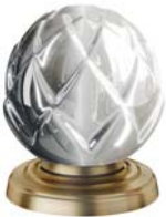
(.011-41) Bronze bronze