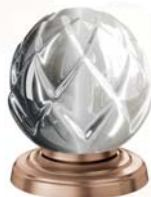
(.023-41) Roségold matt rose gold matt