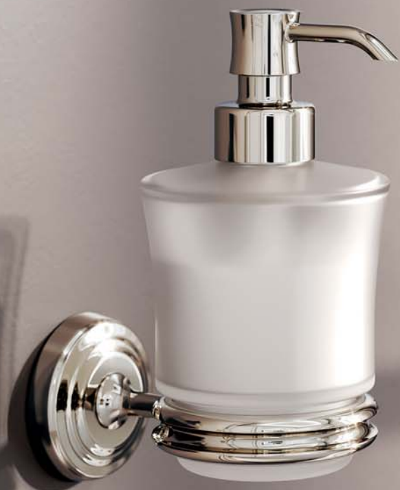
Lotionspender und Handtuchhalter in Silbernickel Soap dispenser and towel bar in polished nickel