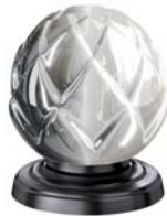
(.096-41) Nerz matt mink matt