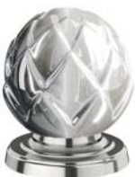
(.065-41) Platin platinum