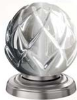
(.036-41) Nickel matt satin nickel