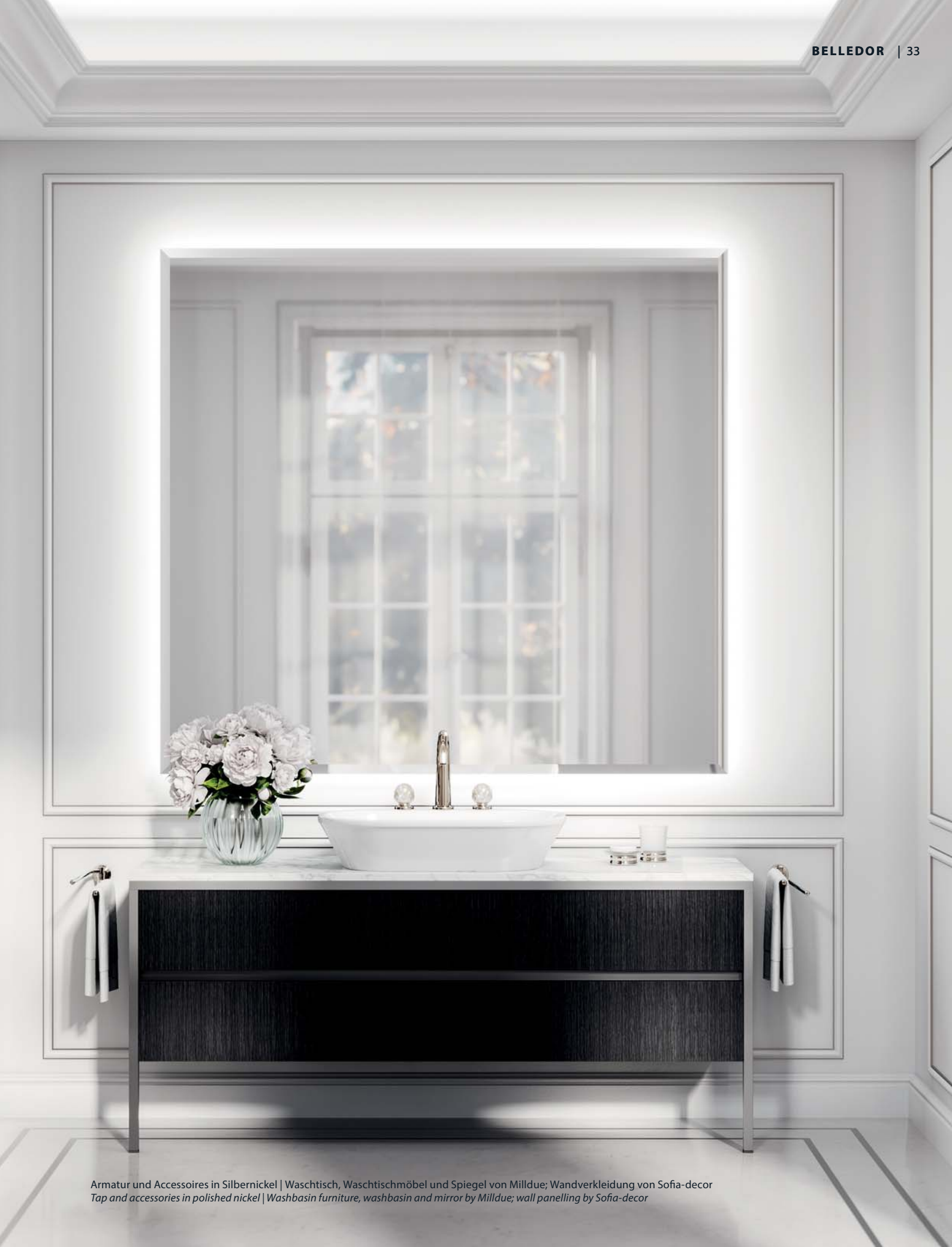
Armaturo e Accessori in Argento Lucido | Lavabo, Mobili per il Lavabo e Specchio di Milldue; Rivestimento delle Pareti di Sofia-decor Tap and accessories in polished nickel | Washbasin furniture, washbasin and mirror by Milldue; wall panelling by Sofia-decor