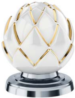
(.000-32) Weiß/Gold (24 K) white/gold (24 C)