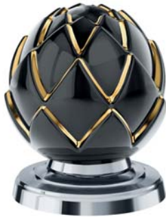
(.000-36) Schwarz/Gold (24 K) black/gold (24 C)