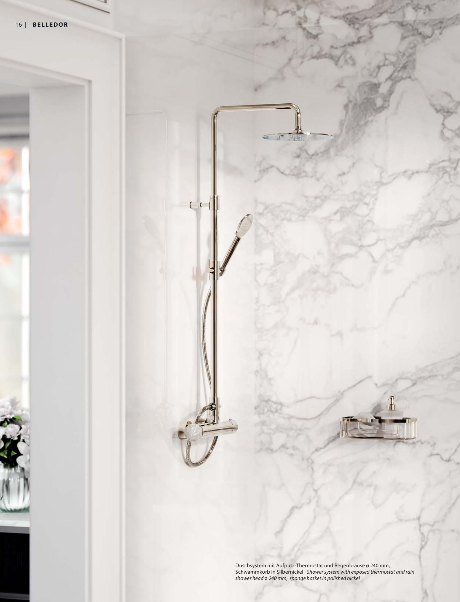
Duschsystem mit Aufputz-Thermostat und Regenbrause ø 240 mm, Schwammkorb in Silbernickel · Shower system with exposed thermostat and rain shower head ø 240 mm, sponge basket in polished nickel