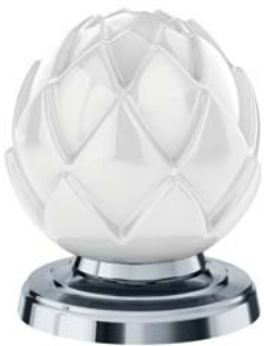
(.000-31) Weiß white

BELLEDDOR WITH TEN AVAILABLE PORCELAIN HANDLES