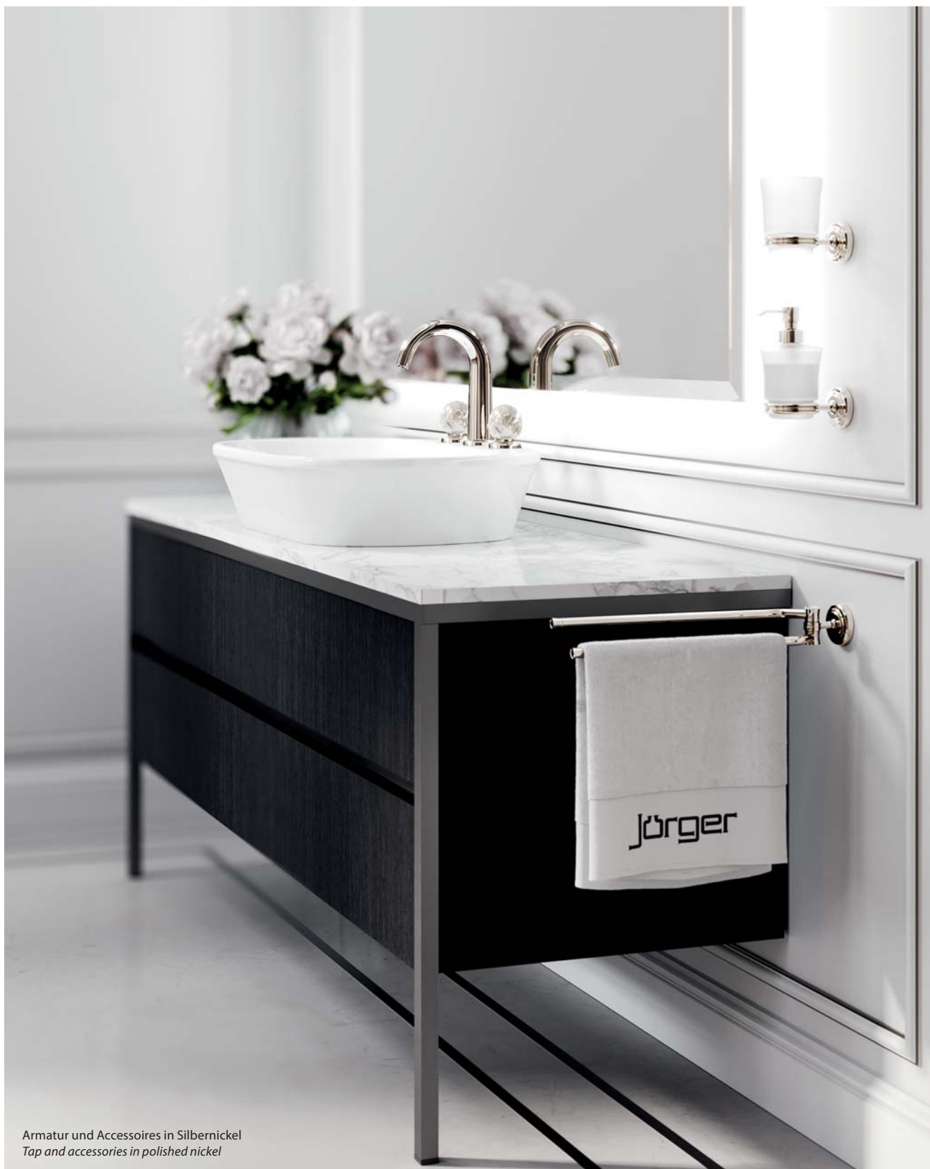
Armatur und Accessoires in Silbernickel Tap and accessories in polished nickel