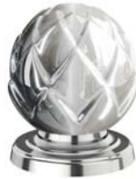
(.035-41) Silbernickel polished nickel