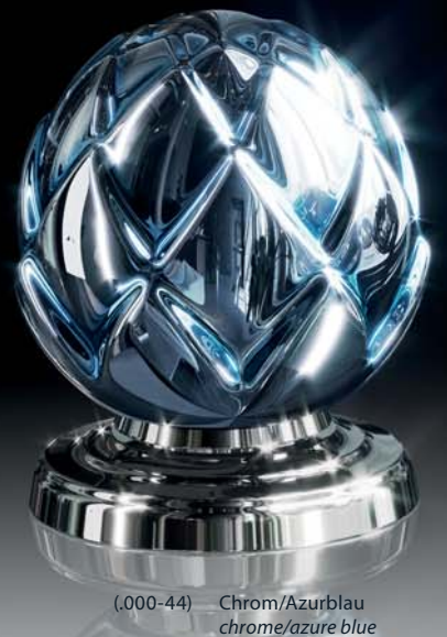
(.000-44) Chrom/Azurblau chrome/azure blue