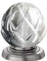
(.066-41) Platin matt platinum matt