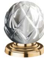
(.040-41) Edelmessing sunshine