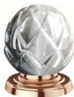
(.022-41) Roségold rose gold