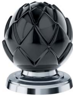
(.000-35) Schwarz black