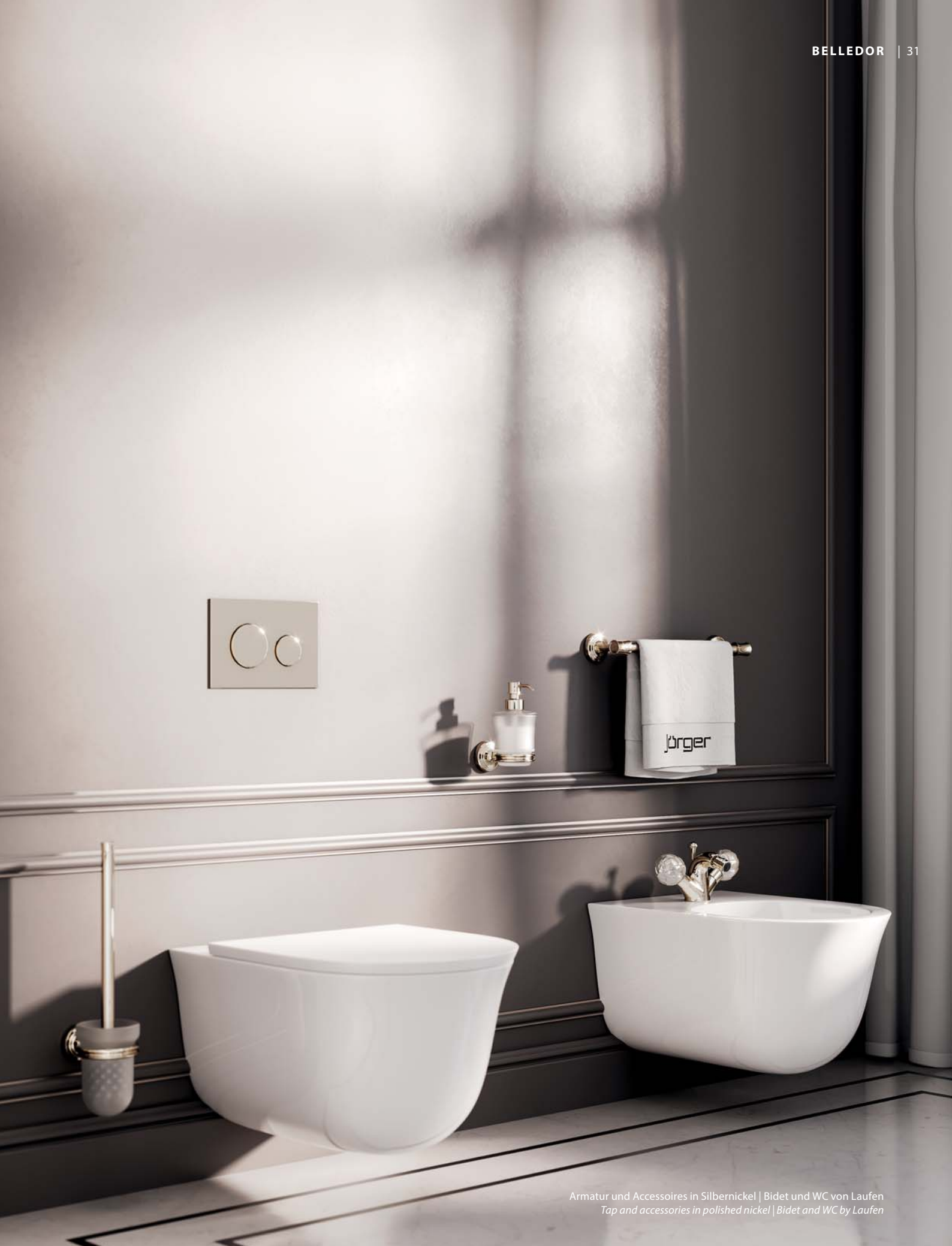
Armatur und Accessoires in Silbernickel | Bidet und WC von Laufen Tap and accessories in polished nickel | Bidet and WC by Laufen