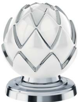
(.000-33) Weiß/Platin white/platinum