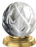
(.021-41) Gold matt gold matt