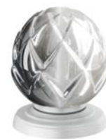
(.052-41) Weiß matt white matt