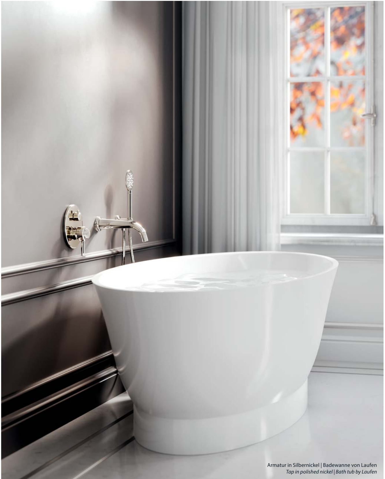
Armatur in Silbernickel | Badewanne von Laufen Tap in polished nickel | Bath tub by Laufen