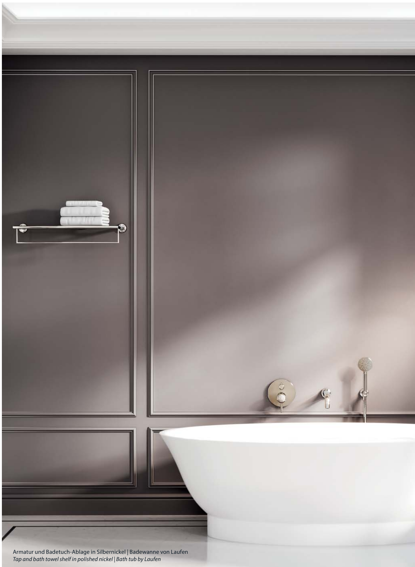
Armatur und Badetuch-Ablage in Silbernickel | Badewanne von Laufen Tap and bath towel shelf in polished nickel | Bath tub by Laufen