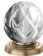
(.041-41) Edelmessing matt sunshine matt