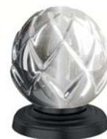
(.092-41) Schwarz matt black matt