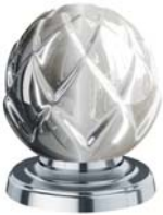
(.000-41) Chrom chrome