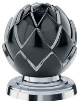
(.000-37) Schwarz/Platin black/platinum