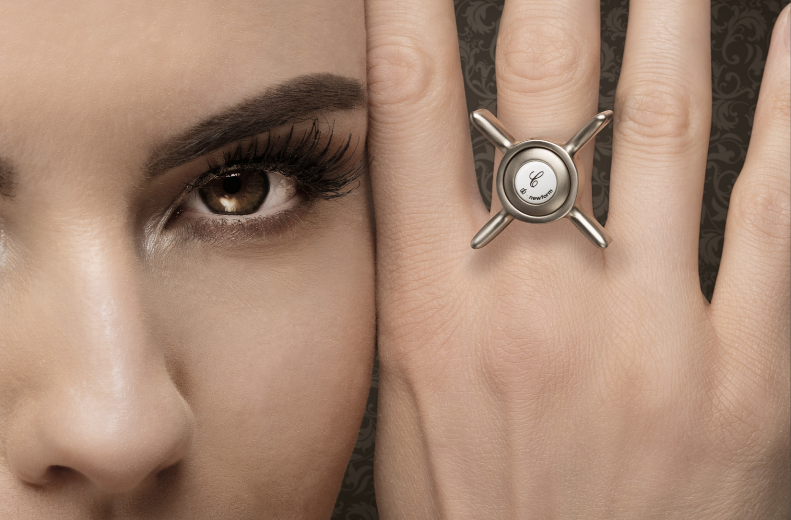
30.059 ORO BRUNITO BURNISHED GOLD