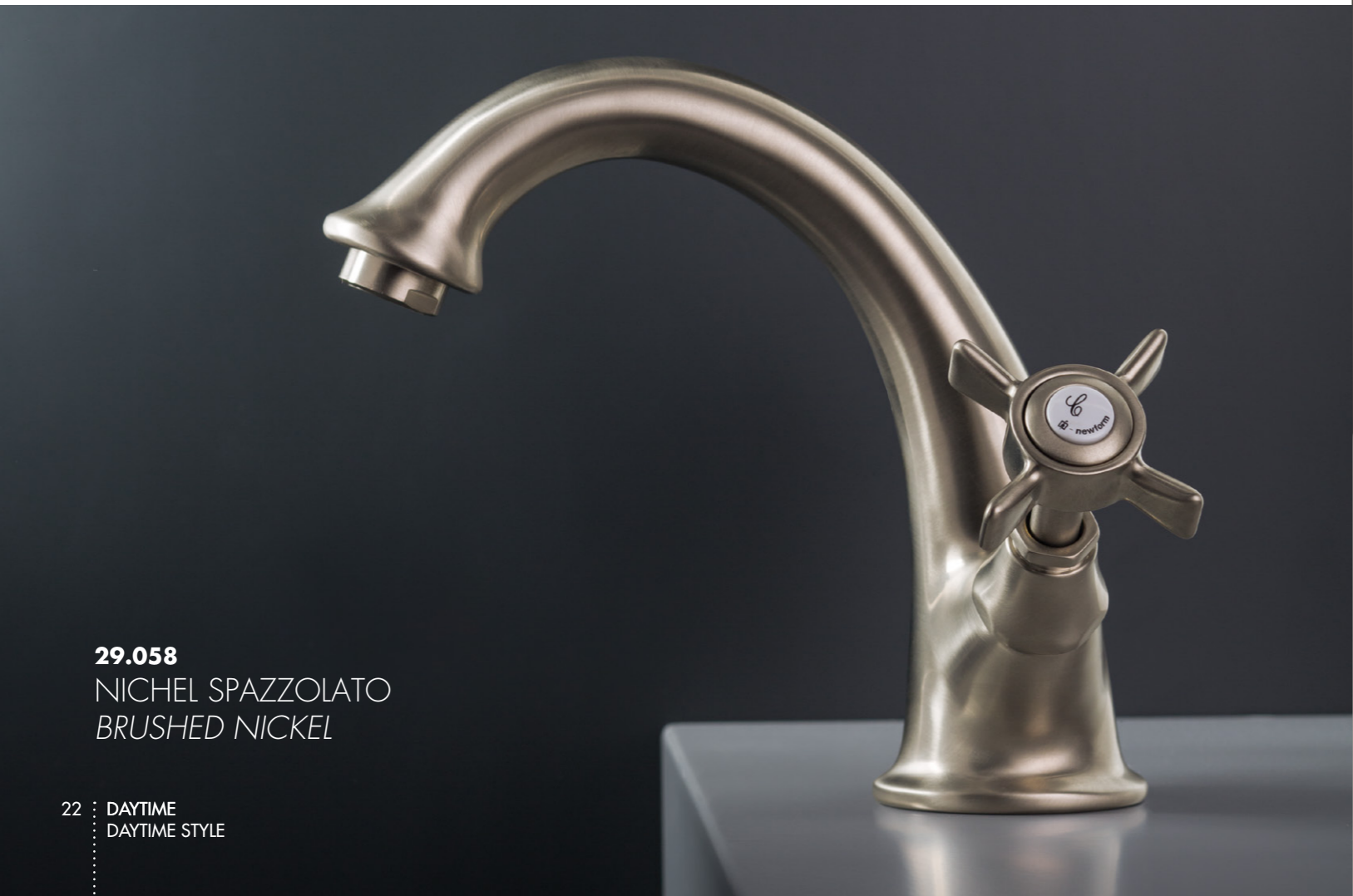
29.058 NICHEL SPAZZOLATO BRUSHED NICKEL