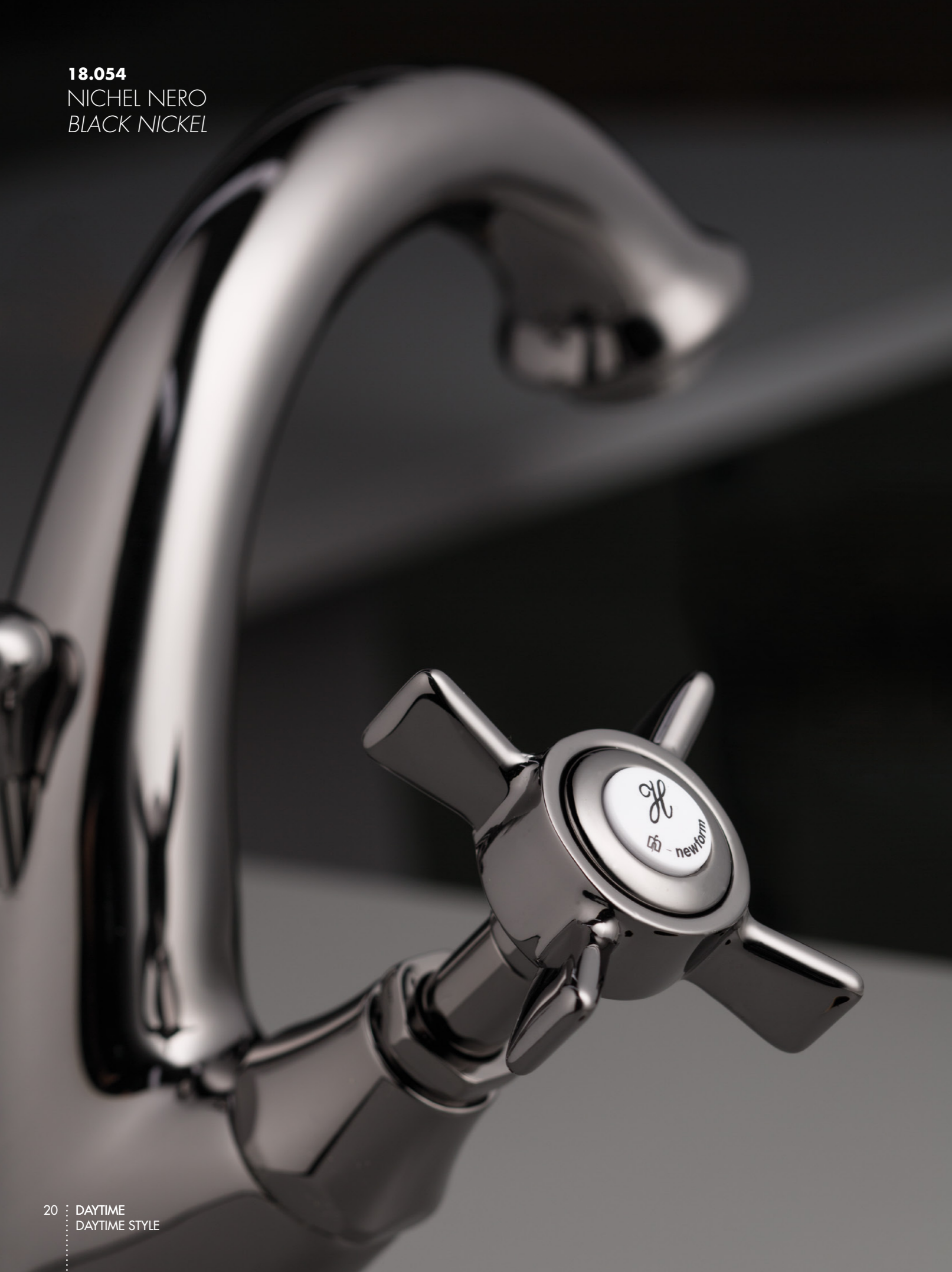
18.054 NICHEL NERO BLACK NICKEL