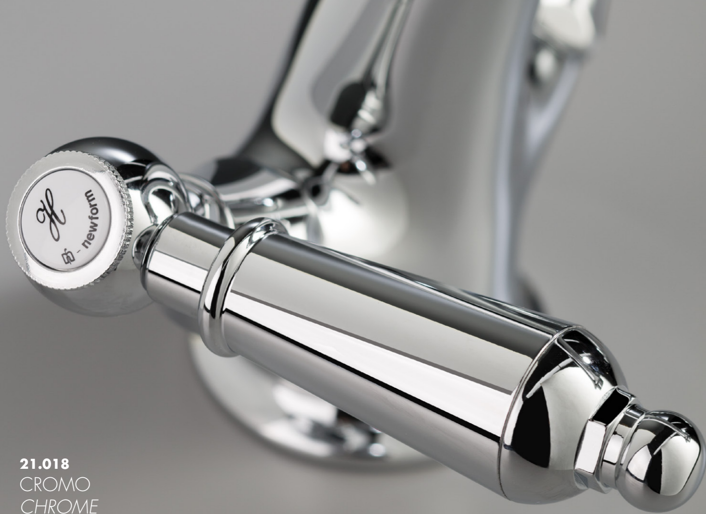
21.018 CROMO CHROME