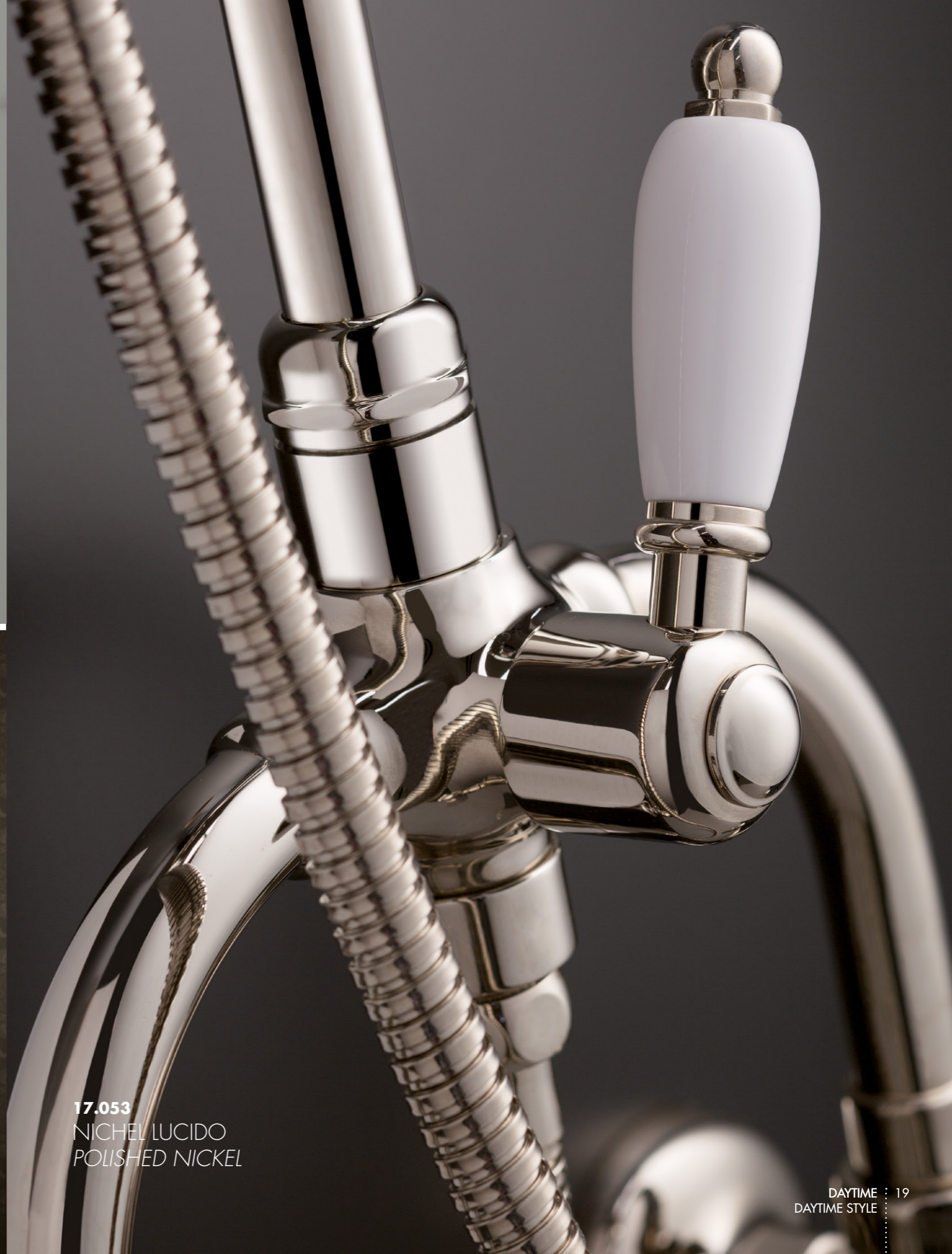
17.053 NICHEL LUCIDO POLISHED NICKEL