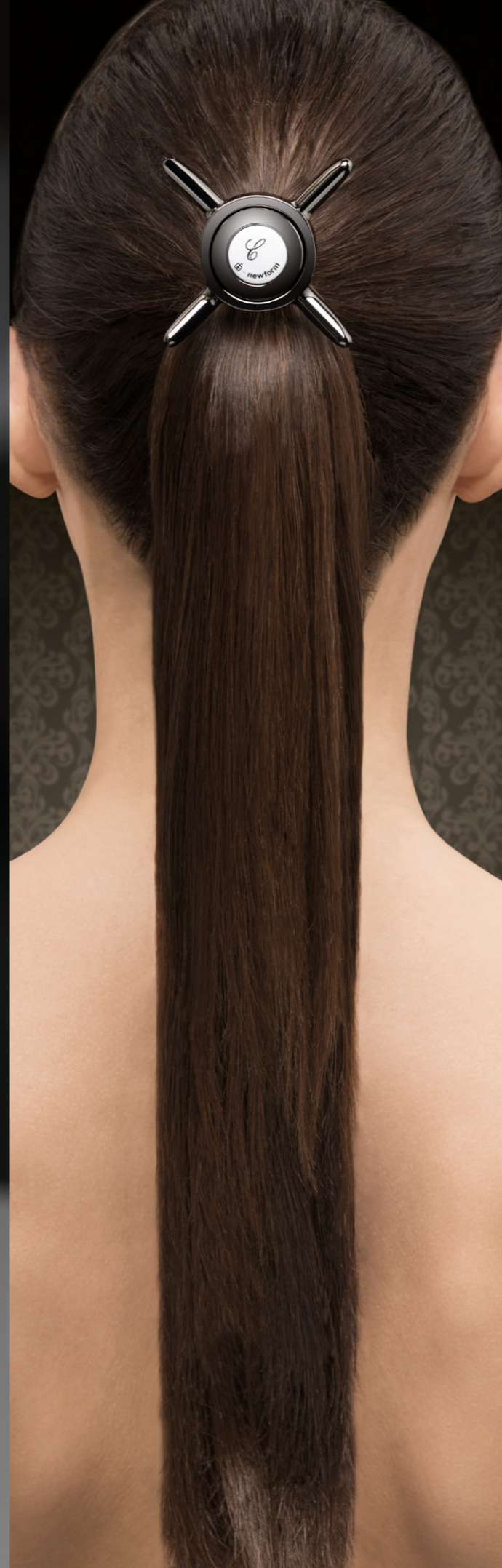
28.057 OTTONE NATURALE NATURAL BRASS