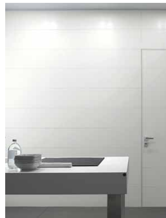
Synua Wall System