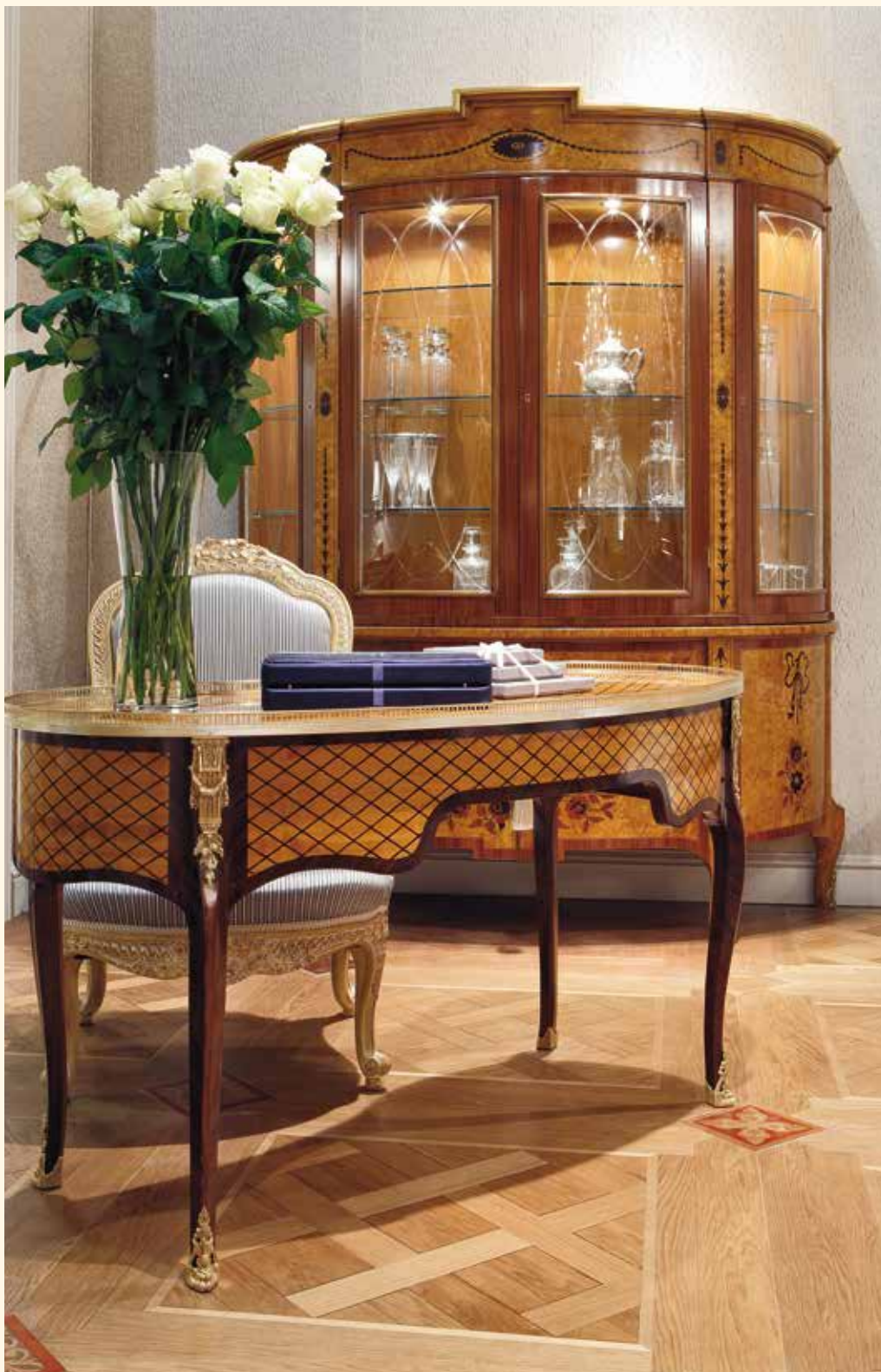
Art. 906 Scrivitoio/Writing desk cm 145 x 65 x 82