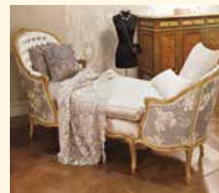
Art. 440 Chaise Longue/Armchair cm 75 x 233 x 101 Pag: 49