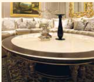
Art. 740 Tavolino rotondo Round coffee table Ø cm 180 x 45 Pag: 24/25