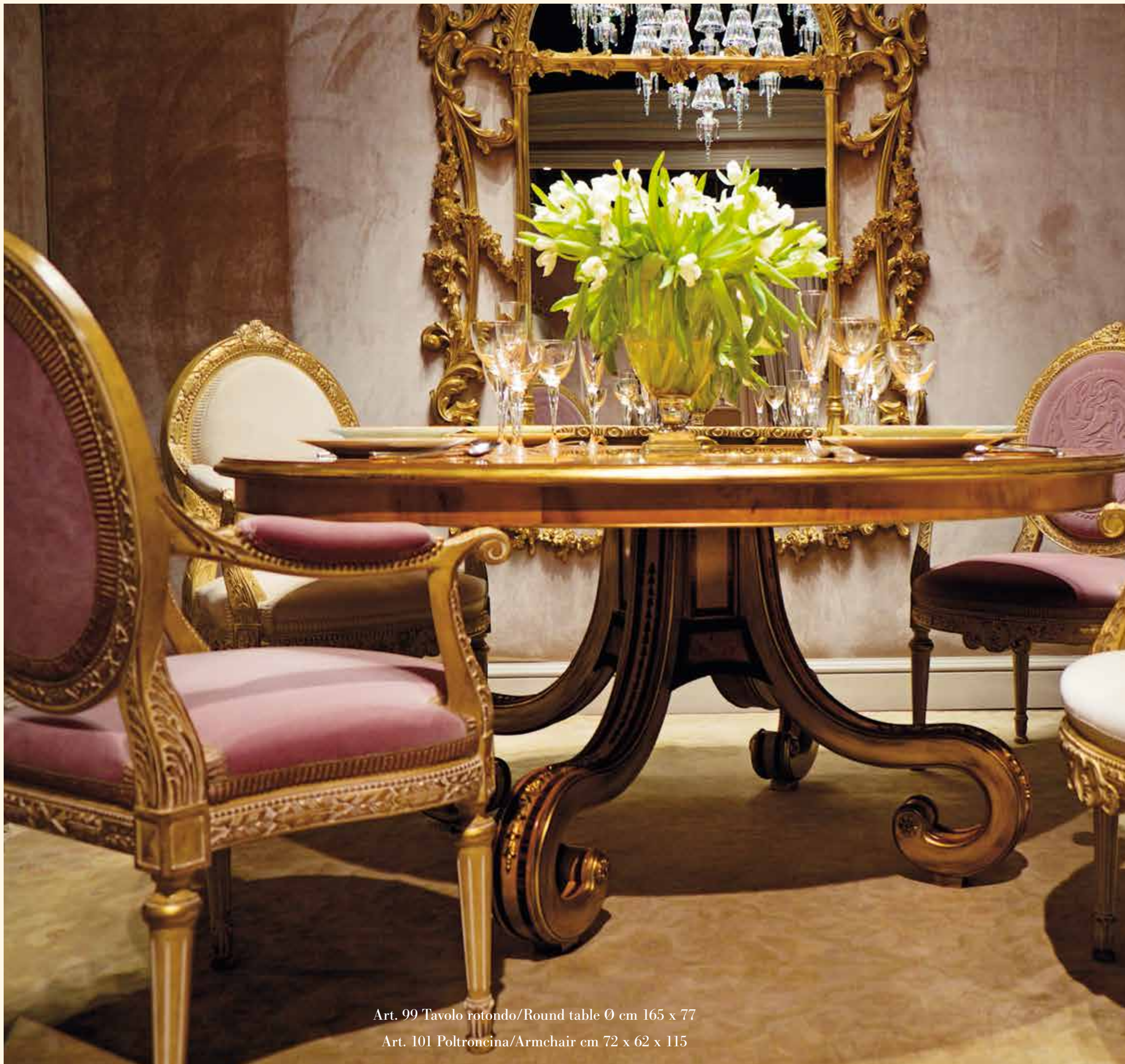
Art. 99 Tavolo rotondo/Round table Ø cm 165 x 77