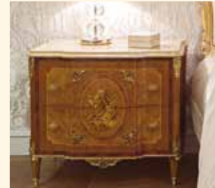
Art. 2070CD Comodino/Beside table cm 85 x 50 x 71 Pag: 45