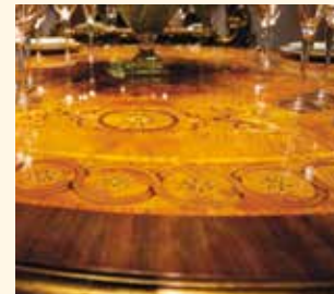
Art. 99 Tavolo rotondo Round table Ø cm 165 x 77 Pag: 38/39