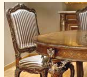
Art. 172 Sedia/Chair cm 60 x 68 x 115 Pag: 36/37