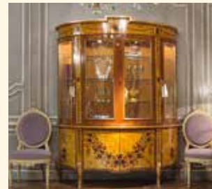
Art. 984 Vetrina/Display cabinet cm 182 x 63 x 232 Pag: 44