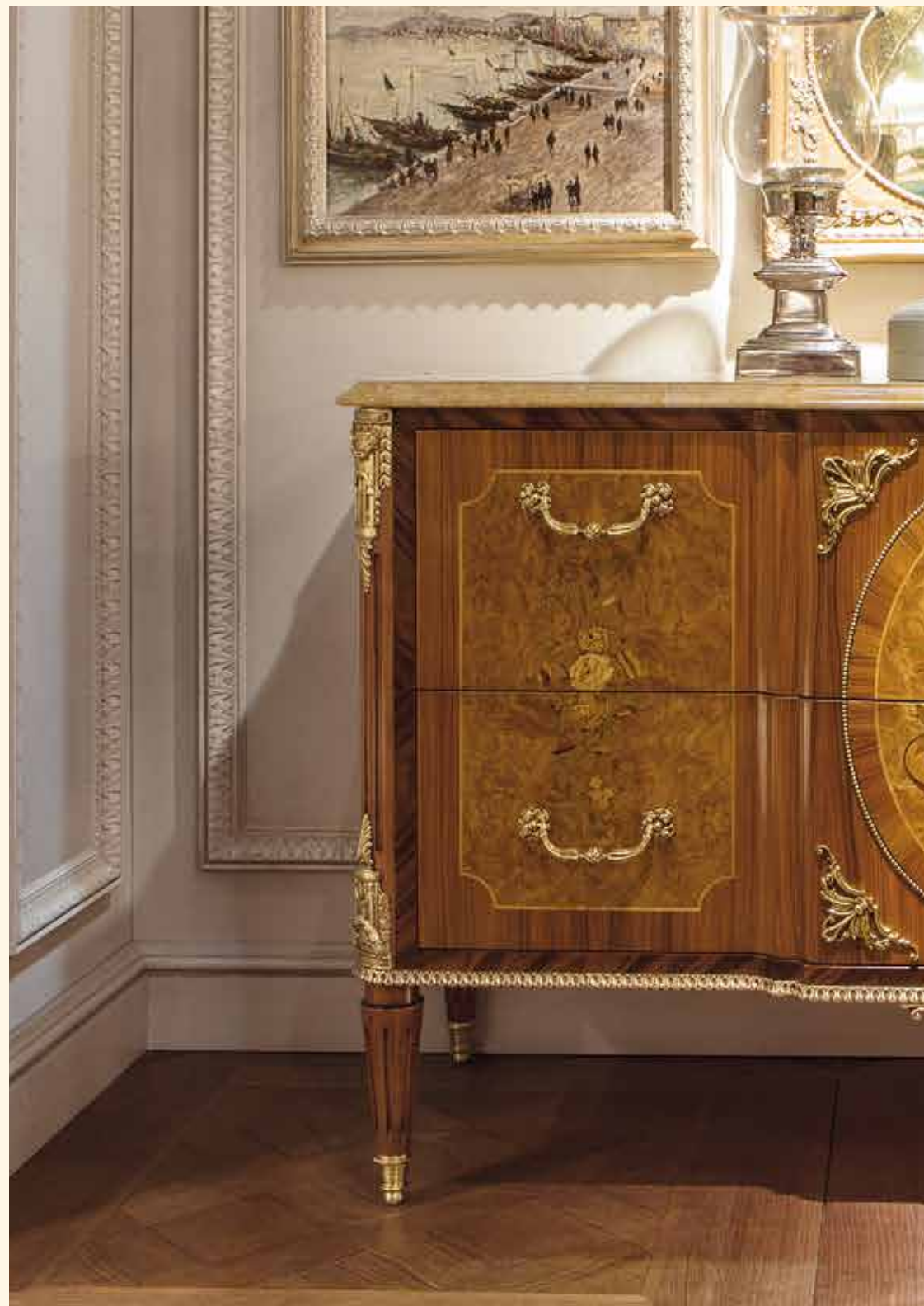
Art. 2070CC Comò/Chest of drawers cm 160 x 64 x 96