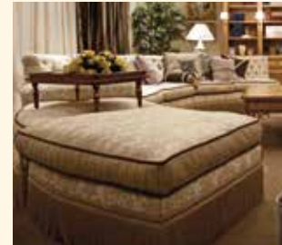
Art. 460 Divano circolare Round sofa Pag: 28/29