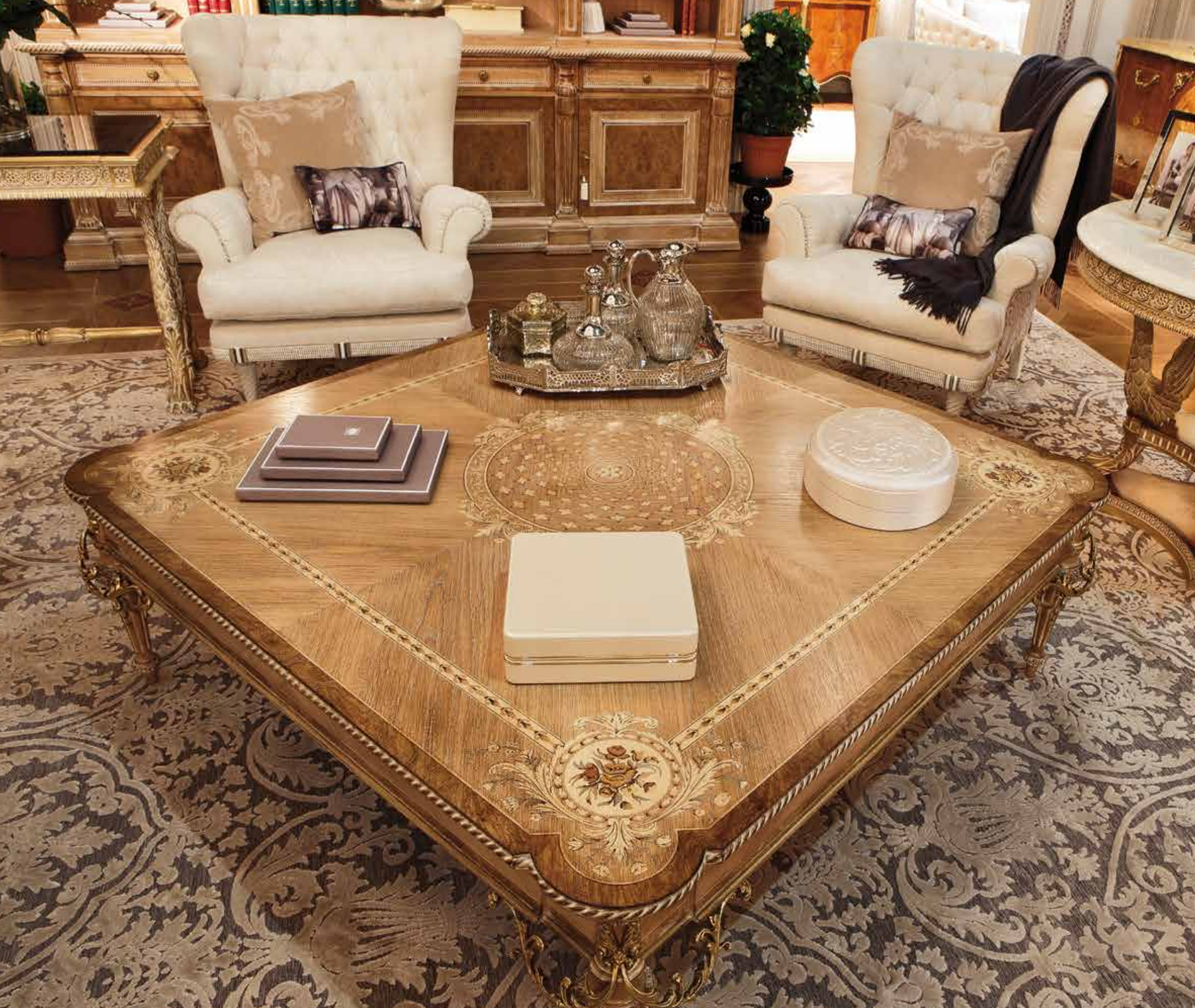
Art. 706 Tavolino quadrato/Square coffee table cm 140 x 140 x 45