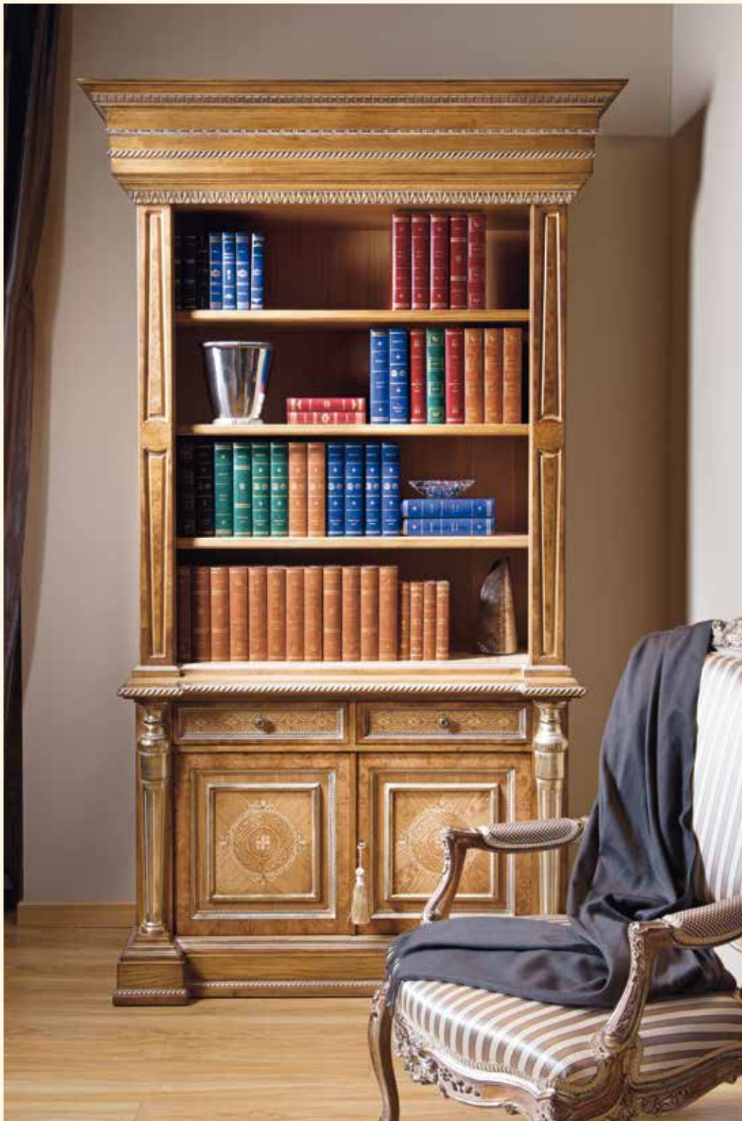
Art. 249 Libreria/Bookcase cm 140 x 68 x 248