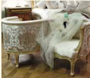
Art. 444 Divanetto visavis Sofa visavis cm 135 x 110 x 70 Pag: 49