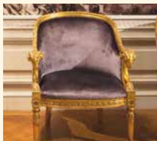
Art. 213 Poltrona/Armchair cm 73 x 70 x 88 Pag: 19 - 23