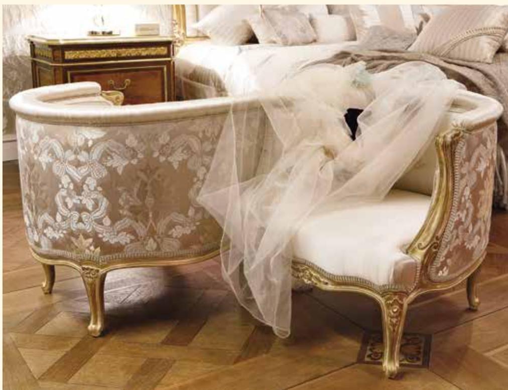
Art. 440 Chaise Longue/Armchair cm 75 x 233 x 101 Art. 444 Divanetto visavis/Sofa visavis cm 135 x 110 x 70