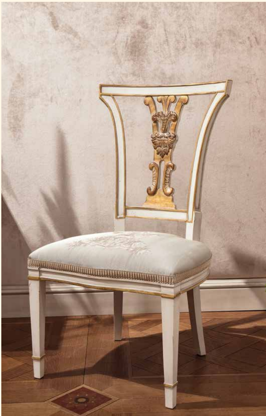
Art. 135 Sedia/Chair cm 64 x 66 x 105