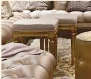
Art. 453PP Pouff quadrato Square Pouf cm 42 x 42 x 52 Pag: 24/25