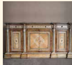
Art. 248 Credenza/Sideboard cm 200 x 60 x 101 Pag: 31