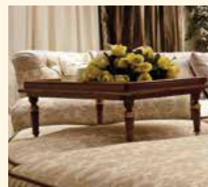
Art. 770 Vassoio/Tray cm 80 x 45 x 28 Pag: 28 - 34 - 46 - 51