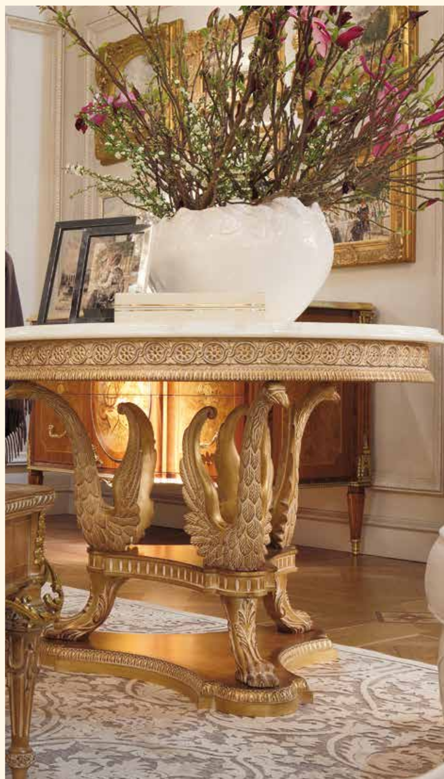
Art. 758 Tavolino tondo/Round coffee table Ø cm 104 x 75