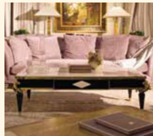
Art. 702 Tavolino rett. Rectangular coffe table cm 140 x 75 x 45 Pag: 16/17