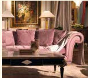
Art. 450 Divano/Sofa cm 280 x 130 x 88 Pag: 16/17