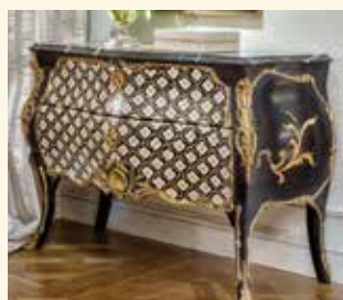
Art. 2021CC Comò/Chest of drawers cm 125 x 56 x 88 Pag: 15