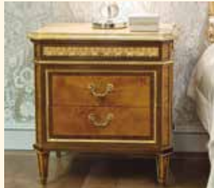
Art. 2071CD Comodino/Beside table cm 87 x 51 x 75 Pag: 47 - 49