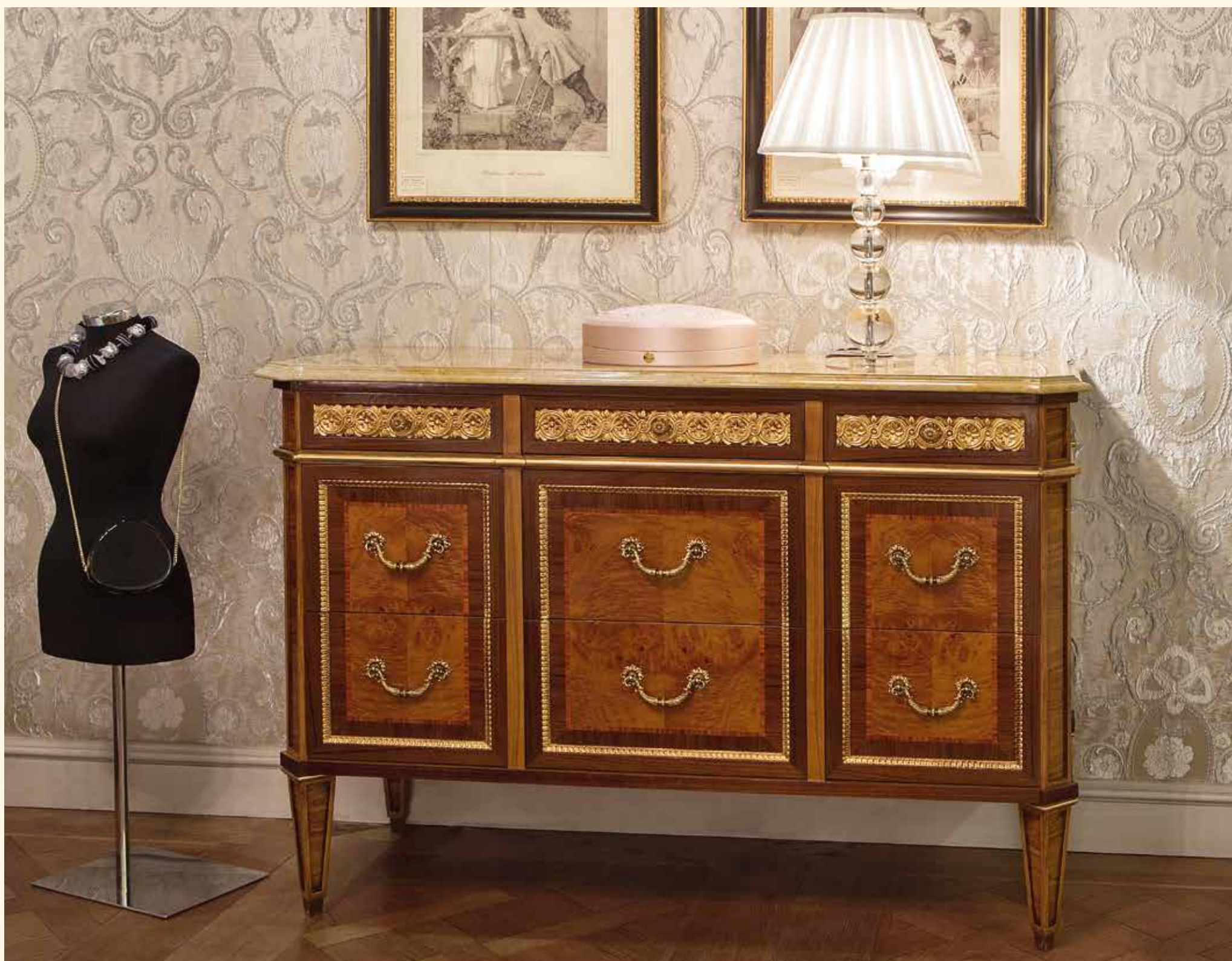
Art. 2071CC Comò/Chest of drawers cm 170 x 60 x 105