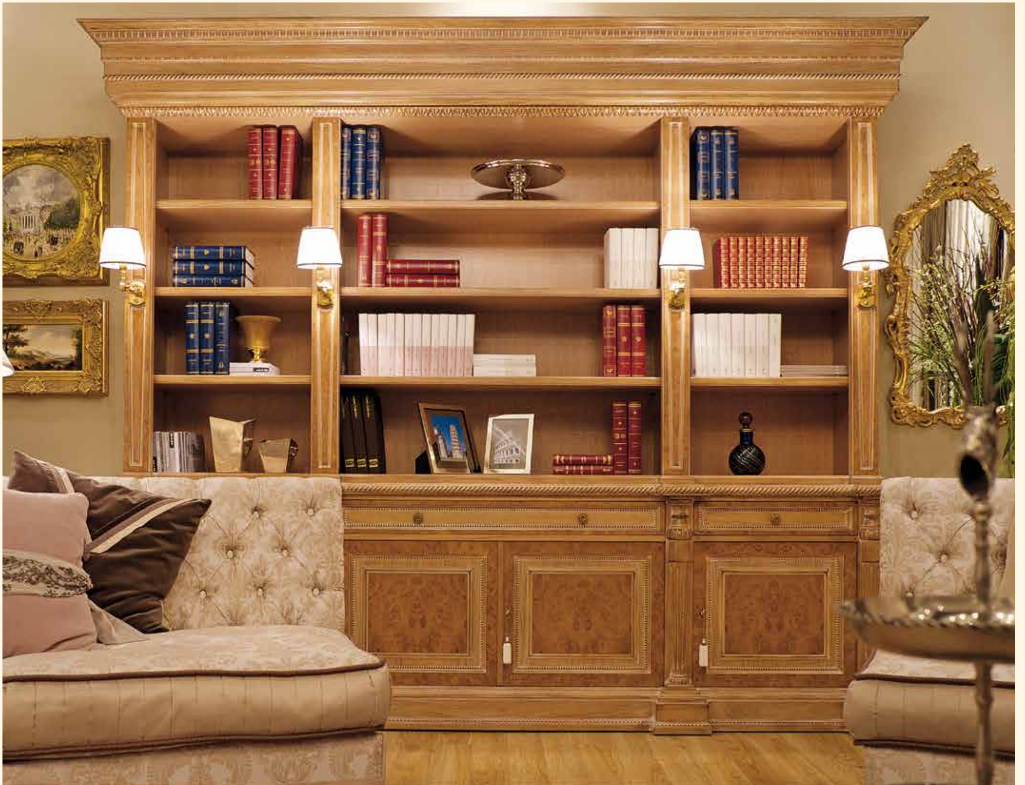
Art. 239 Libreria/Bookcase cm 300 x 60 x 248