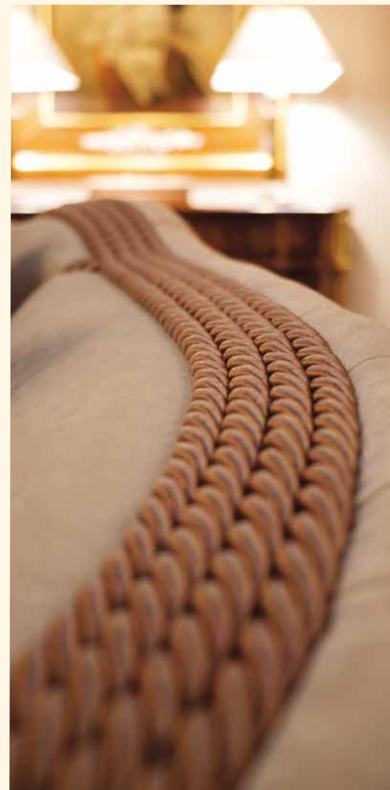
Art. 463 Divano/Sofa