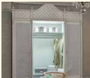
Art. 2059AA Armadio/Wardrobe cm 265 x 67 x 313 Pag: 46