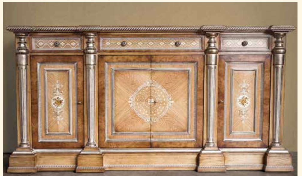
Art. 248 Credenza/Sideboard cm 200 x 60 x 101