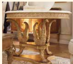
Art. 758 Tavolino tondo Round side table Ø cm 104 x 75 Pag: 6/7 - 8 - 13 - 15