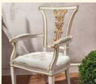
Art. 135P Poltrona/Armchair cm 64 x 66 x 105