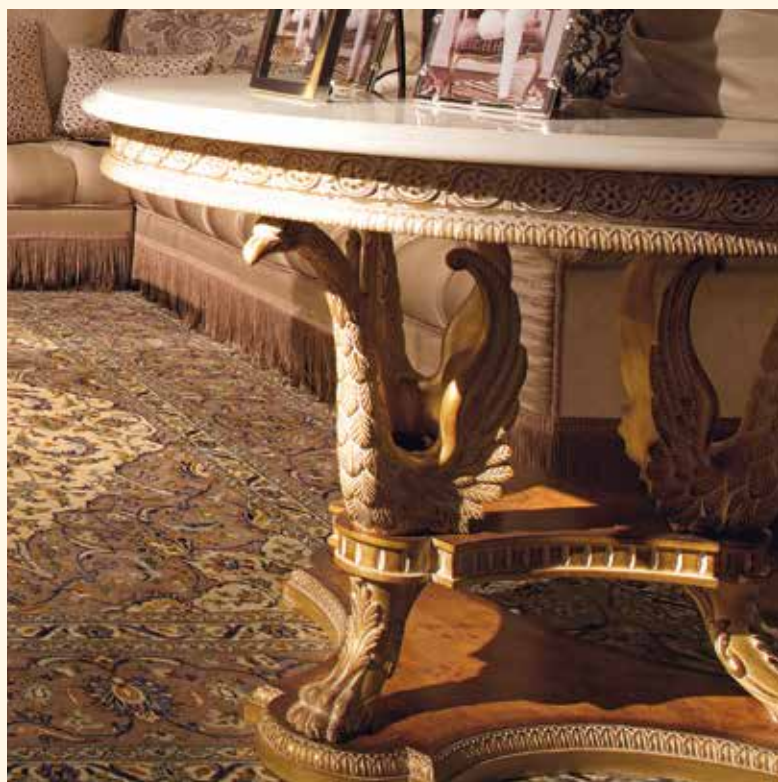
Art. 758 Tavolino tondo/Round coffee table