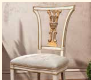
Art. 135 Sedia/Chair cm 64 x 66 x 105 Pag: 40