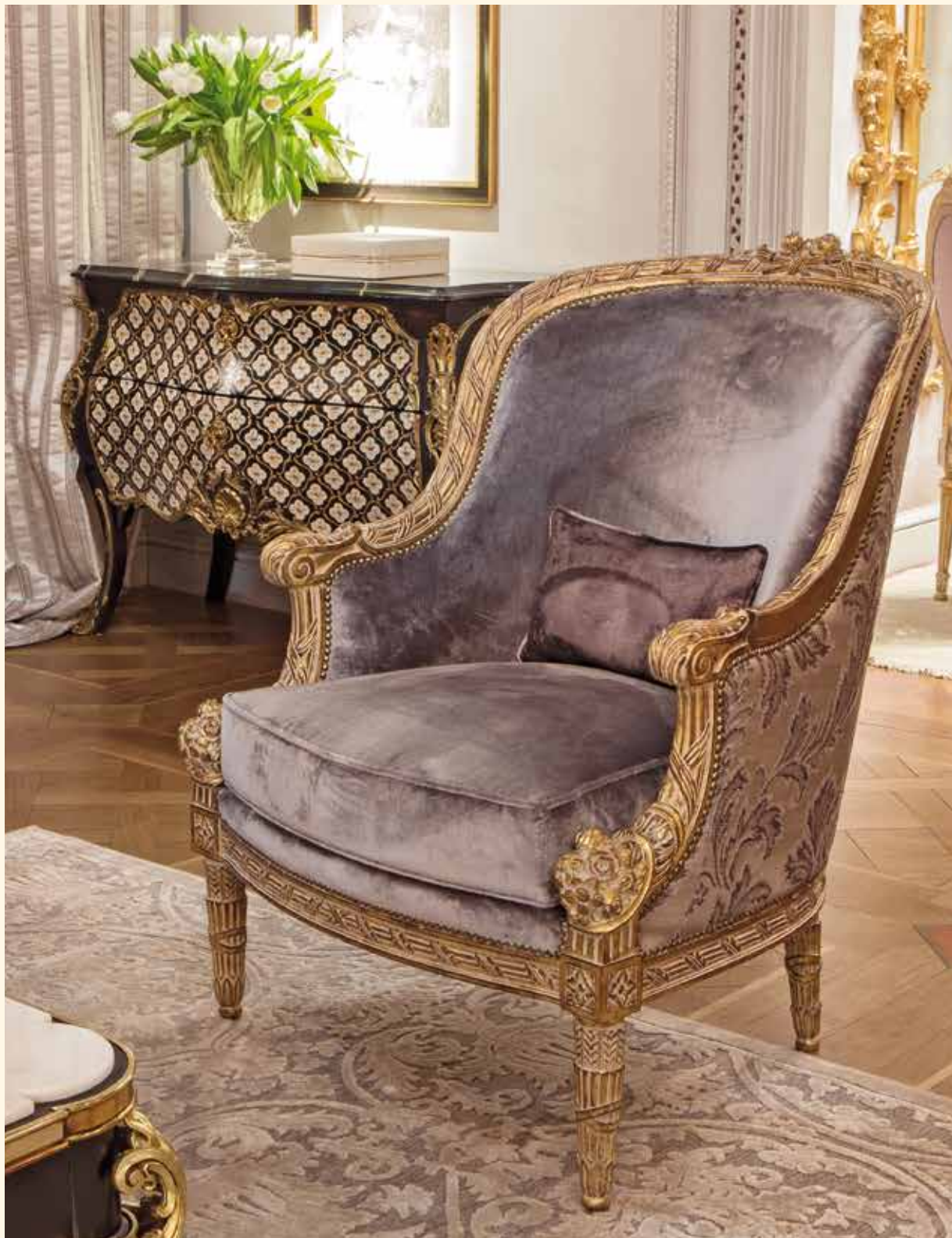
Art. 215 Poltrona/Armchair cm 82 x 90 x 105