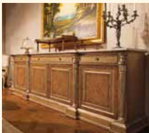
Art. 238 Credenza/Sideboard cm 280 x 60 x 101 Pag: 34/35