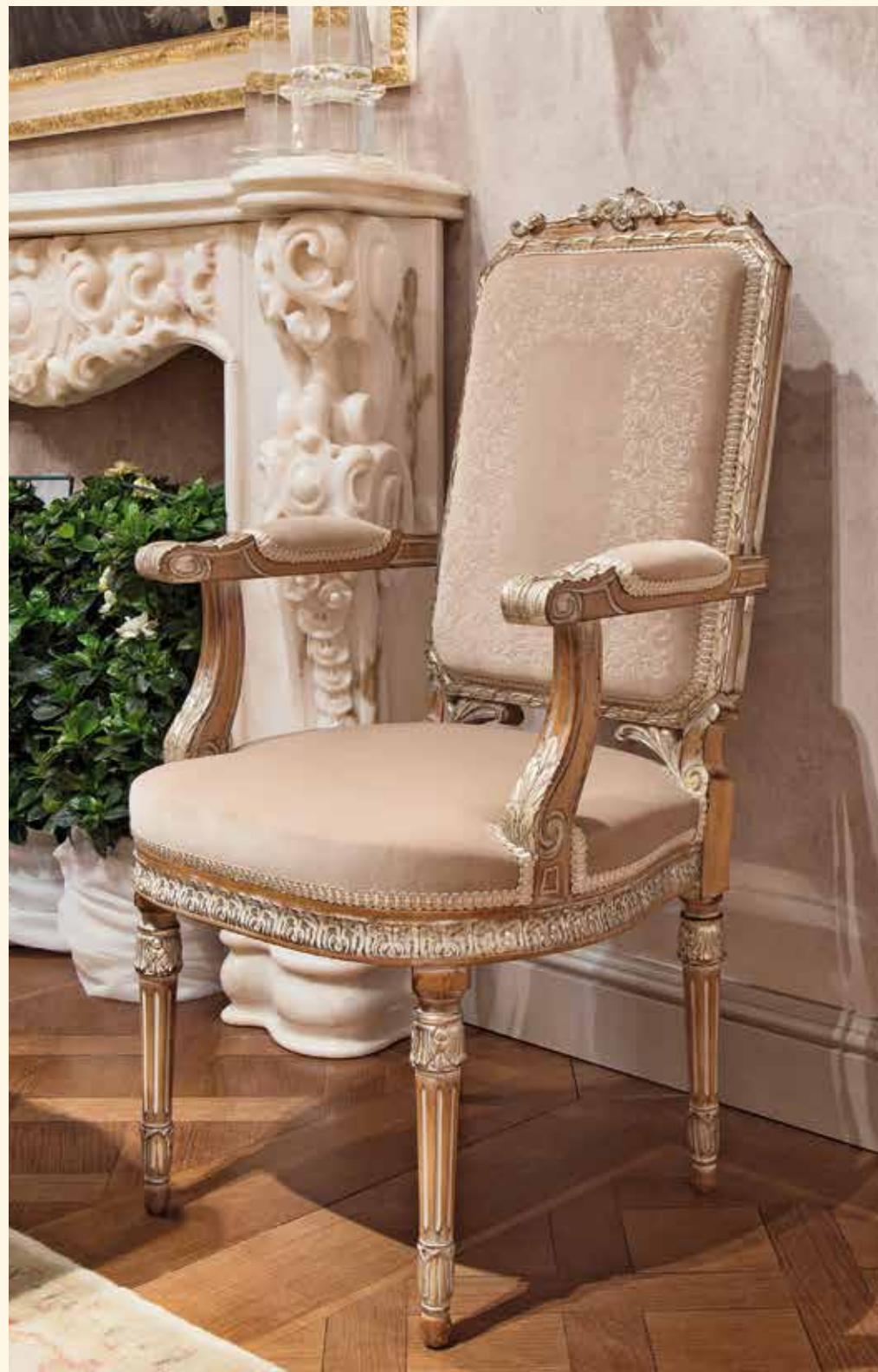
Art. 138P Poltrona /Armchair cm 59 x 64 x 115