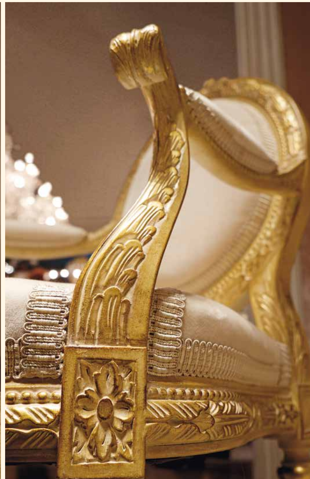
Art. 101 Poltroncina/Armchair cm 72 x 62 x 115