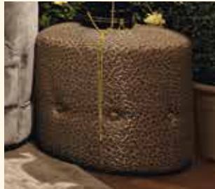
Art. 468A Pouff/Pouf Ø cm 40 x 50 Pag: 21 - 24/25