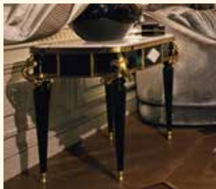
Art. 700 Tavolino Side table cm 80 x 50 x 70 Pag: 18 - 20 - 21