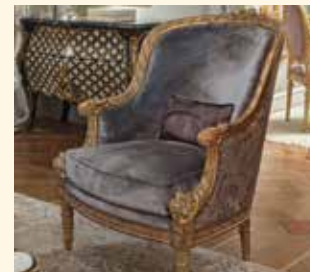
Art. 215 Poltrona/Armchair cm 82 x 90 x 105 Pag: 10/11 - 14 - 16/17