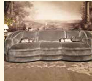
Art. 470 Divano/Sofa cm 263 x 125 x 93 Pag: 18/19 - 20/21