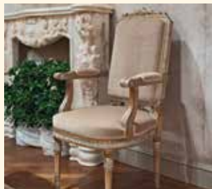
Art. 138P Poltroncina/Armchair cm 59 x 64 x 115 Pag: 41