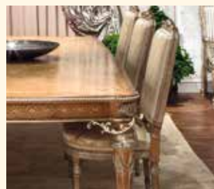
Art. 138 Sedia/Chair cm 58 x 64 x 115 Pag: 32/33