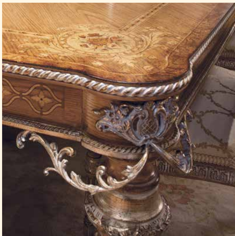
Art. 706 Tavolino quadrato/Square coffee table