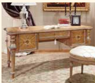
Art. 49 Scrivania/Writing desk cm 180 x 80 x 78 Pag: 31