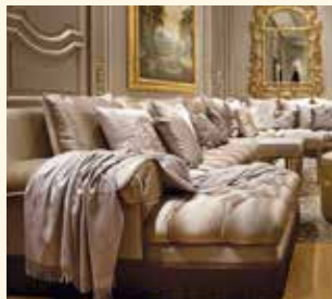
Art. 466 Divano angolare Corner Sofa cm 480 x 320 x 86 Pag: 24/25 - 26/27