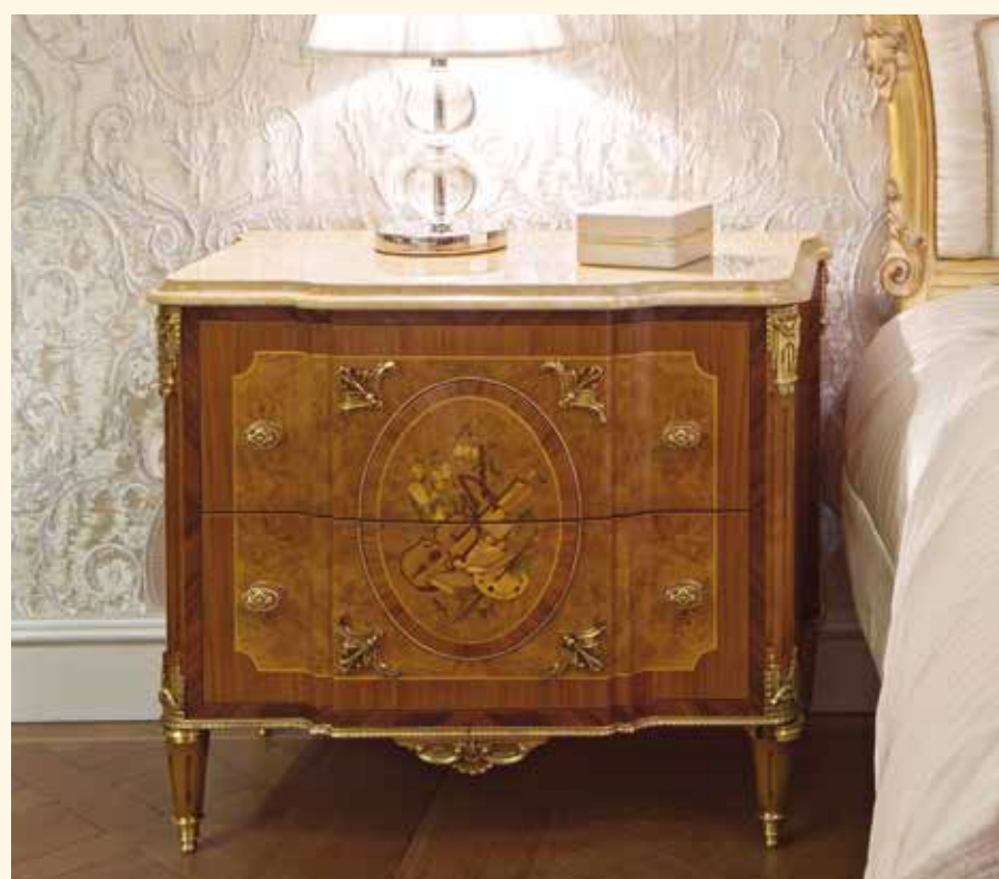
Art. 2070CD Comodino/ Beside table cm 85 x 50 x 71