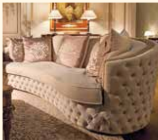
Art. 463 Divano/Sofa cm 260 x 110 x 94 Pag: 6/7 - 8/9 - 13