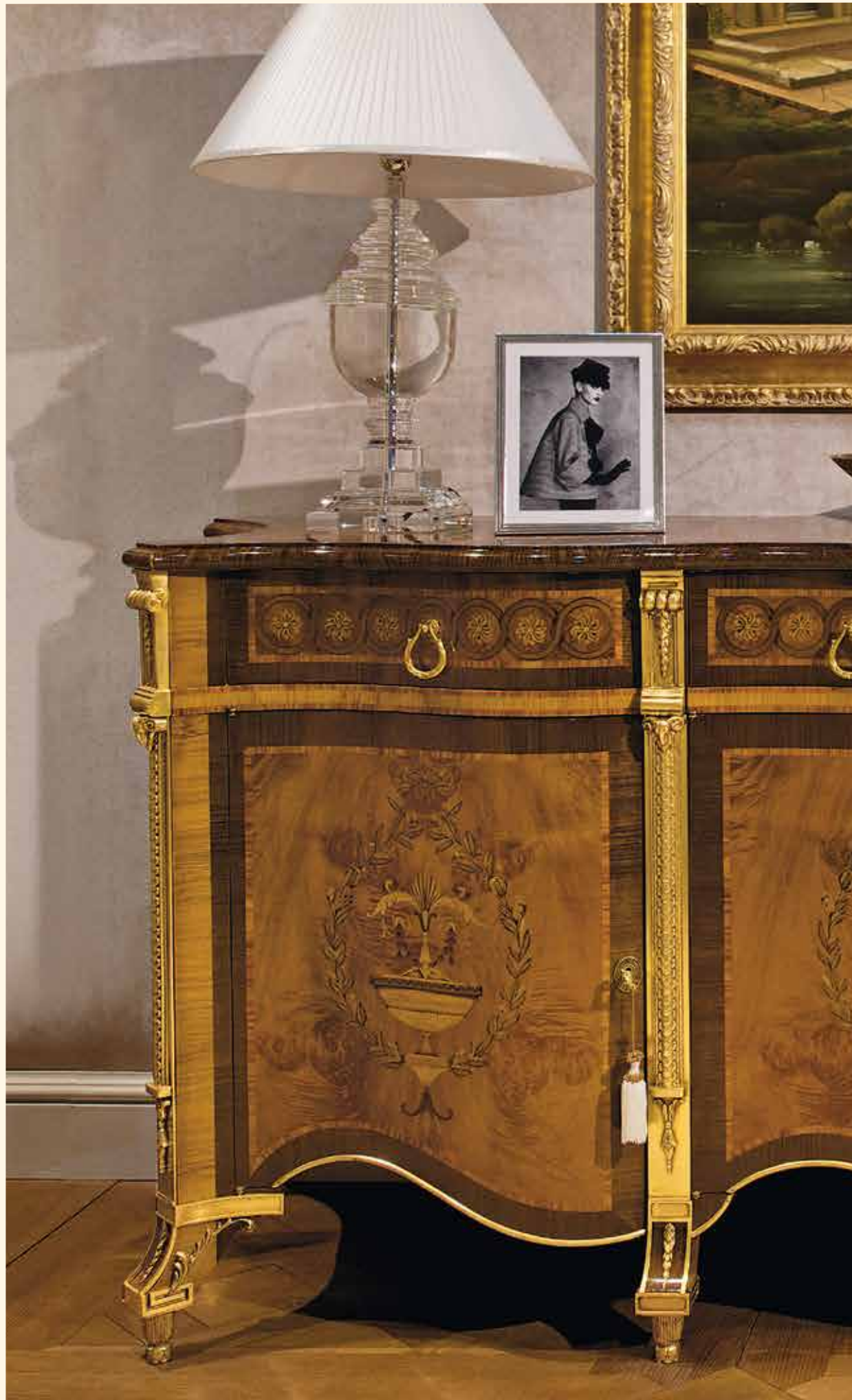
Art. 236 Credenza/Sideboard cm 268 x 65 x 97