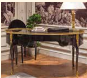
Art. 906L Scrivania/Writing desk cm 145 x 65 x 82 Pag: 19 - 22/23