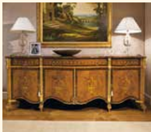
Art. 236 Credenza/Sideboard cm 268 x 65 x 97 Pag: 42/43