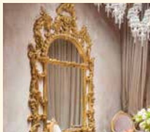
Art. 640 Specchiera/Mirror cm 240 x 8 x 140 24/25 - 38/39