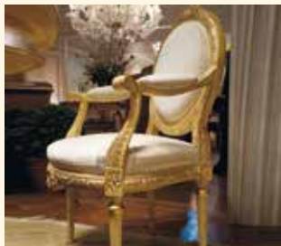
Art. 101 Poltroncina/Armchair cm 72 x 62 x 115 Pag: 38/39