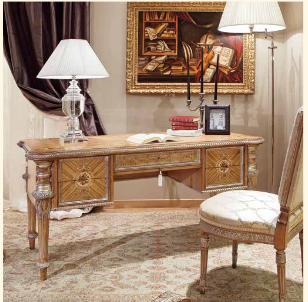
Art. 49 Scrivitoio/Writing desk cm 180 x 80 x 78