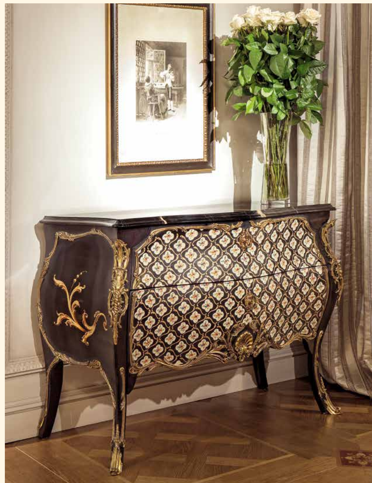
Art. 2021CC Comò cm 125 x 56 x 88