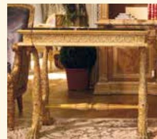
Art. 759 Tavolino rett. Rectangular table cm 85 x 55 x 77 Pag: 10/11