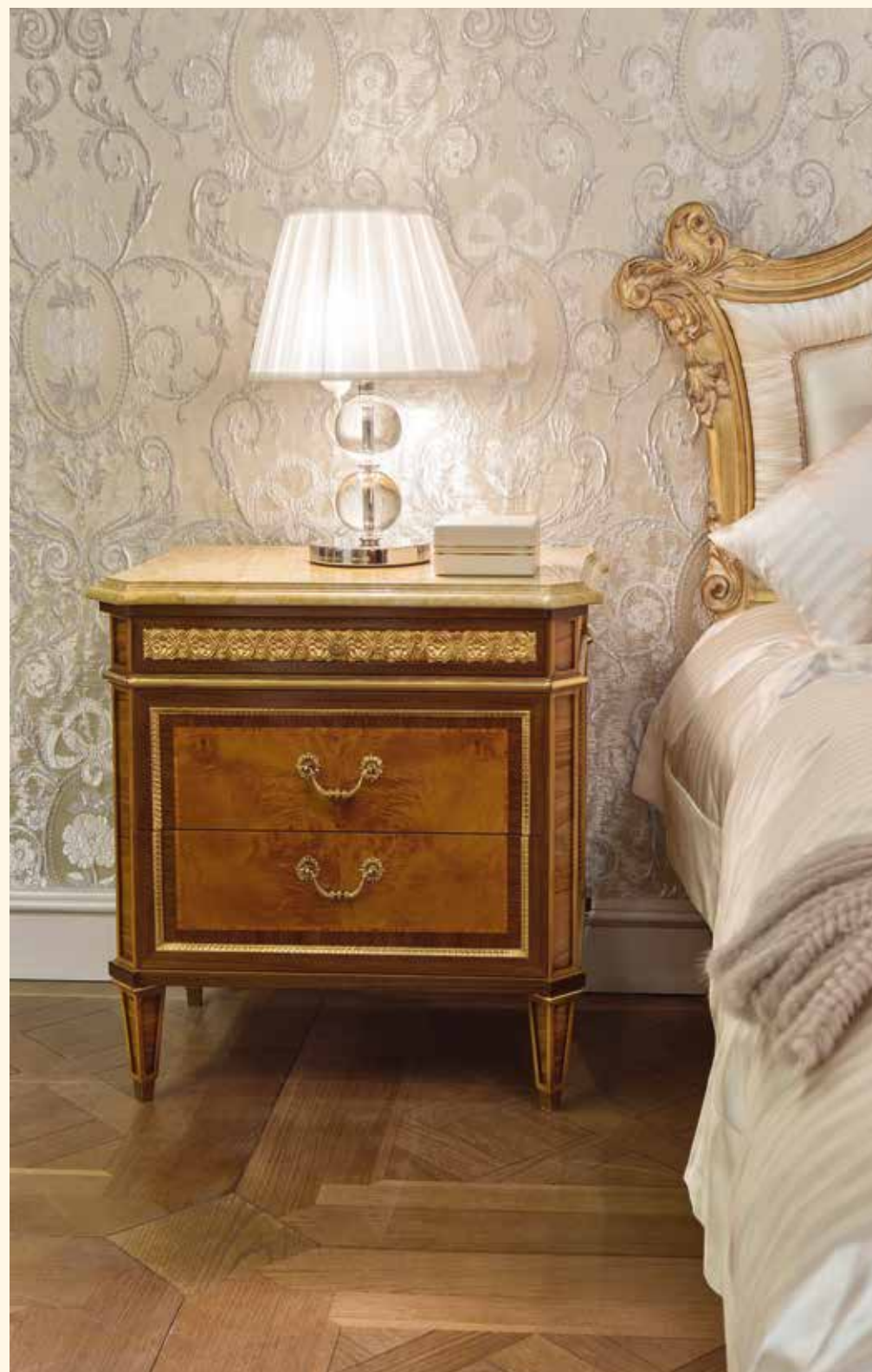
Art. 2071CD Comodino/Beside table cm 87 x 51 x 75