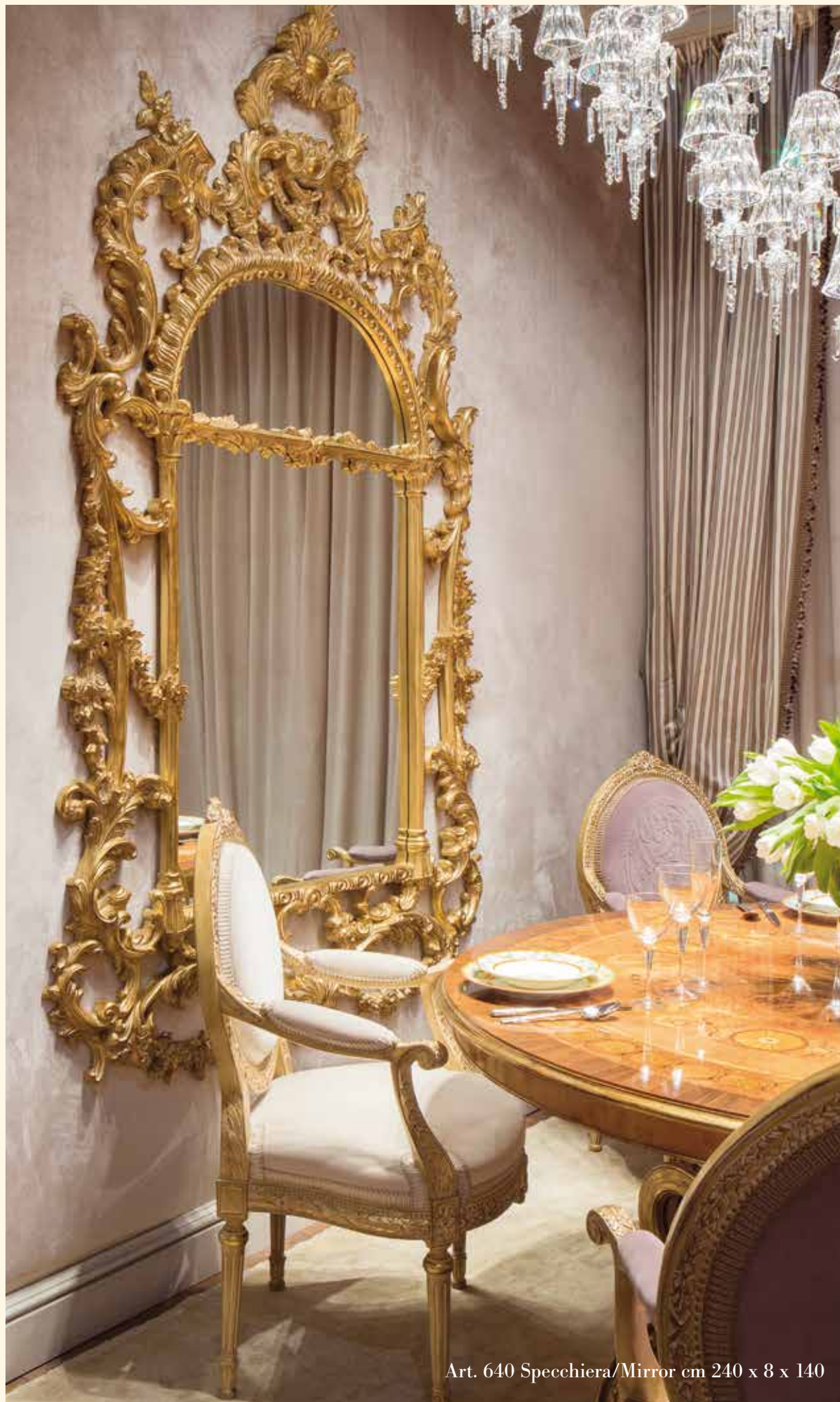
Art. 640 Specchiera/Mirror cm 240 x 8 x 140