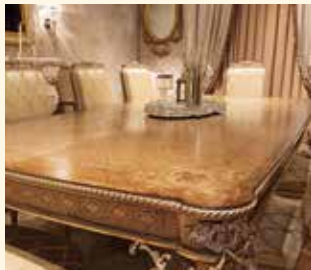
Art. 38 Tavolo rettangolare Rectangular table cm 280 x 140 x 77 Pag: 32/33