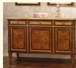
Art. 2071CC Comò/Chest of drawers cm 170 x 60 x 105 Pag: 48