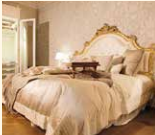
Art. 2078LL Letto/Bed cm 274 x 210 x 190 Pag: 46/47