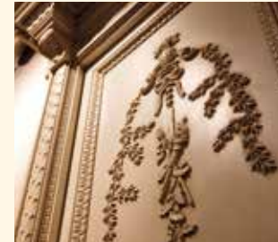
Art. 674 Porta doppia/Doors cm 166 x 10 x 242 Pag: 18/19