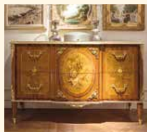
Art. 2070CC Comò/Chest of drawers cm 160 x 64 x 96 Pag: 44/45