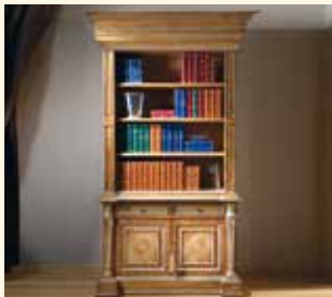
Art. 249 Libreria/Bookcase cm 140 x 68 x 248 Pag: 31