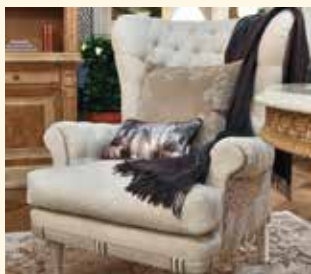
Art. 217 Poltrona/Armchair cm 95 x 105 x 105 Pag: 6 - 10/11 - 12