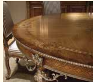
Art. 88 Tavolo rotondo Round table Ø cm 220 x 77 Pag: 36/37- 41