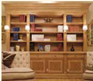
Art. 239 Libreria/Bookcase cm 300 x 60 x 248 Pag: 28/29 - 30