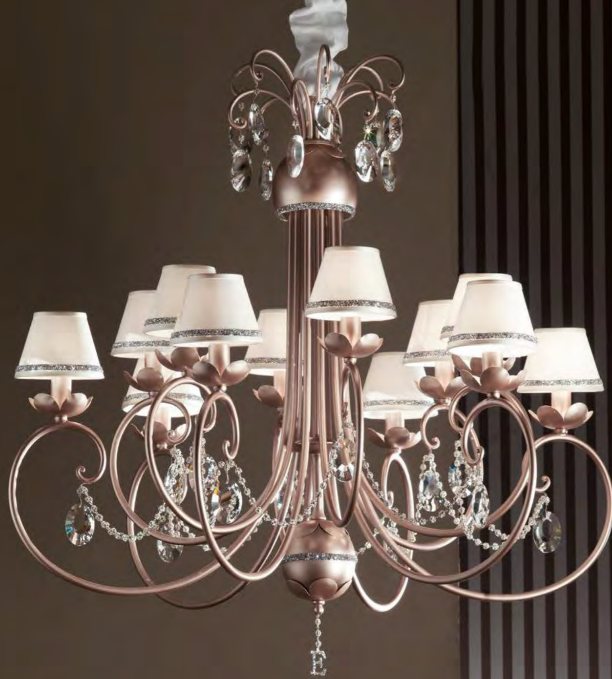
2647/12LA COLORE: ORO ROSA GLITTER COD. 3886 CM. H. 95 X Ø 102 12 X E14 MAX 40 WATT PARALUME TELETTA BEIGE CON BORDO COD. 7716 SWAROVSKI* SU RICHIESTA* MARCHIO "E" IN CRYSTAL ROCK SWAROVSKI ELEMENTS*