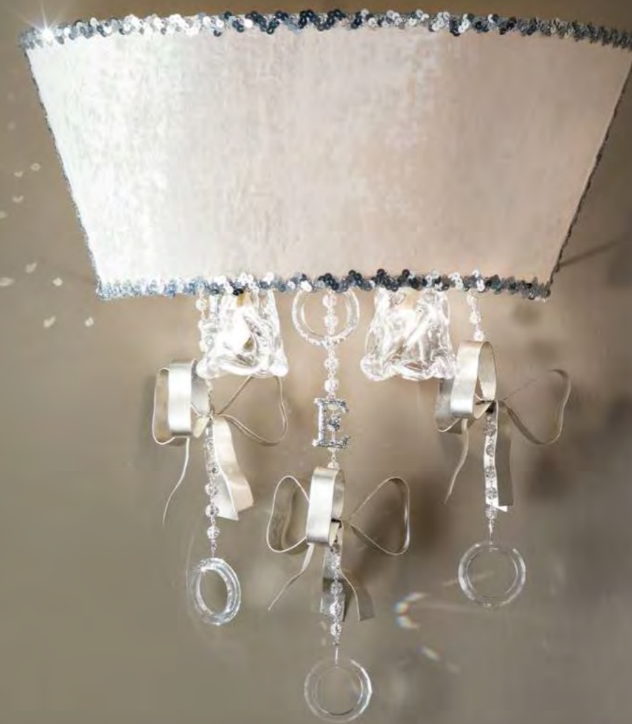
2645/05AP COLORE: ARGENTO FOGLIA COD. 3007 CM. H. 52 x L. 47 x P. 26 5 x G9 MAX 40 WATT PARALUME VELLUTO AVORIO INCLUSO** MARCHIO "E" IN CRYSTAL ROCK SWAROVSKI ELEMENTS®.