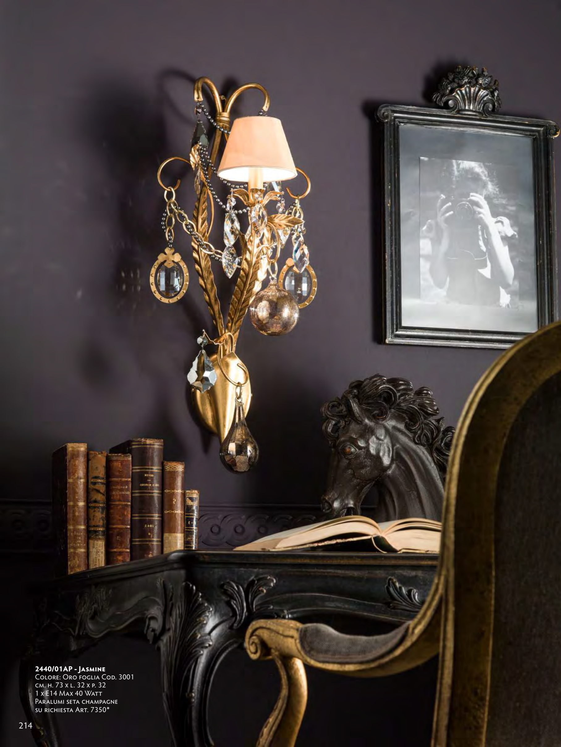
2440/01AP - JASMINE COLORE: ORO FOGLIA COD. 3001 CM. H. 73 X L. 32 X P. 32 1 X E14 MAX 40 WATT PARALUMI SETA CHAMPAGNE SU RICHIESTA ART. 7350*