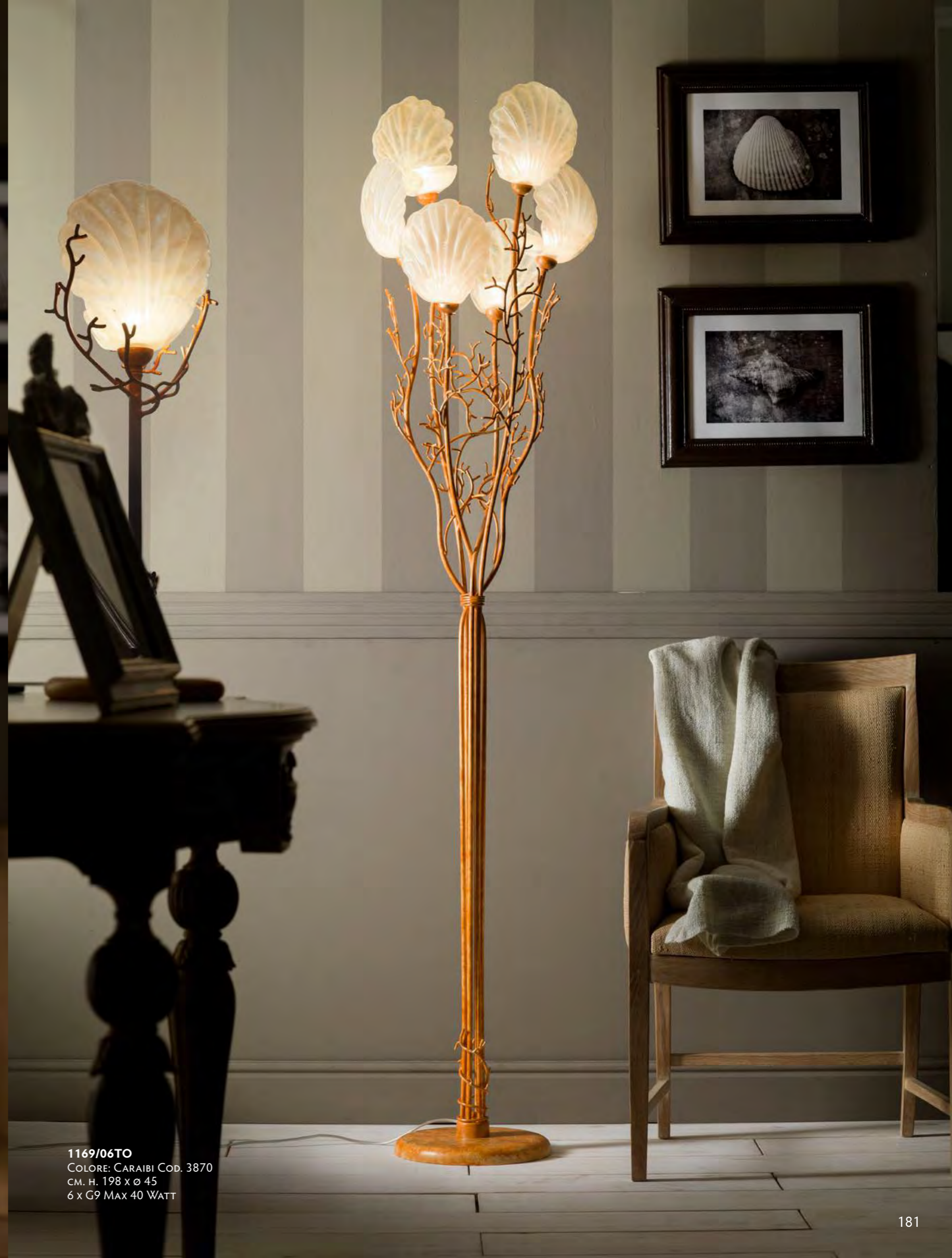
1169/06TO COLORE: CARAIBI COD. 3870 CM. H. 198 x Ø 45 6 x G9 MAX 40 WATT