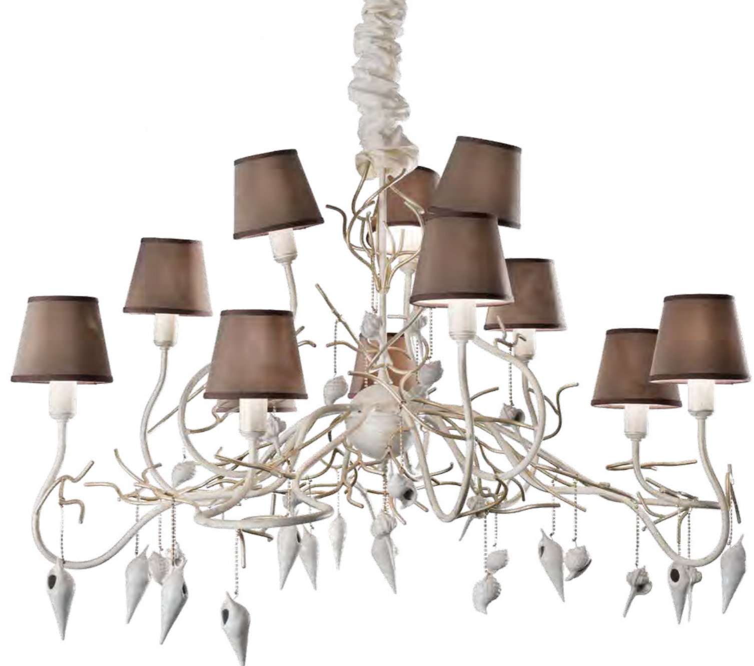
1139/12LA COLORE: LARISSA COD. 3984 CM. H. 70 x ø 100 12 x E14 MAX 40 WATT PARALUMI MICROFIBRA VISONE SU RICHIESTA ART. 7457*