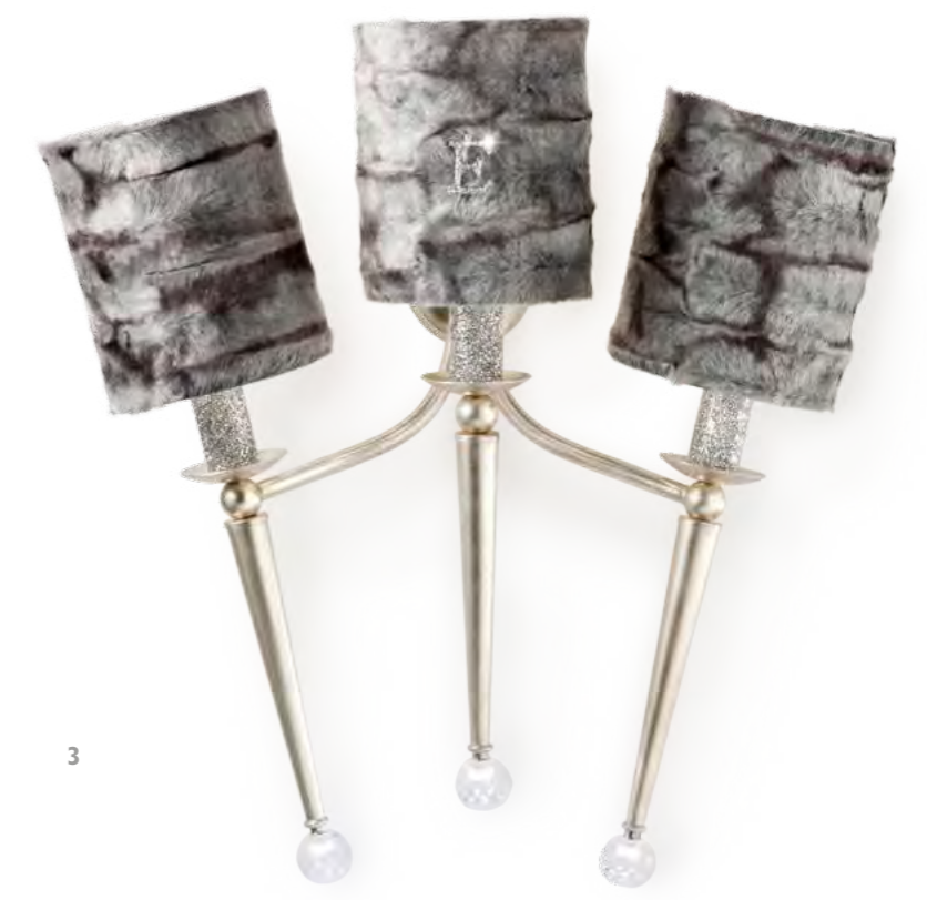
3 - 2644/06AP COLORE: ARGENTO FOGLIA Cod. 3007 CM. H. 62 x L. 62 x P. 22 3 x E14 MAX 40 WATT + 3 LED 1,5 WATT CRISTALLI SWAROVSKI®. PARALUMI ECOPELLICCIA GRIGIA CON MARCHIO "E" IN SWAROVSKI® INCLUSI**