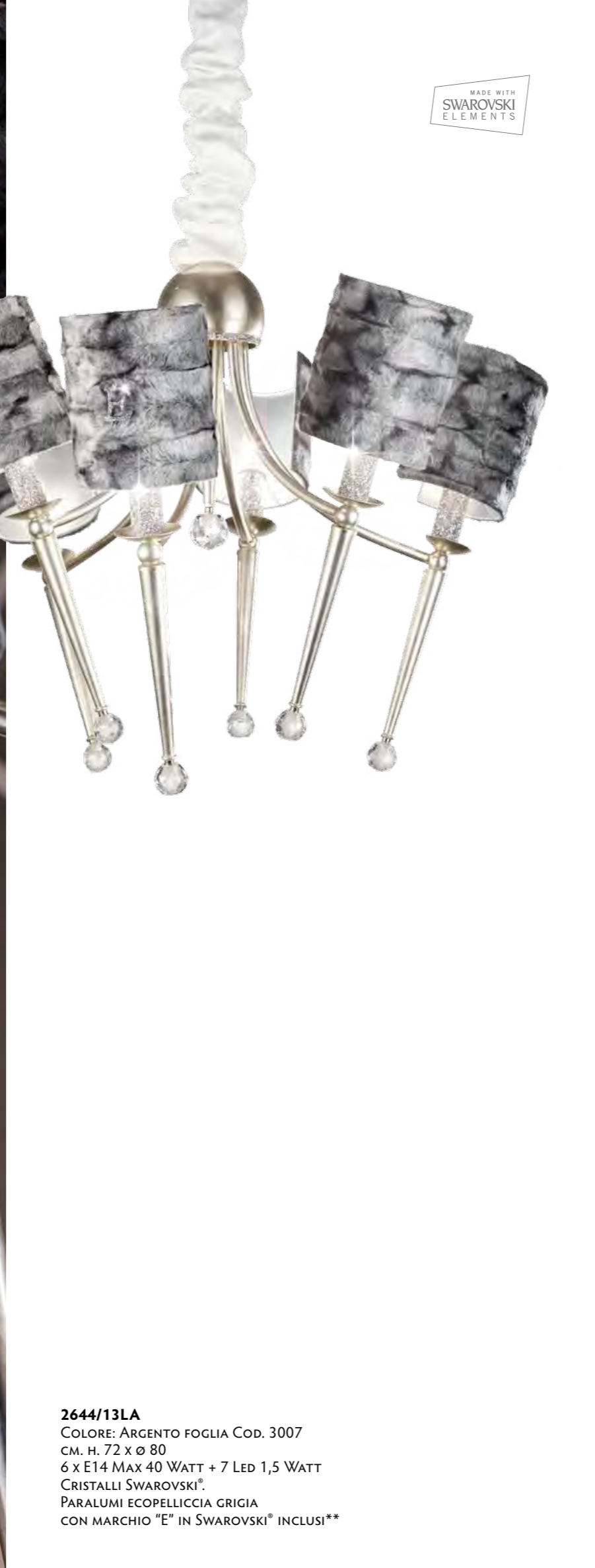
2644/13LA COLORE: ARGENTO FOGLIA COD. 3007 CM. H. 72 x Ø 80 6 x E14 MAX 40 WATT + 7 LED 1,5 WATT CRISTALLI SWAROVSKI®. PARALUMI ECOPELLICCIA GRIGIA CON MARCHIO "E" IN SWAROVSKI® INCLUSI**