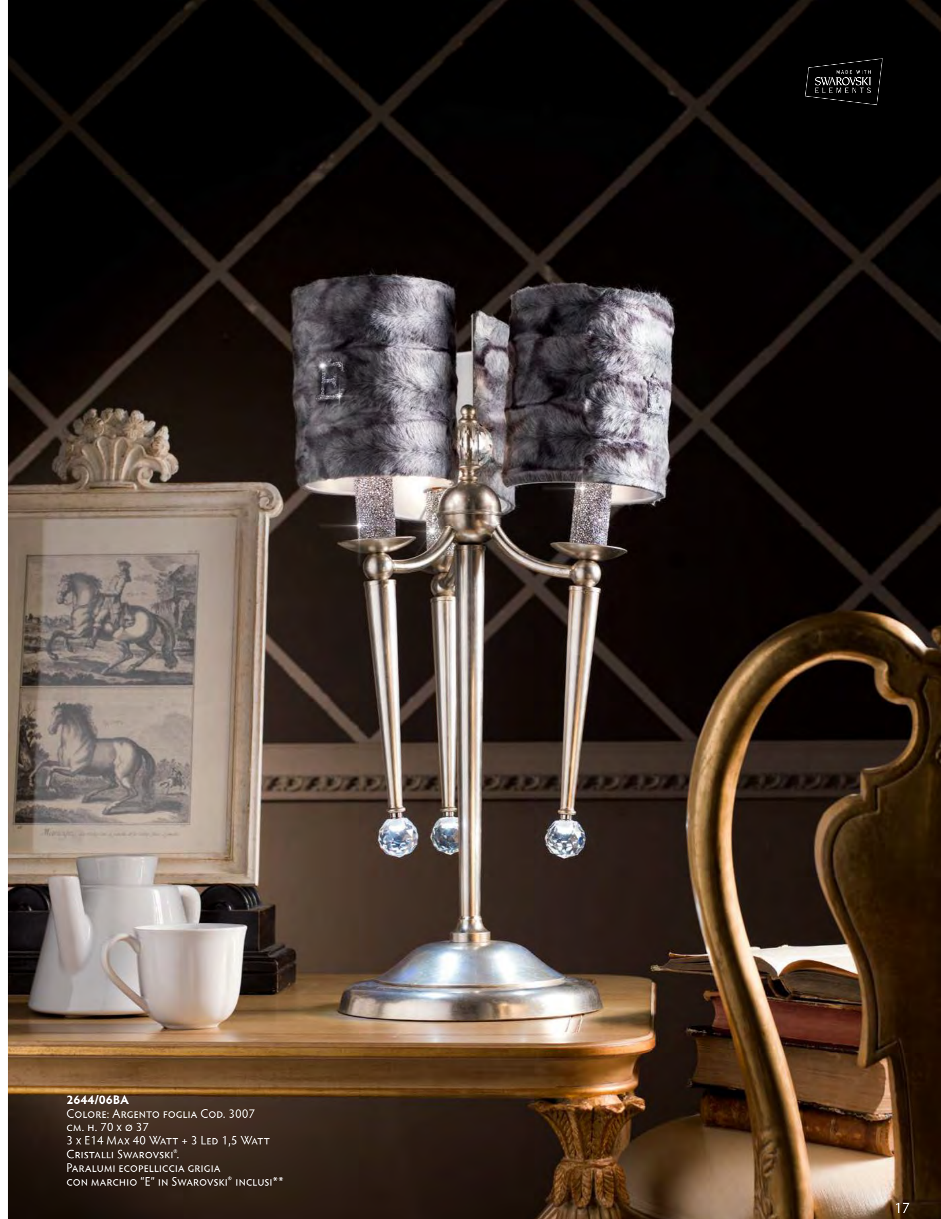
2644/06BA COLORE: ARGENTO FOGLIA COD. 3007 CM. H. 70 x Ø 37 3 x E14 MAX 40 WATT + 3 LED 1,5 WATT CRISTALLI SWAROVSKI®. PARALUMI ECOPELLICCIA GRIGIA CON MARCHIO "E" IN SWAROVSKI® INCLUSI**