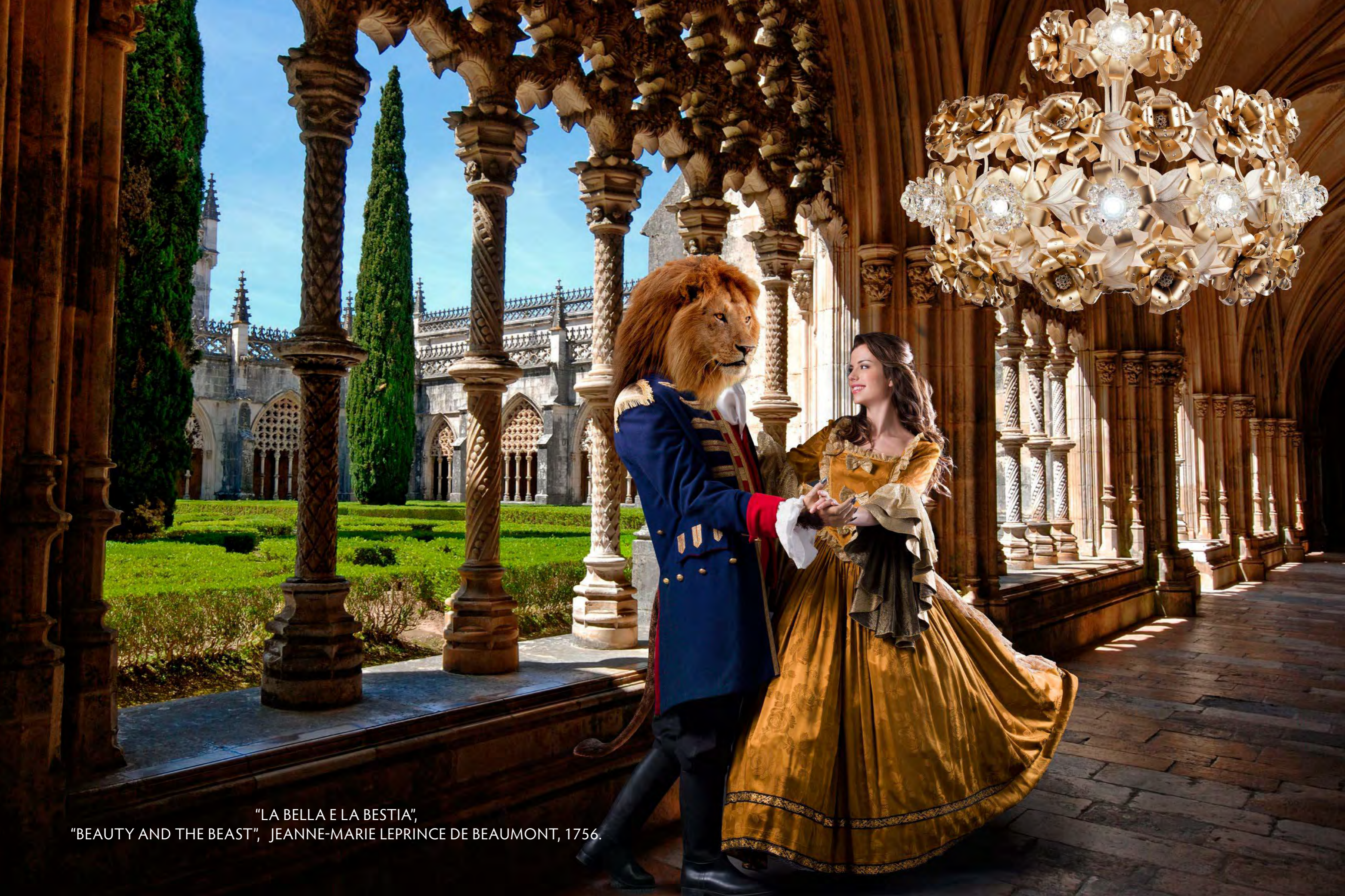
"LA BELLA E LA BESTIA", "BEAUTY AND THE BEAST", JEANNE-MARIE LEPRINCE DE BEAUMONT, 1756.