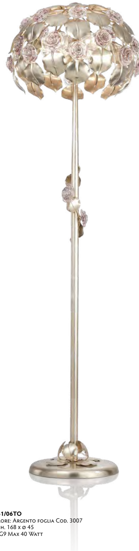
1161/06TO COLORE: ARGENTO FOGLIA COD. 3007 CM. H. 168 X Ø 45 6 X G9 MAX 40 WATT