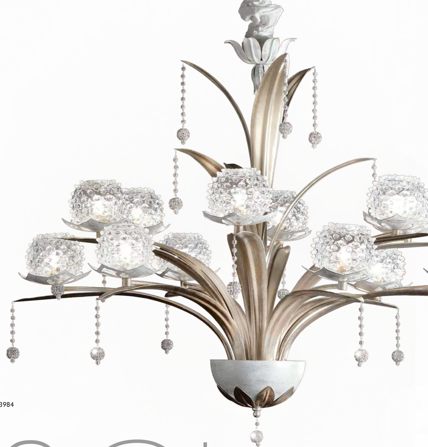
2637/12LA COLORE: LARISSA COD. 3984 CM. H. 90 x ø 102 12 x G9 Max 40 WATT