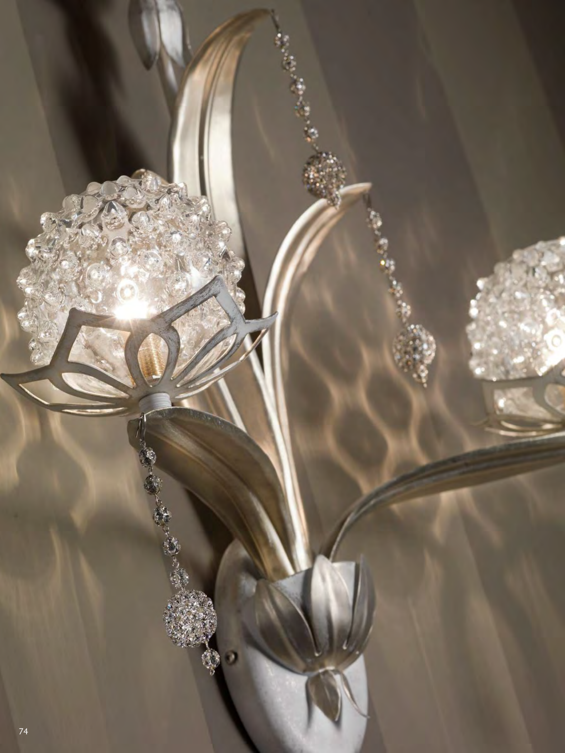
2637/02AP COLORE: LARISSA COD. 3984 CM. H. 57 X L. 54 X P. 25 2 X G9 MAX 40 WATT