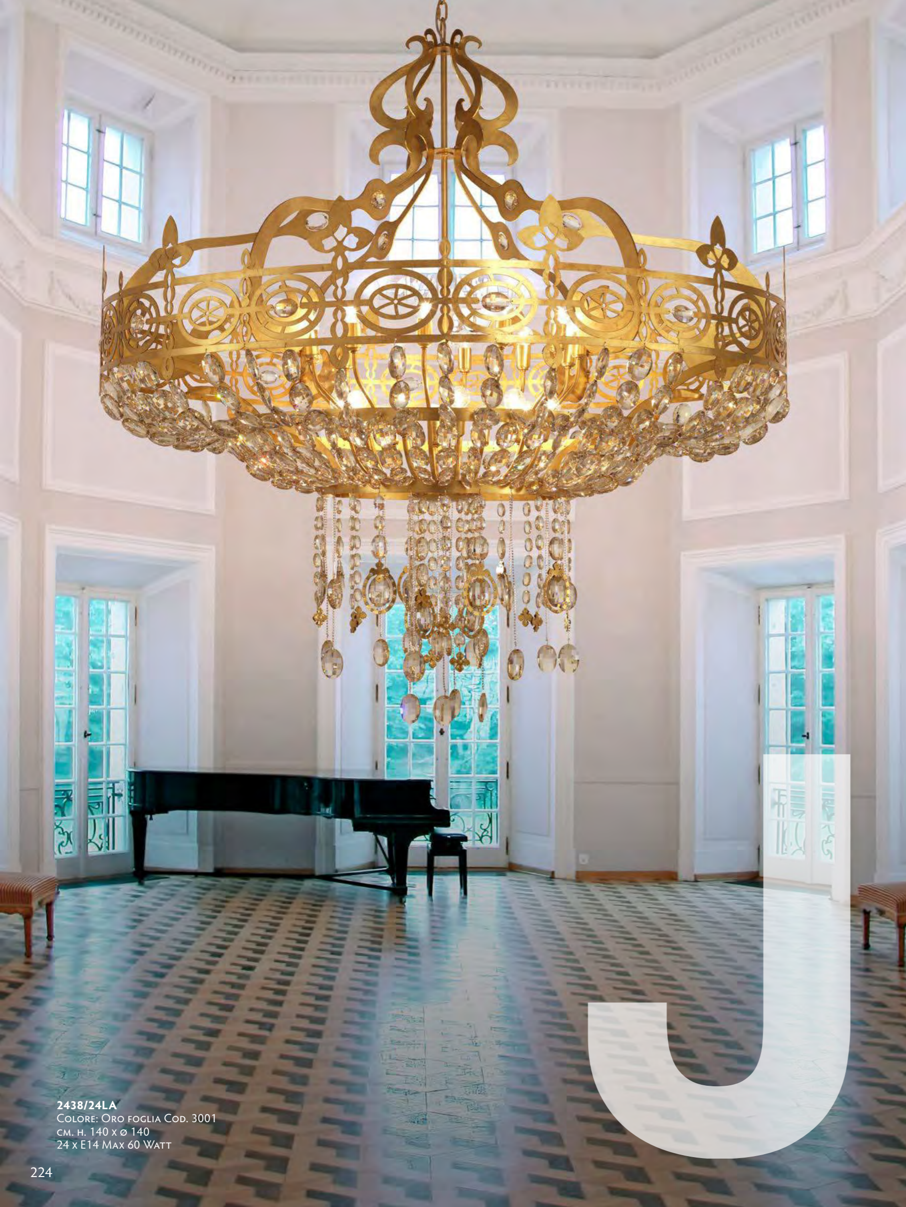
2438/24LA COLORE: ORO FOGLIA COD. 3001 CM. H. 140 x Ø 140 24 x E14 MAX 60 WATT