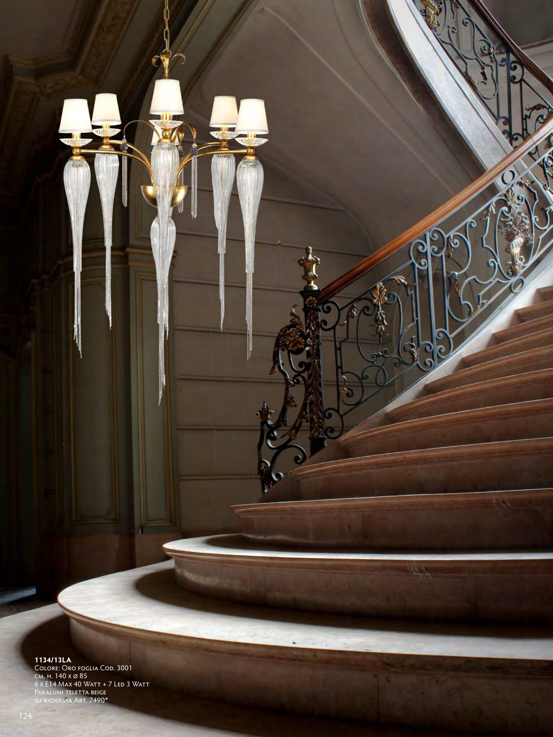
1134/13LA COLORE: ORO FOGLIA Cod. 3001 CM. H. 140 x Ø 85 6 x E14 MAX 40 WATT + 7 LED 3 WATT PARALUMI TELETTA BEIGE SU RICHIESTA ART. 7490*