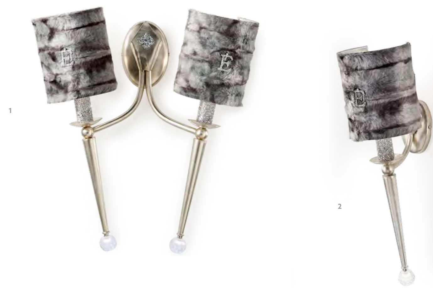
1 - 2644/04AP COLORE: ARGENTO FOGLIA Cod. 3007 CM. H. 57 x L. 52 x P. 22 2 x E14 MAX 40 WATT + 2 LED 1,5 WATT CRISTALLI SWAROVSKI®. PARALUMI ECOPELLICCIA GRIGIA CON MARCHIO "E" IN SWAROVSKI® INCLUSI**