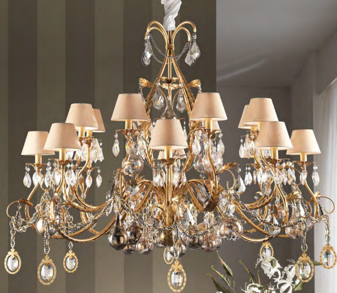
2440/16LA COLORE: ORO FOGLIA COD. 3001 CM. H. 120 x Ø 140 16 x E14 MAX 40 WATT PARALUMI SETA CHAMPAGNE SU RICHIESTA ART. 7350*