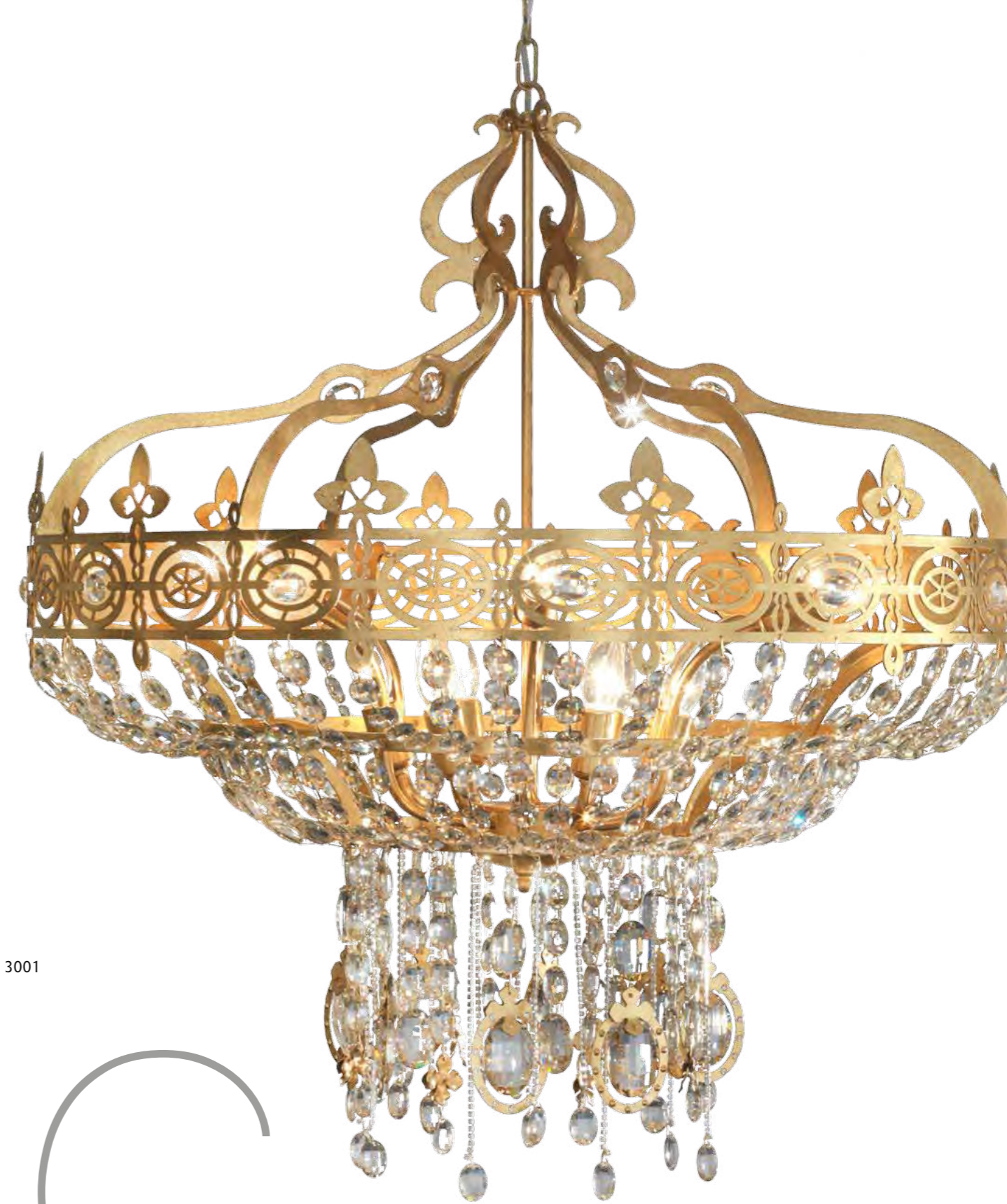
2438/12LA COLORE: ORO FOGLIA COD. 3001 CM. H. 96 X Ø 86 12 X G9 MAX 40 WATT