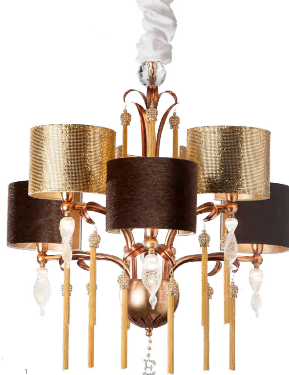
1 - 2642/12LA COLORE: ORO VISONE COD. 3883 CM. H. 75 x Ø 68 6 x E14 MAX 40 WATT + 6 LED 1,5 WATT PARALUMI ECOPELLICCIA MARRONE E RETE METALLICA ORO CON MARCHIO "E" IN SWAROVSKI INCLUSI**