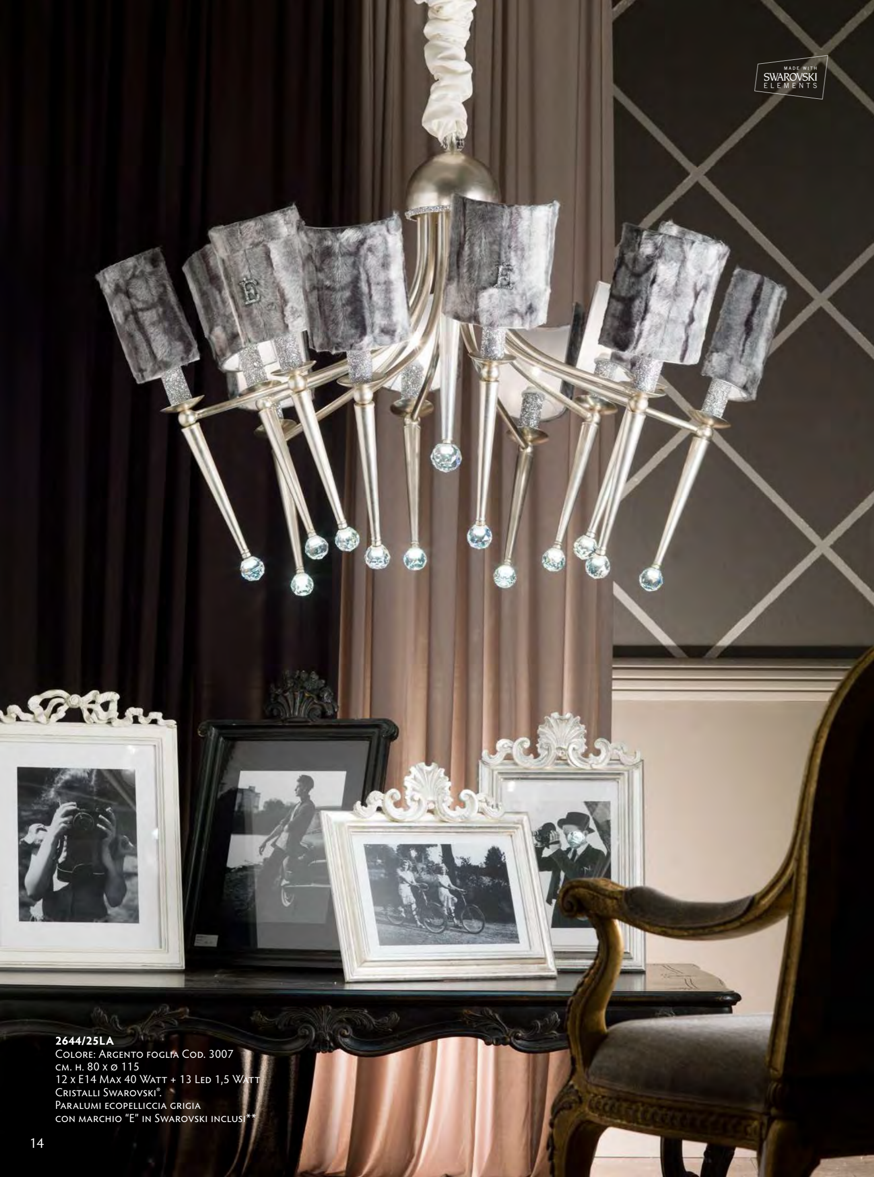
2644/25LA COLORE: ARGENTO FOGLIA Cod. 3007 CM. H. 80 x Ø 115 12 x E14 MAX 40 WATT + 13 LED 1,5 WATT CRISTALLI SWAROVSKI®. PARALUMI ECOPELLICCIA GRIGIA CON MARCHIO "E" IN SWAROVSKI INCLUSI**