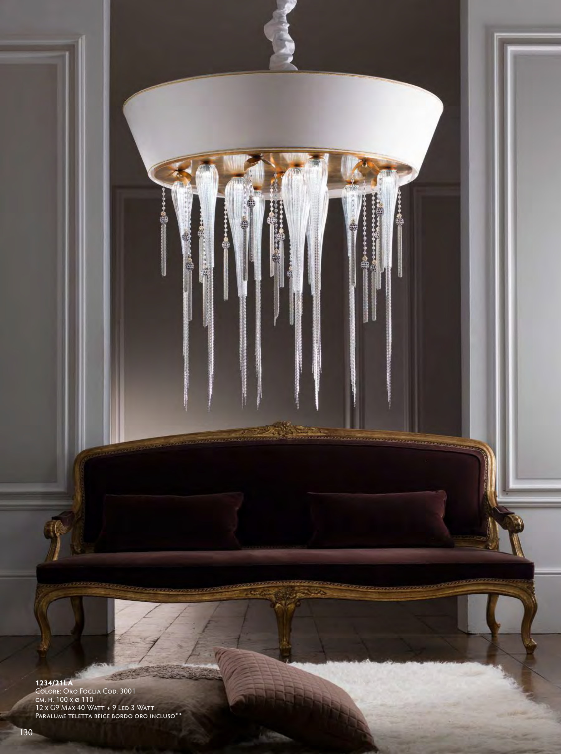
1234/21LA COLORE: ORO FOGLIA Cod. 3001 CM. H. 100 x Ø 110 12 x G9 Max 40 WATT + 9 LED 3 WATT PARALUME TELETTA BEIGE BORDO ORO INCLUSO**