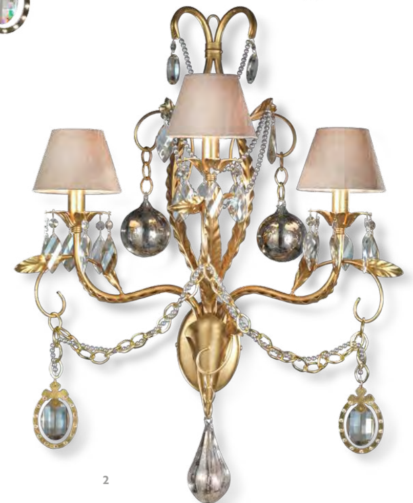
2 - 2440/03AP COLORE: ORO FOGLIA COD. 3001 CM. H. 80 x L. 70 x P. 30 3 x E14 MAX 40 WATT PARALUMI SETA CHAMPAGNE SU RICHIESTA ART. 7350*