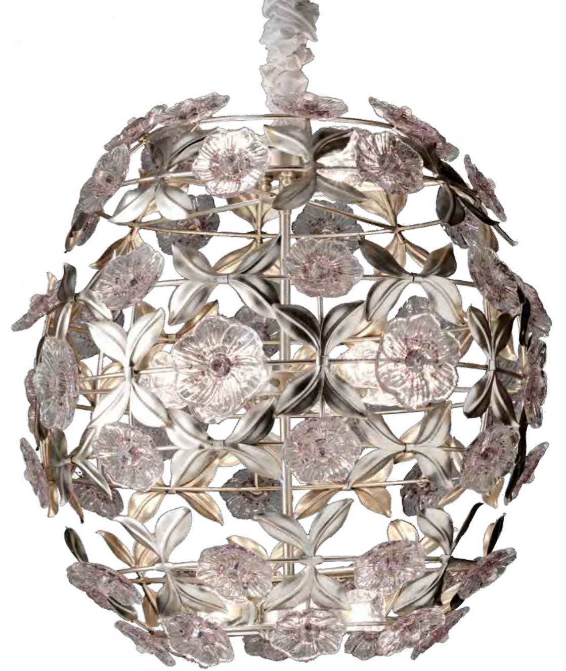
2485/16LA COLORE: ARGENTO FOGLIA COD. 3007 CM. H. 75 x Ø 75 16 x G9 MAX 40 WATT