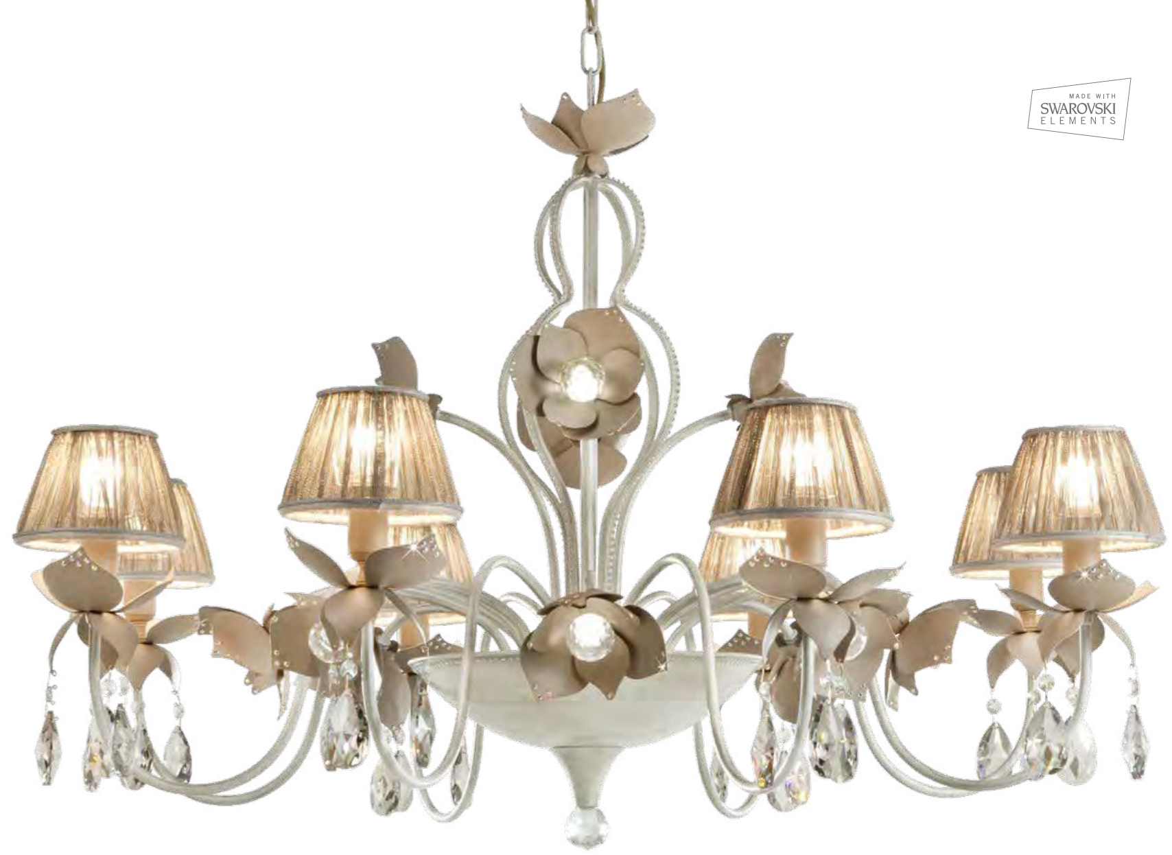
2467/20LA COLORE: LARA COD. 3986 CM. H. 70 x Ø 105 8 x E14 MAX 40 WATT + 12 LED x 1,5 WATT CRISTALLI SWAROVSKI®. PARALUMI ARRICCIATI SU RICHIESTA ART. 7482*