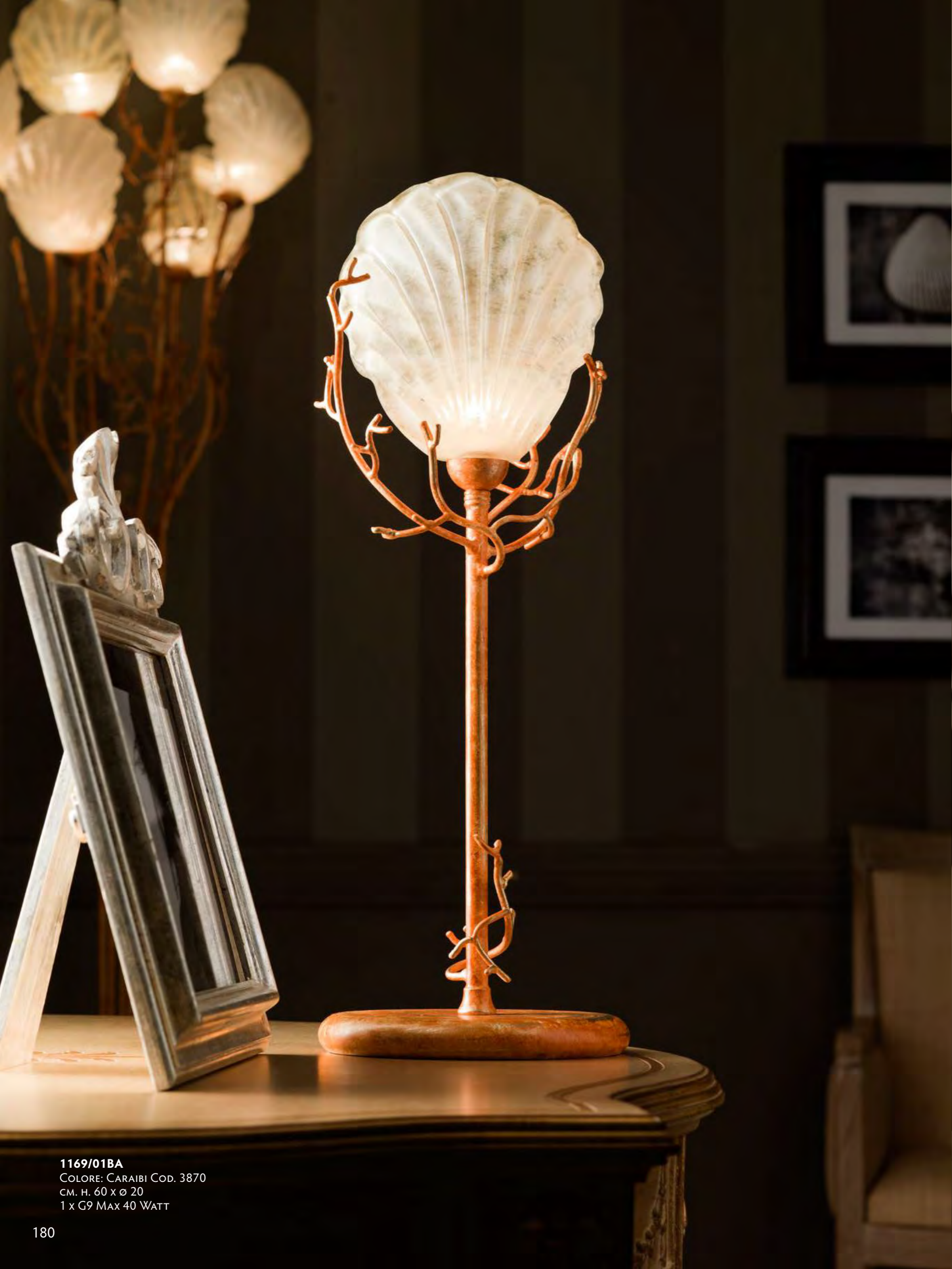
1169/01BA COLORE: CARAIBI COD. 3870 CM. H. 60 x Ø 20 1 x G9 MAX 40 WATT