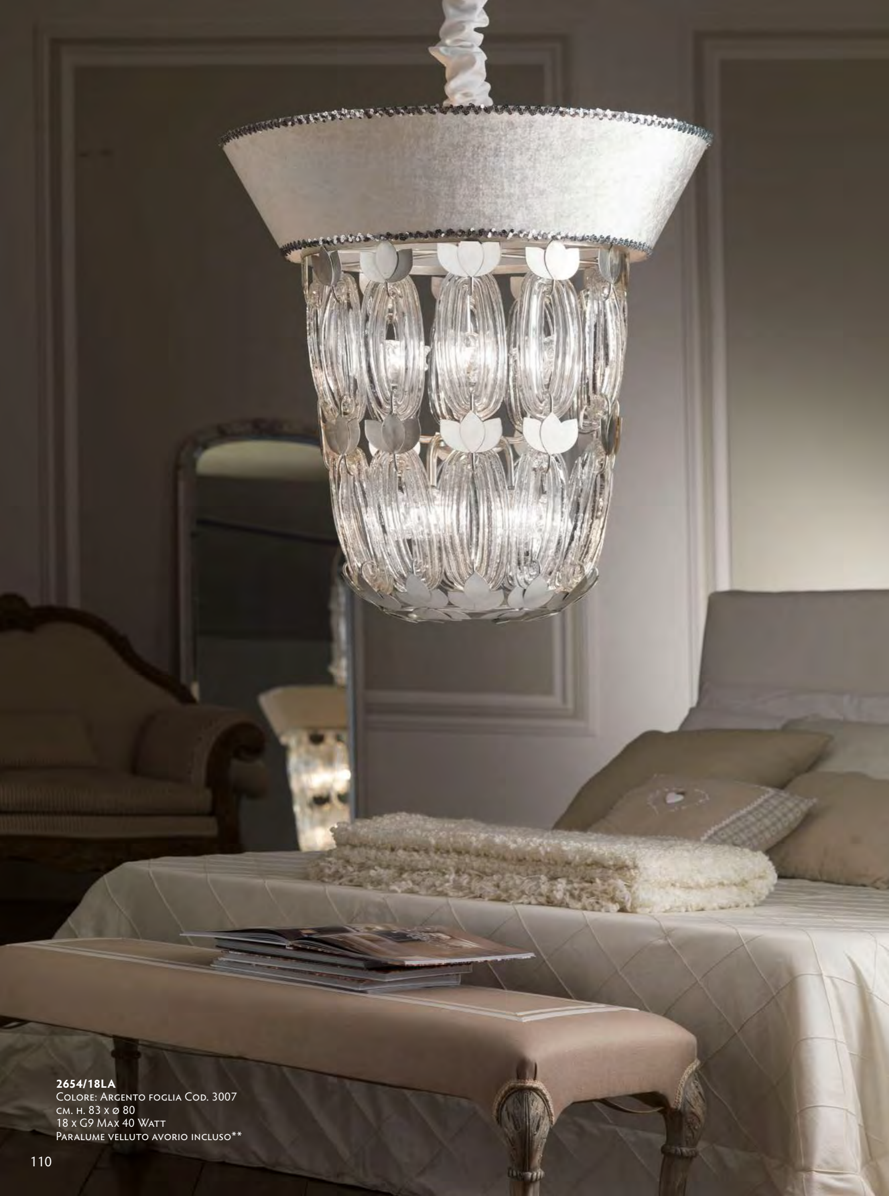
2654/18LA COLORE: ARGENTO FOGLIA COD. 3007 CM. H. 83 x Ø 80 18 x G9 MAX 40 WATT PARALUME VELLUTO AVORIO INCLUSO**