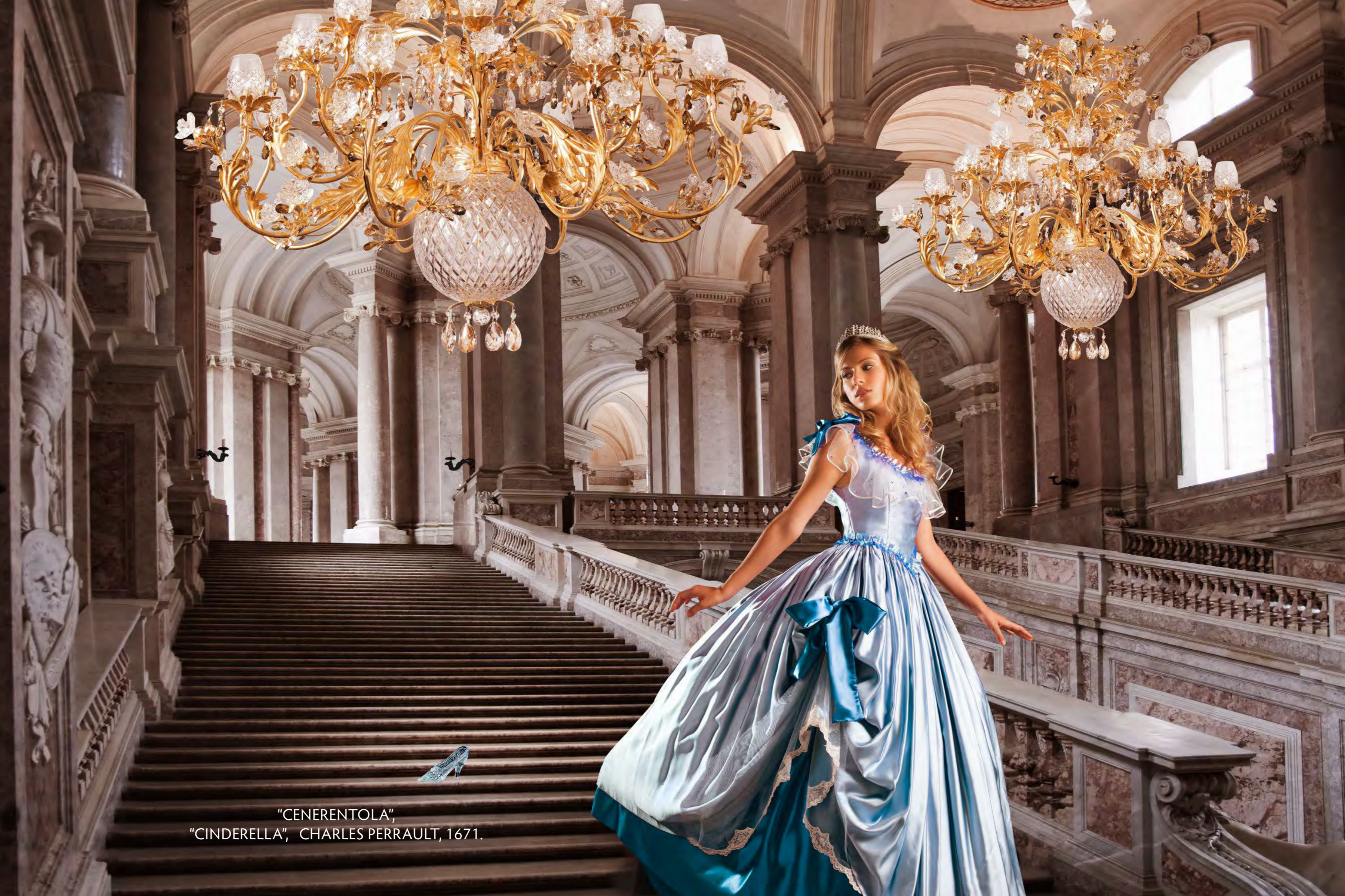
"CENERENTOLA", "CINDERELLA", CHARLES PERRAULT, 1671.