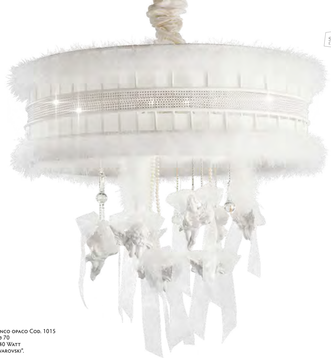
2562/06LA COLORE: BIANCO OPACO Cod. 1015 CM. H. 70 x Ø 70 6 x G9 MAX 40 WATT CRISTALLI SWAROVSKI®.