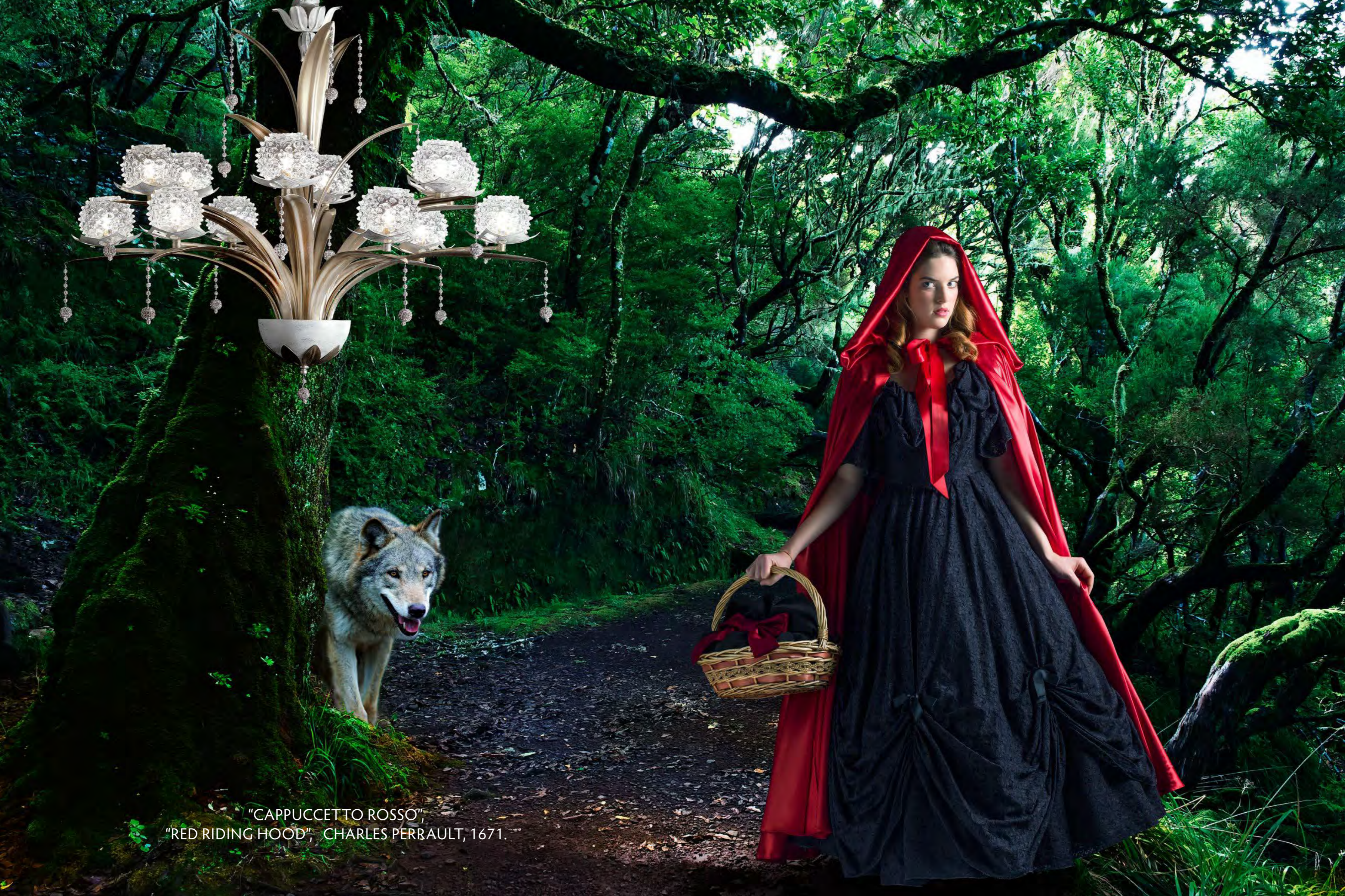
"CAPPUCETTO ROSSO", "RED RIDING HOOD", CHARLES PERRAULT, 1671.