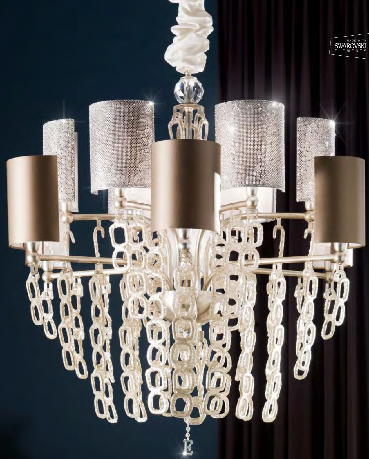
2643/12LA COLORE: ARGENTO FOGLIA Cod. 3007 CM. H. 100 x Ø 95 12 x E14 MAX 40 WATT PARALUMI RASO TORTORA E RETE METALLICA ARGENTO SWAROVSKI INCLUSI** MARCHIO "E" IN CRYSTAL ROCK SWAROVSKI ELEMENTS®.