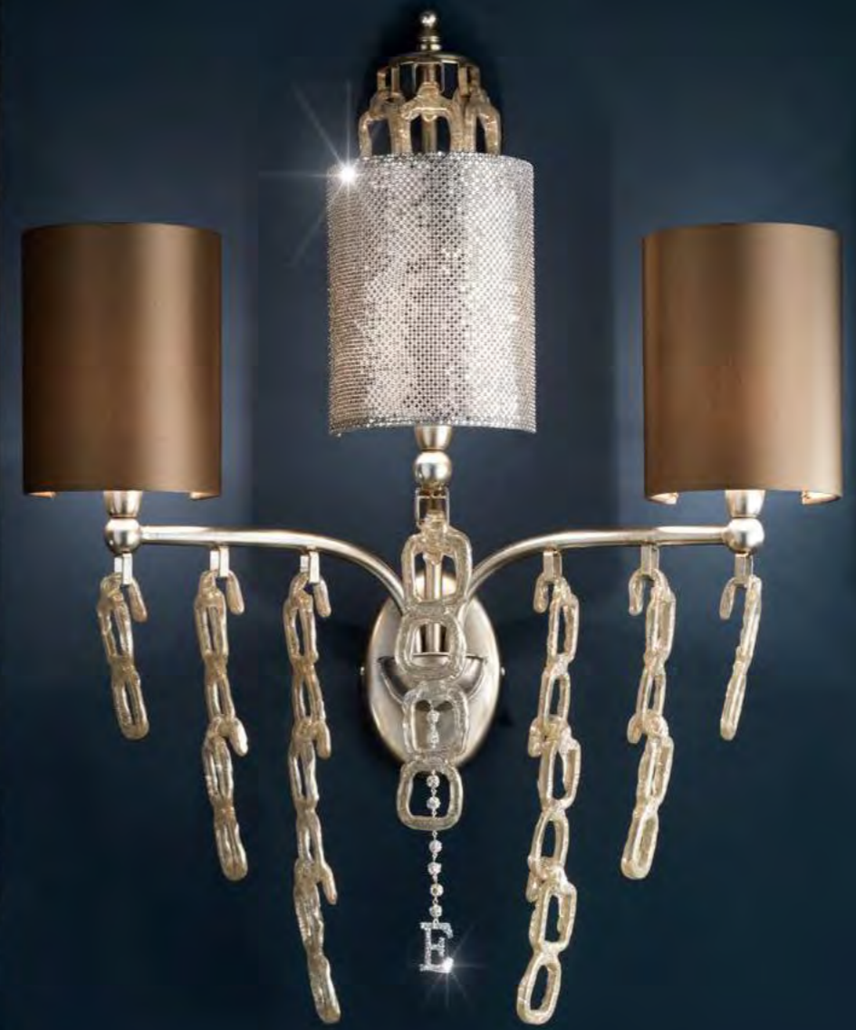
2643/03AP COLORE: ARGENTO FOGLIA COD. 3007 CM. H. 73 X L. 62 X P. 25 3 X E14 MAX 40 WATT PARALUMI RASO TORTORA E RETE METALLICA ARGENTO SWAROVSKI® INCLUSI** MARCHIO "E" IN CRYSTAL ROCK SWAROVSKI ELEMENTS®