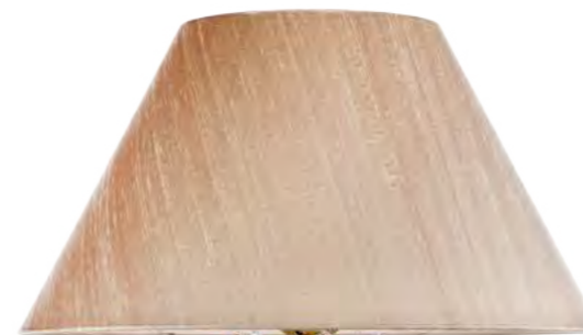
3 - 2540/01BA - JASMINE COLORE: ORO FOGLIA COD. 3001 CM. H. 47 X Ø 25 1 X E27 MAX 40 WATT PARALUME SETA CHAMPAGNE SU RICHIESTA ART. 7496*