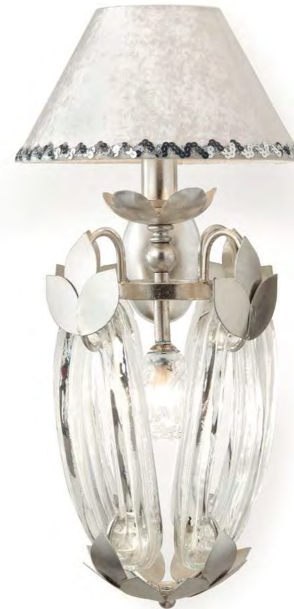
2654/02AP COLORE: ARGENTO FOGLIA COD. 3007 CM. H. 52 x L. 22 x P. 32 1 x G9 MAX 40 WATT + 1 x E14 MAX 40 WATT PARALUME VELLUTO AVORIO INCLUSO**