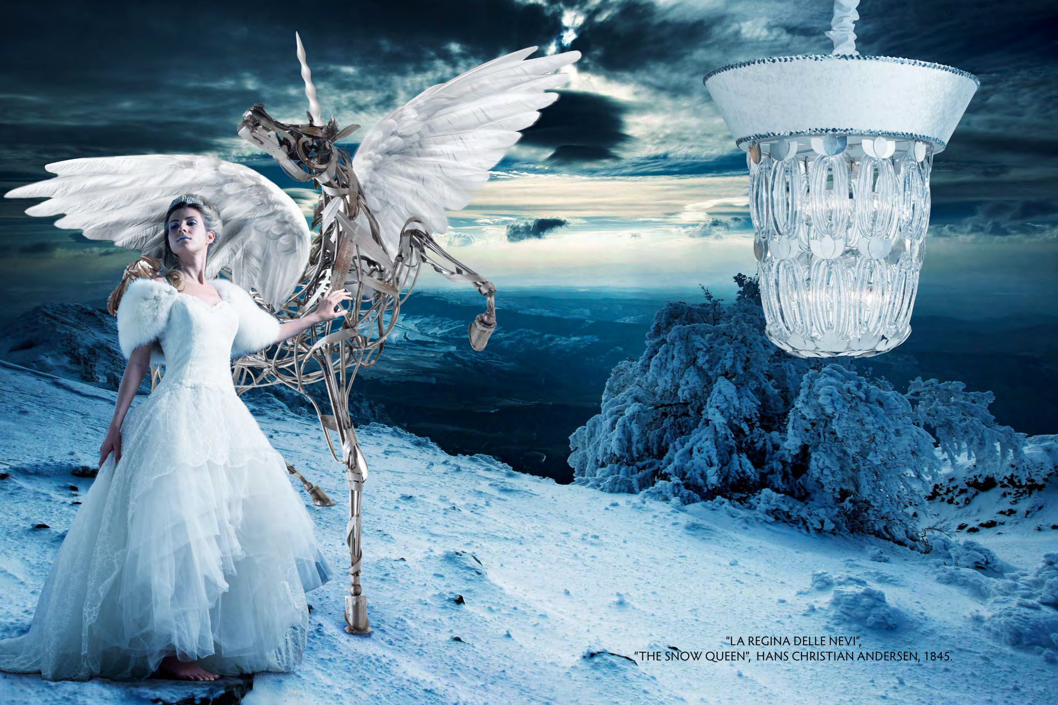
"LA REGINA DELLE NEVI", "THE SNOW QUEEN", HANS CHRISTIAN ANDERSEN, 1845.