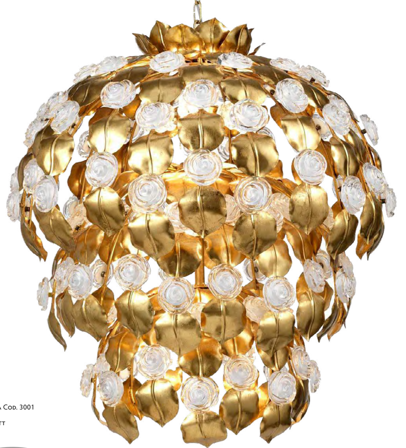
1160/14LA COLORE: ORO FOGLIA Cod. 3001 CM. H. 90 x Ø 80 14 x G9 MAX 40 WATT