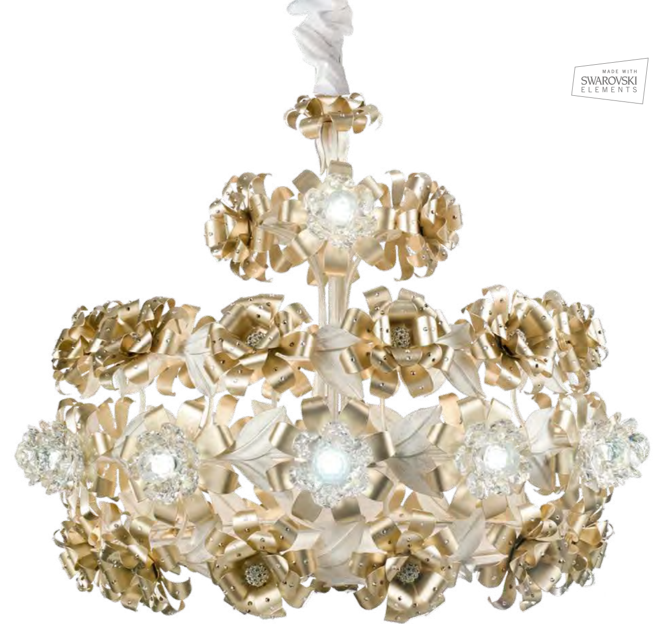
1 - 2639/27LA COLORE: LARISSA Cod. 3984 CM. H. 65 x 76 Ø 12 x G9 MAX 40 WATT 15 LED 1,5 WATT CRISTALLI SWAROVSKI®.