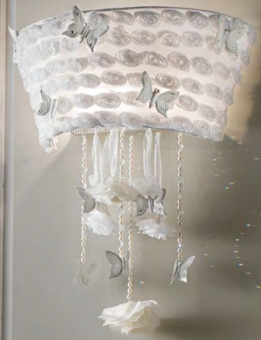
2641/03AP COLORE: BIANCO BRILLANTE COD. 3206 CM. H. 60 x L. 47 x P. 26 3 x G9 MAX 40 WATT CRISTALLI SWAROVSKI® PARALUME ROSE INCLUSO**