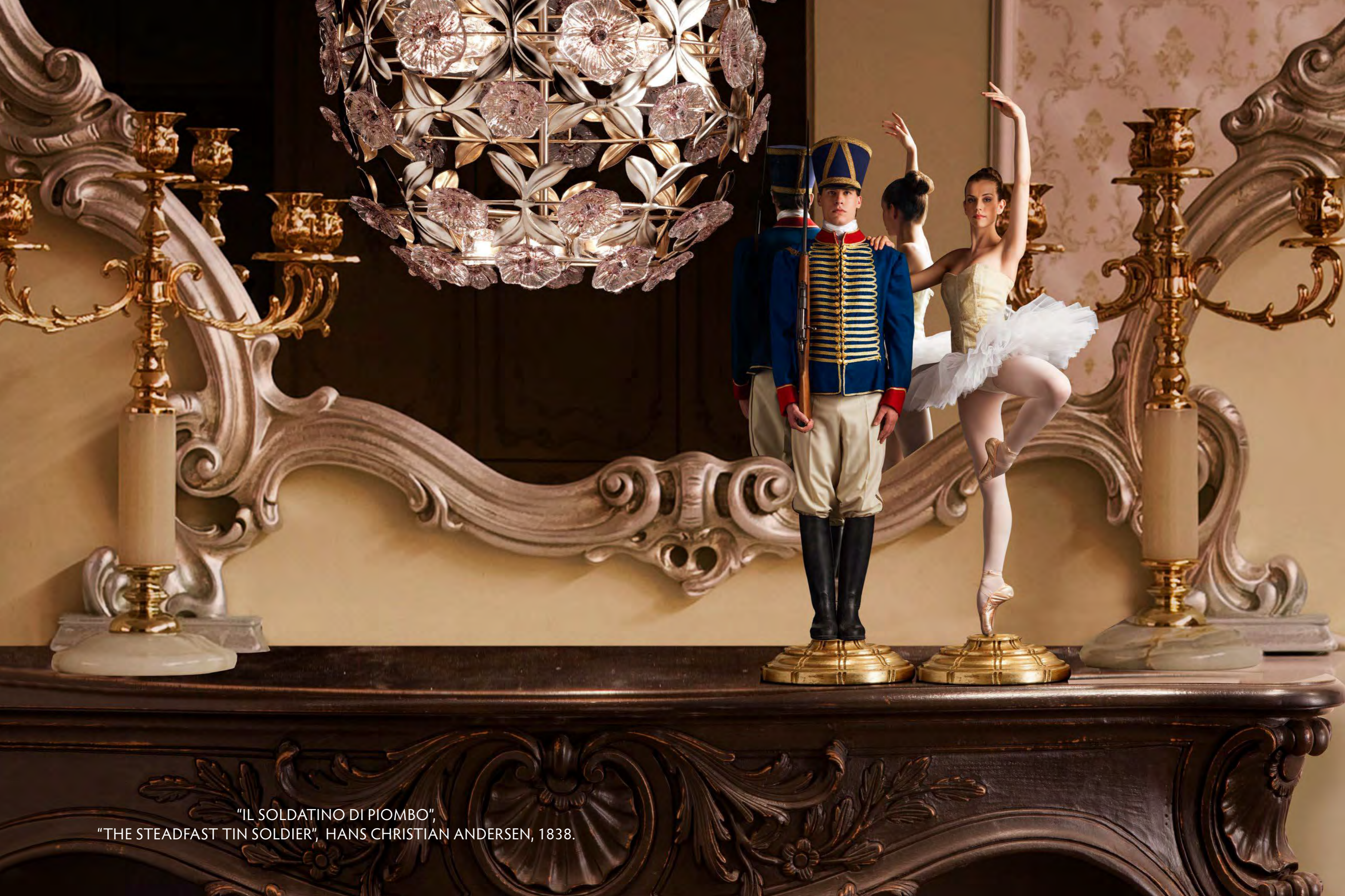
"IL SOLDATINO DI PIOMBO", "THE STEADFAST TIN SOLDIER", HANS CHRISTIAN ANDERSEN, 1838.