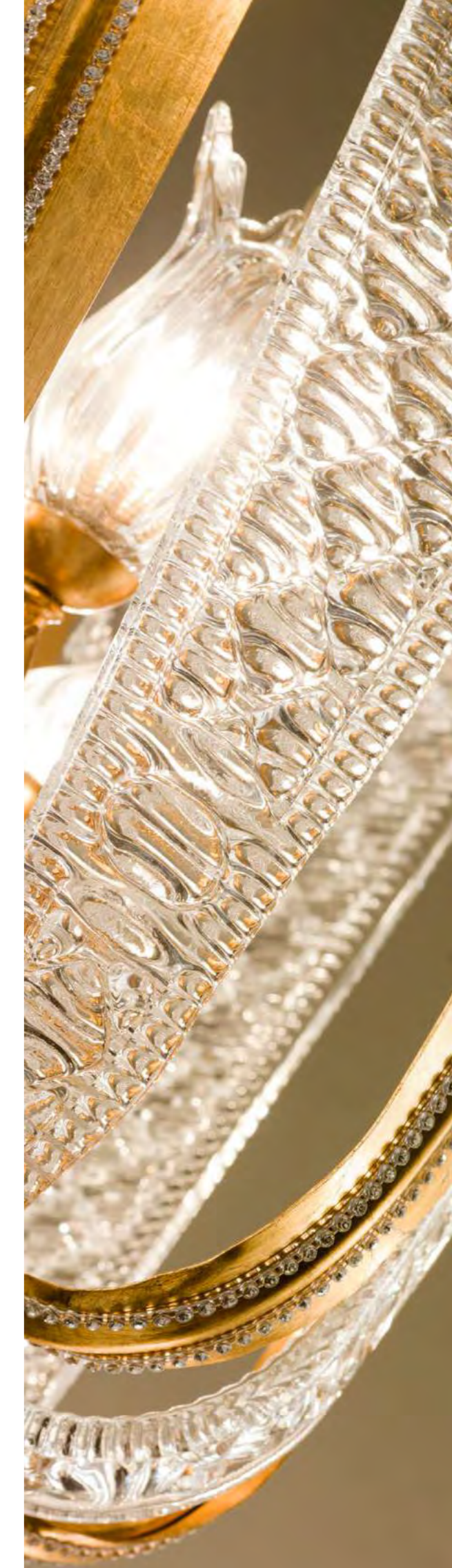
2 - 1288/02AP COLORE: ORO FOGLIA COD. 3001 CM. H. 77 x Ø L. 12 x P. 18 1 x G9 MAX 40 WATT + 1 LED 1,5 WATT VERSIONE SENZA LED ART. 1188/01AP