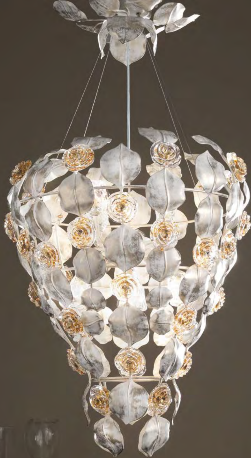
1262/08PL COLORE: EVA COD. 3987 CM. H. 98 (REGOLABILE) X Ø 57 8 X G9 MAX 40 WATT