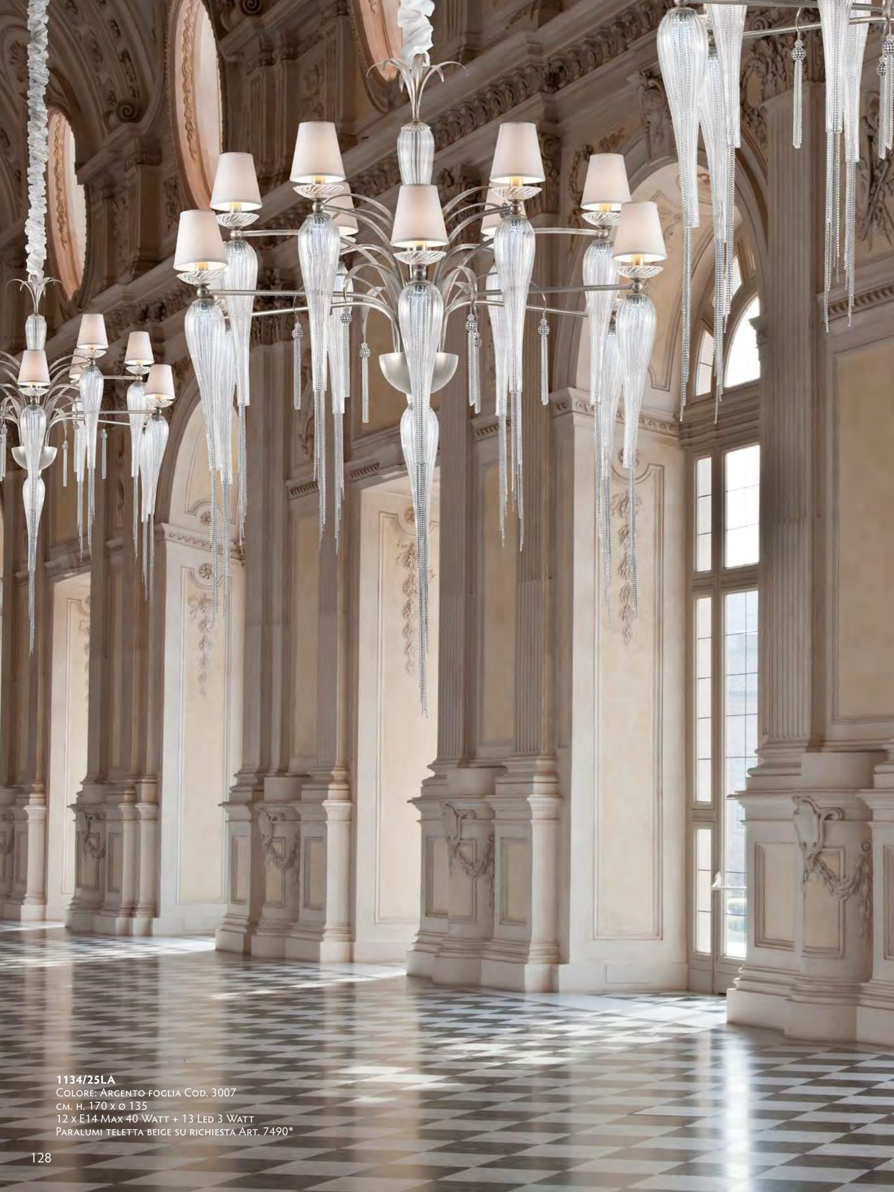
1134/25LA COLORE: ARGENTO FOGLIA COD. 3007 CM. H. 170 x Ø 135 12 x E14 MAX 40 WATT + 13 LED 3 WATT PARALUMI TELETTA BEIGE SU RICHIESTA ART. 7490*