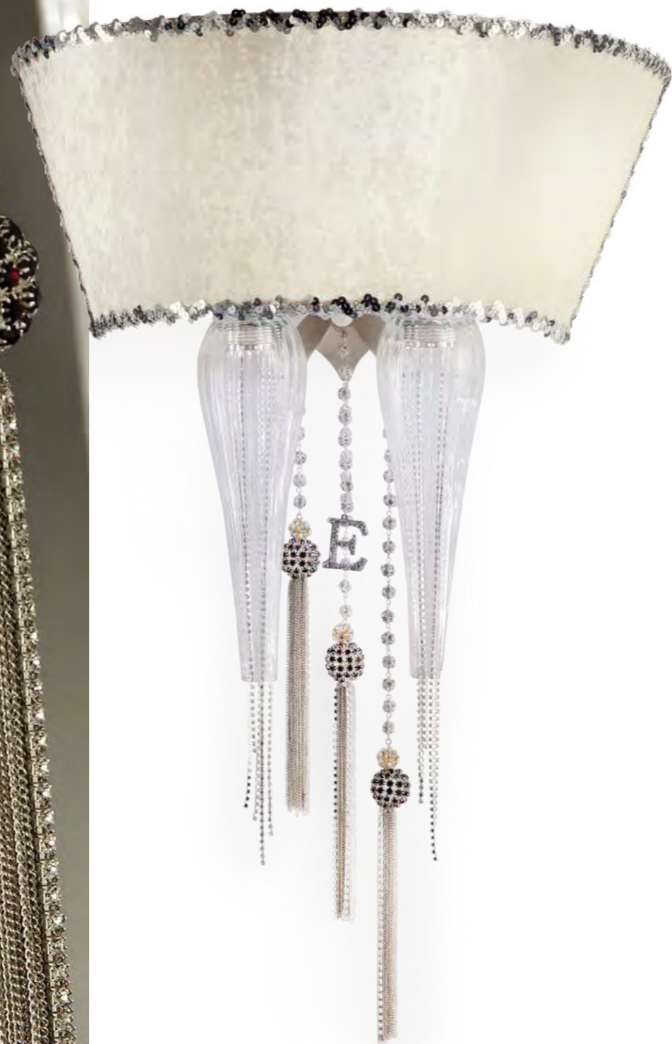
1134/05AP COLORE: LARISSA COD. 3984 CM. H. 70 x L. 47 x P. 26 3 x G9 MAX 40 WATT + 2 LED 3 WATT PARALUMI VELLUTO AVORIO INCLUSO** MARCHIO "E" IN CRYSTAL ROCK SWAROVSKI ELEMENTS®.