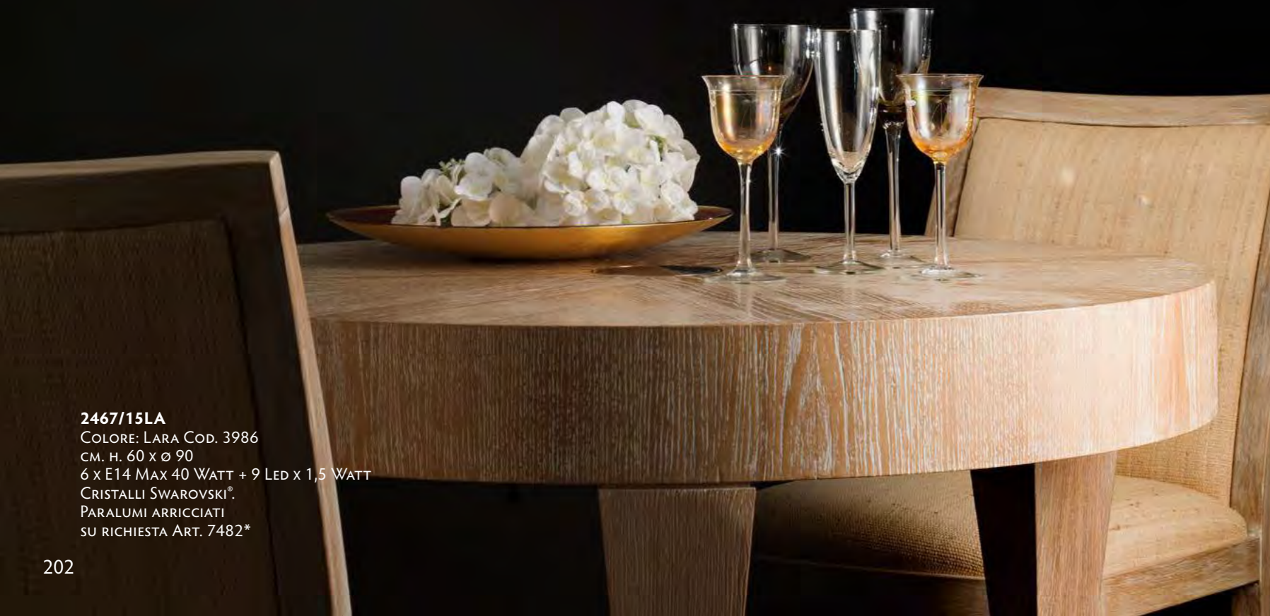
2467/15LA COLORE: LARA COD. 3986 CM. H. 60 x Ø 90 6 x E14 MAX 40 WATT + 9 LED x 1,5 WATT CRISTALLI SWAROVSKI®. PARALUMI ARRICCIATI SU RICHIESTA ART. 7482*