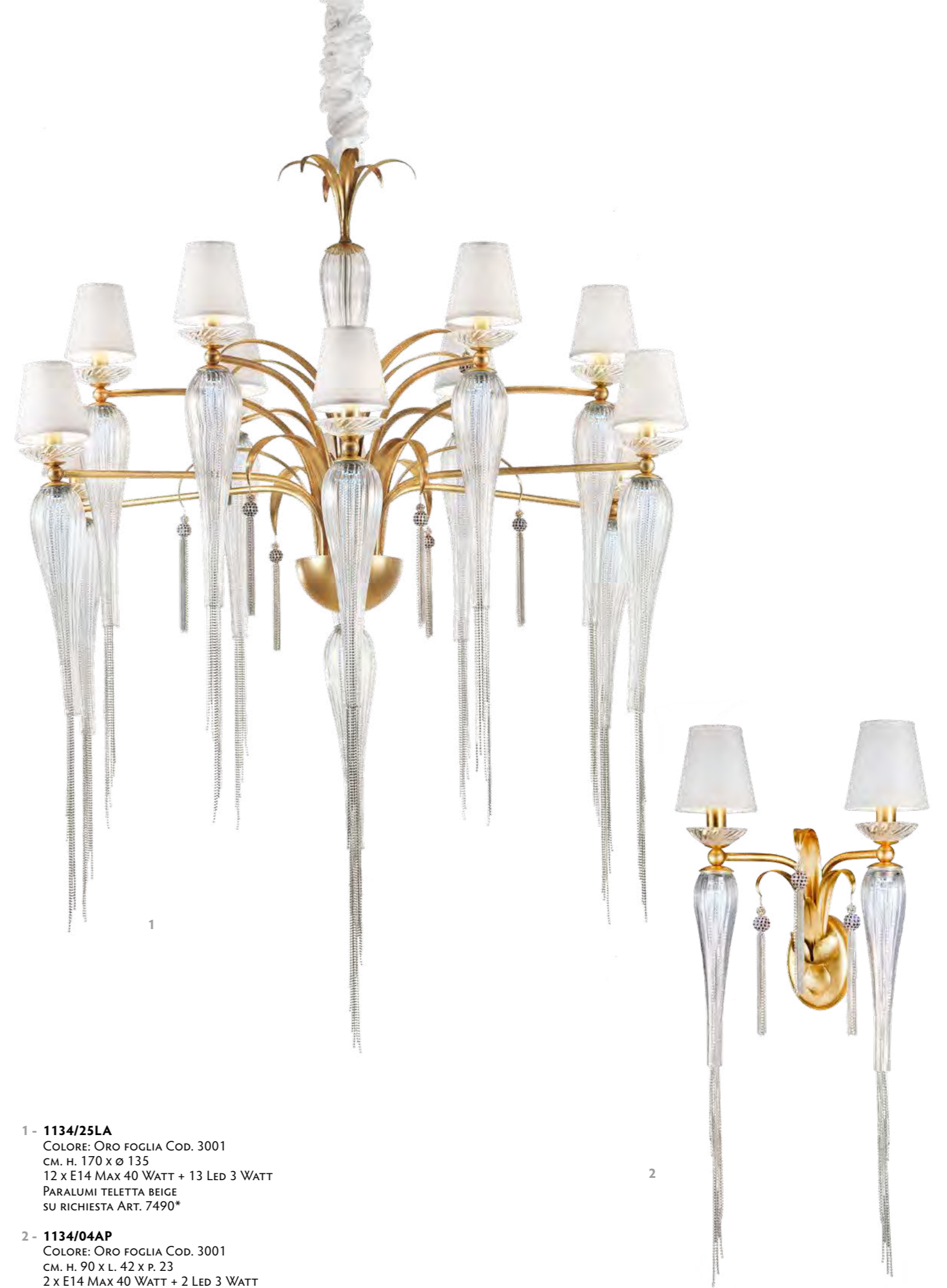
1 - 1134/25LA COLORE: ORO FOGLIA COD. 3001 CM. H. 170 x Ø 135 12 x E14 MAX 40 WATT + 13 LED 3 WATT PARALUMI TELETTA BEIGE SU RICHIESTA ART. 7490*