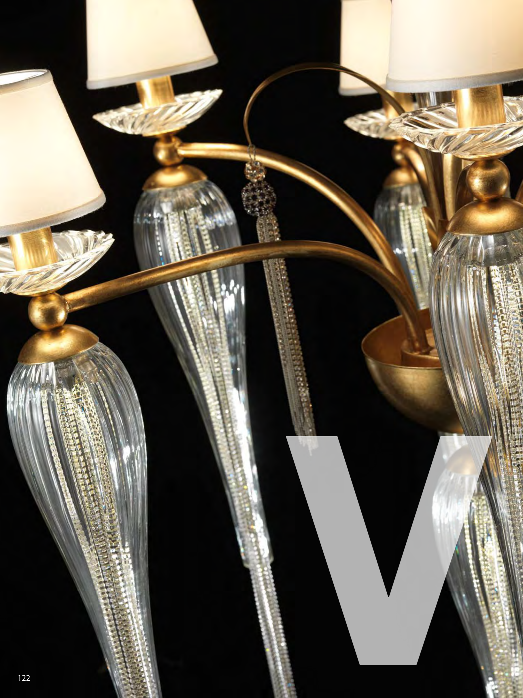
1134/13LA COLORE: ORO FOGLIA COD. 3001 CM. H. 140 x Ø 85 6 x E14 MAX 40 WATT + 7 LED 3 WATT PARALUMI TELETTA BEIGE SU RICHIESTA ART. 7490*