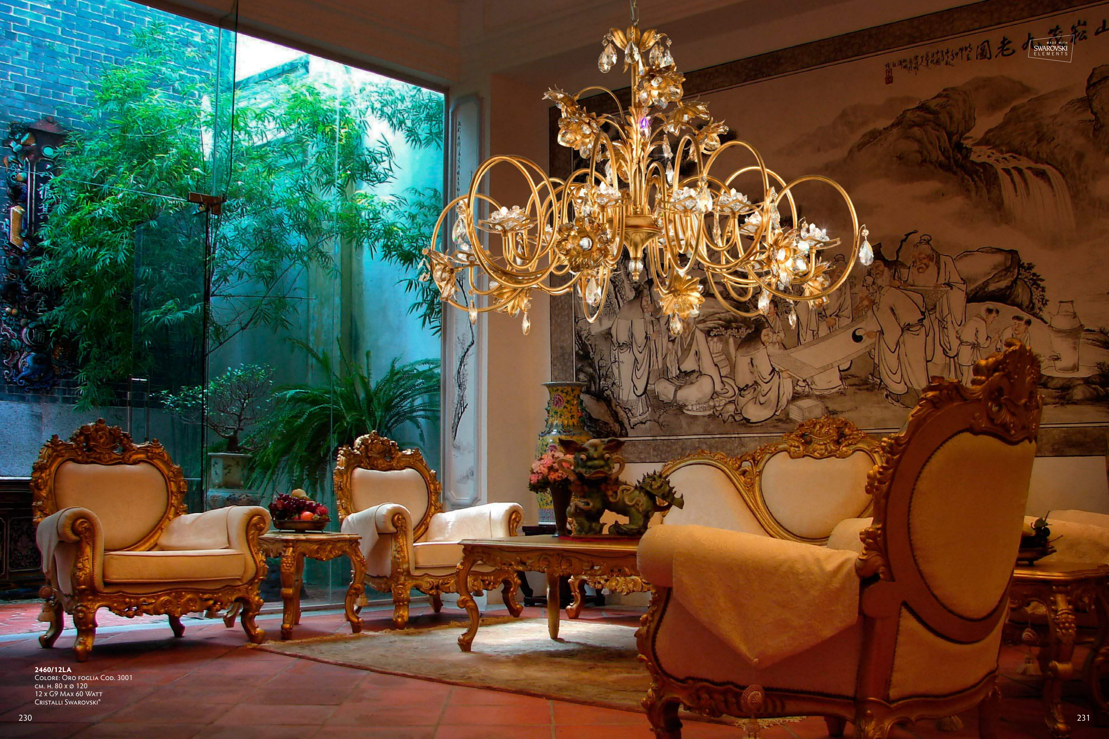
2460/12LA COLORE: ORO FOGLIA Cod. 3001 CM. H. 80 x ø 120 12 x G9 Max 60 WATT CRISTALLI SWAROVSKI®