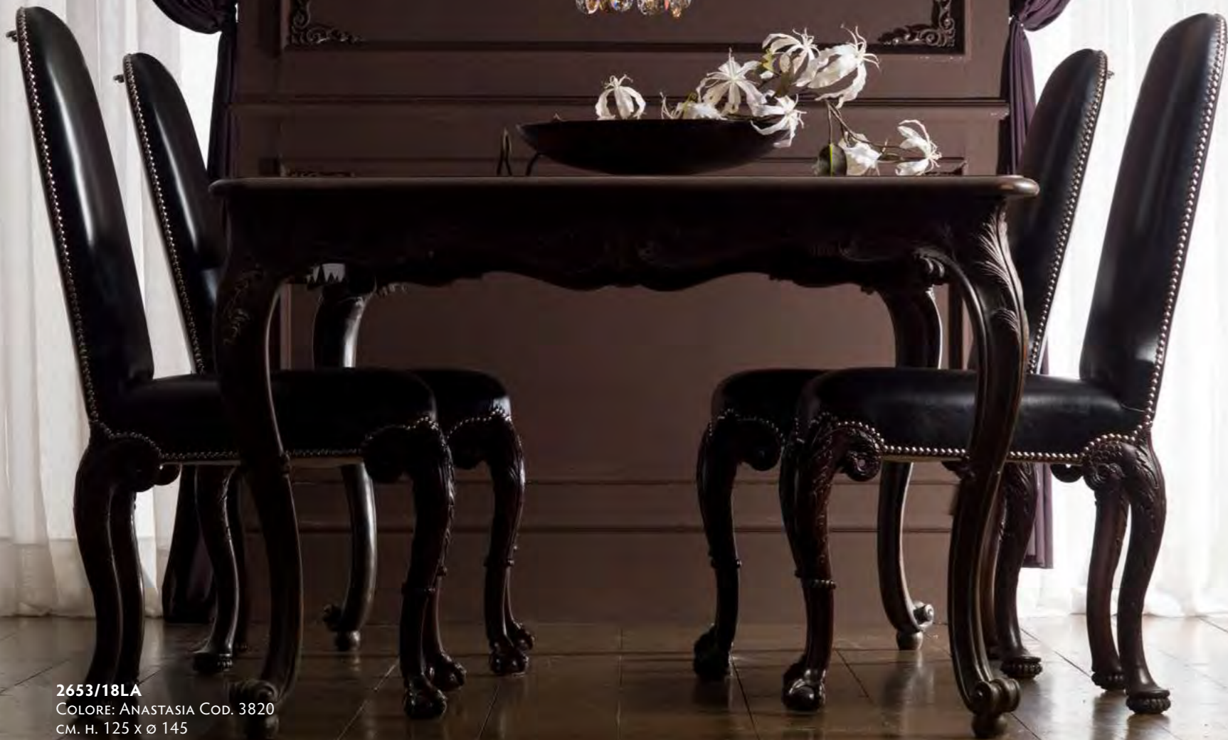
2653/18LA COLORE: ANASTASIA COD. 3820 CM. H. 125 x Ø 145 18 x G9 MAX 40 WATT CRISTALLI SWAROVSKI®