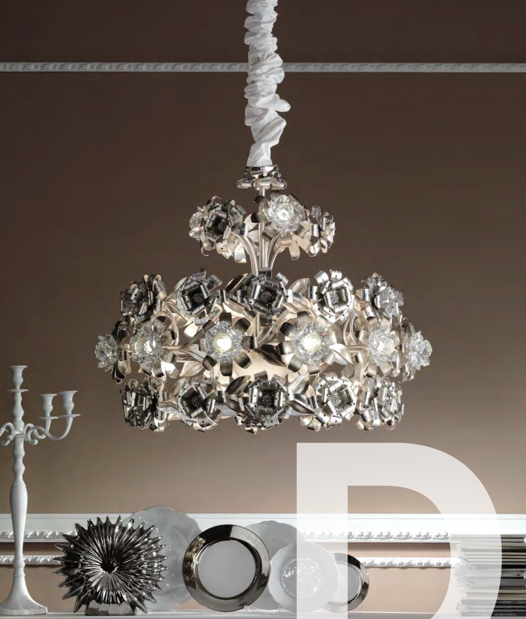
2639/27LA COLORE: ARGENTO FOGLIA Cod. 3007 CM. H. 65 x 76 Ø 12 x G9 MAX 40 WATT - 15 LED 1,5 WATT CRISTALLI SWAROVSKI®.