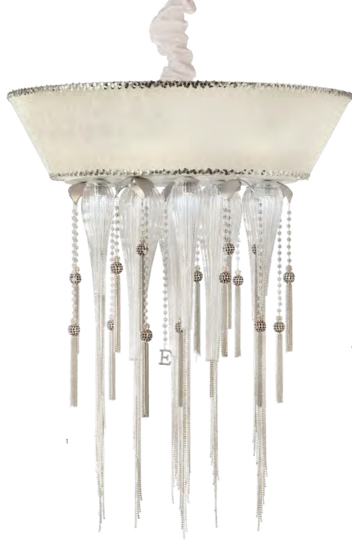
1 - 1134/17LA COLORE: LARISSA COD. 3984 CM. H. 100 x Ø 80 8 x G9 MAX 40 WATT + 9 LED 3 WATT PARALUME VELLUTO AVORIO INCLUSO** MARCHIO "E" IN CRYSTAL ROCK SWAROVSKI ELEMENTS®.