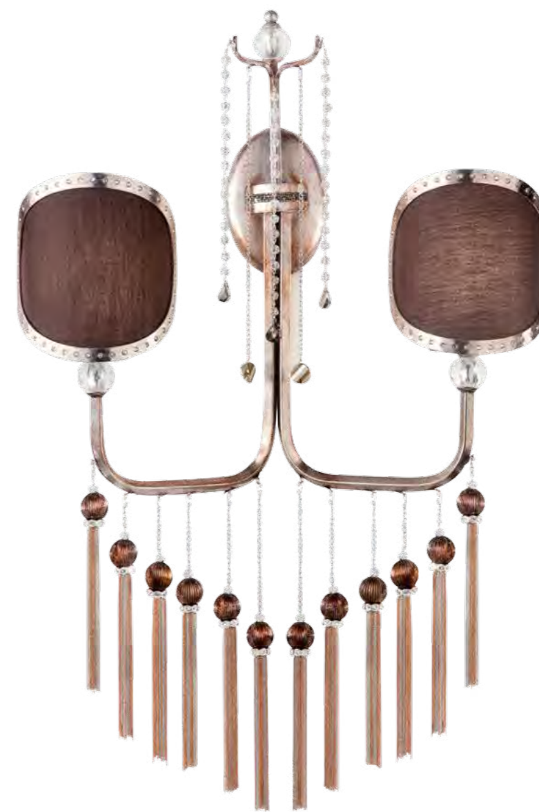
2487/02AP COLORE: ARGENTO VISONE COD. 3879 CM. H. 60 X L. 57 X P. 19 2 X E14 MAX 40 WATT PARALUMI METALLO CON CRISTALLI SWAROVSKI® TELETTA MARRONE INCLUSI**