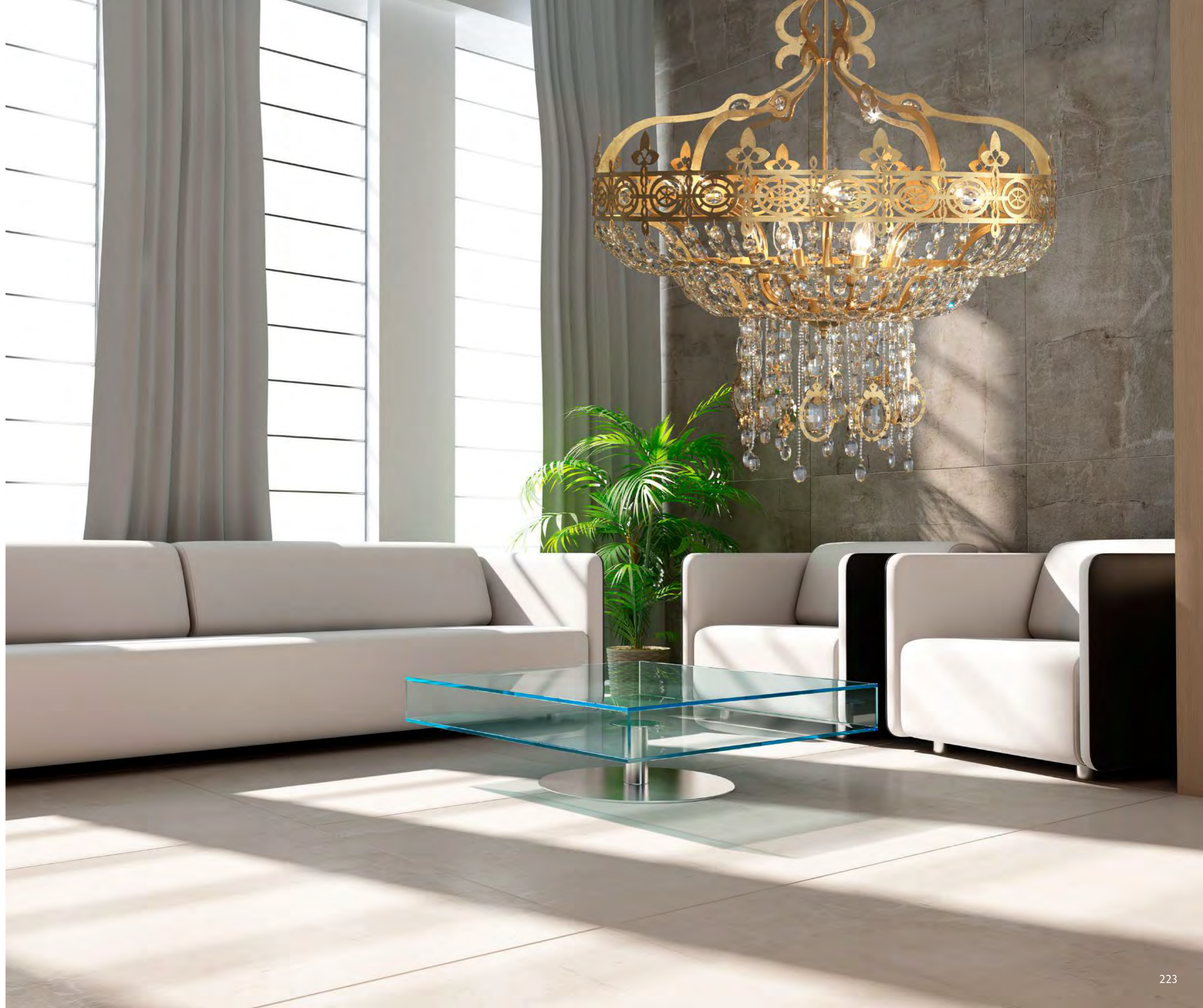
2438/04BA COLORE: ORO FOGLIA Cod. 3001 CM. H. 84 x Ø 30 4 x G9 MAX 40 WATT