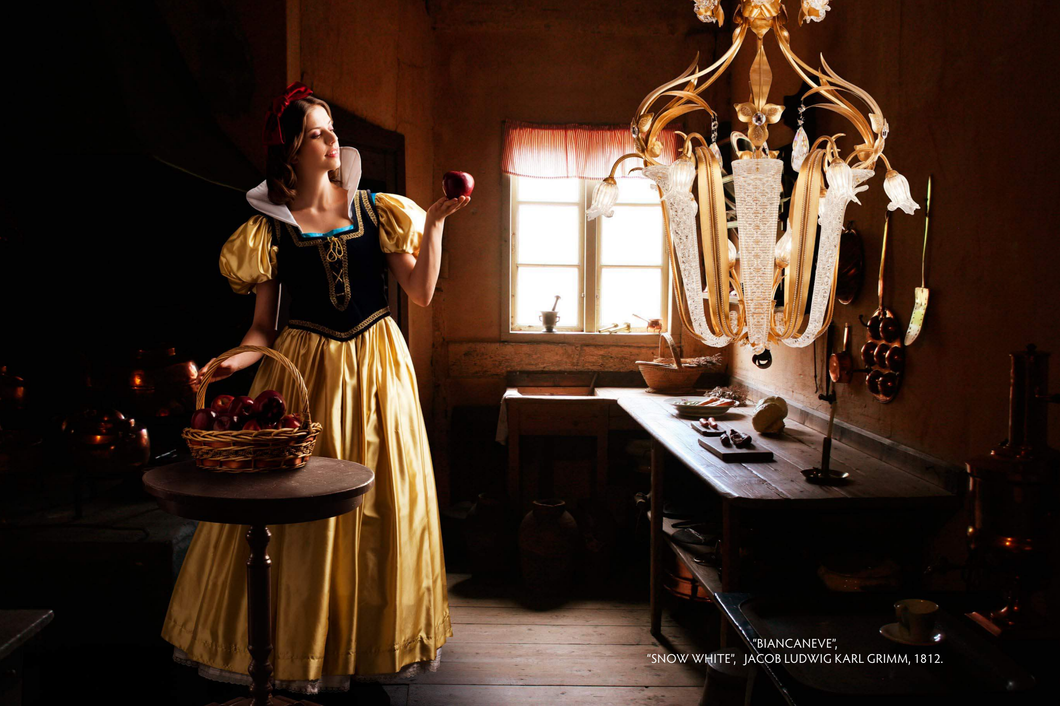
"BIANCANEVE", "SNOW WHITE", JACOB LUDWIG KARL GRIMM, 1812.