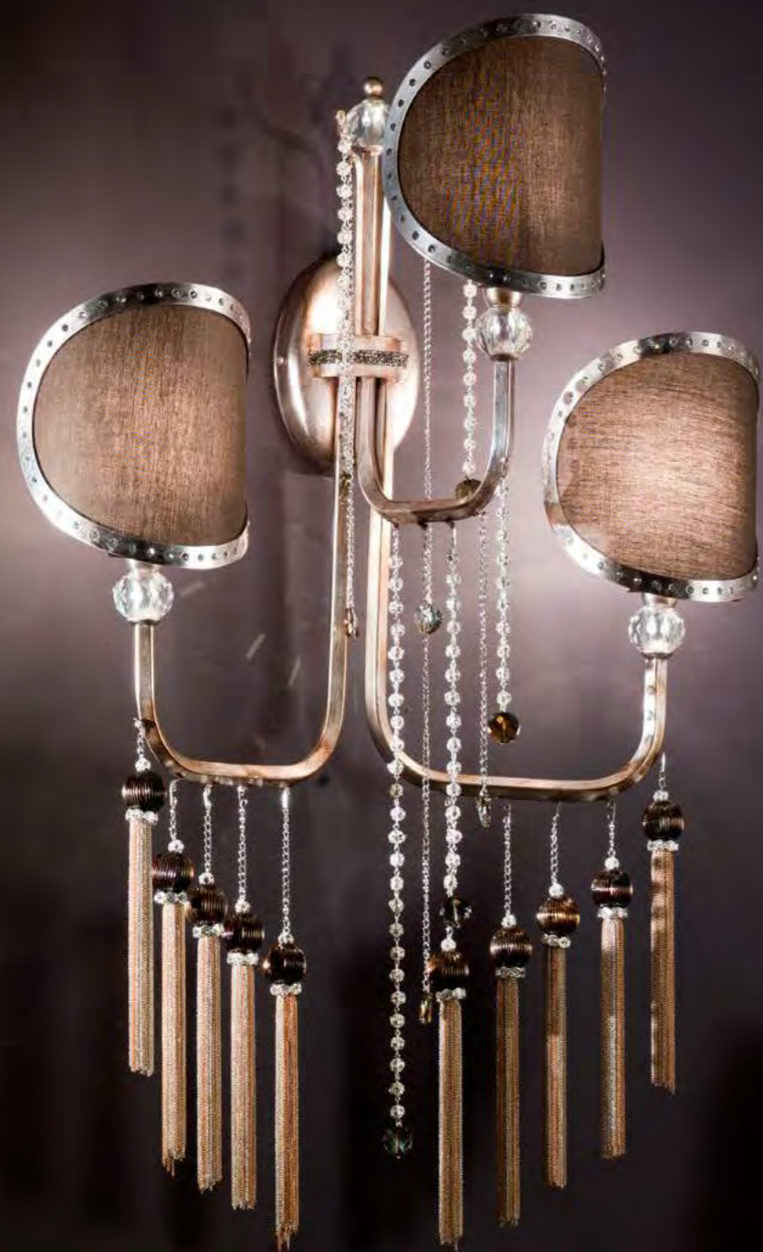
2487/03AP COLORE: ARGENTO VISONE COD. 3879 CM. H. 81 X L. 60 X P. 33 3 X E14 MAX 40 WATT PARALUMI METALLO CON CRISTALLI SWAROVSKI® TELETTA MARRONE INCLUSI**