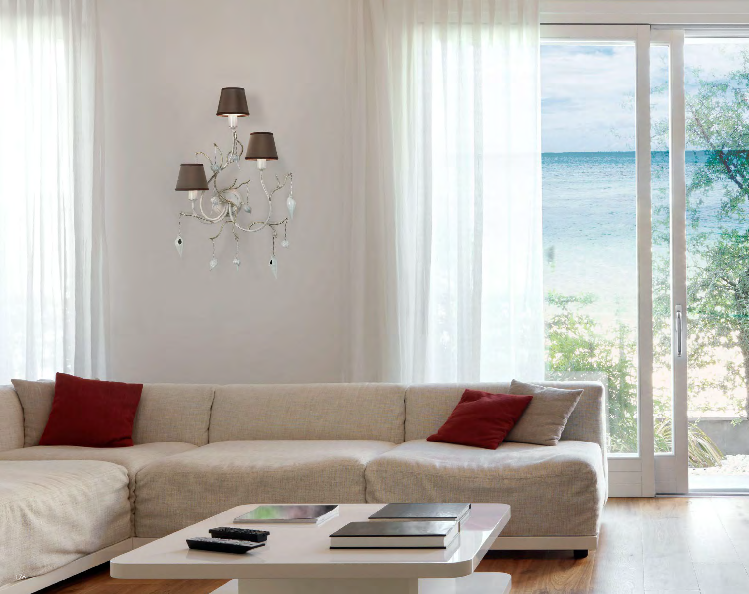
1139/03AP COLORE: LARISSA COD. 3984 CM. H. 65 X L. 47 X P. 15 3 x E14 MAX 40 WATT PARALUMI MICROFIBRA VISIONE SU RICHIESTA ART. 7457*