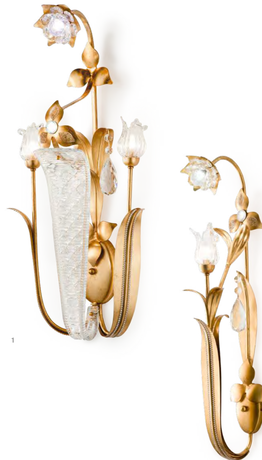
1 - 1288/03AP COLORE: ORO FOGLIA COD. 3001 CM. H. 77 x Ø L. 38 x P. 23 2 x G9 MAX 40 WATT + 1 LED 1,5 WATT VERSIONE SENZA LED ART. 1188/02AP