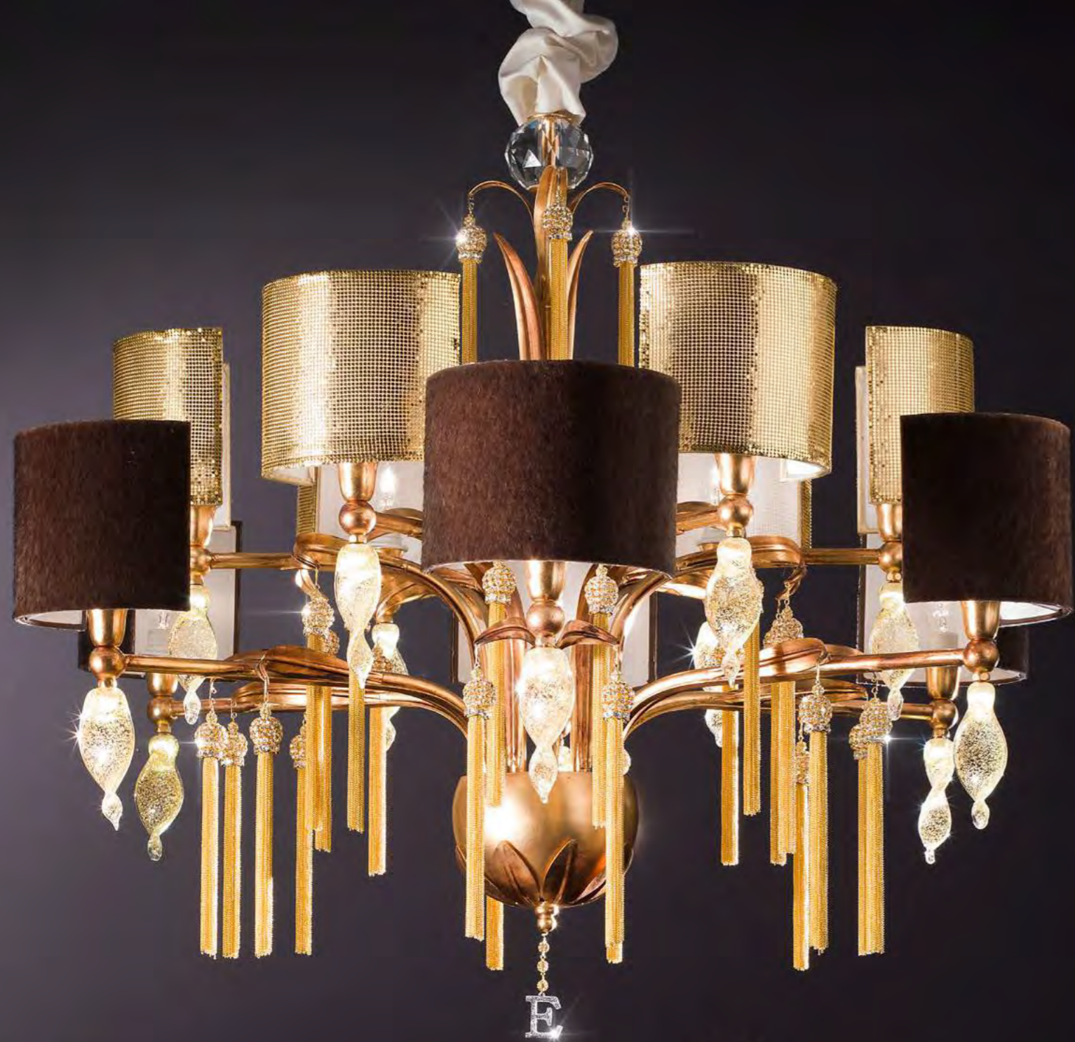
2642/24LA COLORE: ORO VISONE COD. 3883 CM. H. 90 x Ø 98 12 x E14 MAX 40 WATT + 12 LED 1,5 WATT PARALUMI ECOPELLICCIA MARRONE E RETE METALLICA ORO CON MARCHIO "E" IN SWAROVSKI INCLUSI**