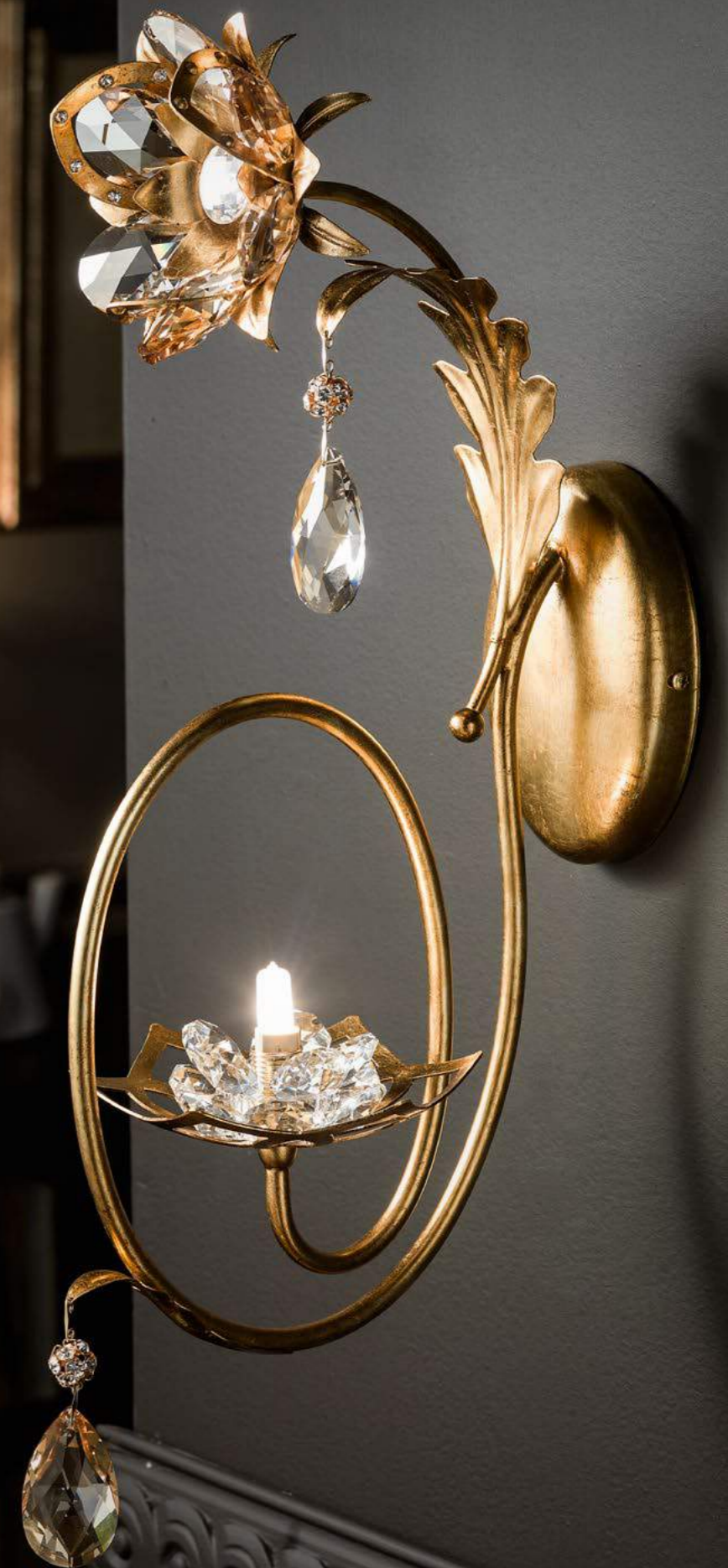
2460/01AP COLORE: ORO FOGLIA Cod. 3001 CM. H. 60 x L. 15 x P. 26 1 x G9 Max 40 WATT CRISTALLI SWAROVSKI®