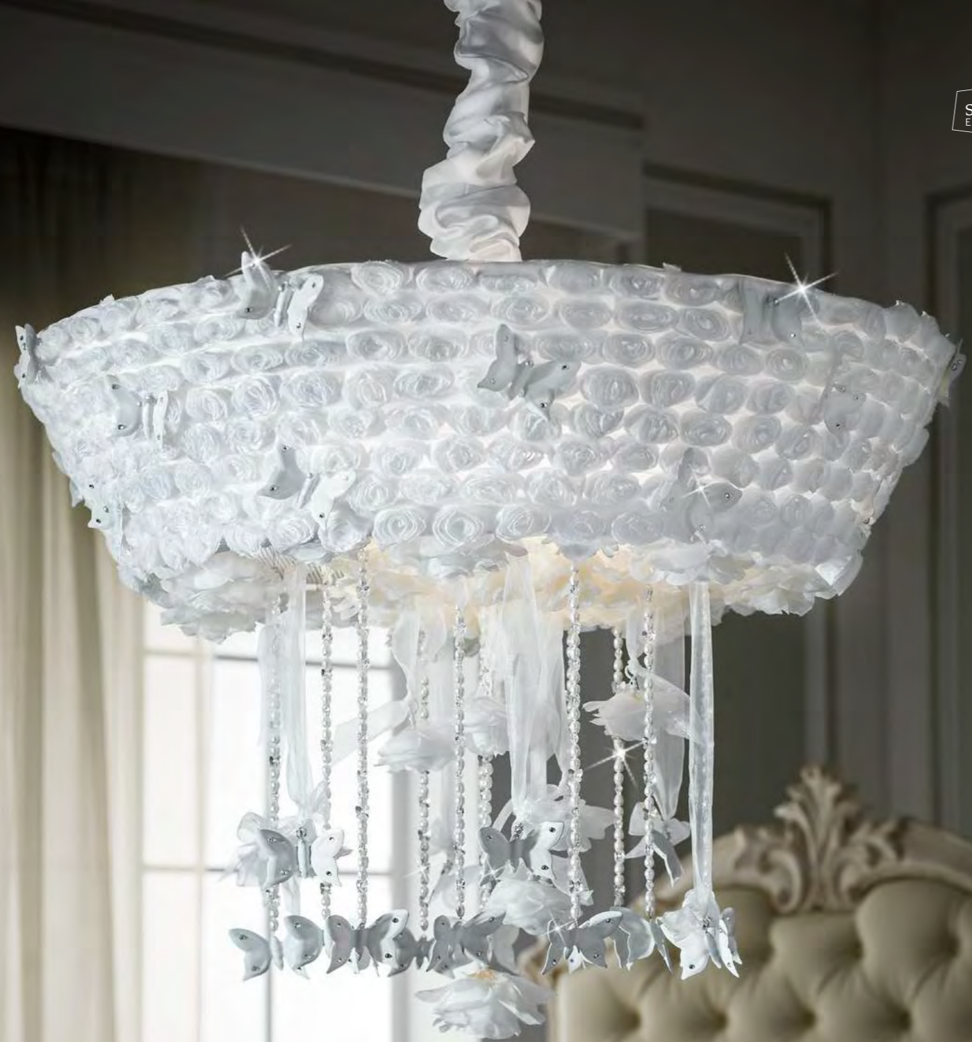
2641/12LA COLORE: BIANCO BRILLANTE COD. 3206 CM. H. 60 x Ø 81 12 x G9 MAX 40 WATT CRISTALLI SWAROVSKI® PARALUME ROSE INCLUSO**