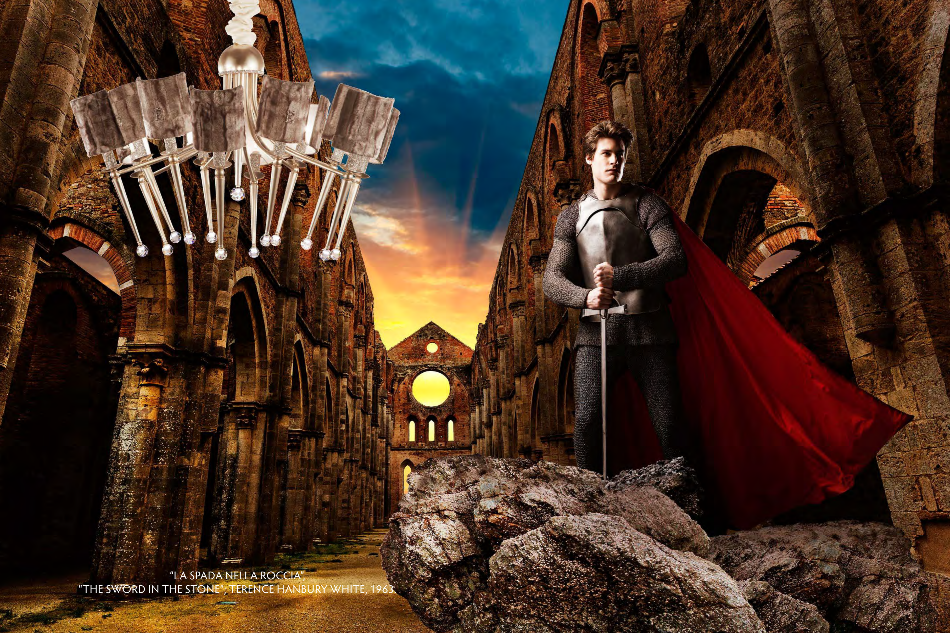
"LA SPADA NELLA ROCCIA", "THE SWORD IN THE STONE"; TERENCE HANBURY WHITE, 1963.