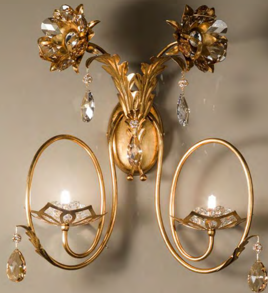
2460/02AP COLORE: ORO FOGLIA Cod. 3001 CM. H. 60 x L. 46 x P. 23 2 x G9 Max 40 WATT CRISTALLI SWAROVSKI®