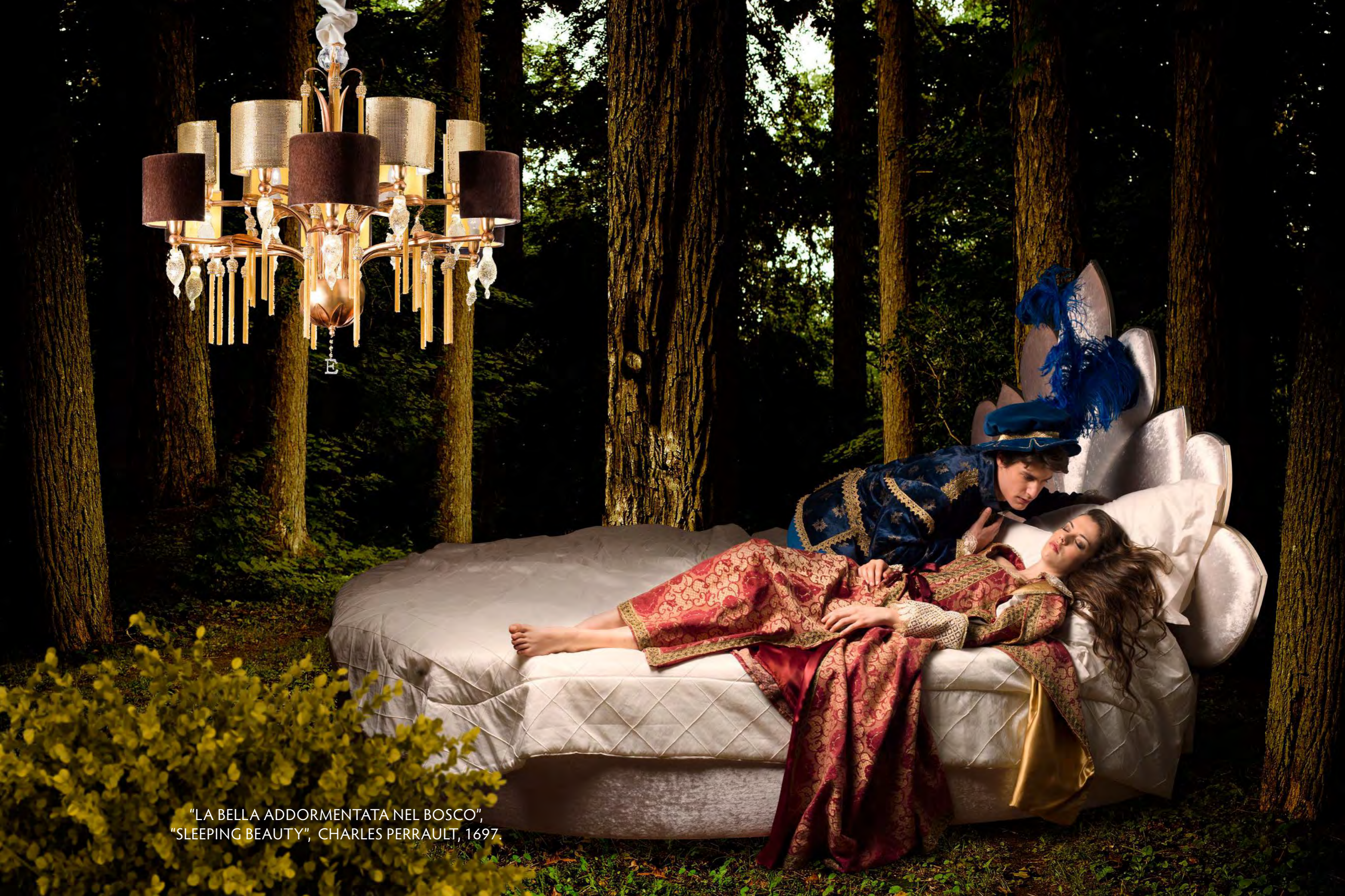
"LA BELLA ADDORMENTATA NEL BOSCO", "SLEEPING BEAUTY", CHARLES PERRAULT, 1697.