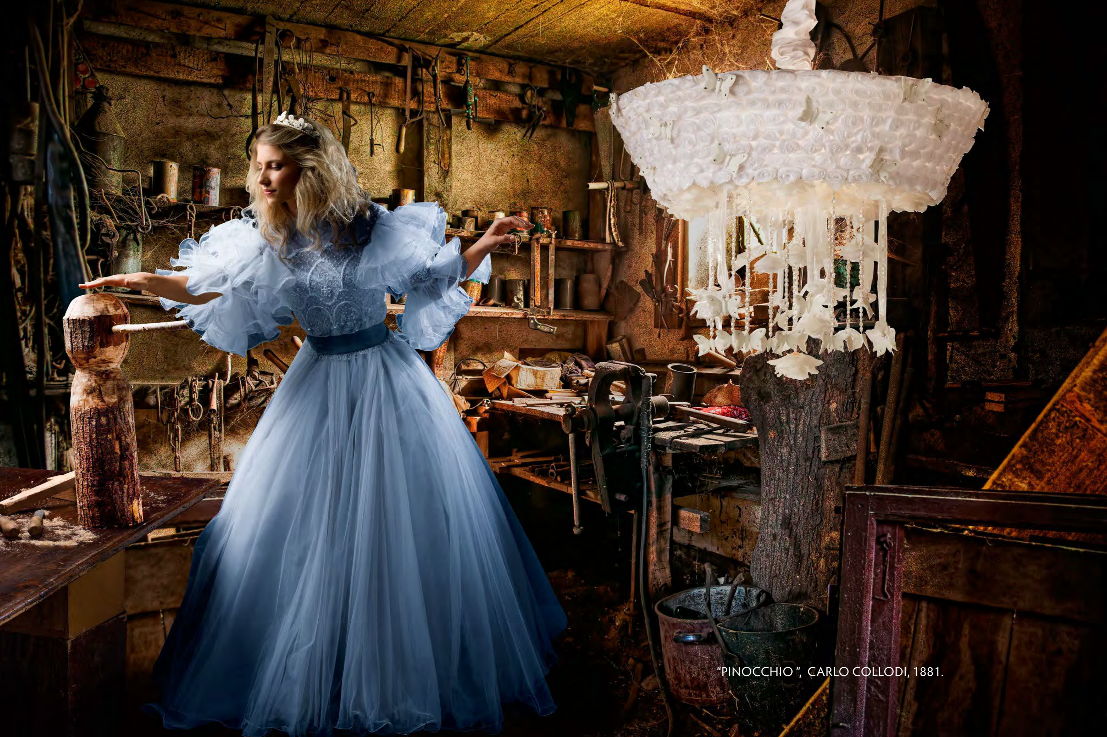
"PINOCCHIO", CARLO COLLODI, 1881.