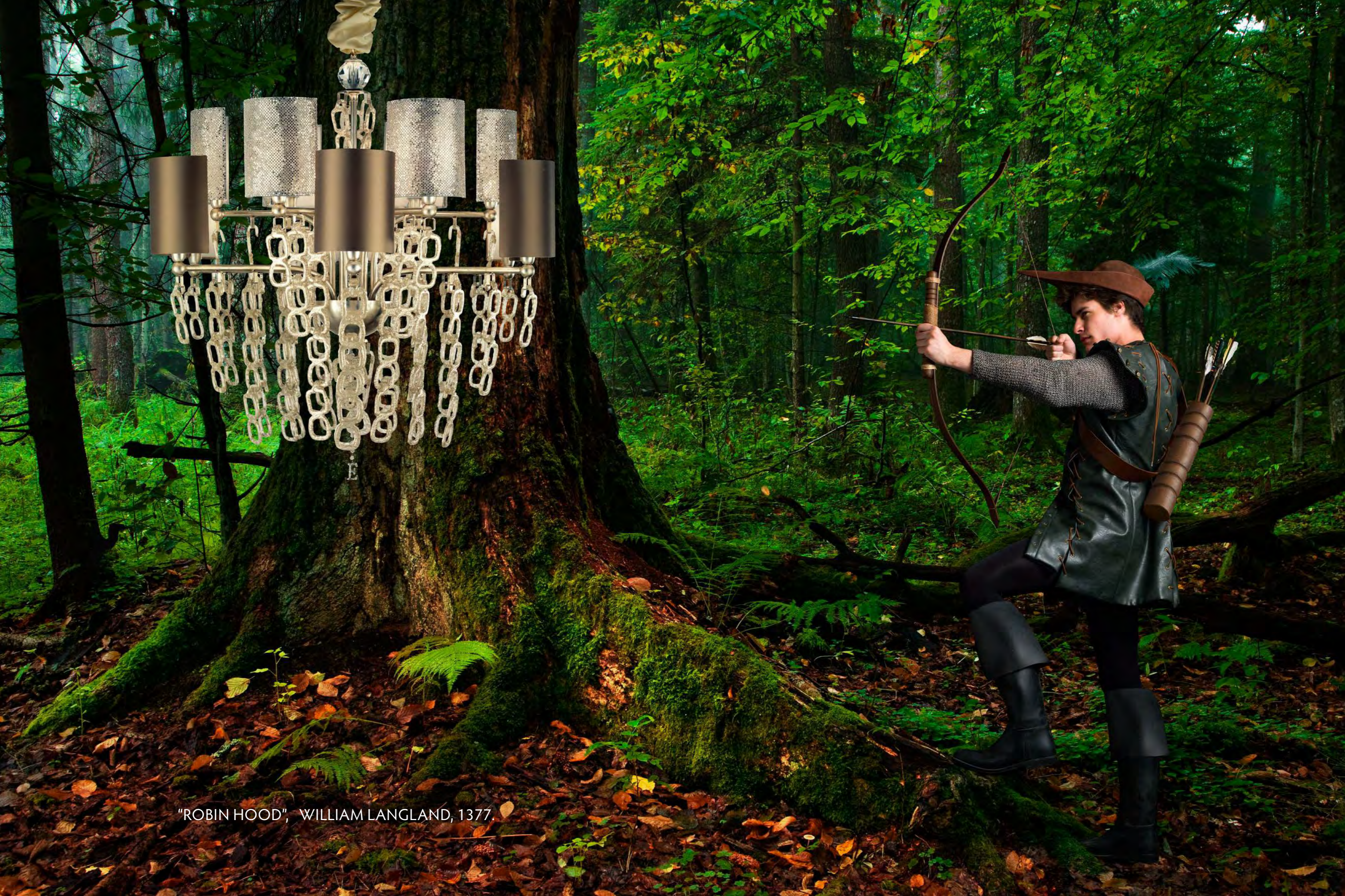
"ROBIN HOOD", WILLIAM LANGLAND, 1377.