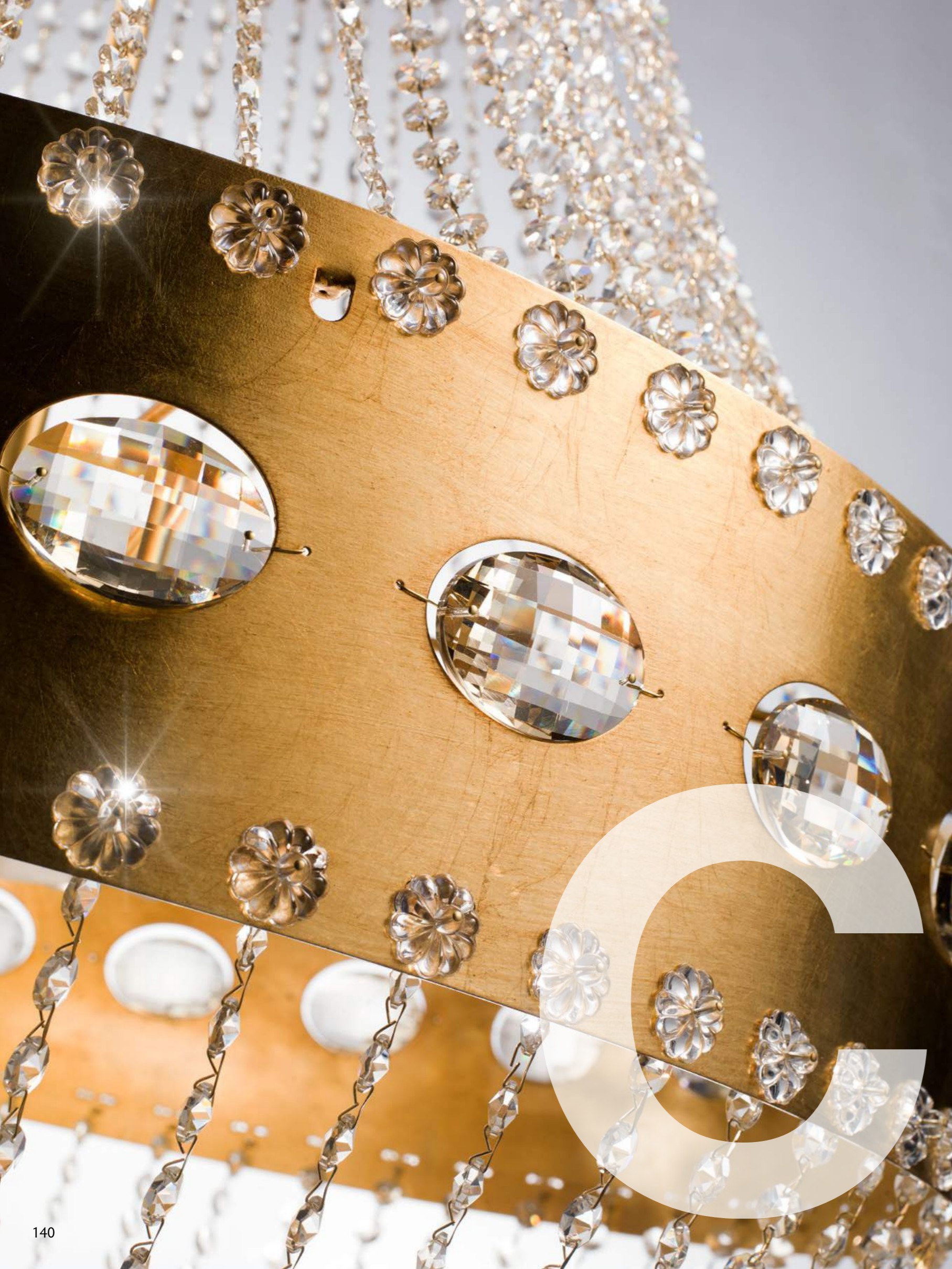
1235/18LA COLORE: ORO FOGLIA COD. 3001 CM. H. 118 x Ø 90 18 x G9 MAX 40 WATT