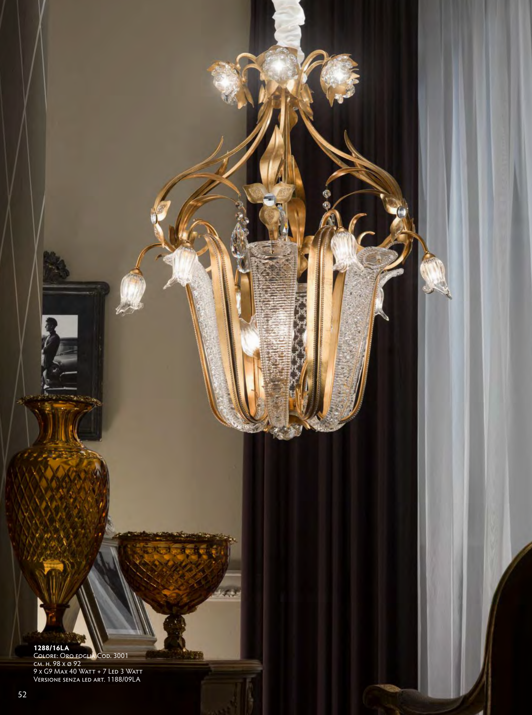
1288/16LA COLORE: ORO FOGLIA COD. 3001 CM. H. 98 x Ø 92 9 x G9 MAX 40 WATT + 7 LED 3 WATT VERSIONE SENZA LED ART. 1188/09LA