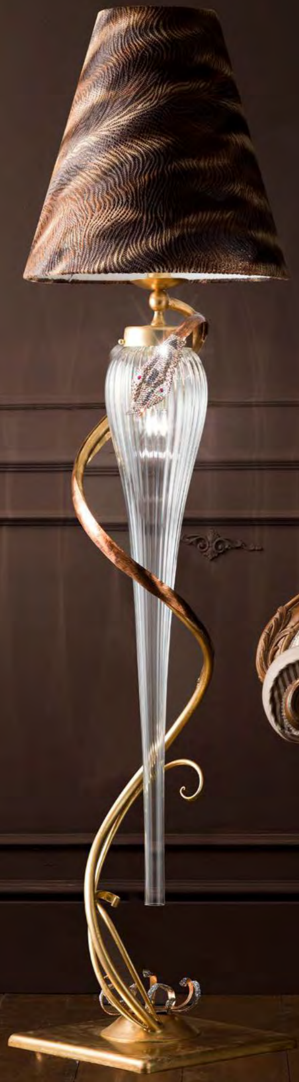
2648/02TO COLORE: ORO VISONE COD. 3883 CM. H. 180 x Ø 50 2 x E27 MAX 40 WATT CRISTALLI SWAROVSKI® PARALUME PYTON MARRONE INCLUSO**