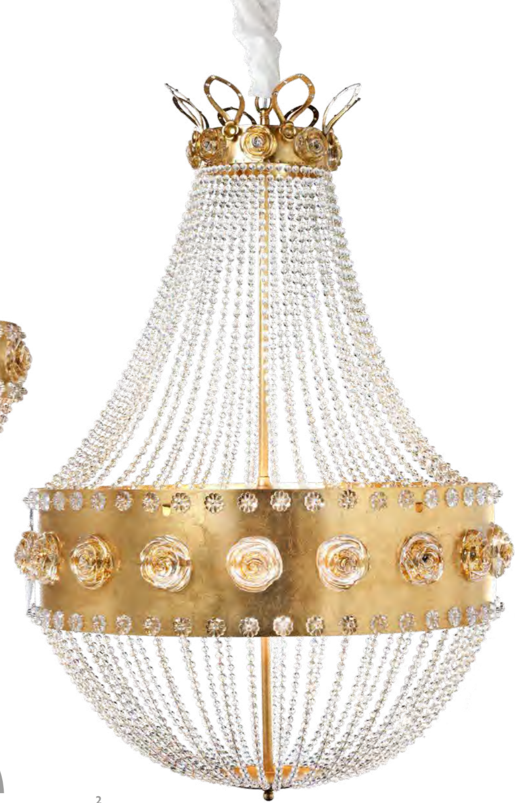
2 - 1136/18LA COLORE: ORO FOGLIA COD. 3001 CM. H. 100 x Ø 66 18 x G9 Max 40 WATT