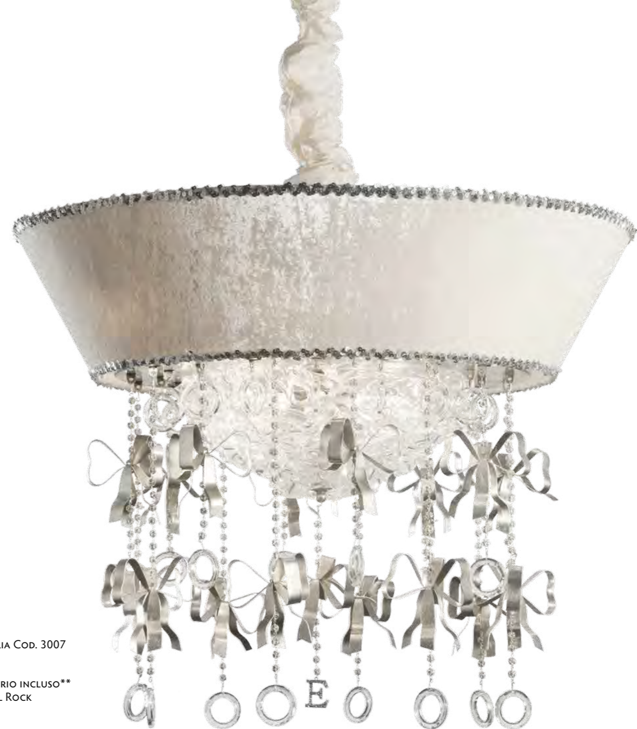
2645/20LA COLORE: ARGENTO FOGLIA COD. 3007 CM. H. 65 x Ø 80 20 x G9 MAX 40 WATT PARALUME VELLUTO AVORIO INCLUSO** MARCHIO "E" IN CRYSTAL ROCK SWAROVSKI ELEMENTS®.