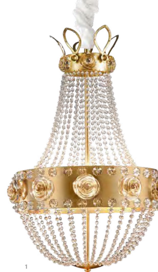
1 - 1136/10LA COLORE: ORO FOGLIA COD. 3001 CM. H. 71 x Ø 47 10 x G9 Max 40 WATT