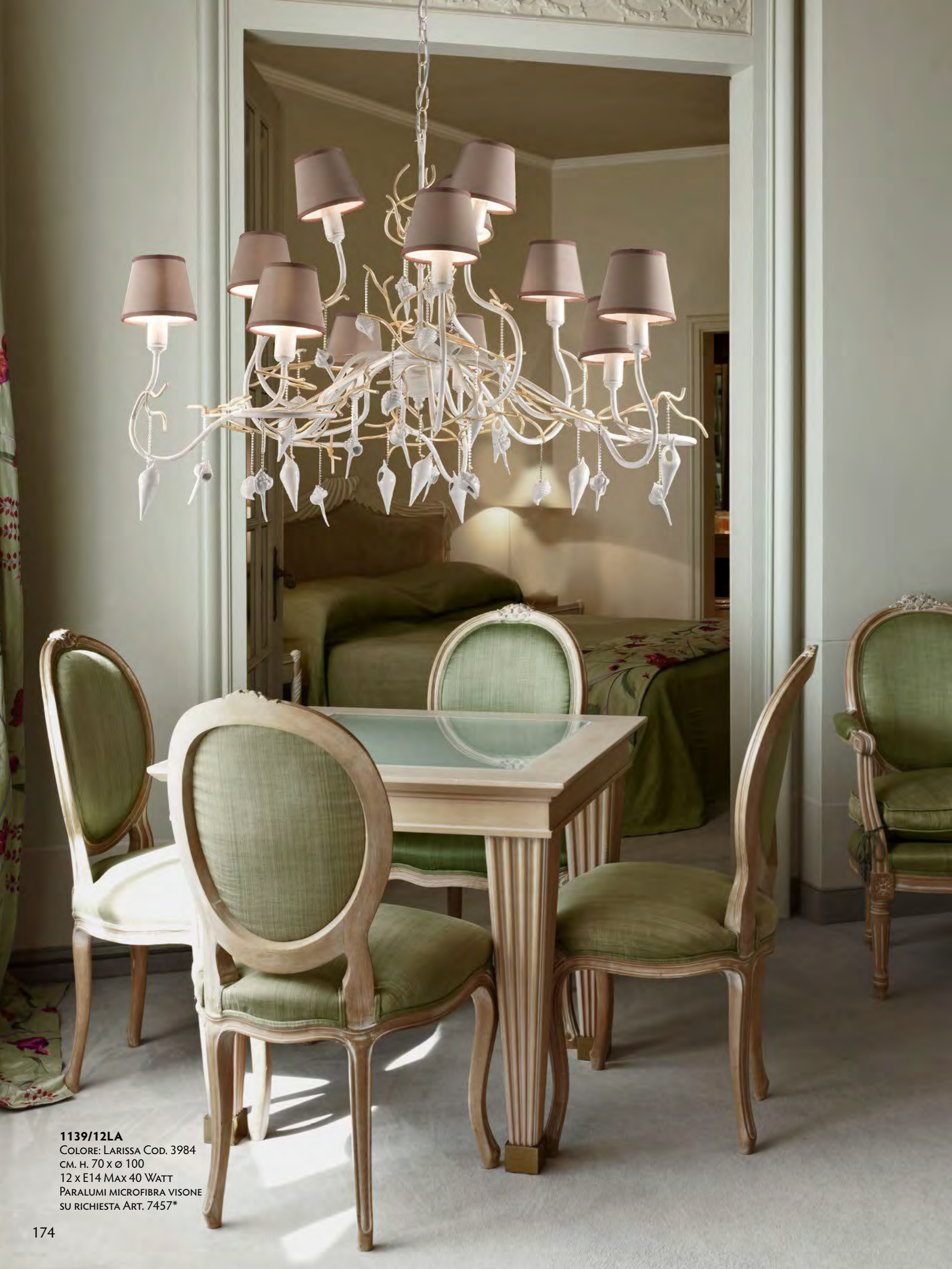
1139/12LA COLORE: LARISSA COD. 3984 CM. H. 70 x Ø 100 12 x E14 MAX 40 WATT PARALUMI MICROFIBRA VISONE SU RICHIESTA ART. 7457*