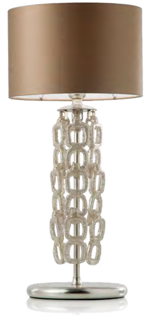
2943/01BA COLORE: ORO FOGLIA COD. 3007 CM. H. 68 X Ø 31 1 X E27 MAX 40 WATT PARALUME RASO TORTORA INCLUSO**