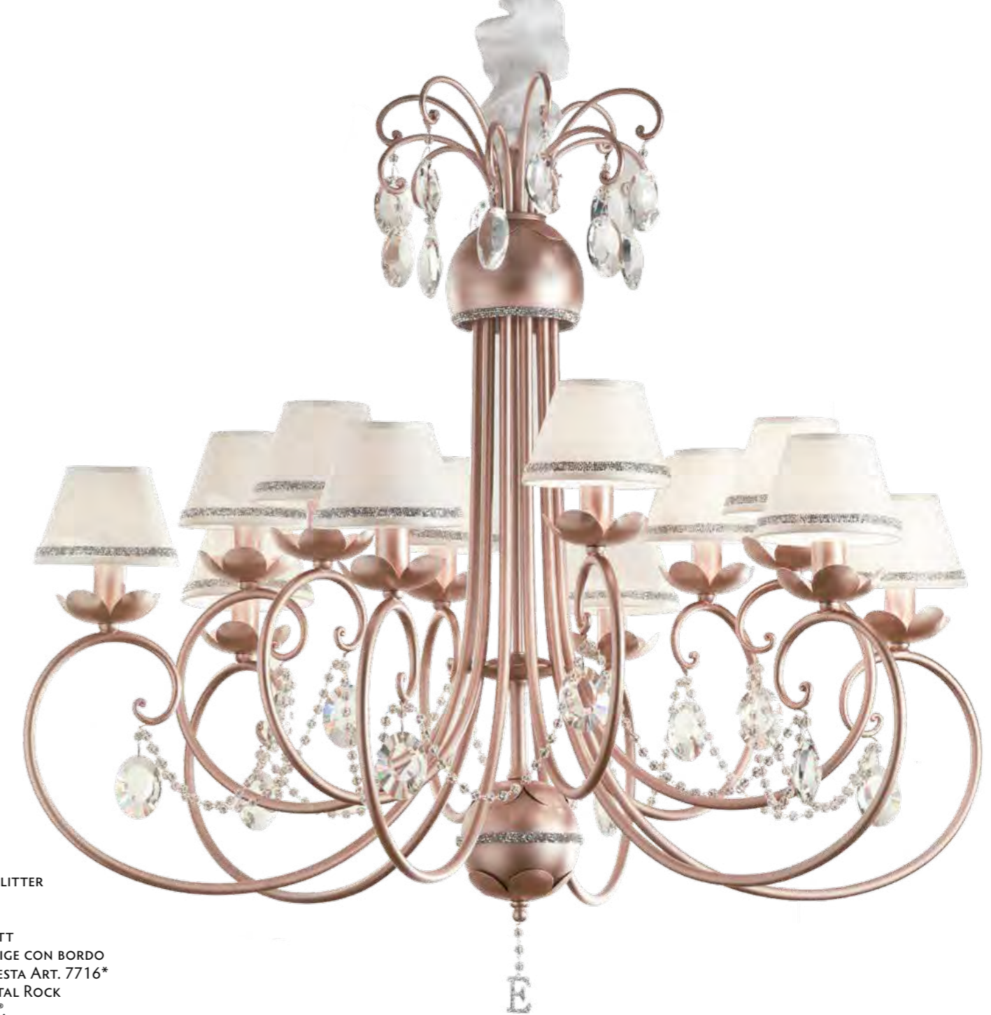
2647/12LA COLORE: ORO ROSA GLITTER COD. 3886 CM. H. 95 x Ø 102 12 x E14 MAX 40 WATT PARALUME TELETTA BEIGE CON BORDO SWAROVSKI® SU RICHIESTA ART. 7716* MARCHIO "E" IN CRYSTAL ROCK SWAROVSKI ELEMENTS®.