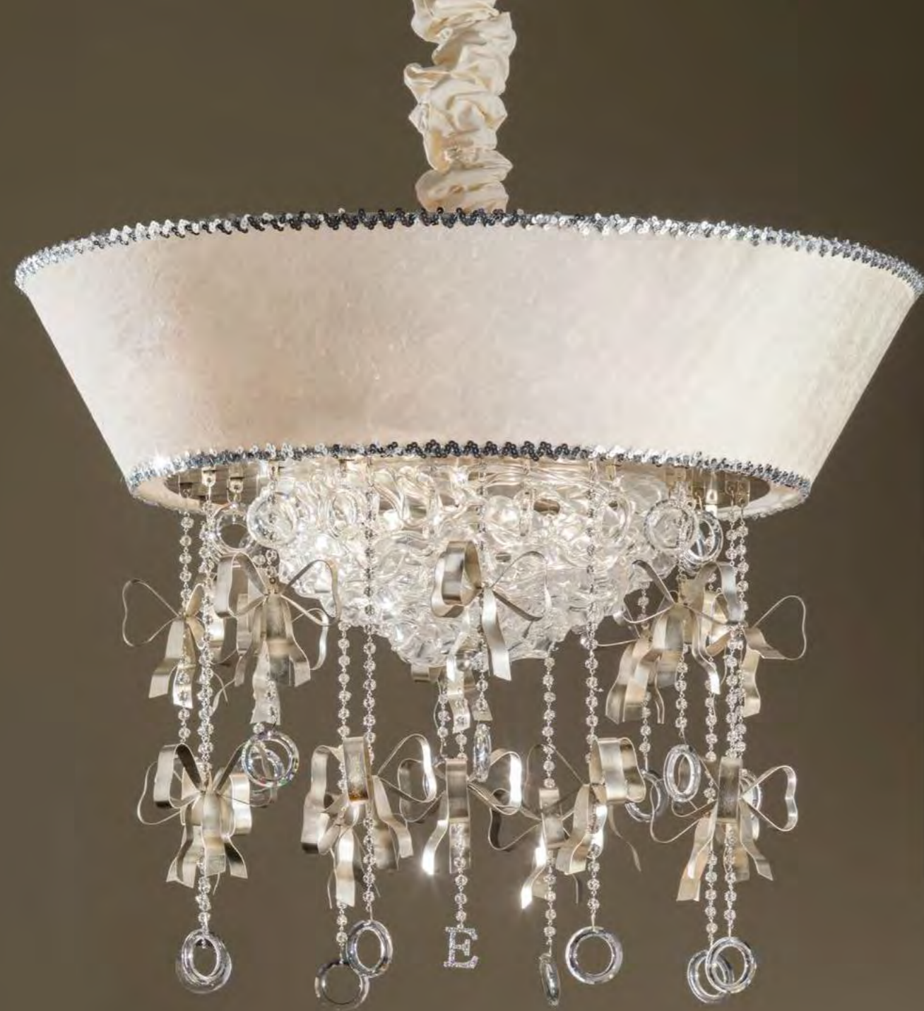
2645/20LA COLORE: ARGENTO FOGLIA COD. 3007 CM. H. 65 x Ø 80 20 x G9 MAX 40 WATT PARALUME VELLUTO AVORIO INCLUSO** MARCHIO "E" IN CRYSTAL ROCK SWAROVSKI ELEMENTS®.