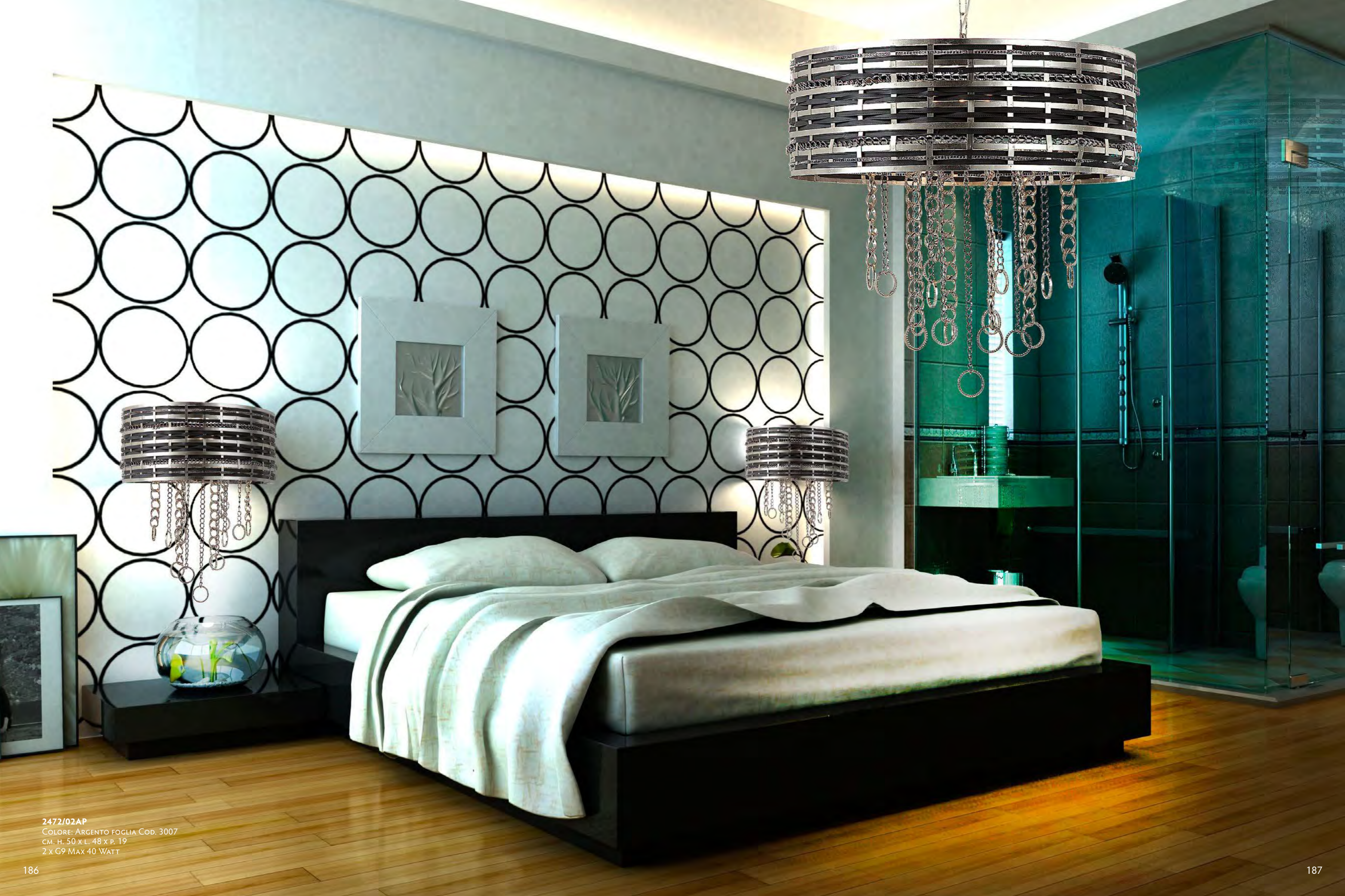
2472/02AP COLORE: ARGENTO FOGLIA COD. 3007 CM. H. 50 x L. 48 x P. 19 2 x G9 MAX 40 WATT