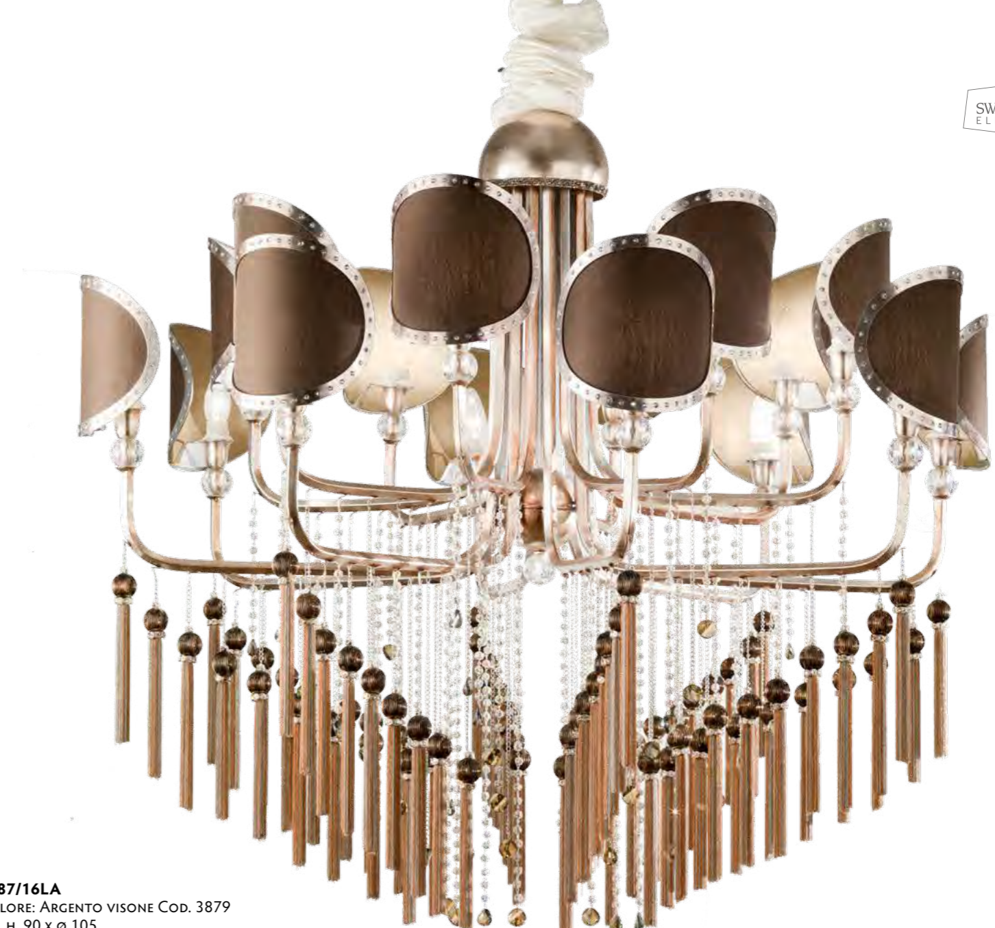
2487/16LA COLORE: ARGENTO VISONE COD. 3879 CM. H. 90 x Ø 105 16 x E14 MAX 40 WATT PARALUMI METALLO CON CRISTALLI SWAROVSKI® TELETTA MARRONE INCLUSI**