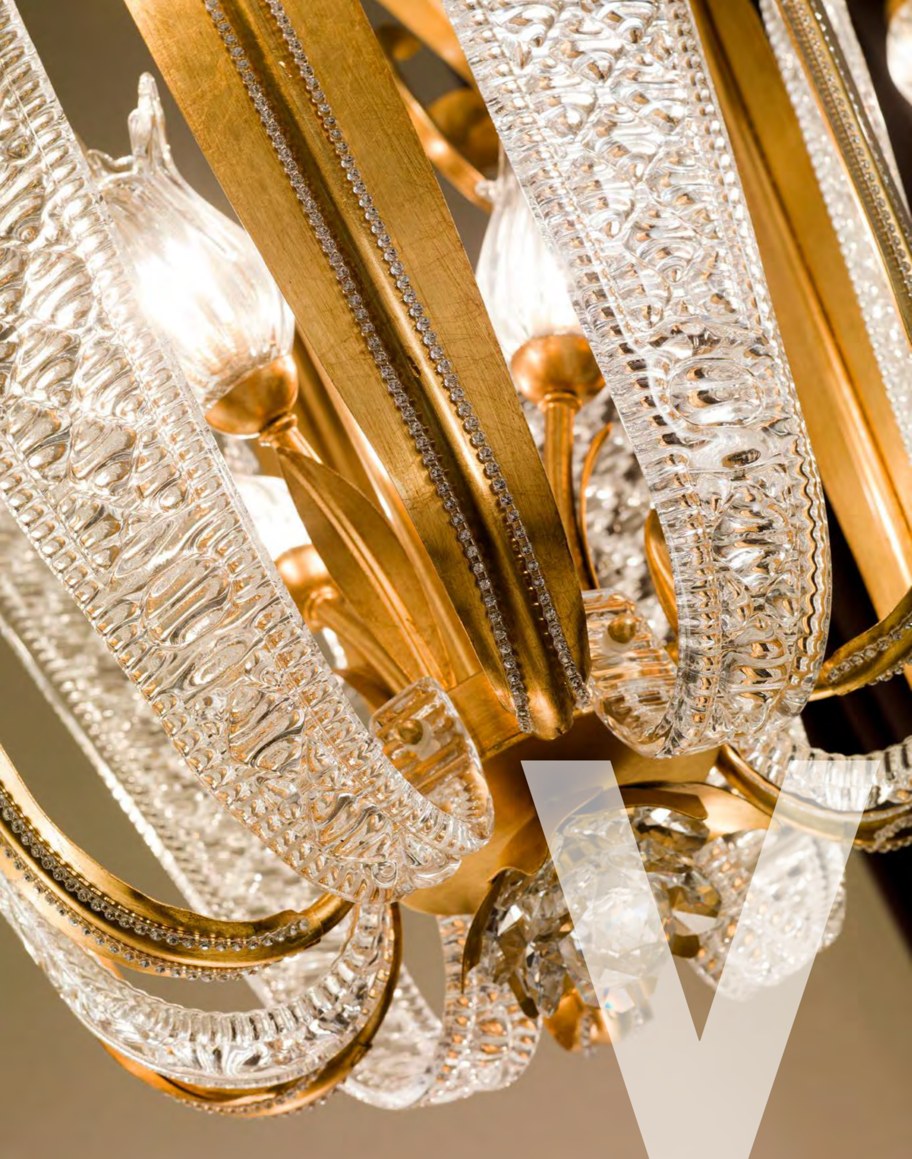
1288/16LA COLORE: ORO FOGLIA Cod. 3001 CM. H. 98 x Ø 92 9 x G9 MAX 40 WATT + 7 LED 1,5 WATT VERSIONE SENZA LED ART. 1188/09LA