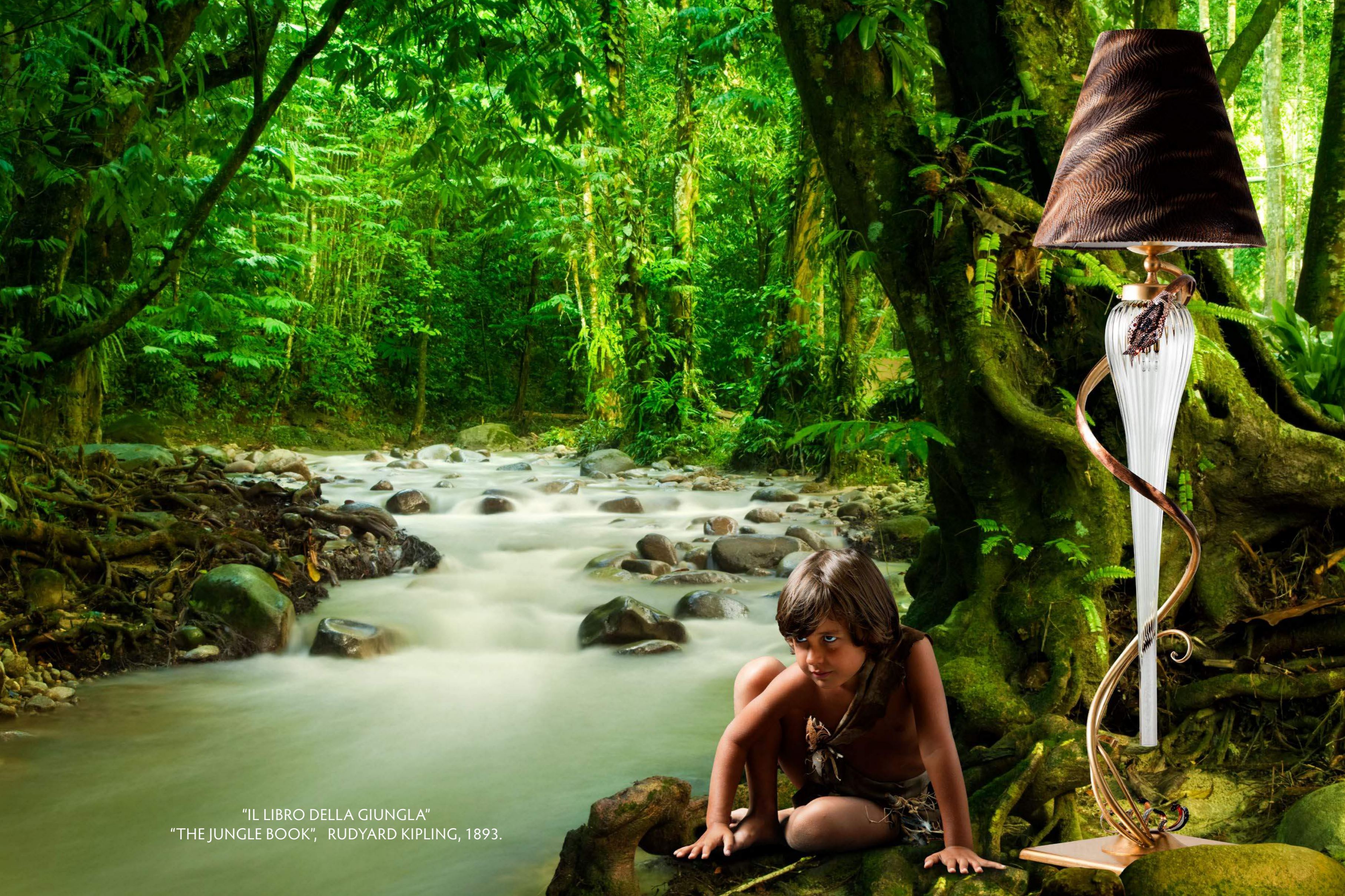
"IL LIBRO DELLA GIUNGLA" "THE JUNGLE BOOK", RUDYARD KIPLING, 1893.