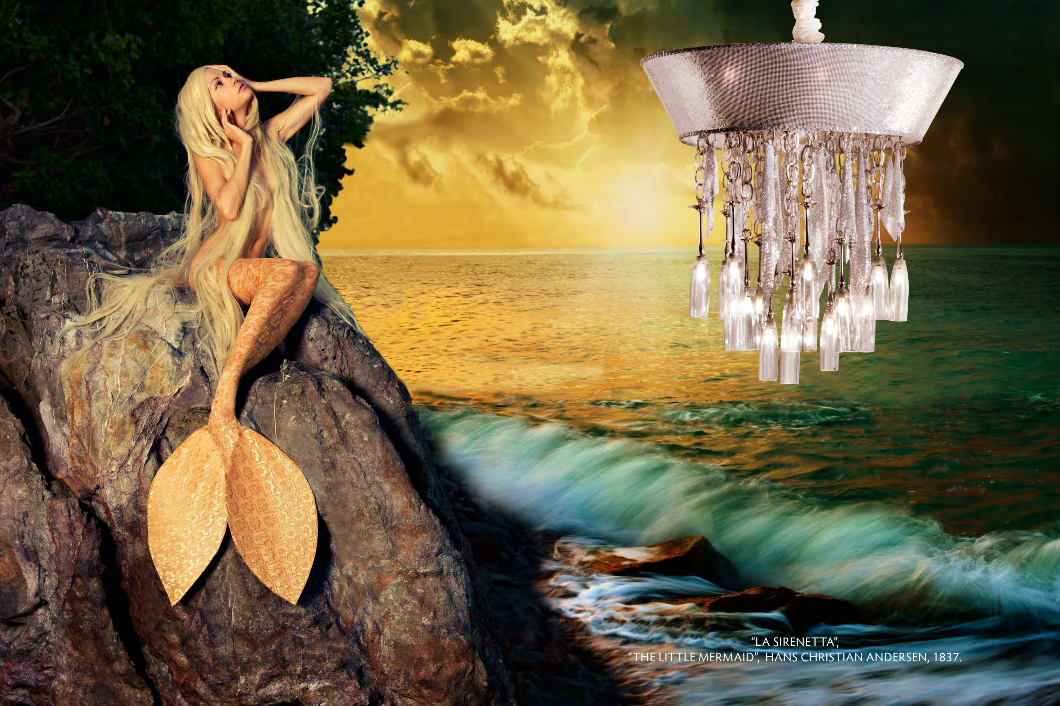
"LA SIRENETTA", "THE LITTLE MERMAID", HANS CHRISTIAN ANDERSEN, 1837.