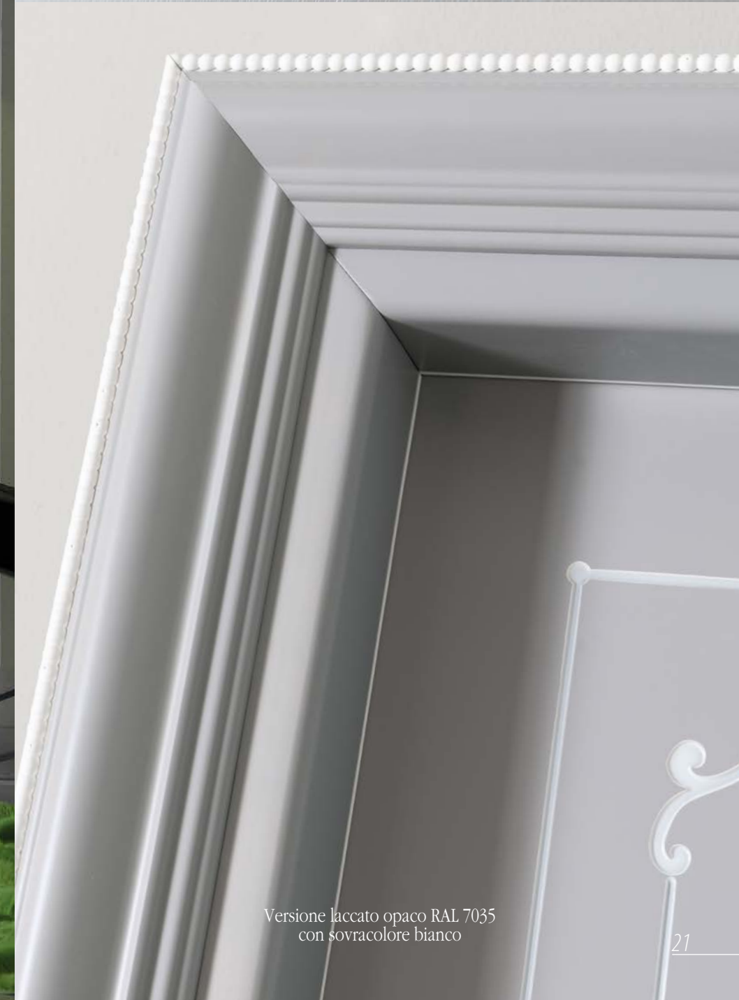
Versione laccato opaco RAL 7035 con sovracoloro bianco