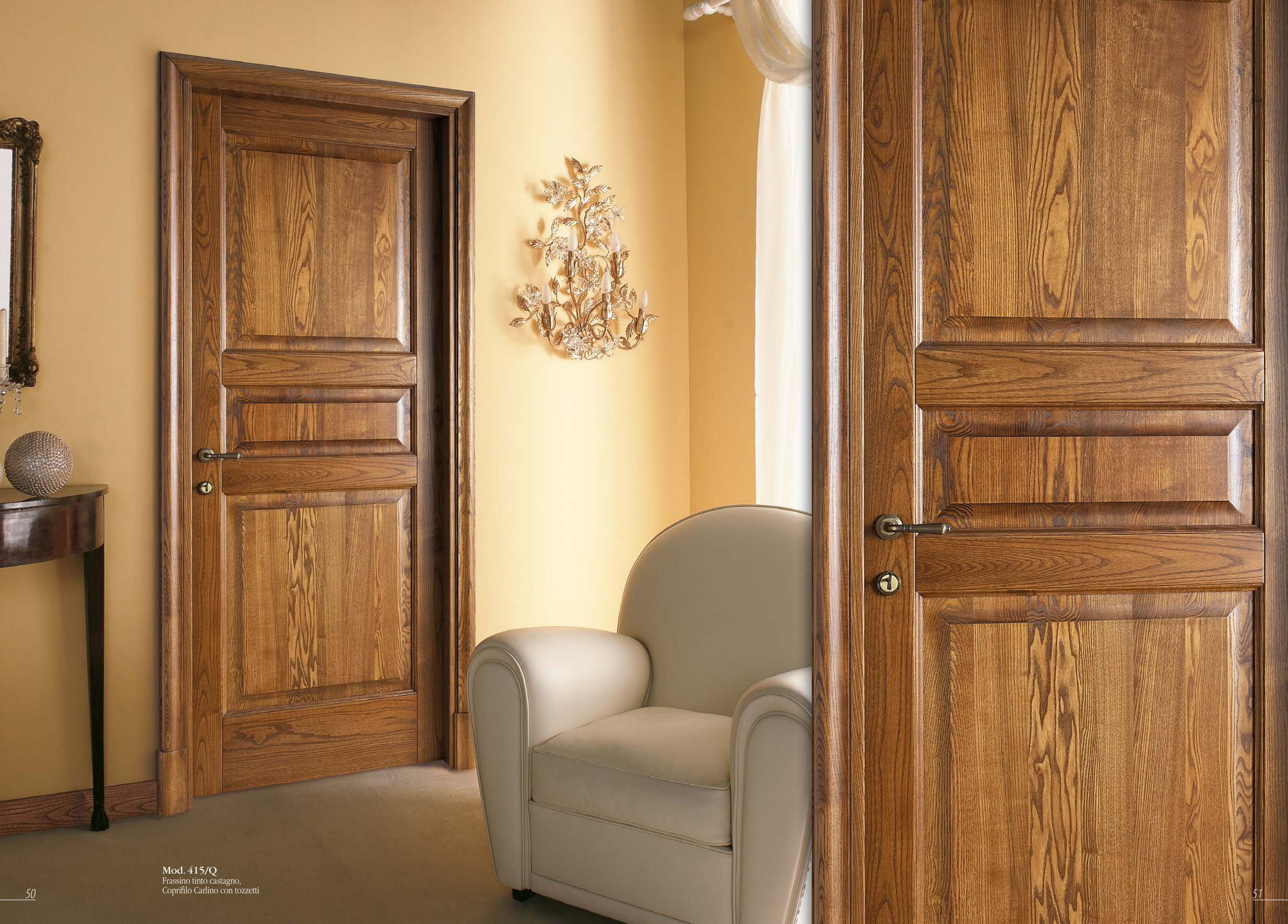
Mod. 415/Q Frassino tinto castagno, Coprifilo Carlino con tozzetti