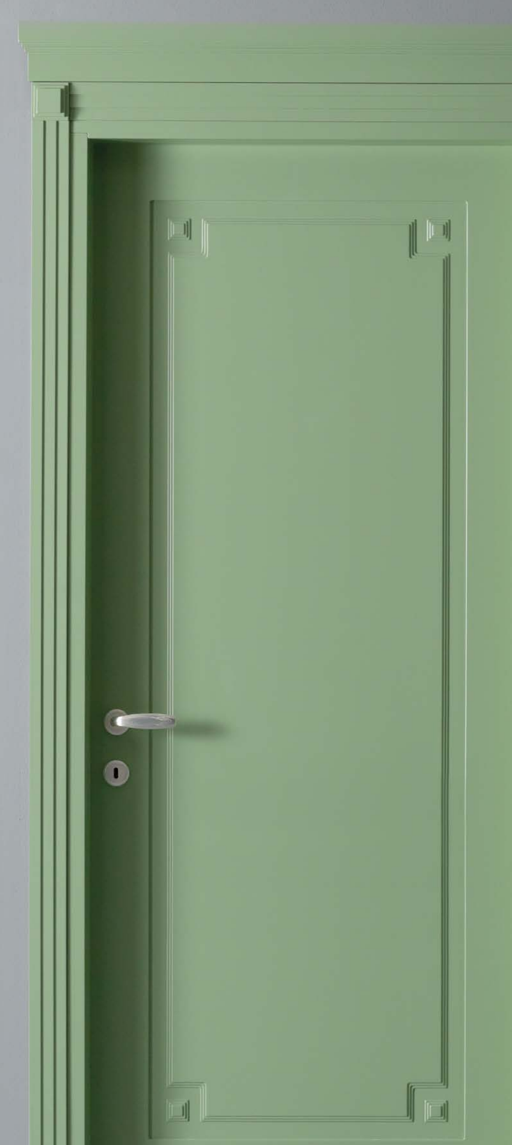
Mod. TWIST 771/00/M pantografatura M Con piramidi 2 lati, Telaio FLB, coprifilo 3S con piramidi, tozzetti e cimasa 3S, laccato opaco RAL 6021