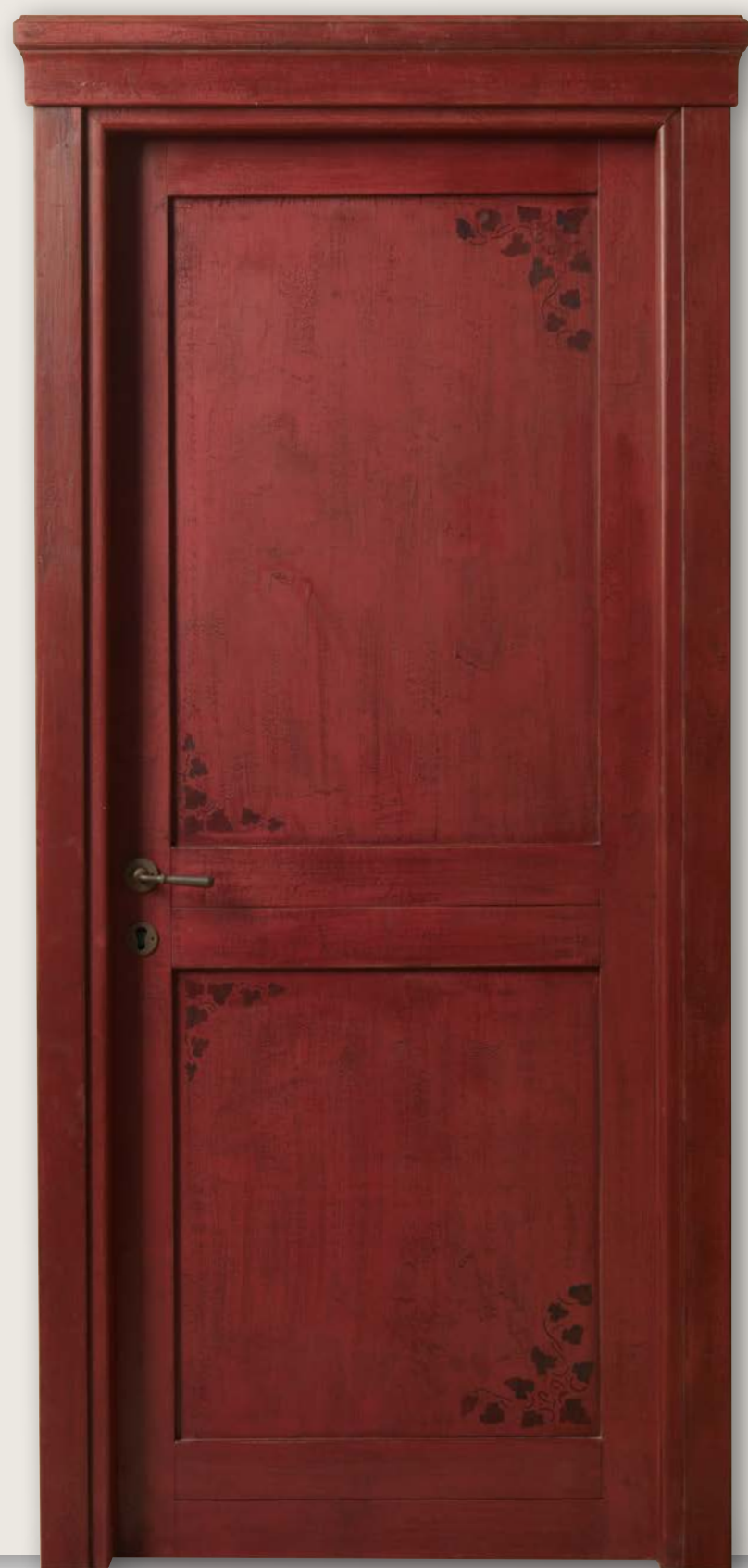
Mod. D.R.VELASQUEZ 304/2 Finitura Old Style rosso decoro Edera CF. 8/7 - cimasa Lory