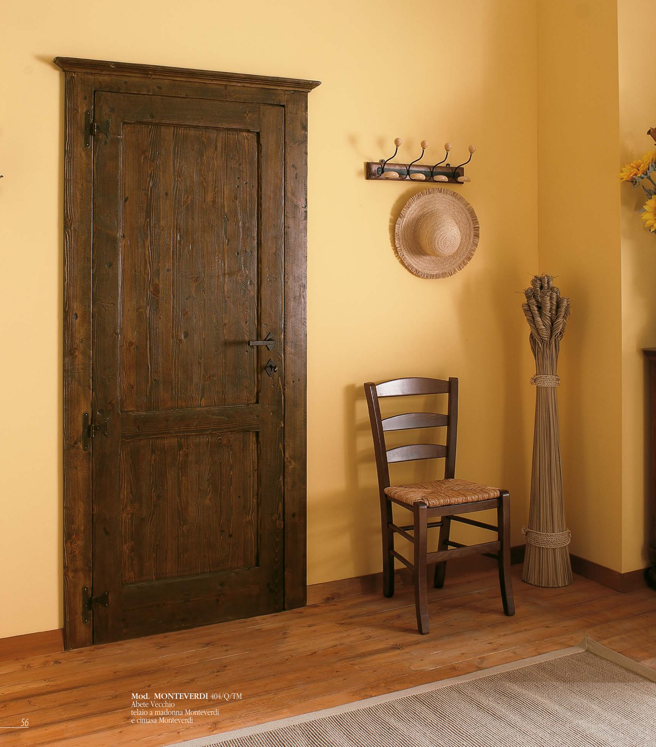
Mod. MONTEVERDI 404/Q/TM Abete Vecchio telaio a madonna Monteverdi e cimasa Monteverdi