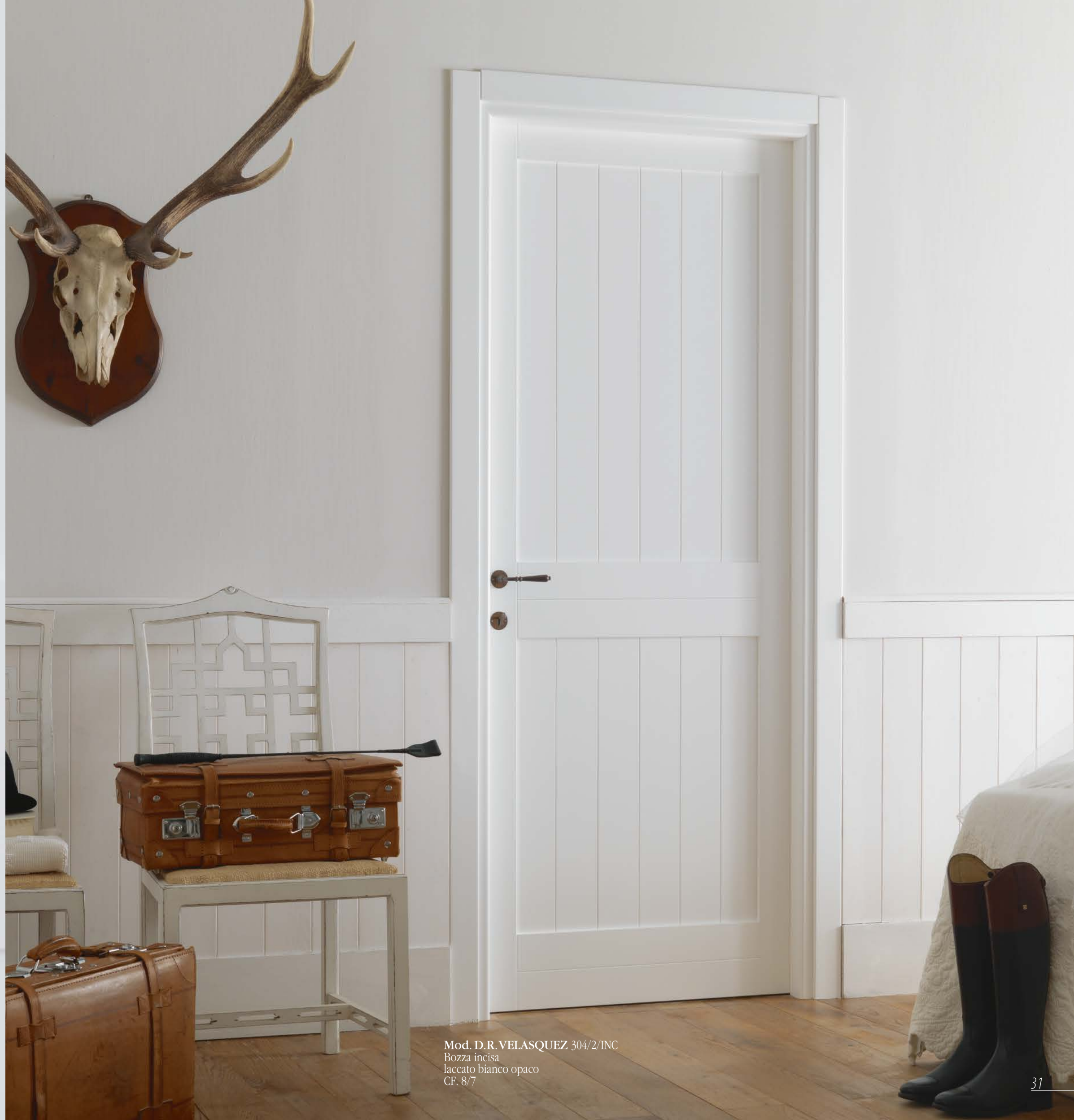
Mod. D.R. VELASQUEZ 304/2/INC Bozza incisa laccato bianco opaco CF. 8/7