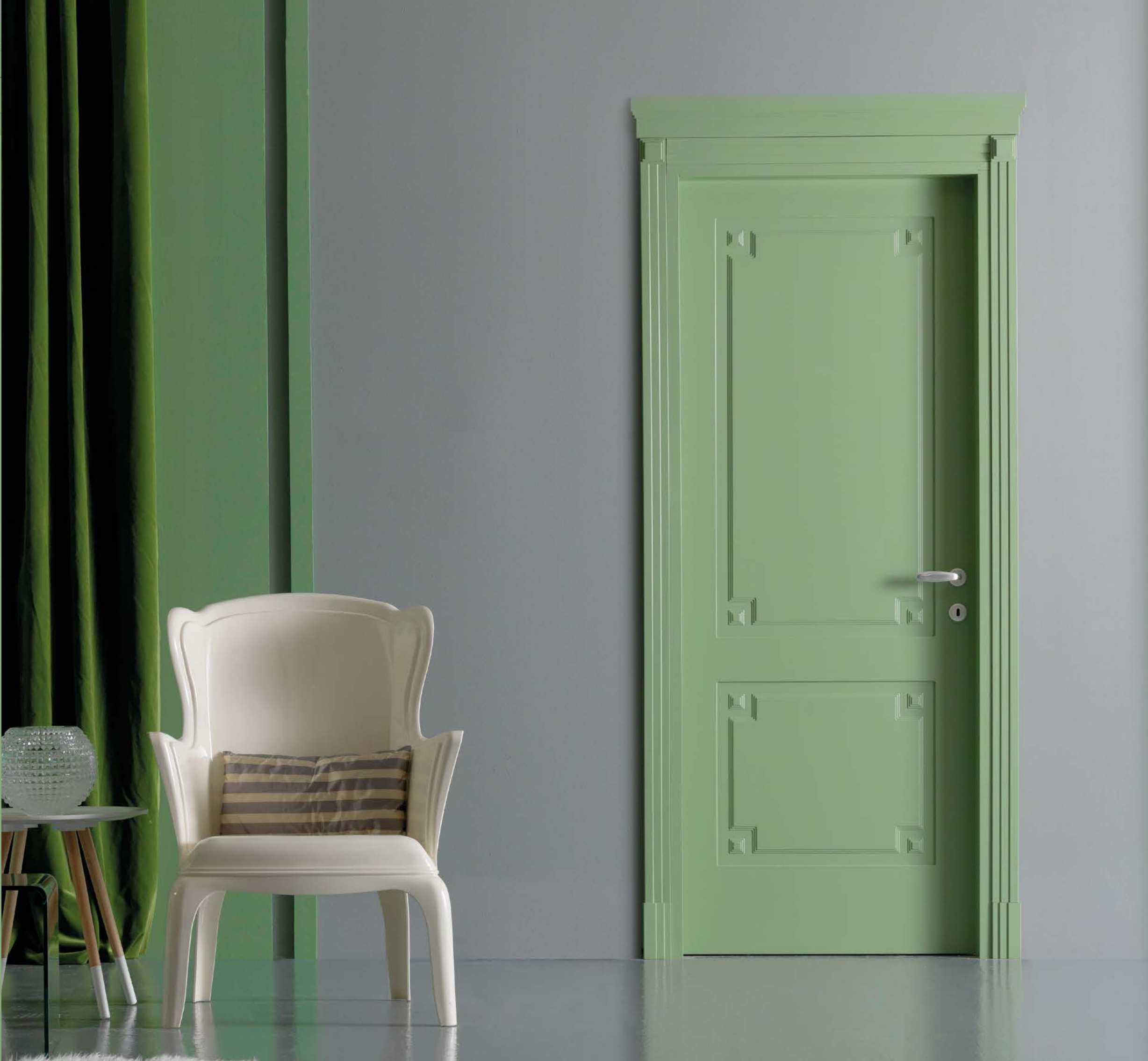
Mod. TWIST 772/00/M pantografatura M Con piramidi 2 lati, Telaio FLB, coprifilo 3S con piramidi, tozzetti e cimasa 3S, laccato opaco RAL 6021