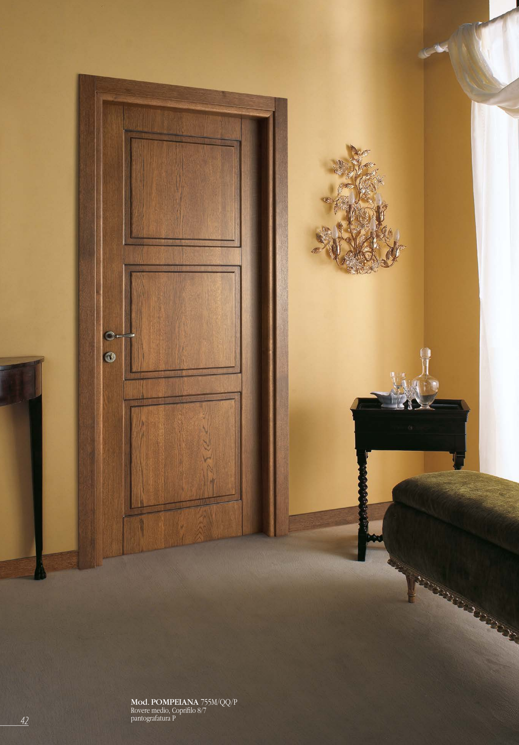
Mod. POMPEIANA 755M/QQ/P Rovere medio, Coprifilo 8/7 pantografatura P