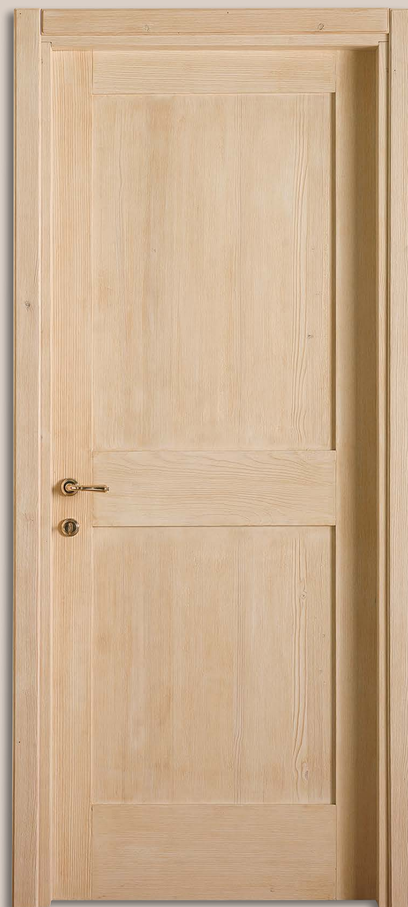
Mod. TORRI 312/Q Abete massello spazzolato cipria CF. 1/7