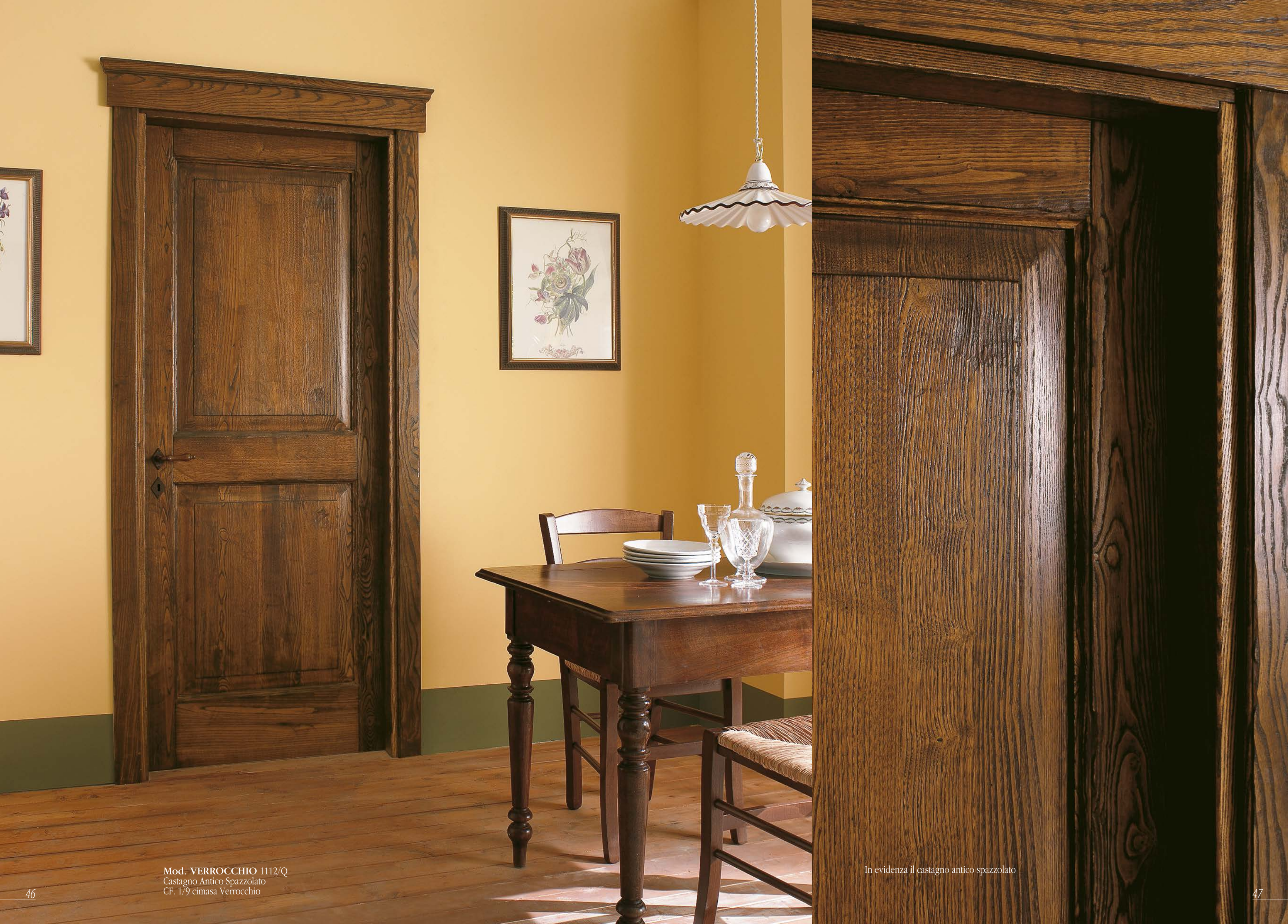
Mod. VERROCCHIO 1112/Q Castagno Antico Spazzolato CF. 1/9 cimasa Verrocchio

In evidenza il castagno antico spazzolato