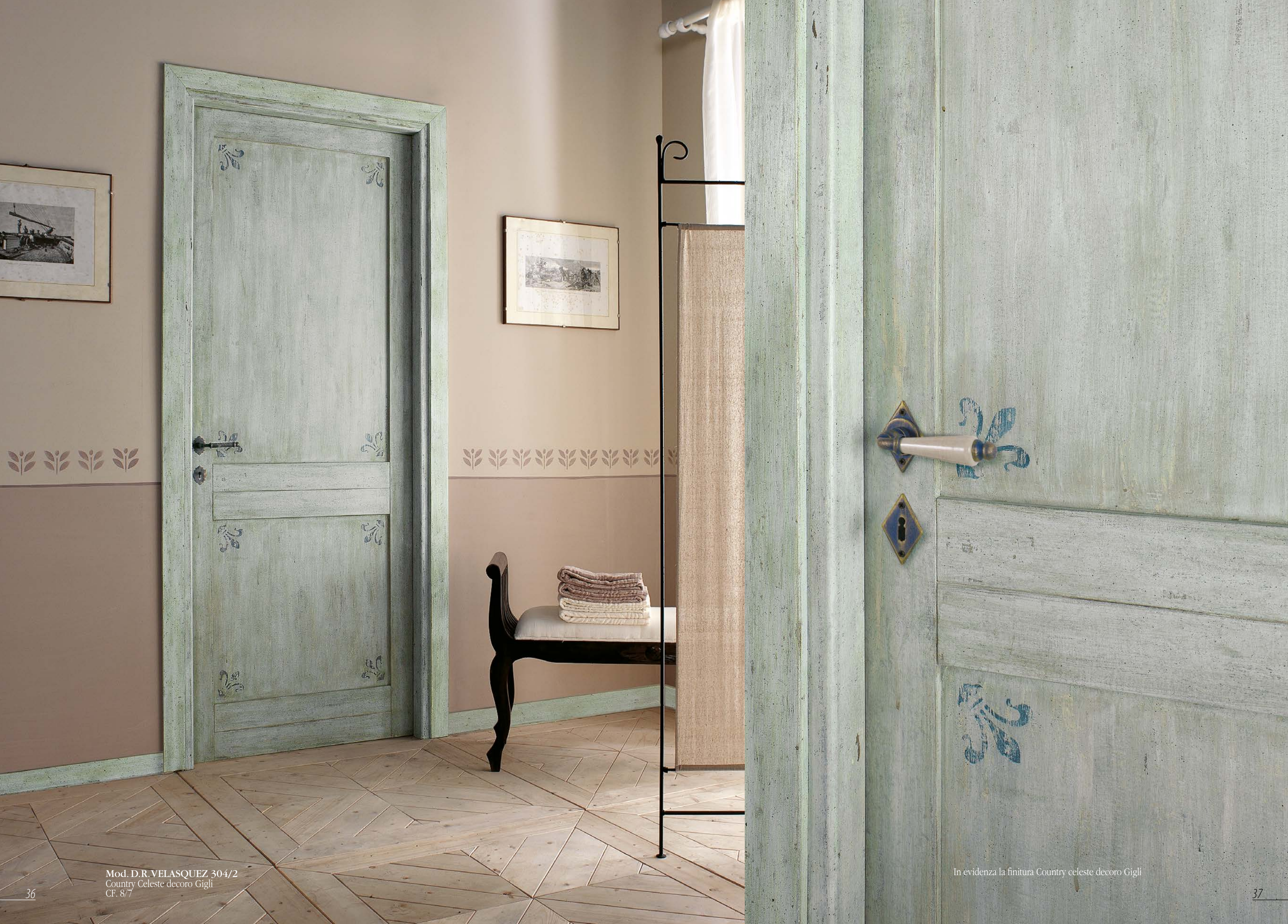
Mod. D.R. VELASQUEZ 304/2 Country Celeste decoro Gigli CF. 8/7

In evidenza la finitura Country celeste decoro Gigli