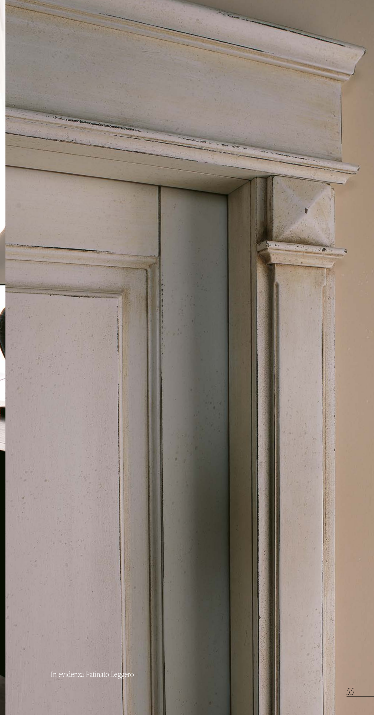
In evidenza Patinato Leggero