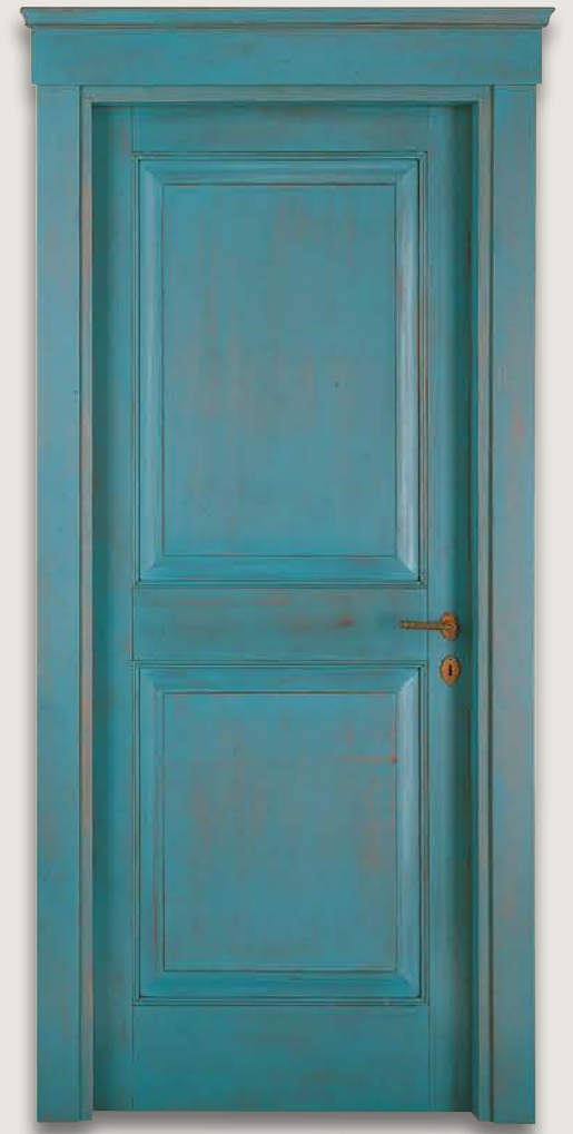
Mod. VERROCCHIO 1112/Q Decapée anticato Azzurro fin. Cera CF. 1/9 e cimasa Verrocchio