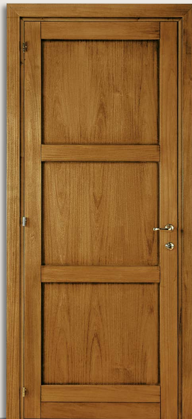
Mod. H. REMBRANDT 305 toulipier chiaro CF. 8/7