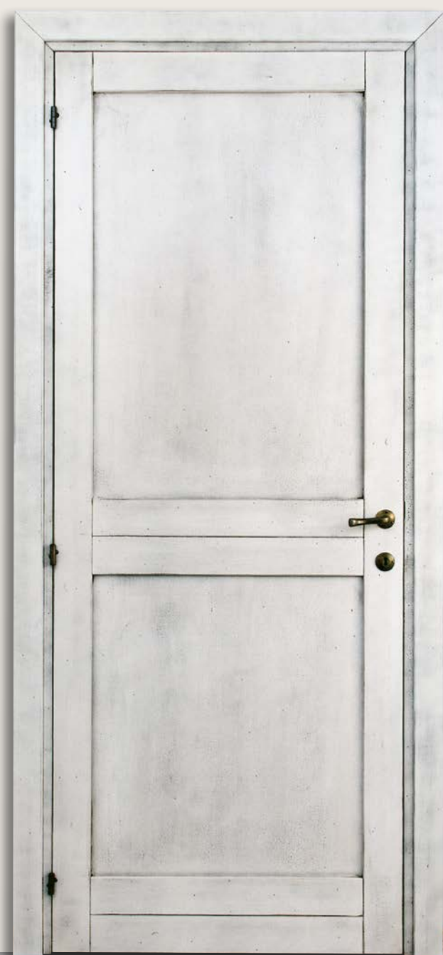
Mod. D.R. VELAZQUEZ 304/2 decapè anticato bianco finitura cera CF. 8/7