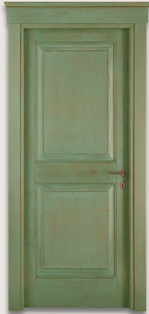
Mod. VERROCCHIO 1112/Q Decapée Anticato Verde fin. Cera CF. 1/9 e cimasa Verrocchio