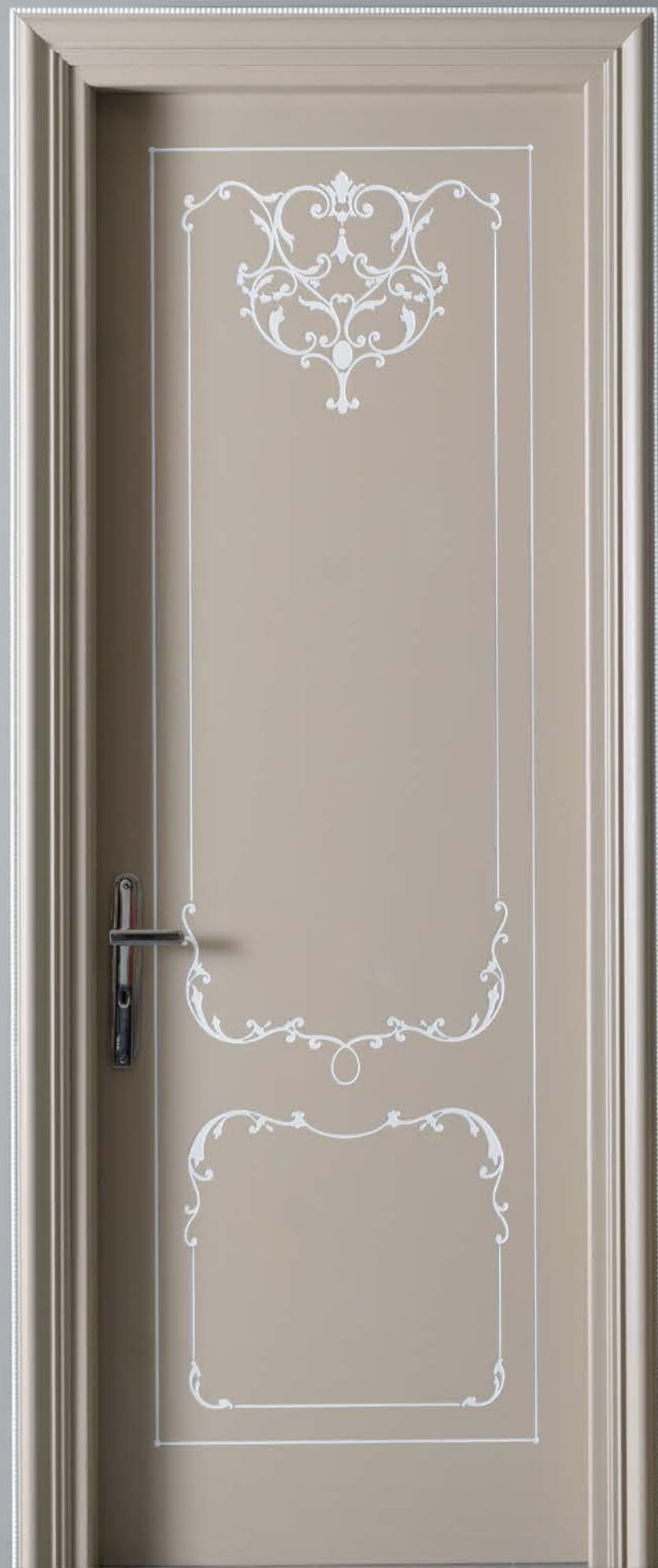
Mod. VILLA TORRIGIANI 5020/QQ Telaio R 10, coprifilo San Pietroburgo con pallino laccato opaco tortora 1850 con sovracoloro bianco