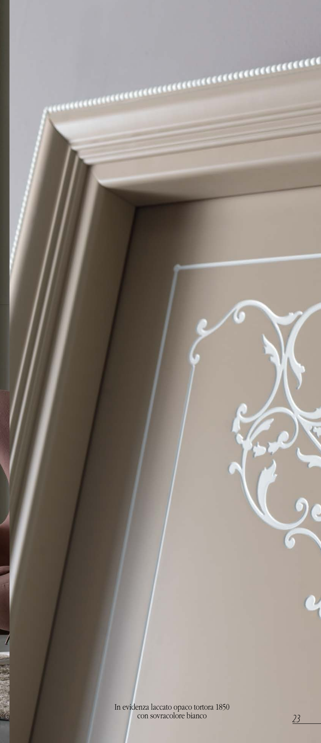
In evidenza laccato opaco tortora 1850 con sovracoloro bianco