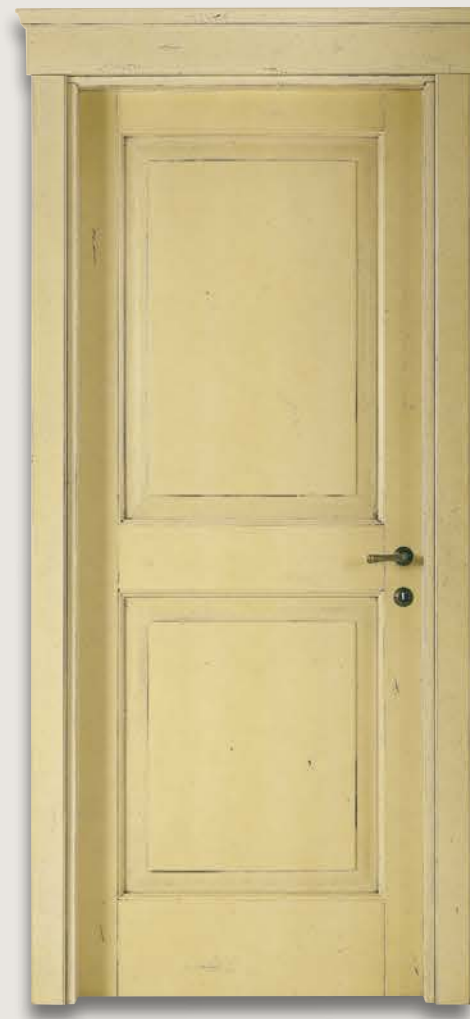
Mod. VERROCCHIO 1112/Q Decapée anticato RAL.1015 fin. Cera CF. 1/9 e cimasa Verrocchio