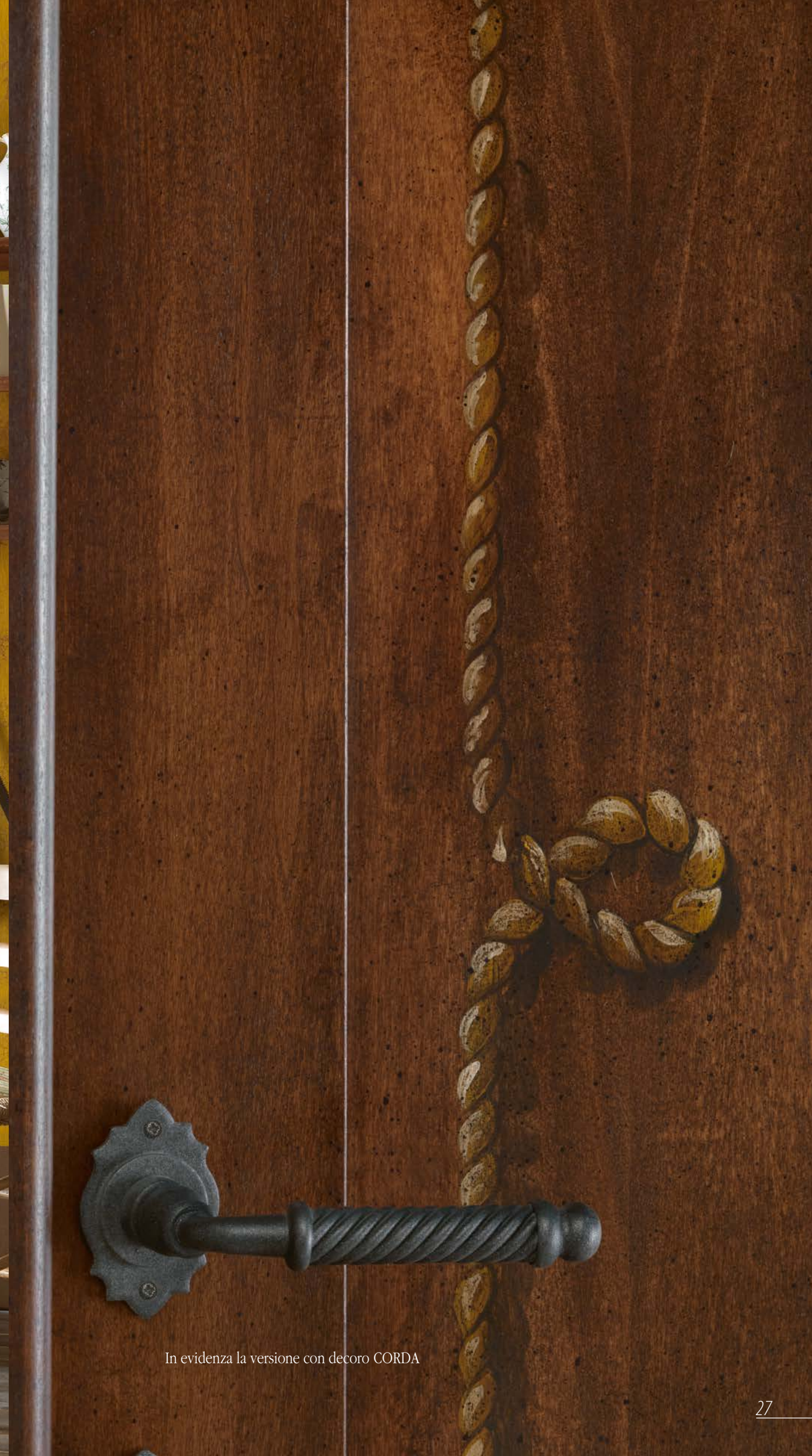
Mod. BERNINI 323 con bugna liscia Touliptier finitura noce vecchio CF 8