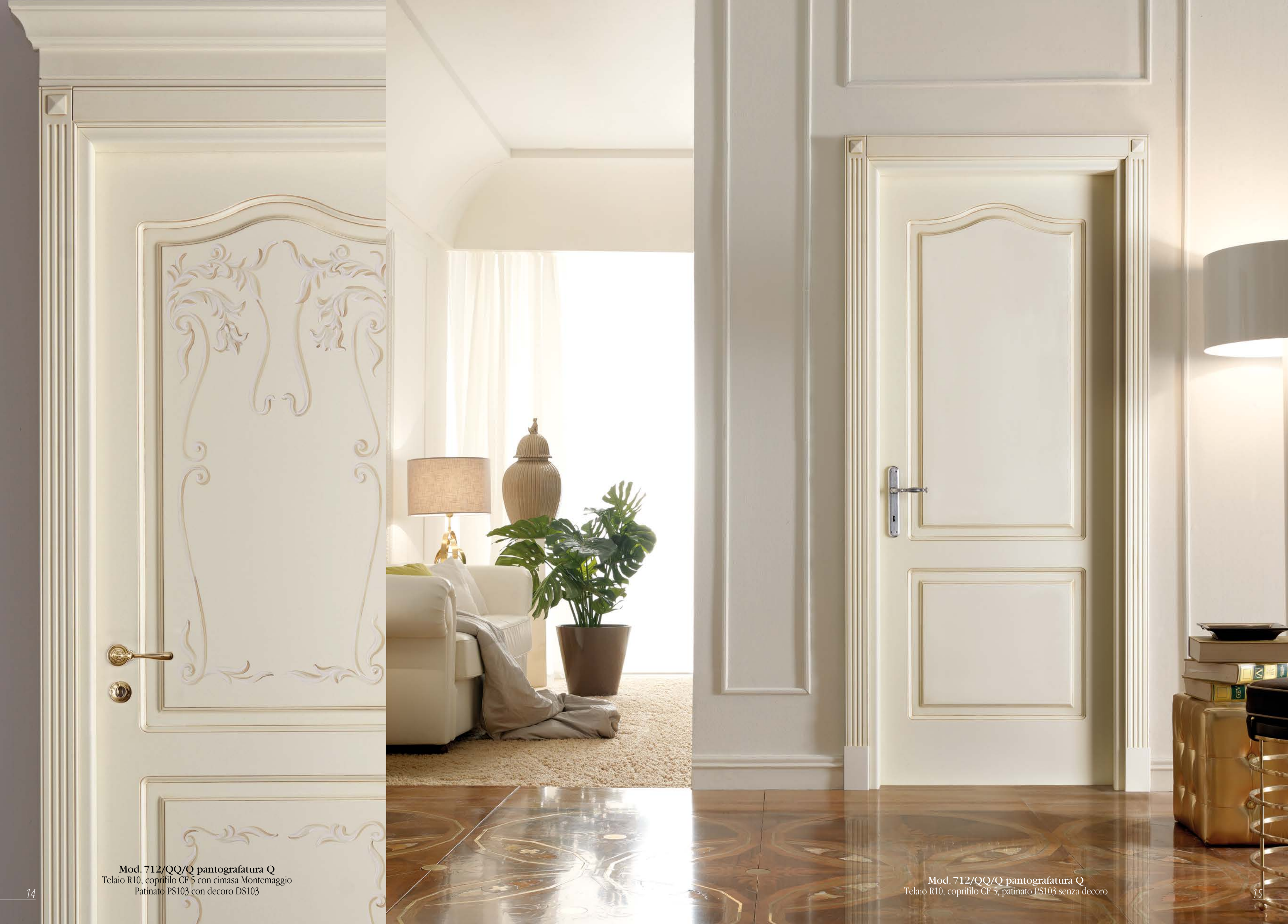
Mod. 712/QQ/Q pantografatura Q Telaio R10, coprifilo CF 5 con cimasa Montemaggio Patinato PS103 con decoro DS103