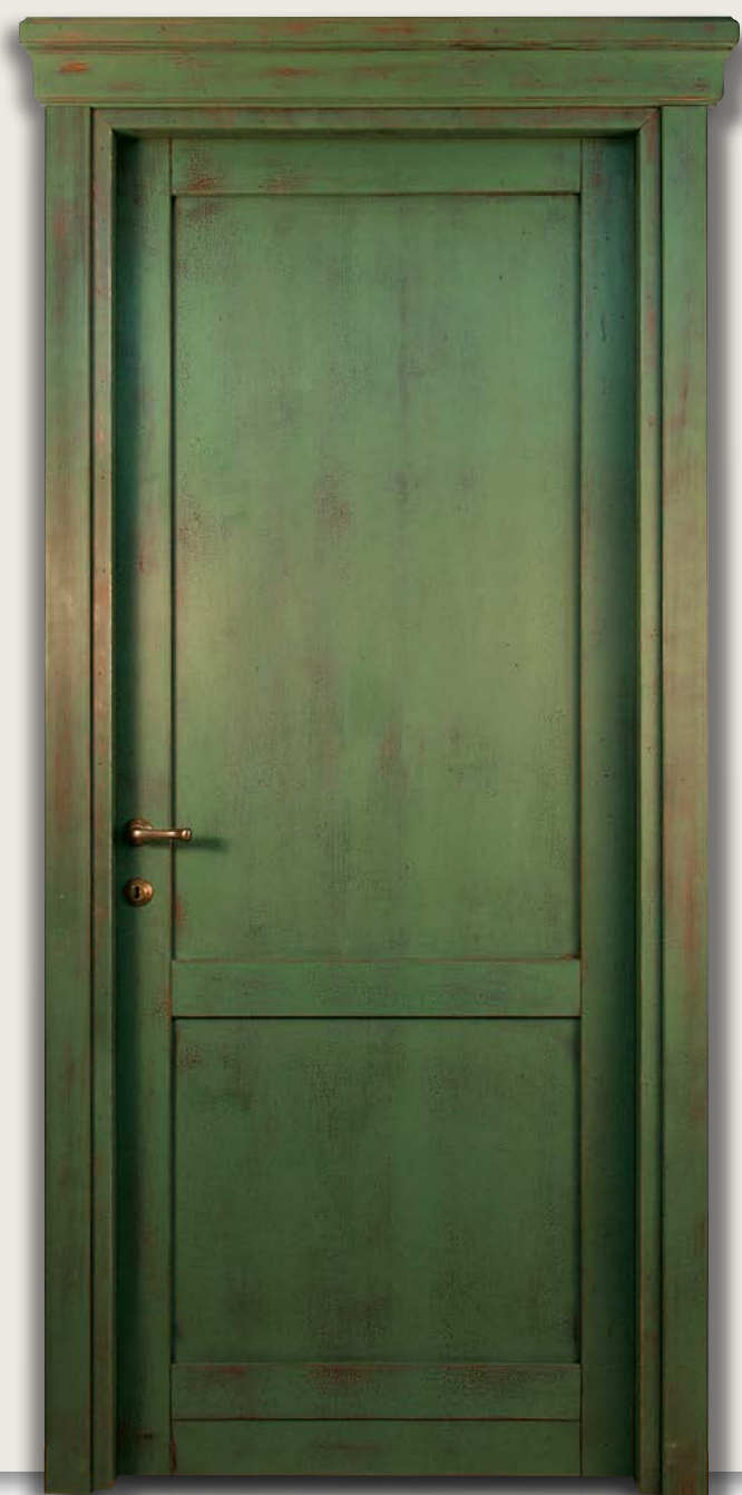
Mod. PIETRO DA CORTONA 304/1 decapè anticato verde finitura cera CF. 8/7 - cimasa LORY