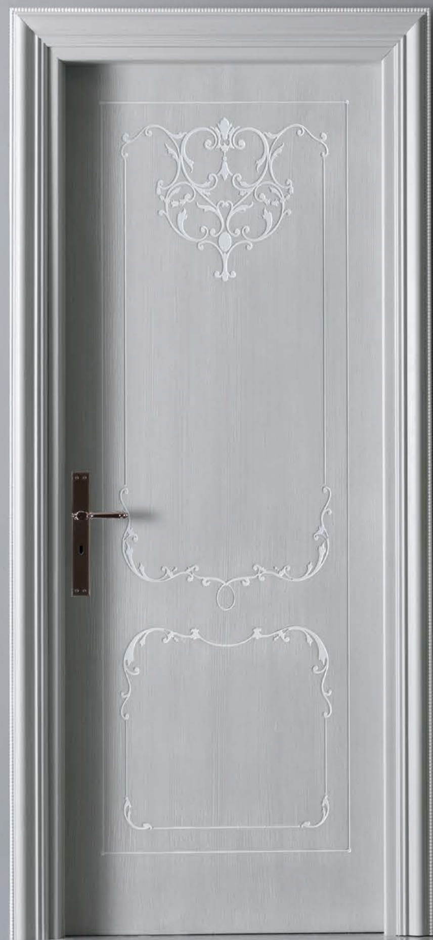
Mod. VILLA TORRIGIANI 5020/QQ Telaio R 10, coprifilo San Pietroburgo con pallino laccato opaco RAL 7035 con sovracoloro bianco e patinatura a pennello