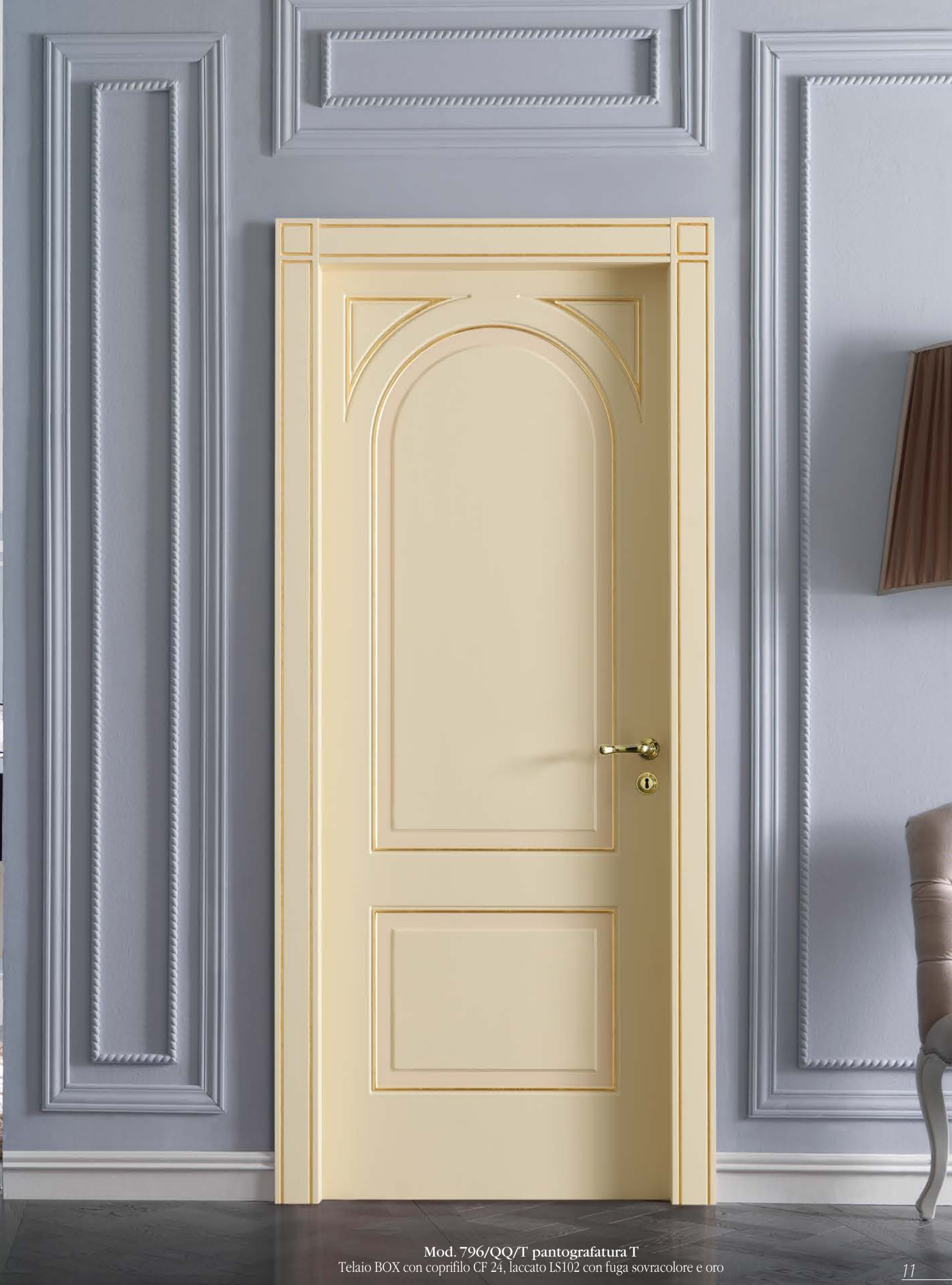
Mod. 796/qq/t pantografatura T Telaio BOX con coprifilo CF 24, laccato LS102 con fuga sovracoloro e oro