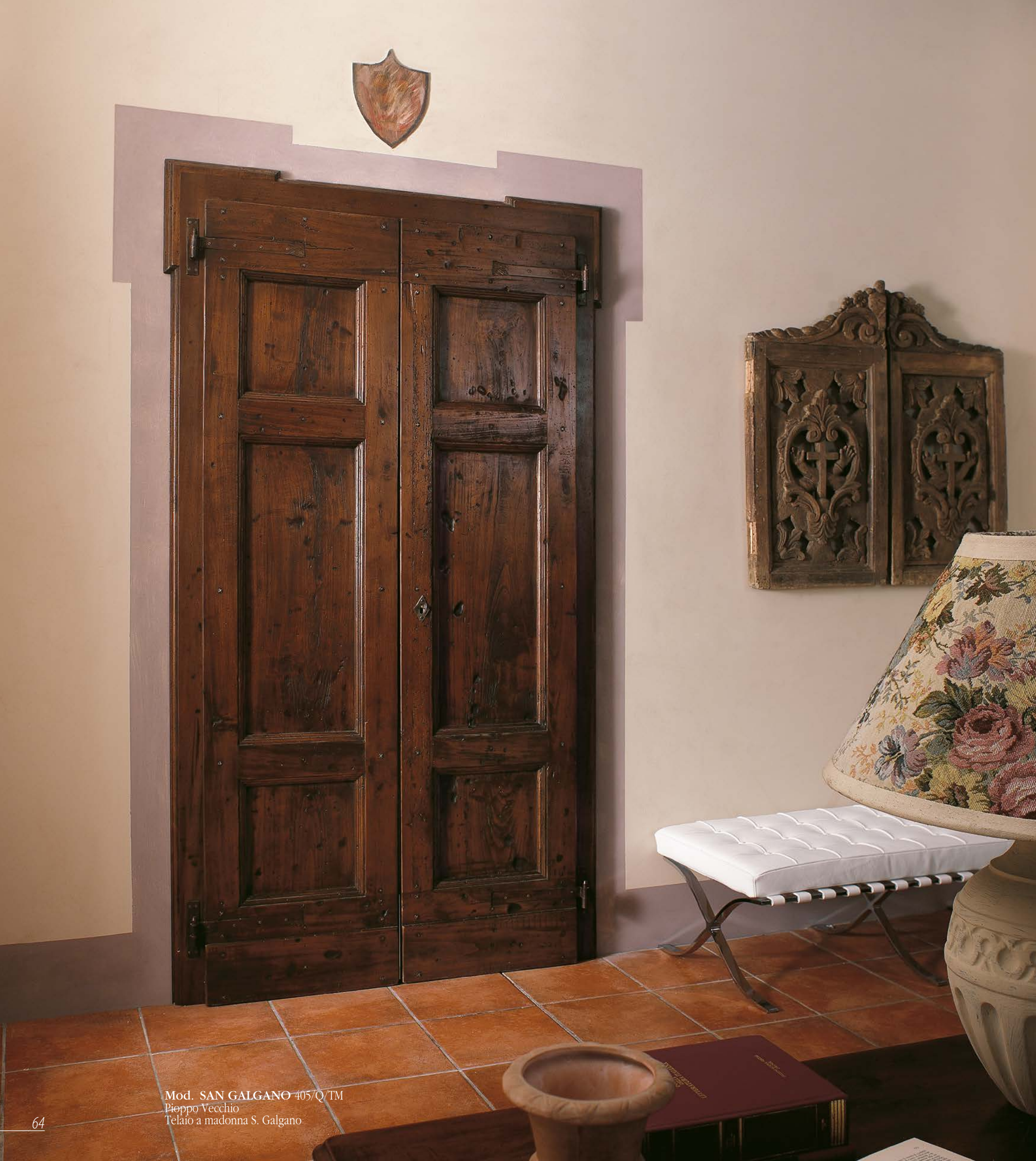
Mod. SAN GALGANO 405/Q/TM Pioppo Vecchio Telaio a madonna S. Galgano