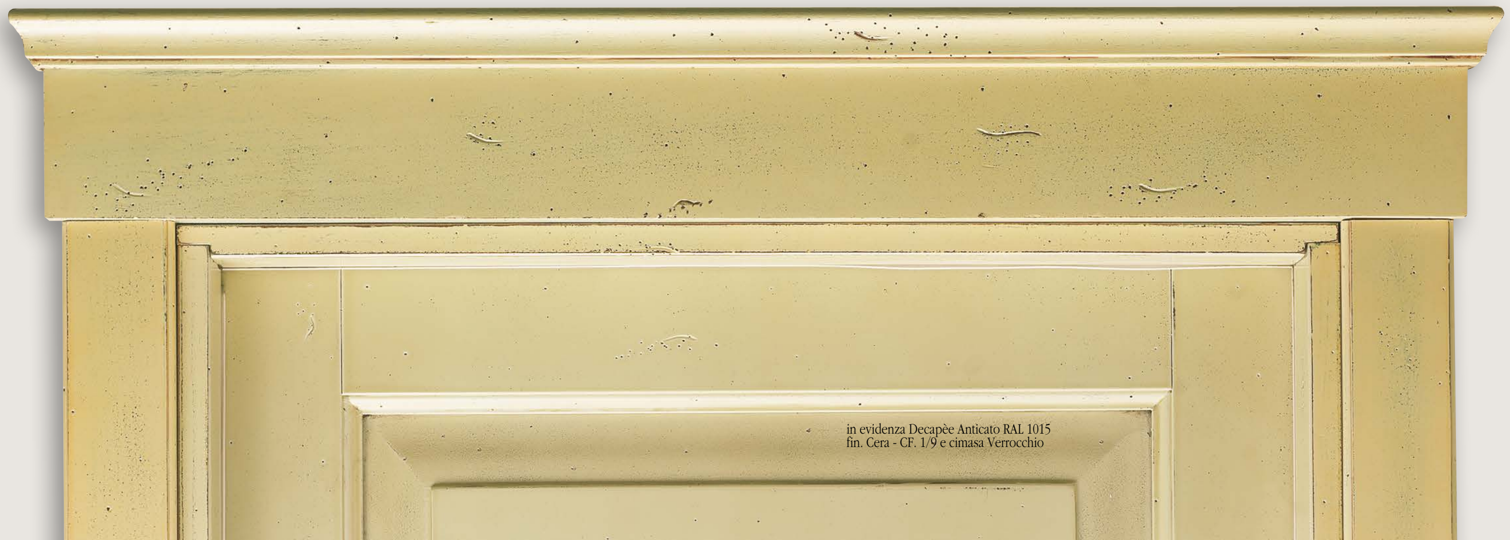
in evidenza Decapée Anticato RAL 1015 fin. Cera - CF. 1/9 e cimasa Verrocchio