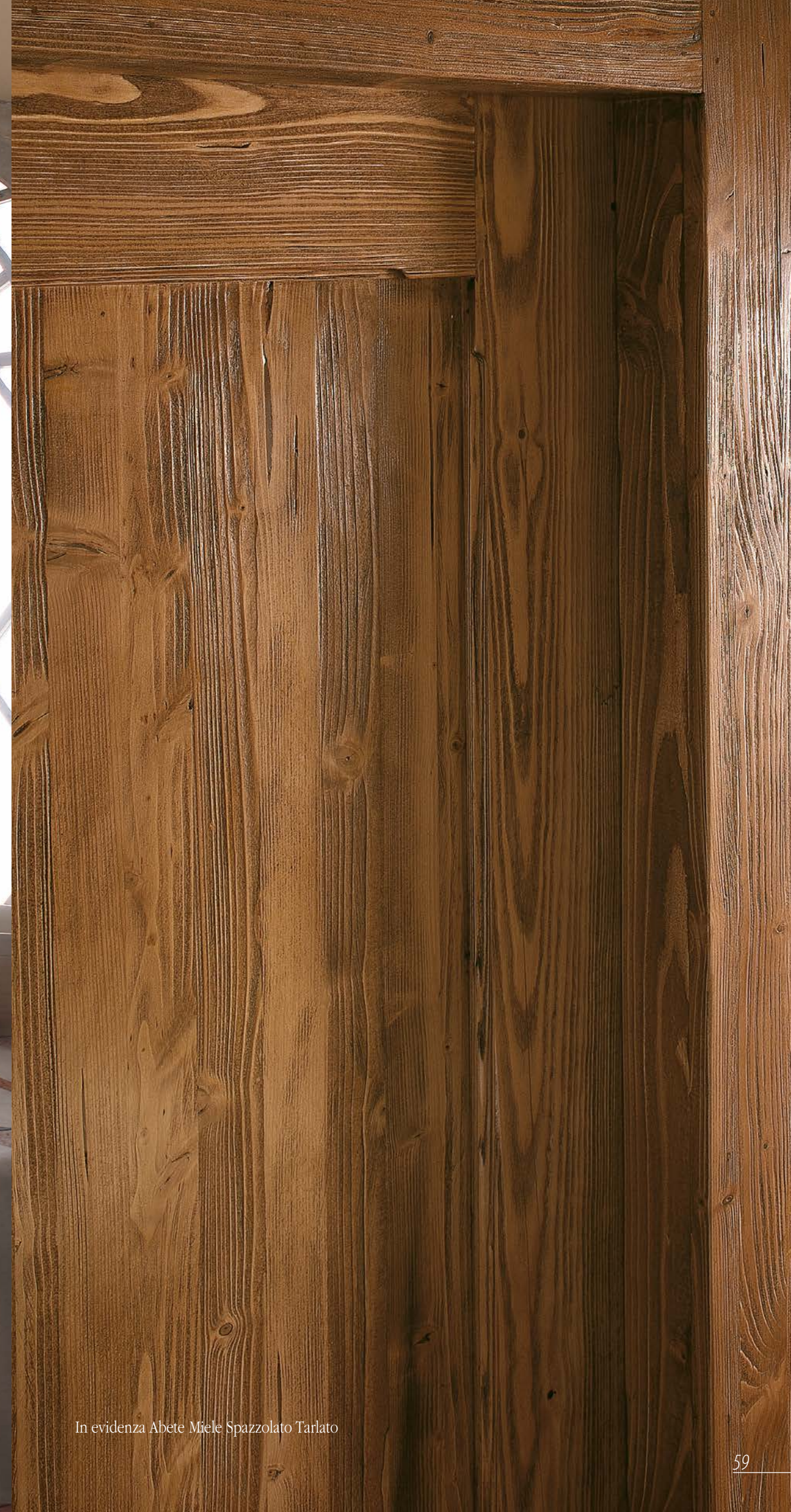
In evidenza Abete Miele Spazzolato Tarlato