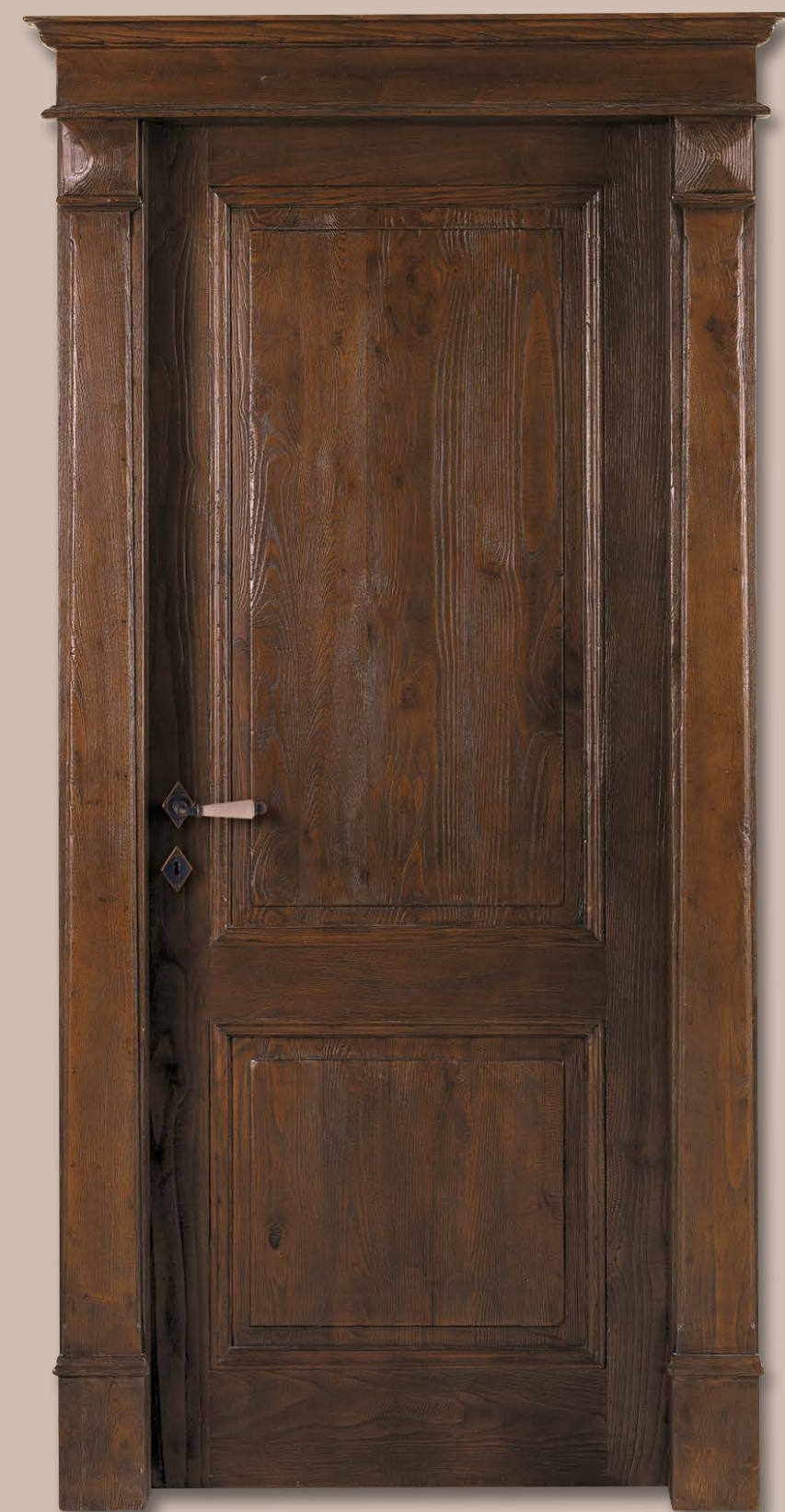
Mod. TANCREDI 408/Q Castagno Spazzolato Anticato CF. Tancredi e cimasa Tancredi