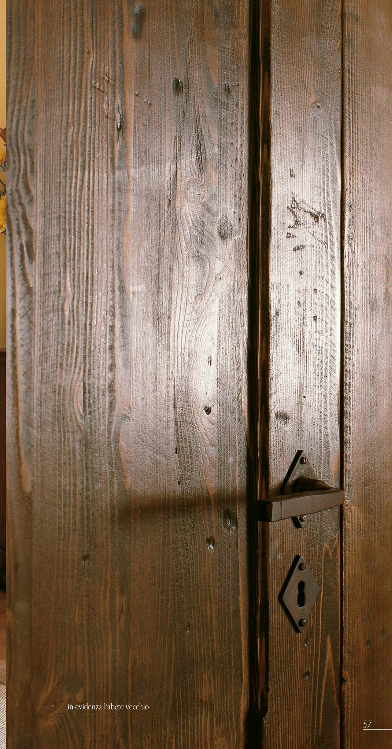
in evidenza l'abete vecchio