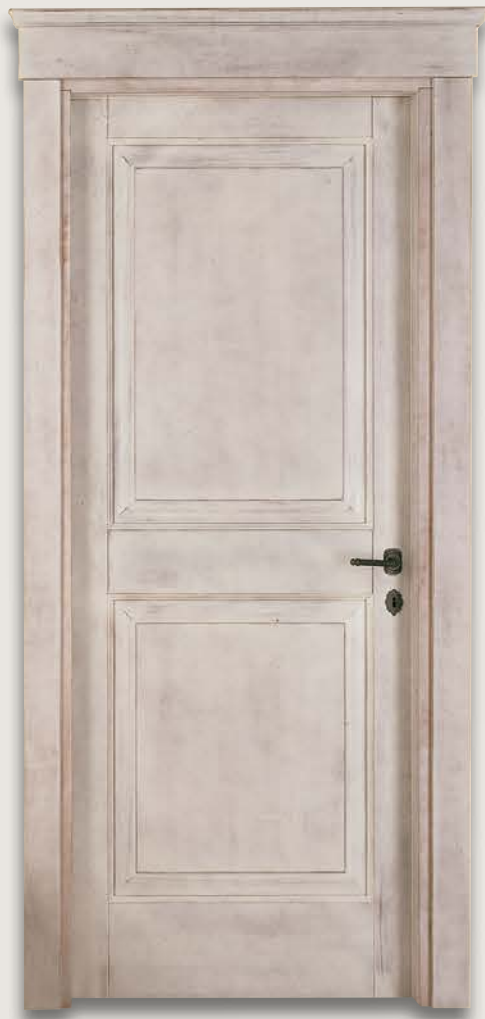
Mod. VERROCCHIO 1112/Q Decapée Anticato Bianco fin. Cera CF. 1/9 e cimasa Verrocchio