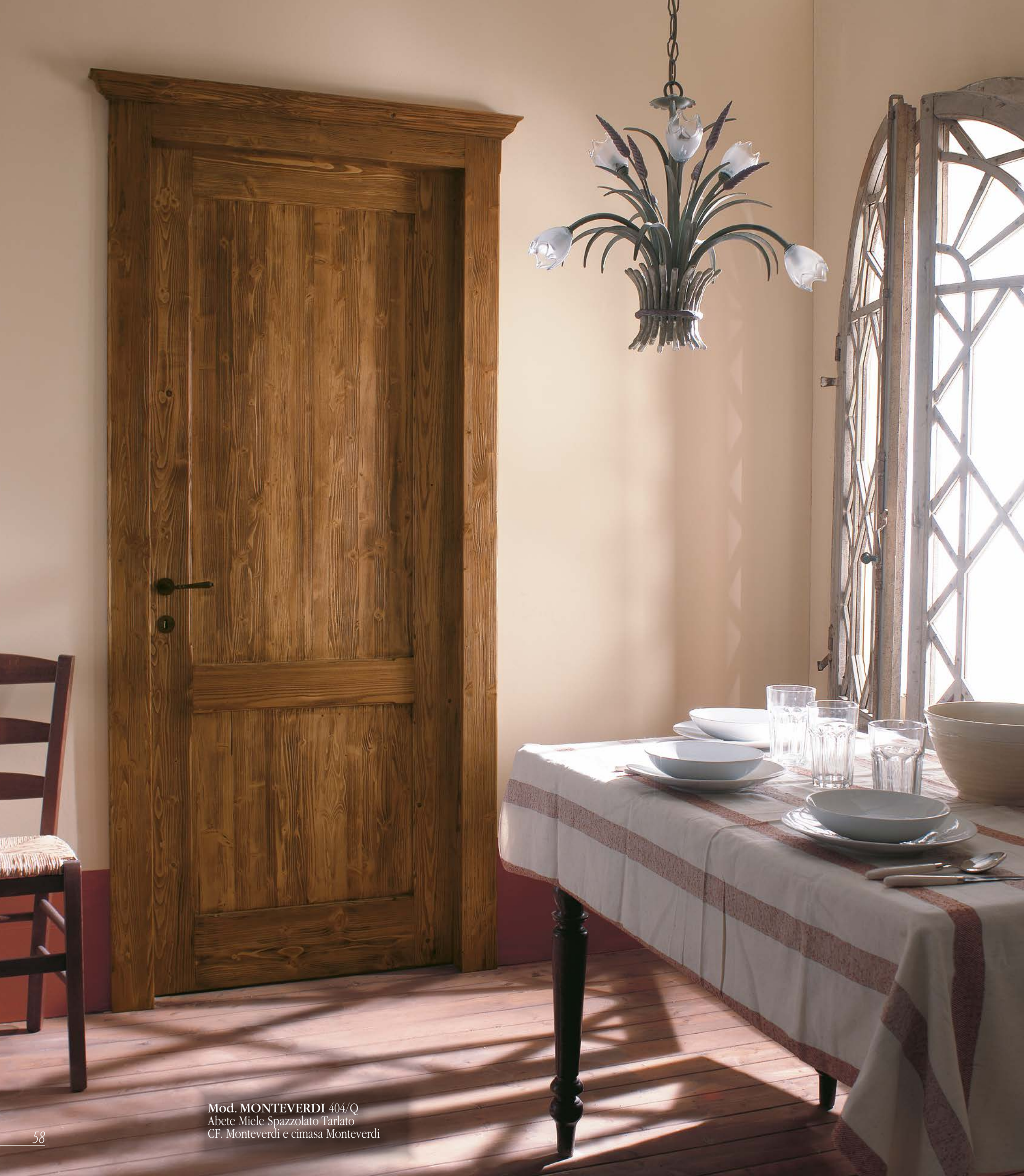
Mod. MONTEVERDI 404/Q Abete Miele Spazzolato Tarlato CF. Monteverdi e cimasa Monteverdi