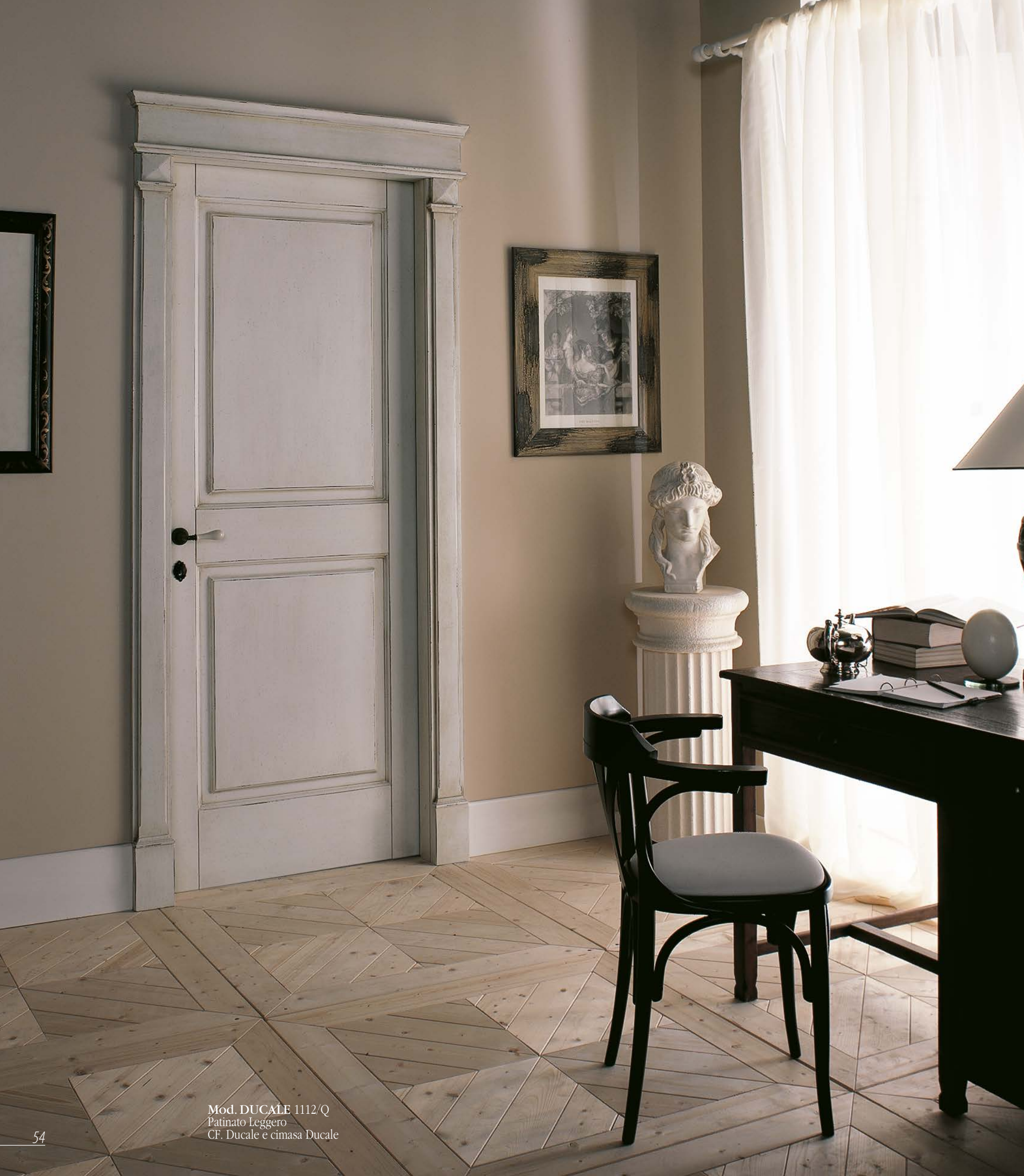
Mod. DUCALE 1112/Q Patinato Leggero CF. Ducale e cimasa Ducale