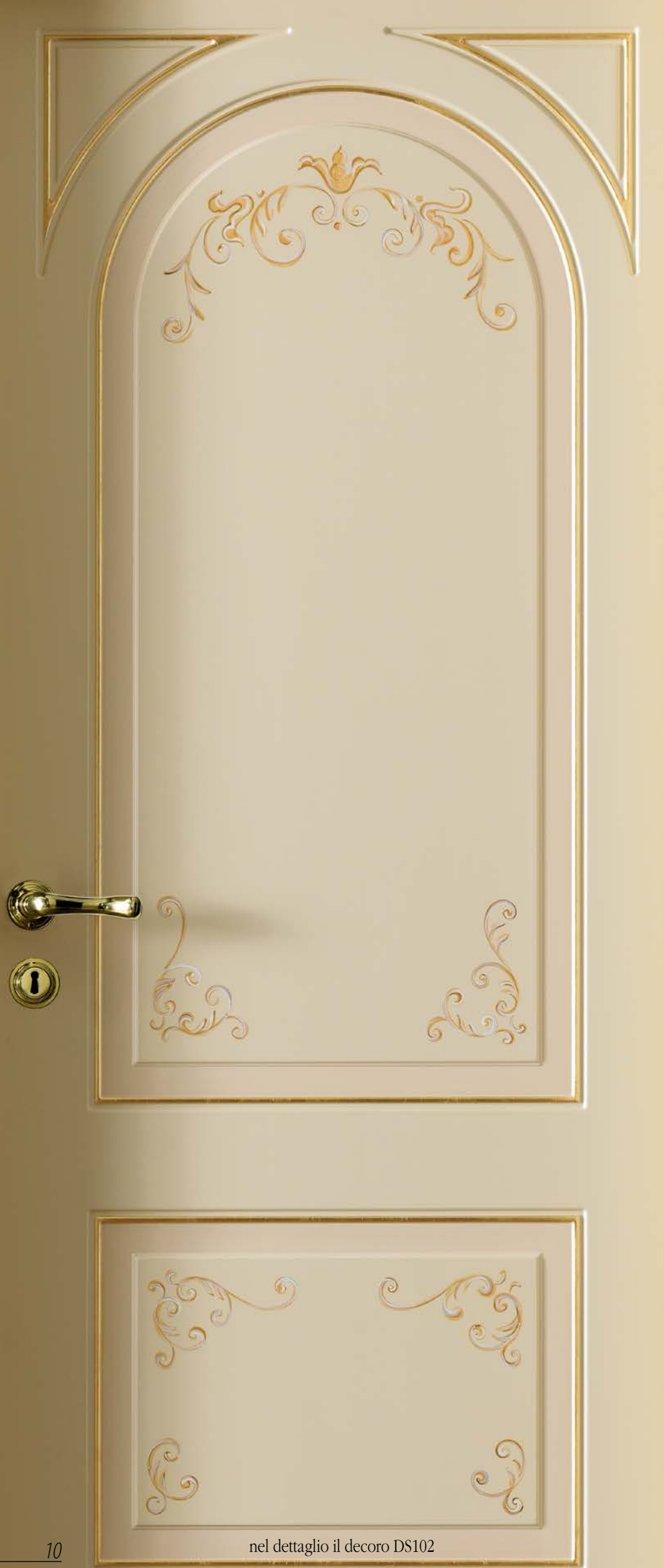
nel dettaglio il decoro DS102