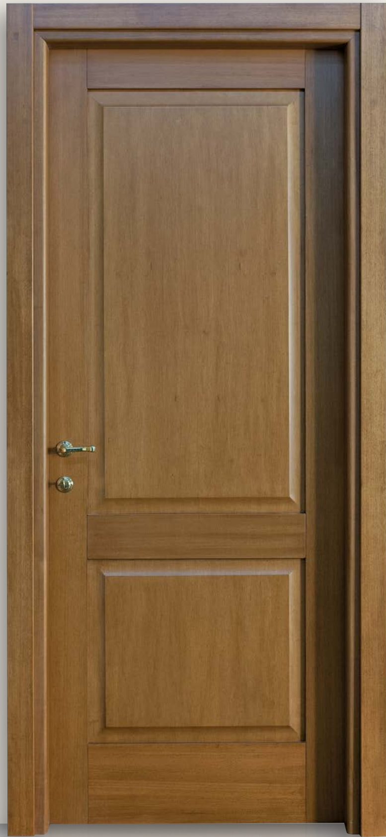
Mod. GUARINI 314 Toulipier medio, CF. 8/7