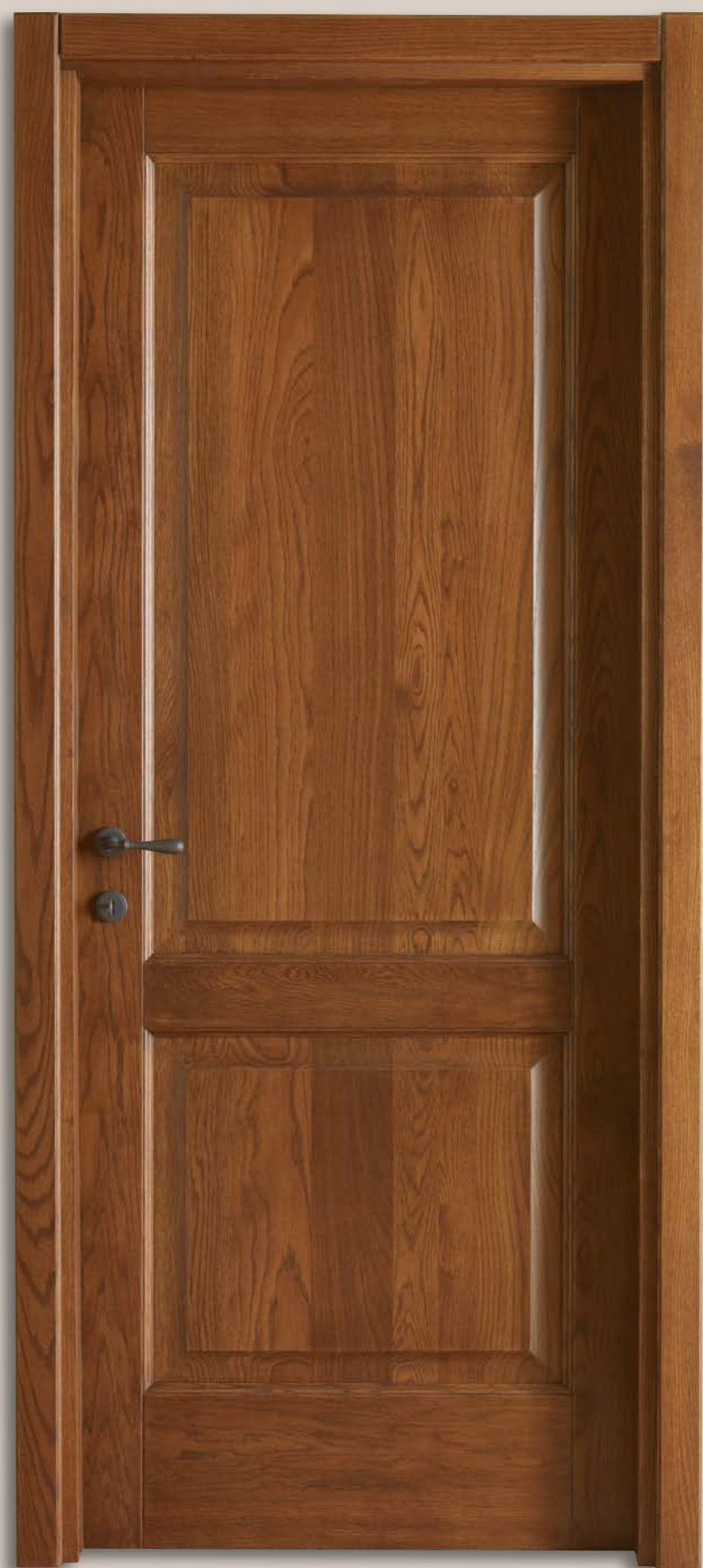
Mod. DONATELLO 1114/Q Frassino tinto castagno medio CF. Liscio