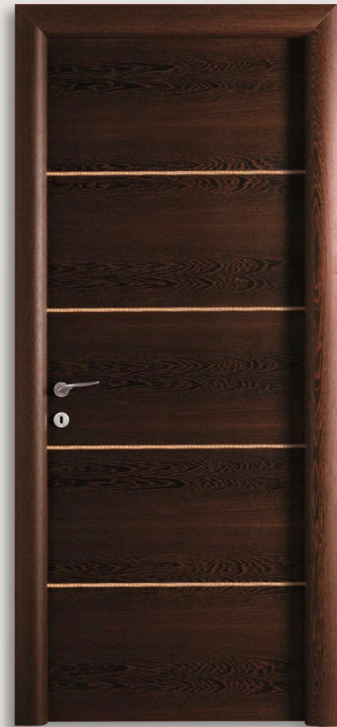
Mod. CARAVAGGIO 1211/QQ/E Wengé con intarsio tipo E CF. 6 - telaio brevettato