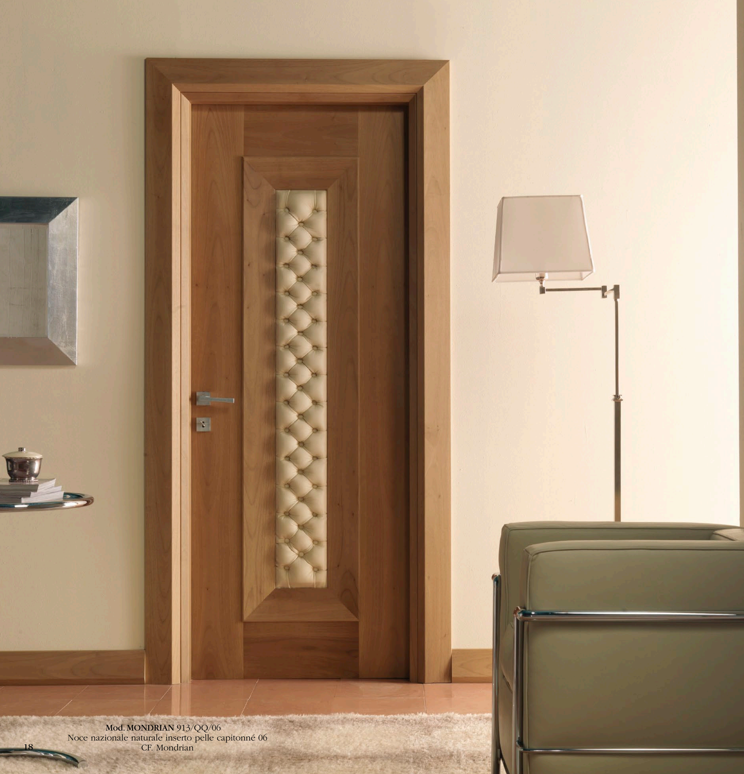
Mod. MONDRIAN 913/06 Noce nazionale naturale inserto pelle capitonné 06 CF. Mondrian