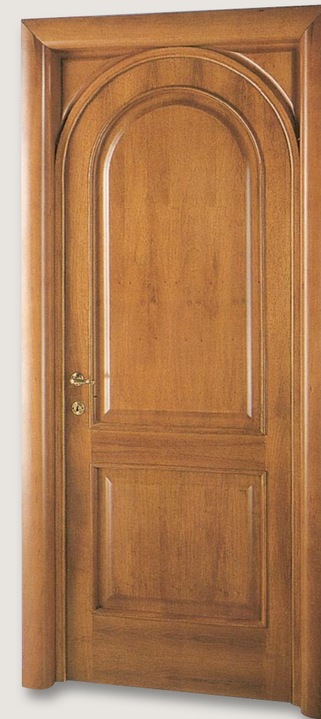
Mod. TINTORETTO 1214/TQ Noce nazionale biondo CF. 6 - telaio brevettato