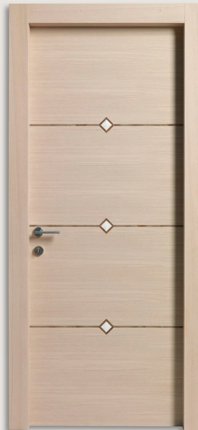
Mod. GIUDETTO 1011/QQ/F02 Rovere sbiancato inserti alabastro 02 CF. 10/10