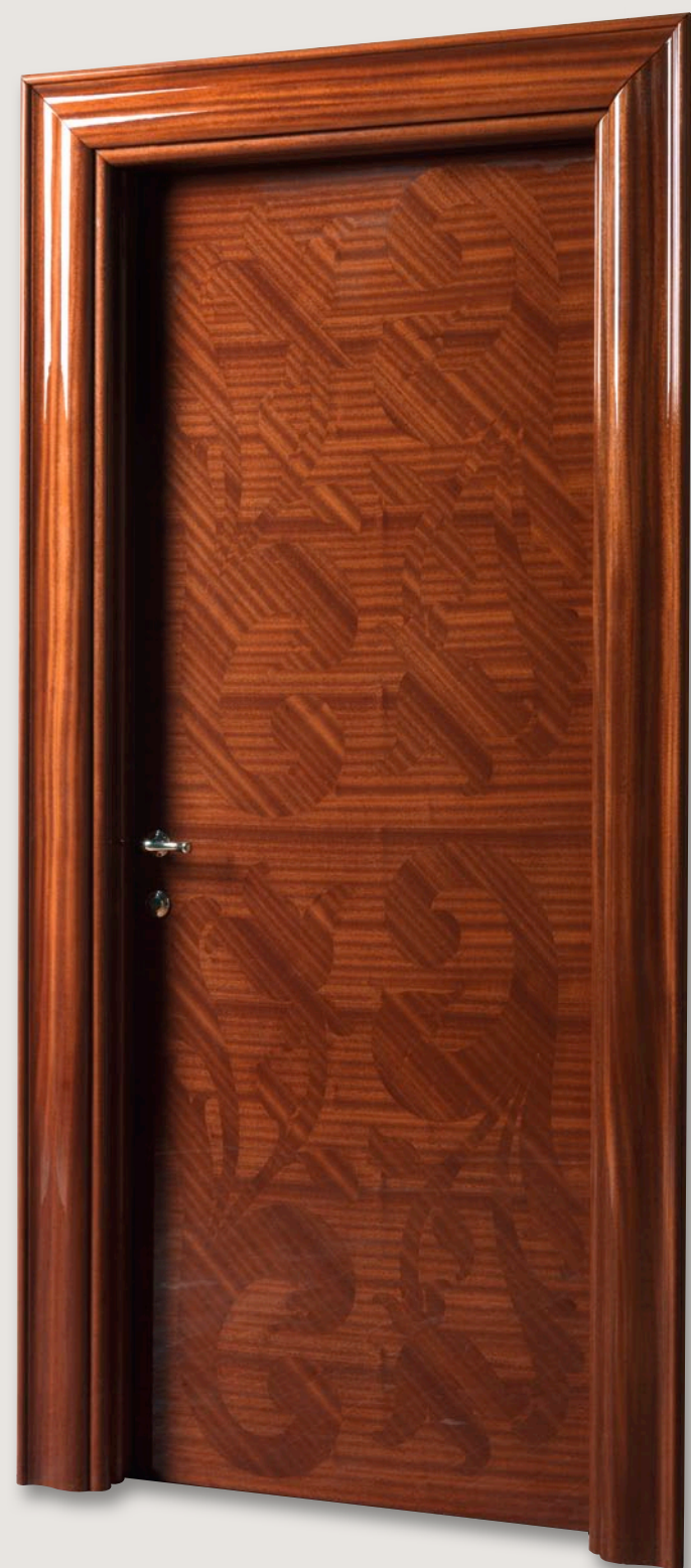
Mod. CENTRAL PARK 901/QQ Mogano lucido - CF. Klee