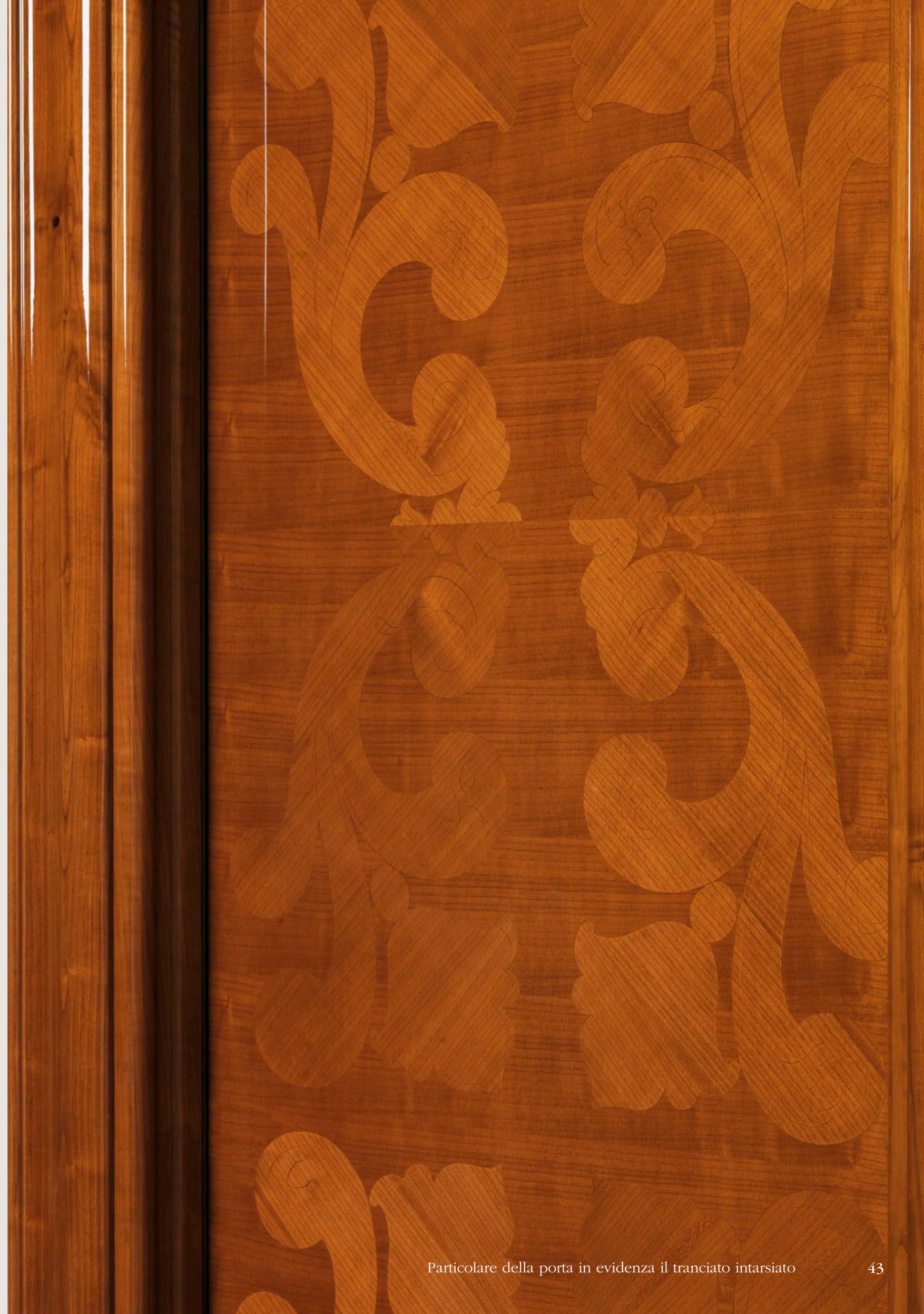
Particolare della porta in evidenza il tranciato intarsiato