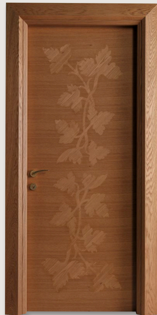
Mod. HYDE PARK 901/QQ Rovere finitura cera CF. Mondrian