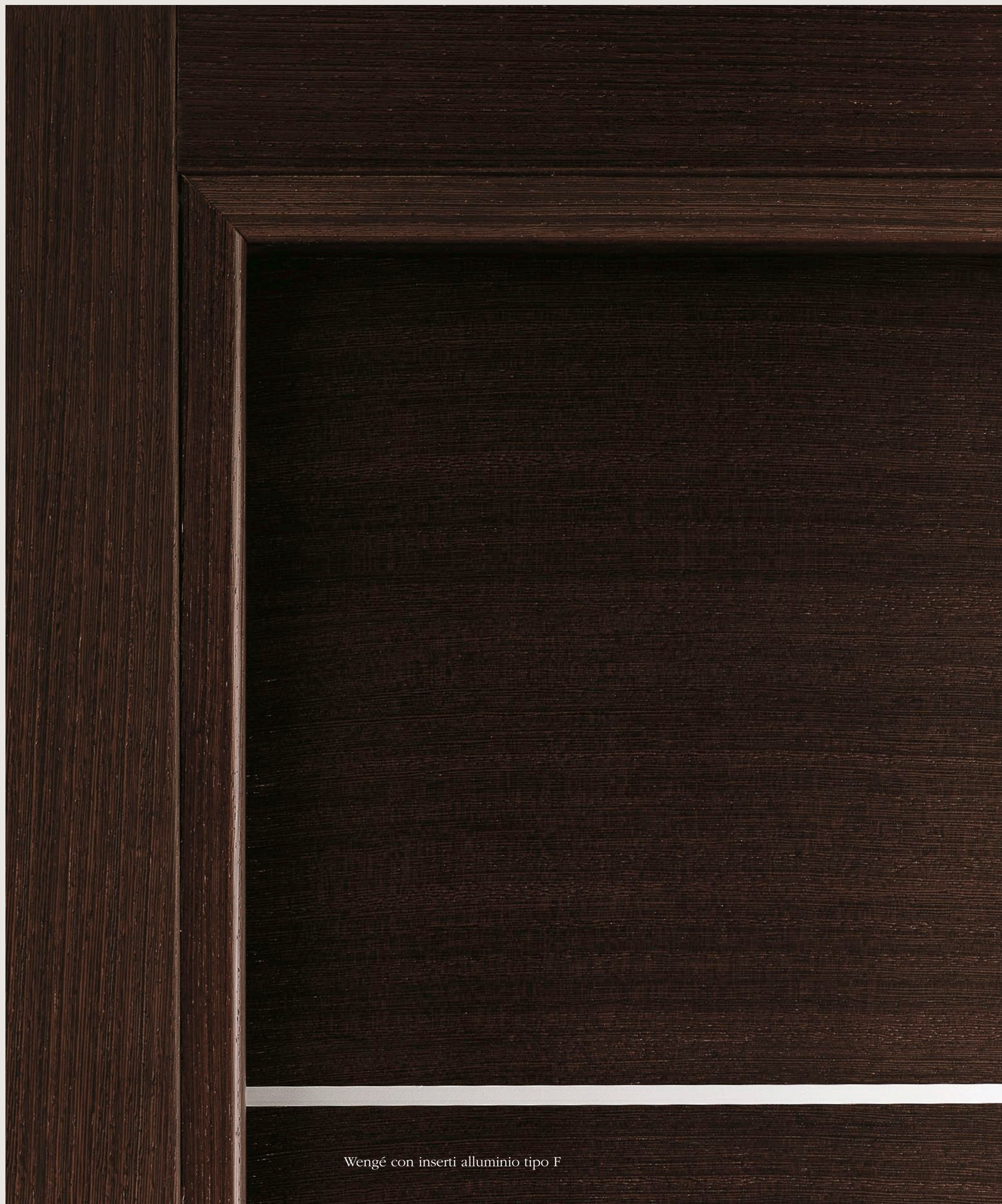
Wengé con inserti alluminio tipo F