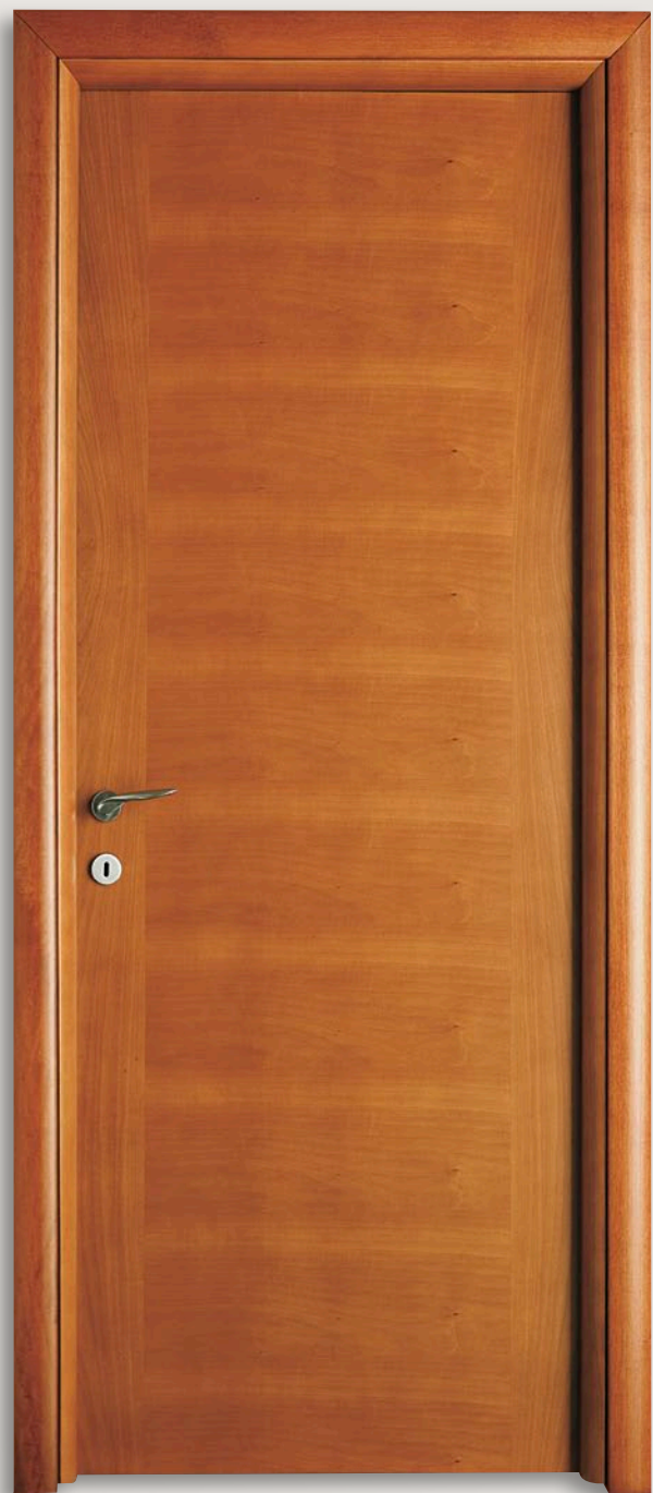
Mod. PICASSO 911/99/B Tanganica Tinto Ciliegio tipo B CF. stonato telaio R50