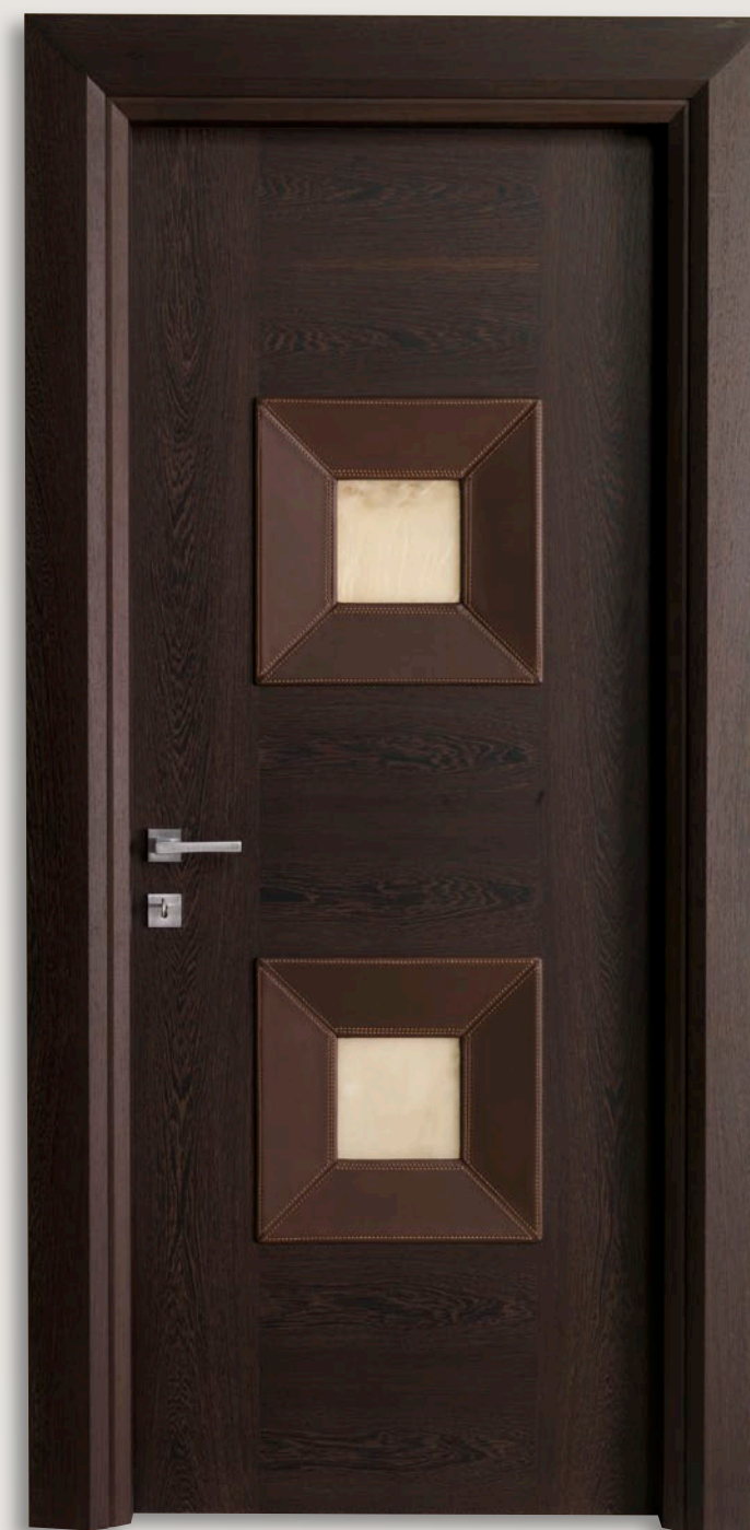
Mod. MONDRIAN CUIOIO 914/QQ/10 Wengè e cuoio inserti alabastro 10 CF. Mondrian