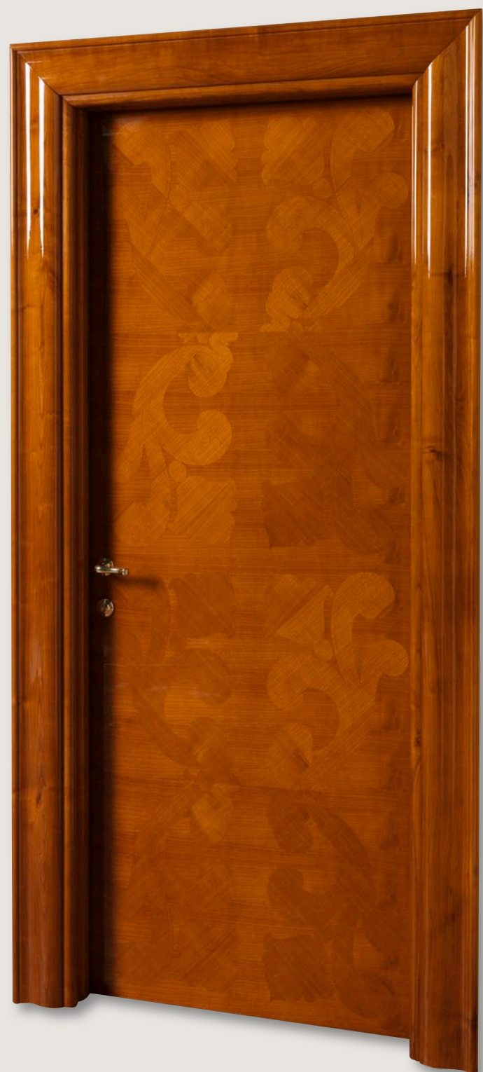
Mod. GORKY PARK 901/QQ Ciliegio lucido CF. Klee