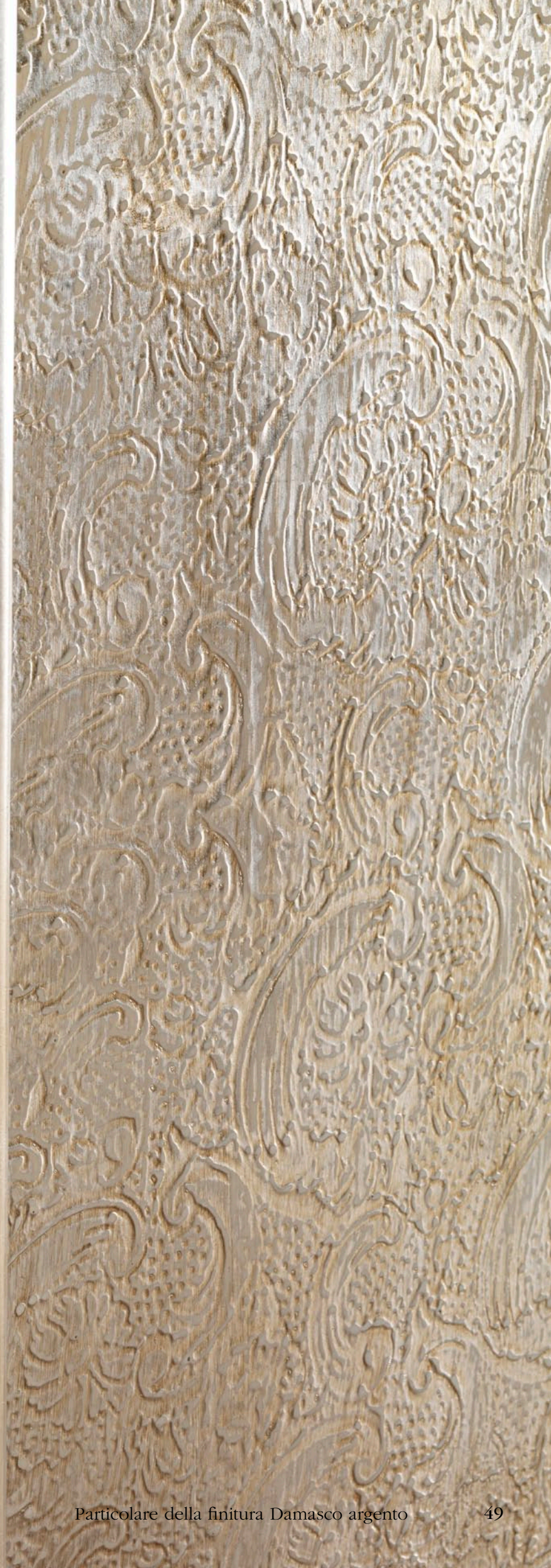
Particolare della finitura Damasco argento