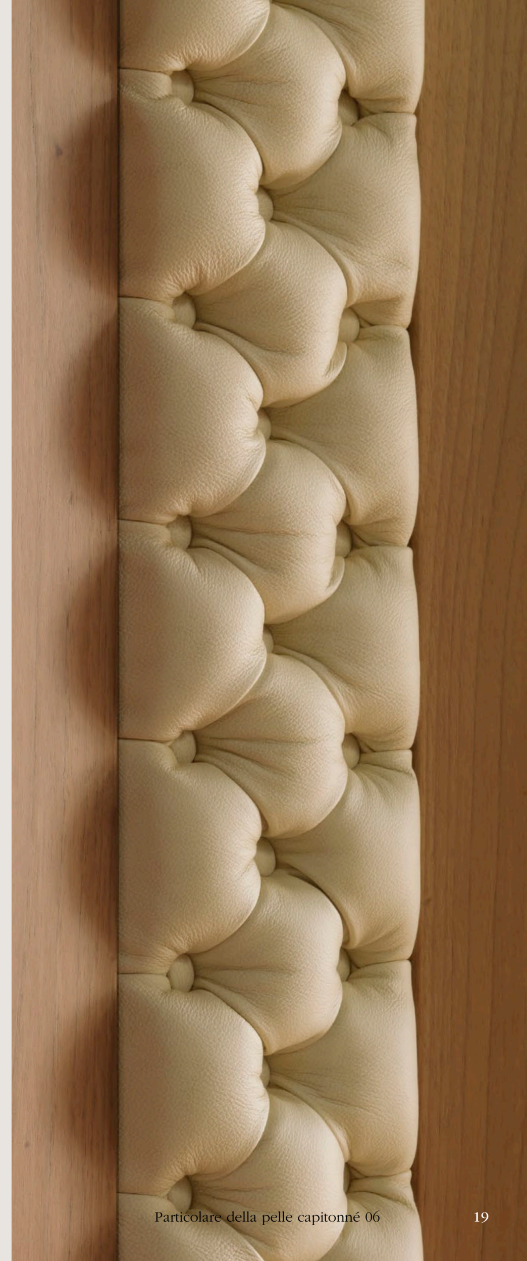
Particolare della pelle capitonné 06