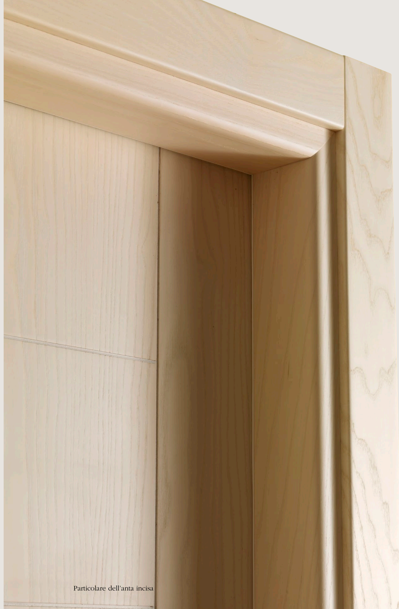
Particolare dell'anta incisa