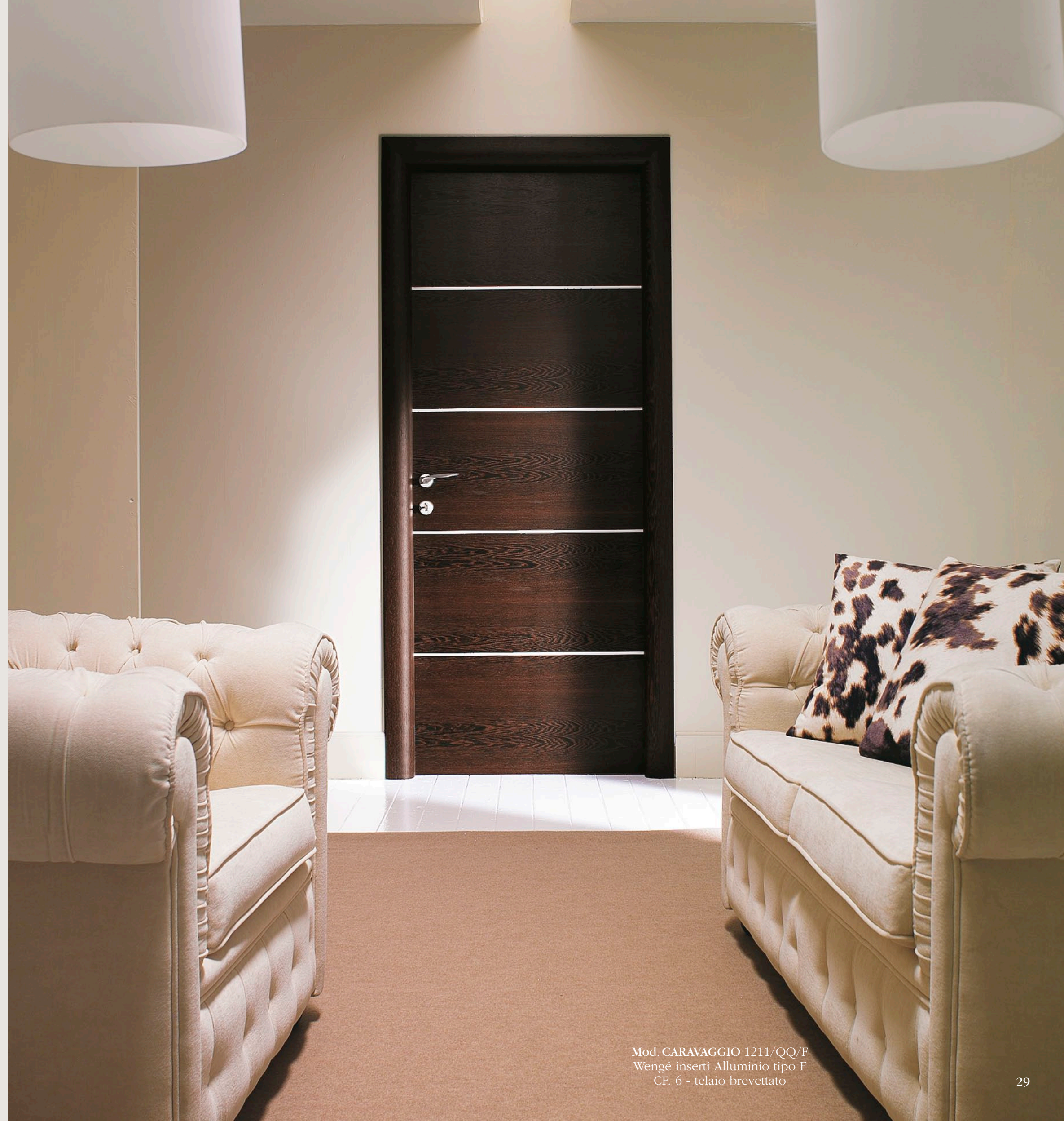
Mod. CARAVAGGIO 1211/QQ/F Wengé inserti Alluminio tipo F CF. 6 - telaio brevettato