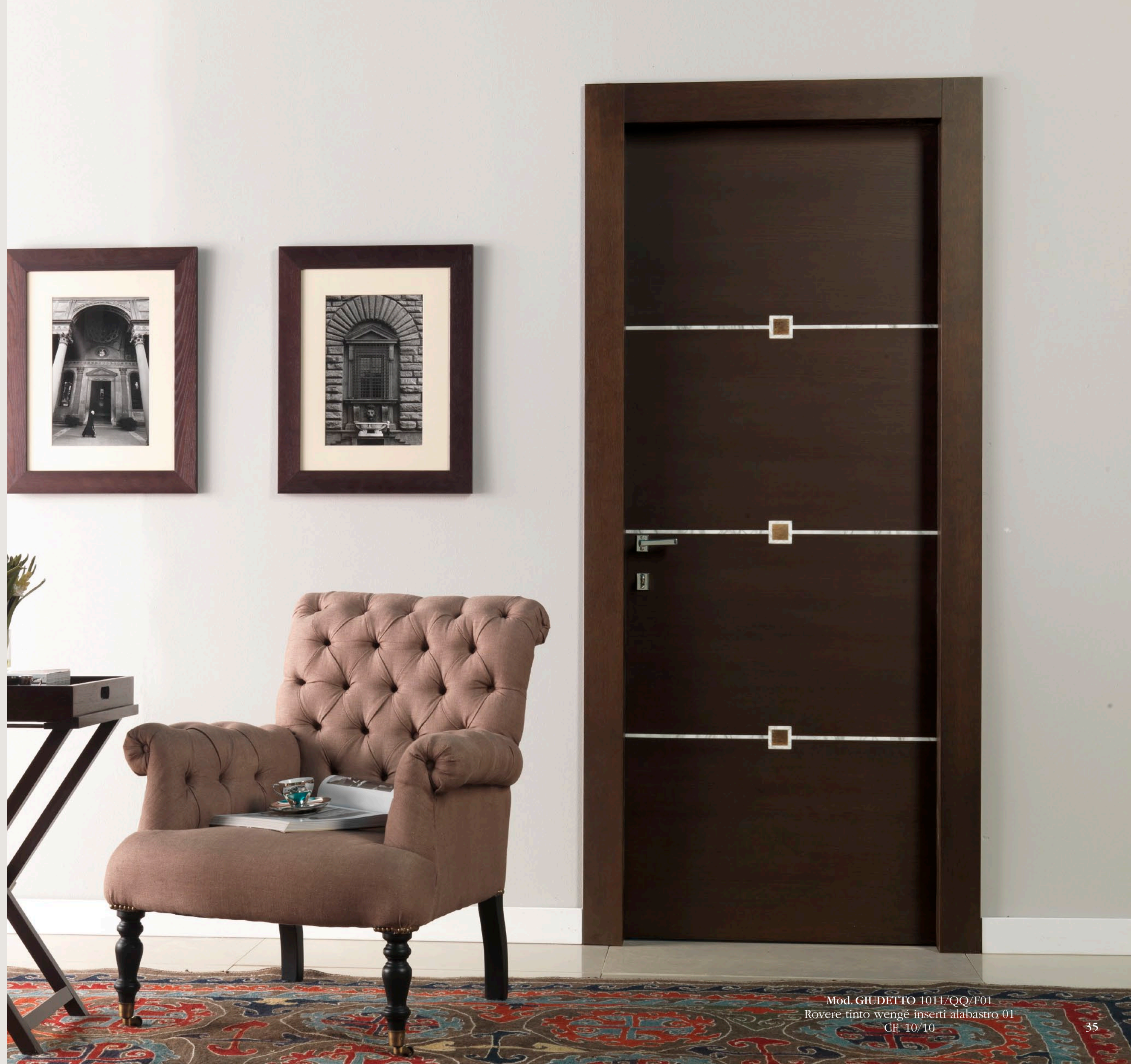
Mod. GIUDETTO 1011/QQ/F01 Rovere tinto wengé inserti alabastro 01 CF. 10/10