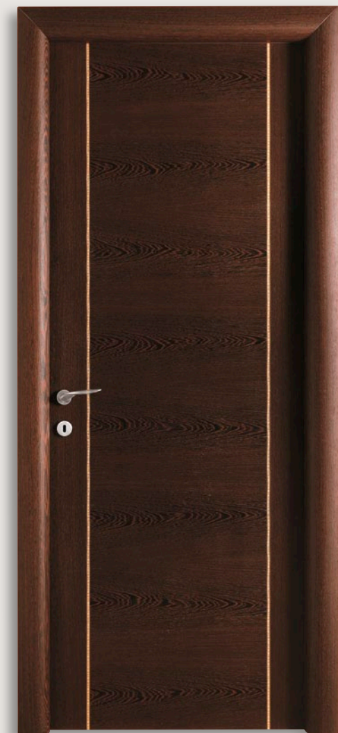
Mod. CARAVAGGIO 1211/QQ/C Wengé con Intarsio tipo C CF. 6 - telaio brevettato