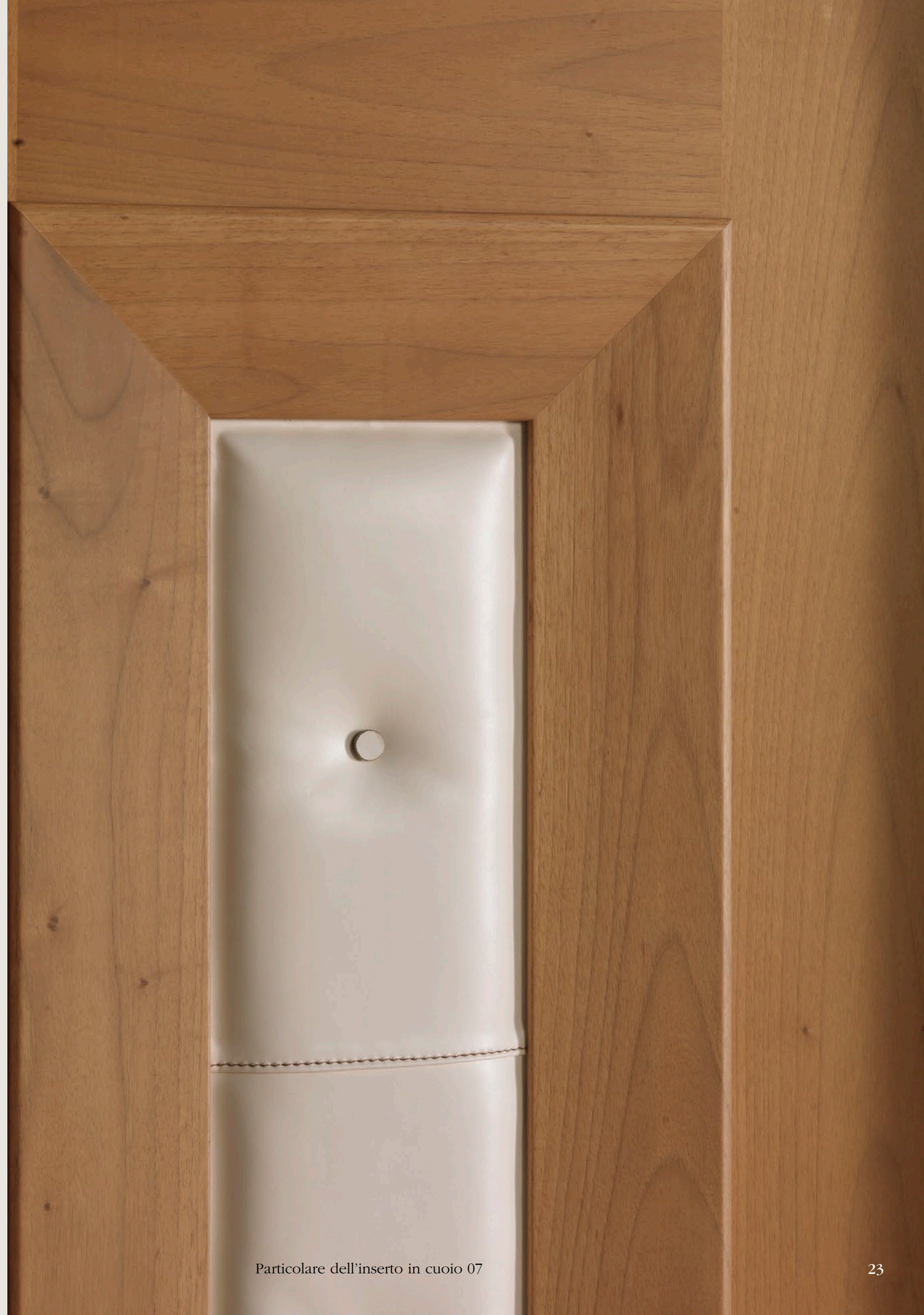
Particolare dell'inserto in cuoio 07