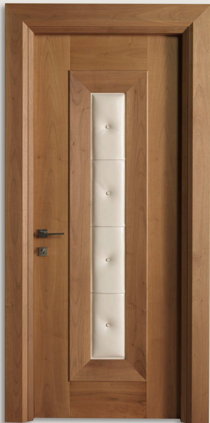
Mod. MONDRIAN 913/QQ/07 Noce nazionale naturale inserto cuoio 07 CF. Mondrian