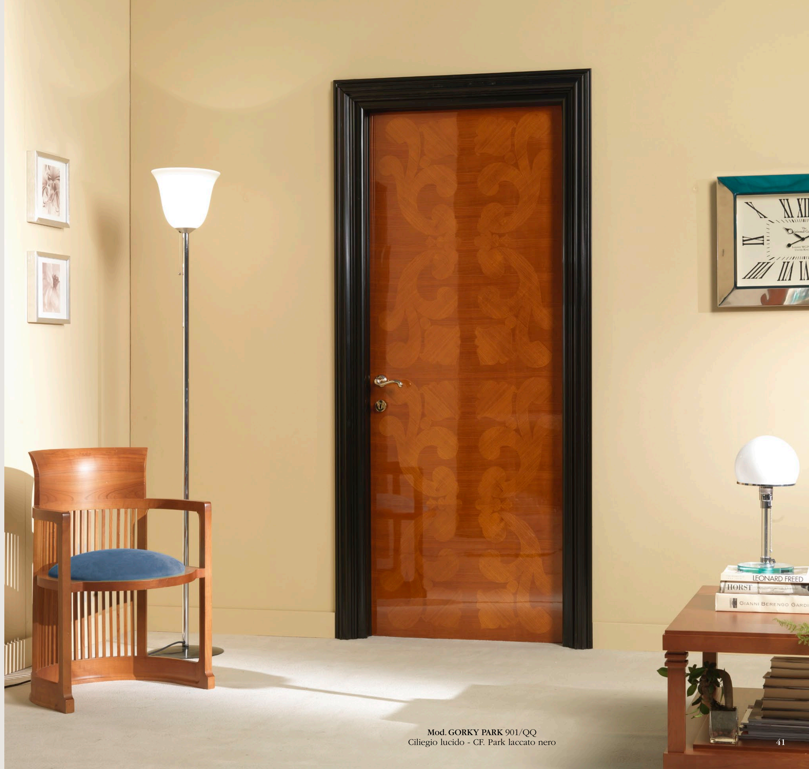
Mod. GORKY PARK 901/QQ Ciliegio lucido - CF. Park laccato nero