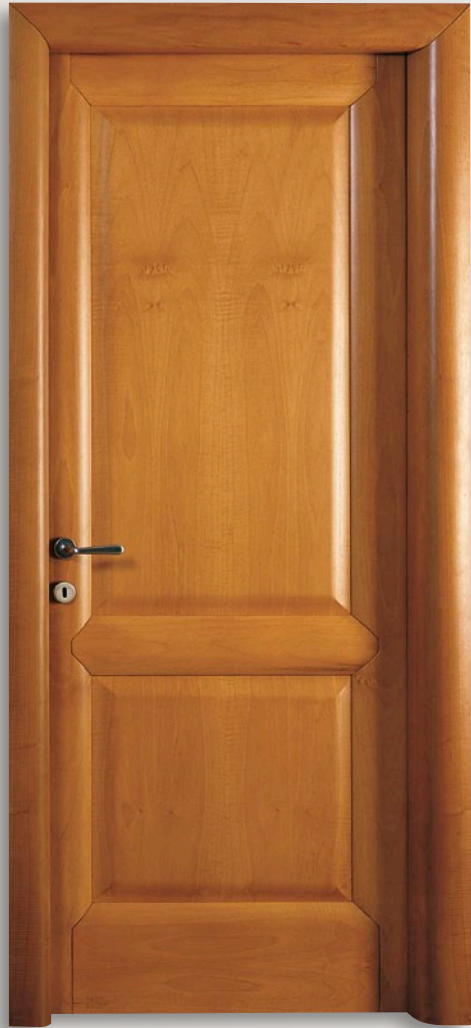
Mod. PALLADIO 1204/QQ Ciliegio - CF. 6 - telaio brevettato