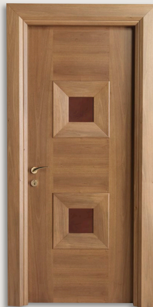
Mod. MONDRIAN 914/08 Noce nazionale inserti cuoio 08 CF. Mondrian