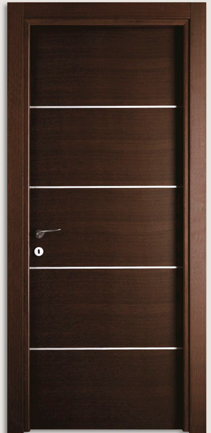
Mod. GIUDETTO 1011/QQ/F Wengé inserti alluminio tipo F CF. 8/7