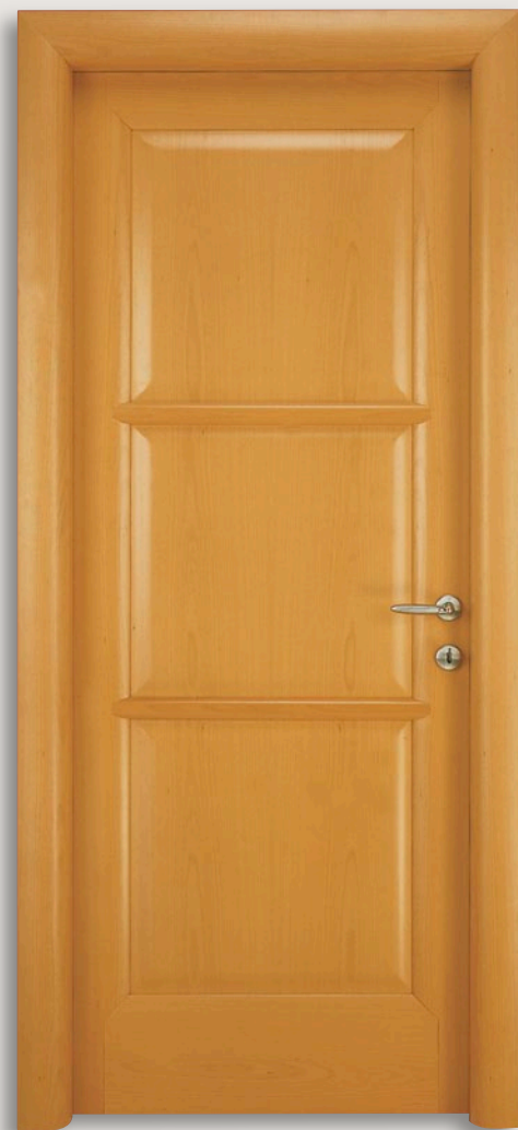
Mod. BUONTALENTI 1205/QQ Tanganica chiaro - CF. 6 - telaio brevettato