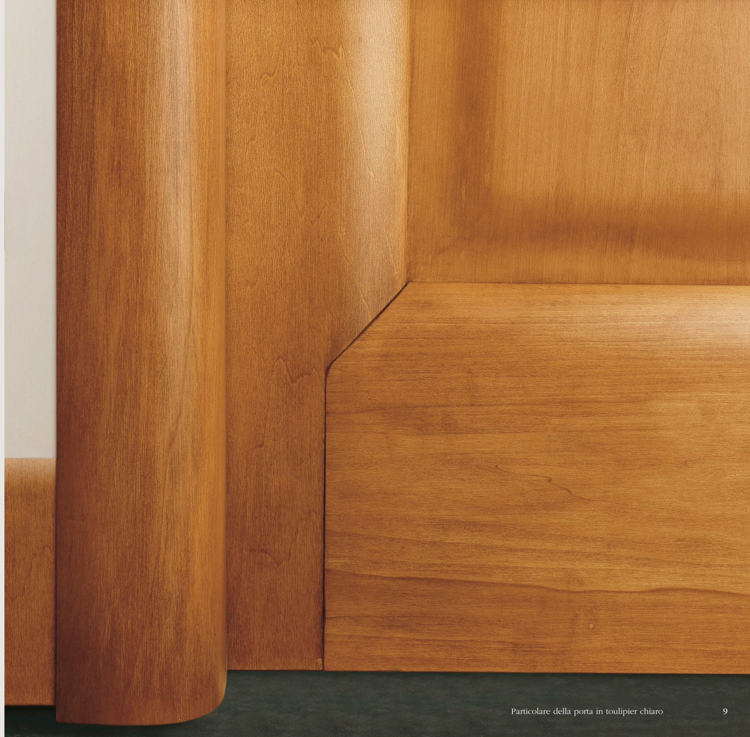
Particolare della porta in toulipier chiaro