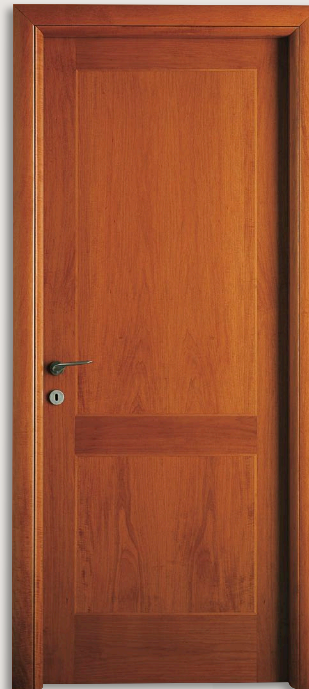
Mod. PICASSO 911/99/D Toulipier Tinto Ciliegio tipo D CF. stonato - telaio R50