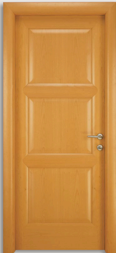
Mod. BUONTALENTI 1205A/QQ Tanganica chiaro - CF. 6 - telaio brevettato