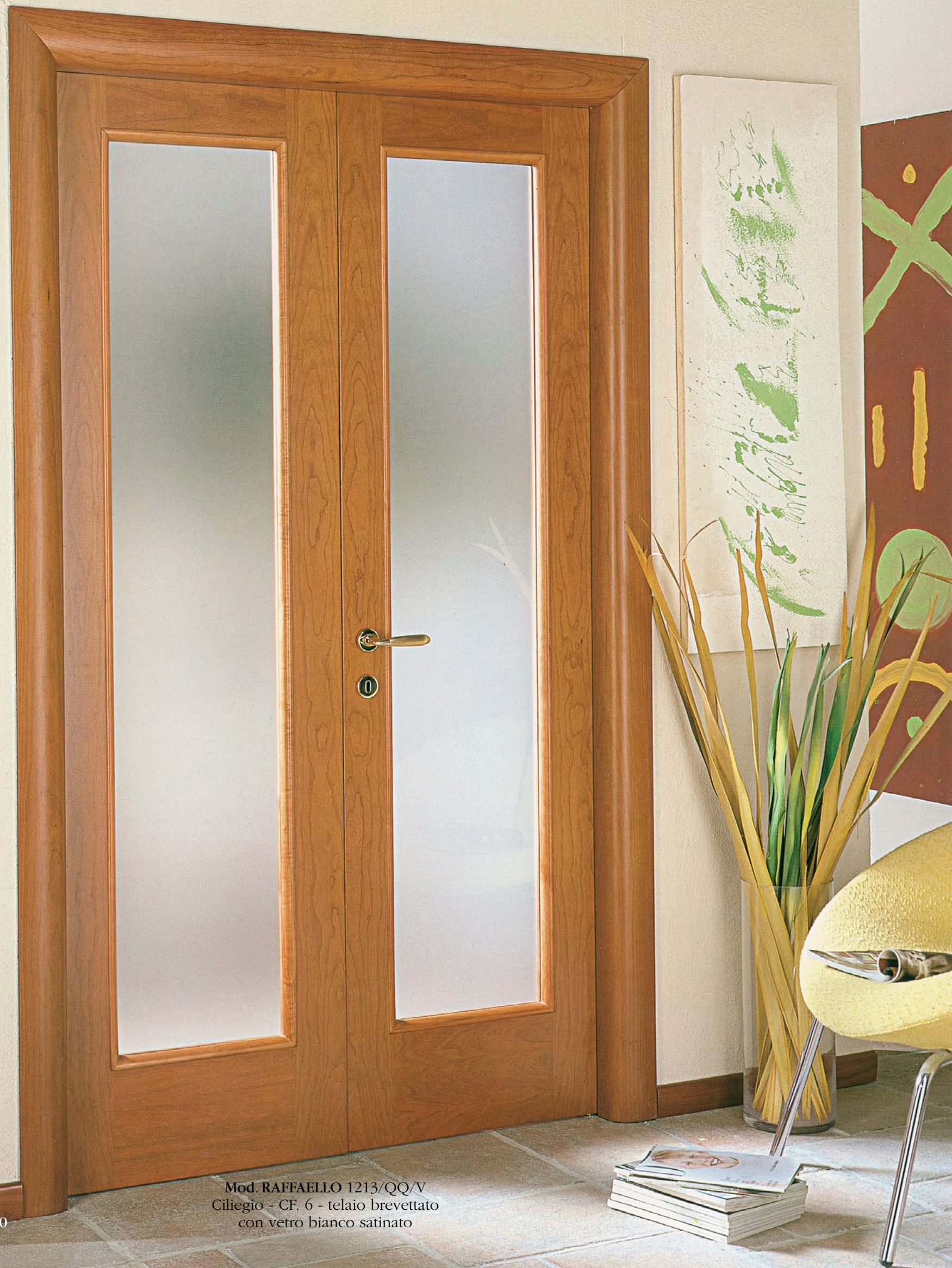
Mod. RAFFAELLO 1213/QQ/V Ciliegio - CF. 6 - telaio brevettato con vetro bianco satinato