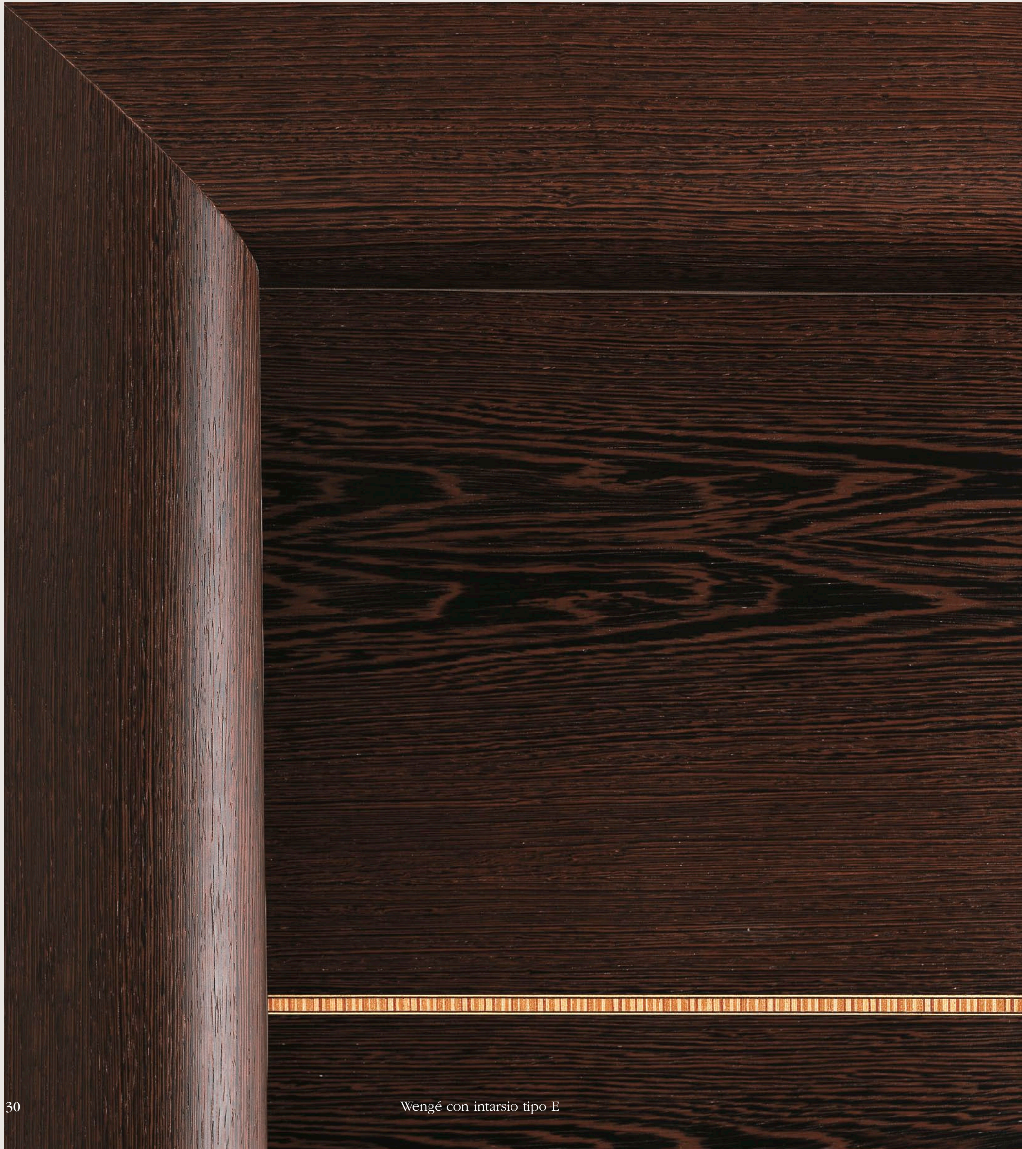
Wengé con intarsio tipo E