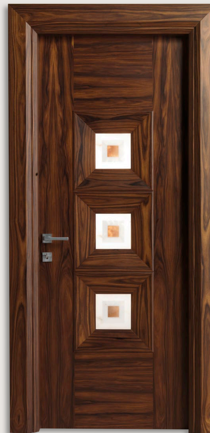
Mod. MONDRIAN 915/04 Palissandro inserti alabastro 04 CF. Mondrian