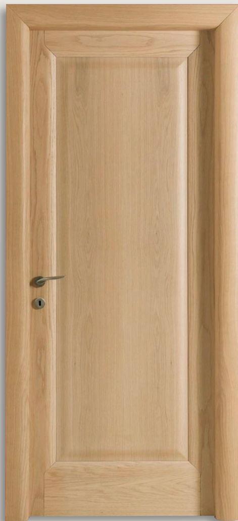
Mod. GIORGIONE 1203/QQ Rovere decapato CF. 6 - telaio brevettato