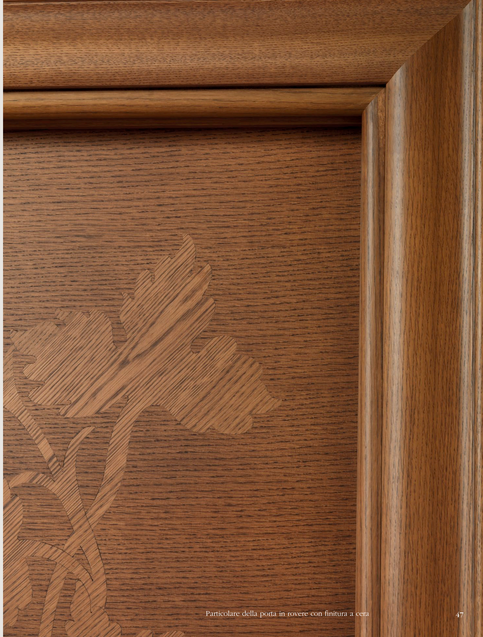
Particolare della porta in rovere con finitura a cera