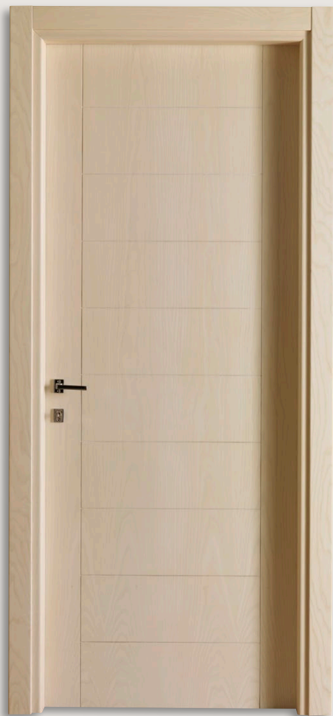
Mod. GIUDETTO 1011/QQ/INC Frassino sbiancato con incisioni CF. 8/7