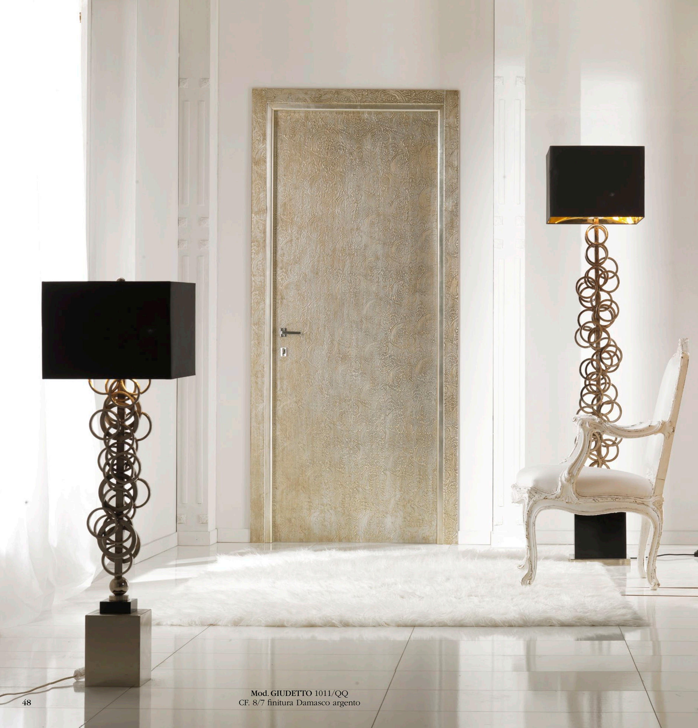
Mod. GIUDETTO 1011/QQ CF. 8/7 finitura Damasco argento