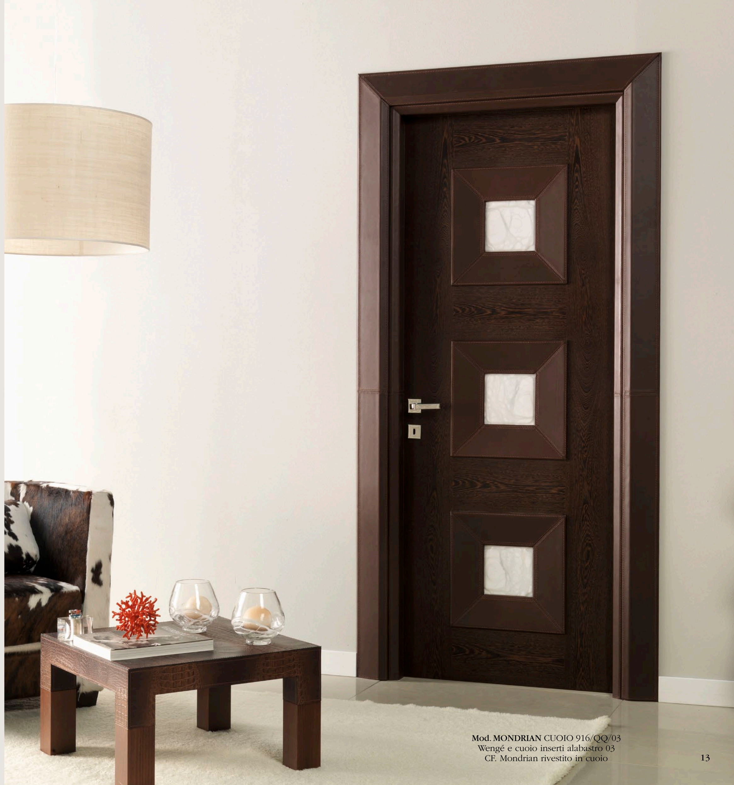
Mod. MONDRIAN CUIOIO 916/QQ/03 Wengé e cuoio inserti alabastro 03 CF. Mondrian rivestito in cuoio