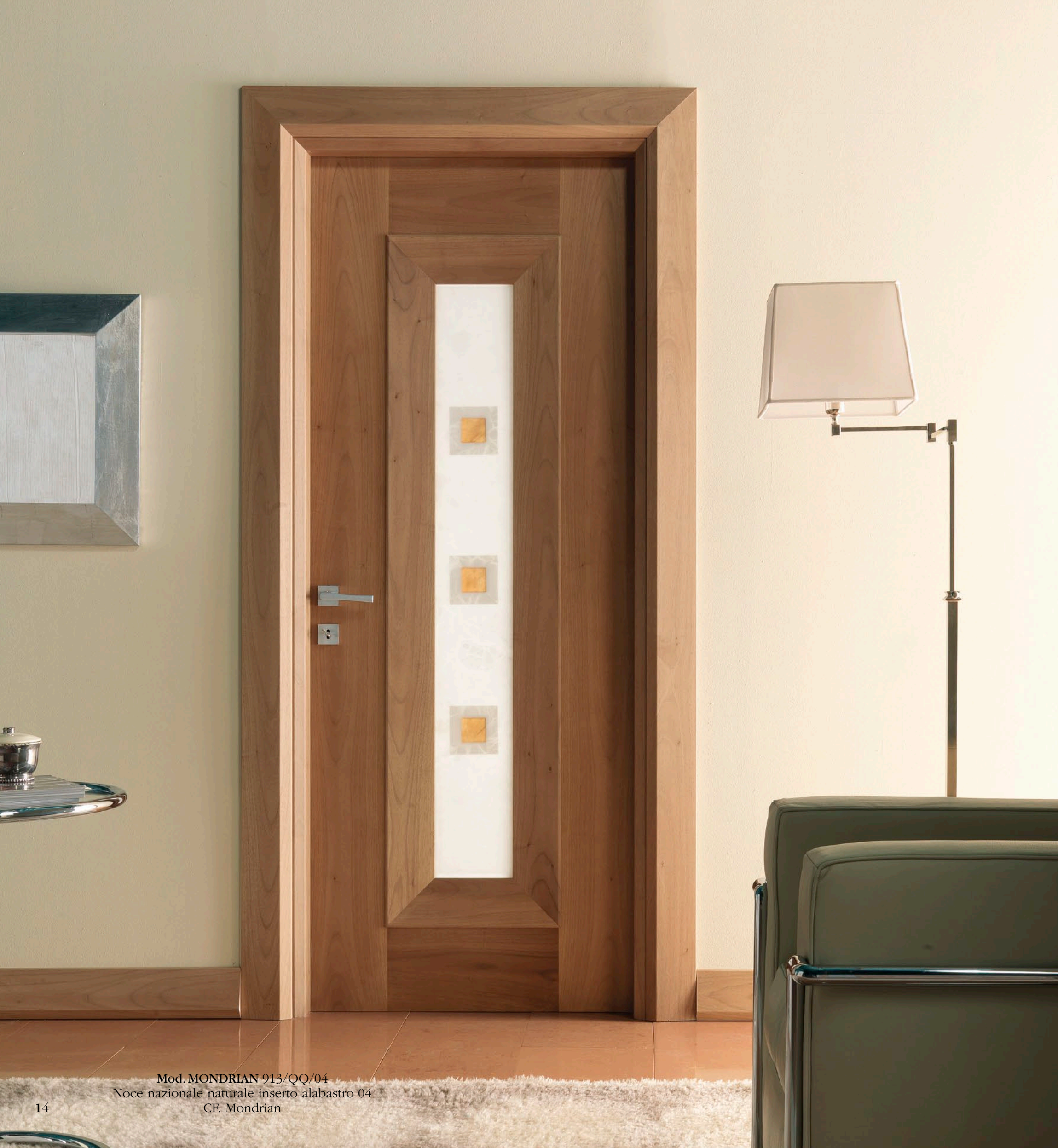
Mod. MONDRIAN 913/04 Noce nazionale naturale inserto alabastro 04 CF. Mondrian