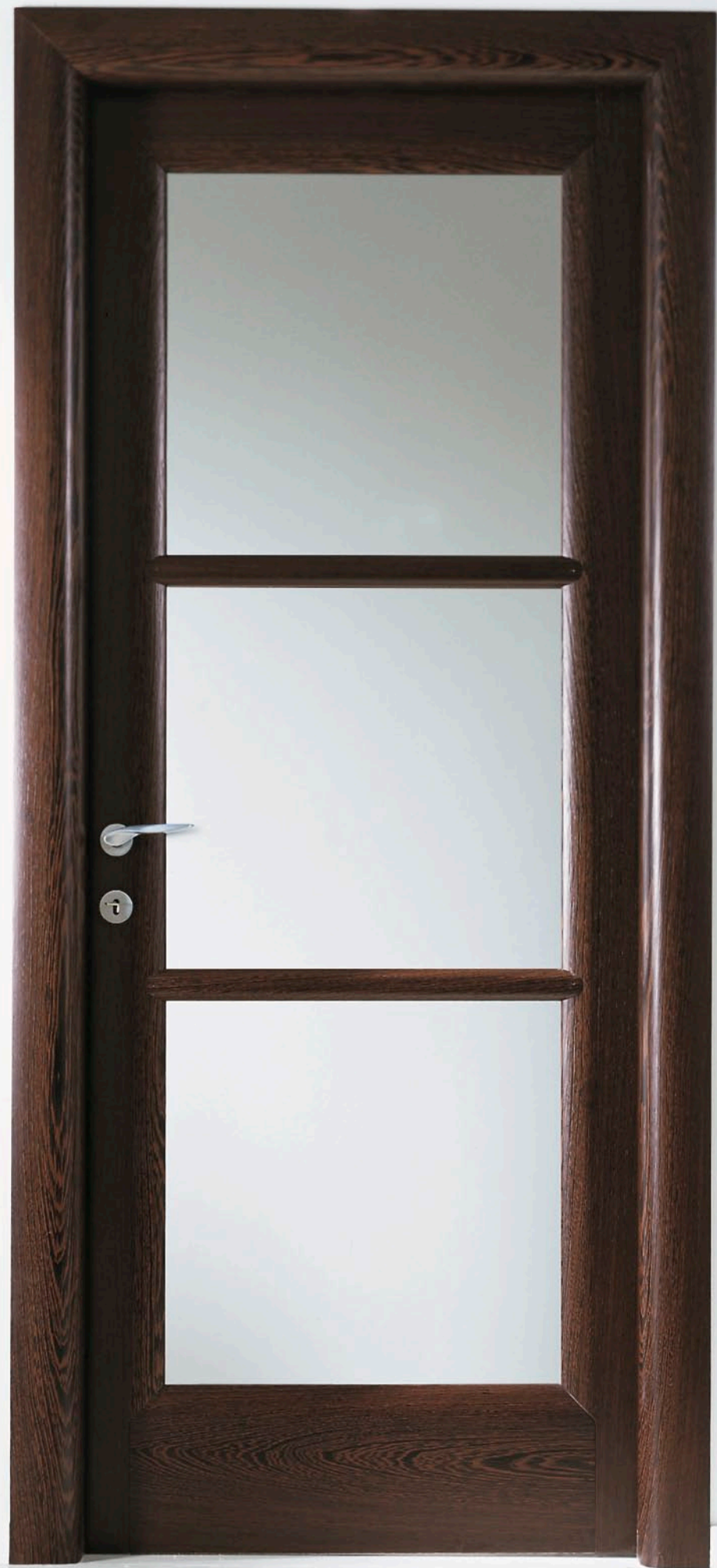
Mod. BUONTALENTI 1205/QQ/V Wengé vetro bianco satinato CF. 6 - telaio brevettato