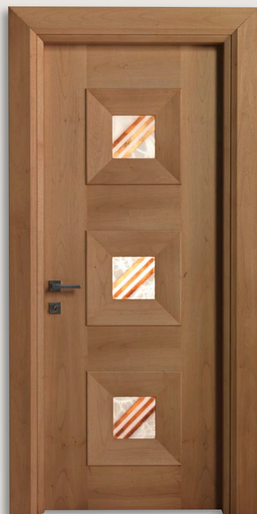
Mod. MONDRIAN 916/05 Noce nazionale naturale inserti alabastro 05 CF. Mondrian