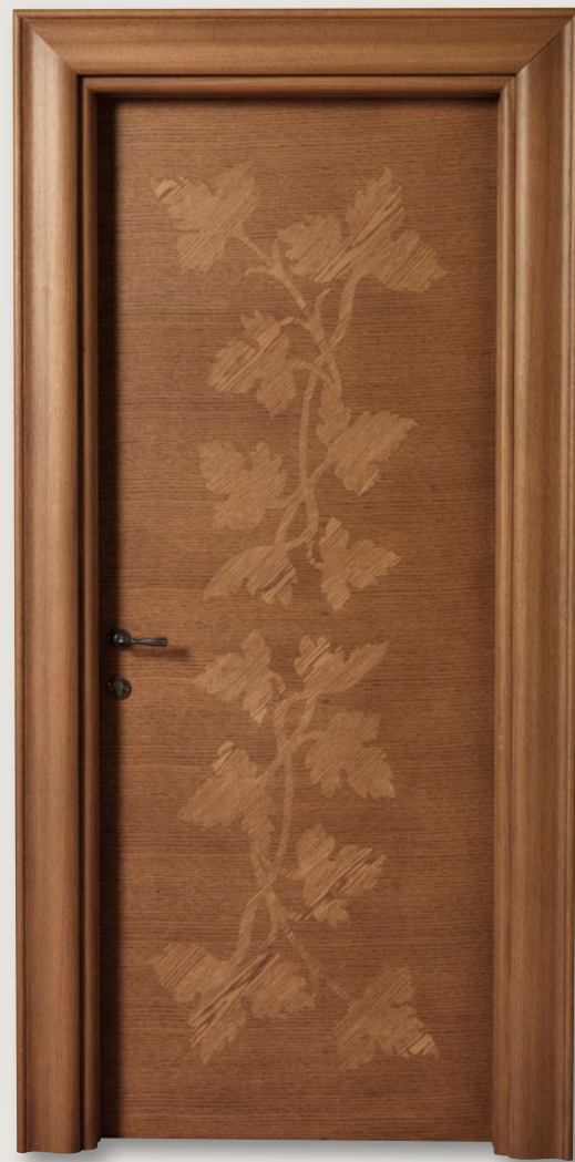
Mod. HYDE PARK 901/QQ Rovere finitura cera CF. Klee