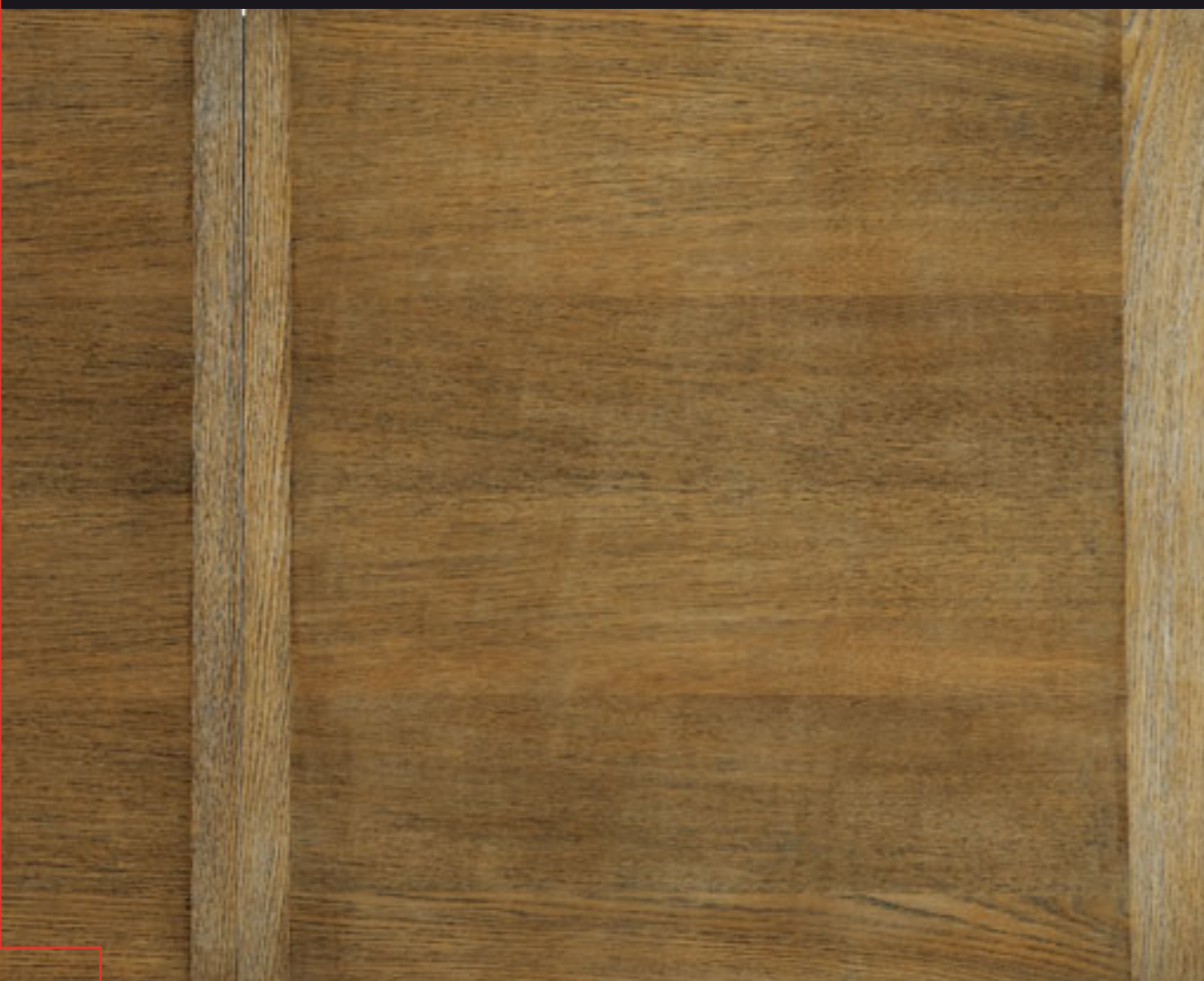
Piano Silver french (06) - French silver top (06)