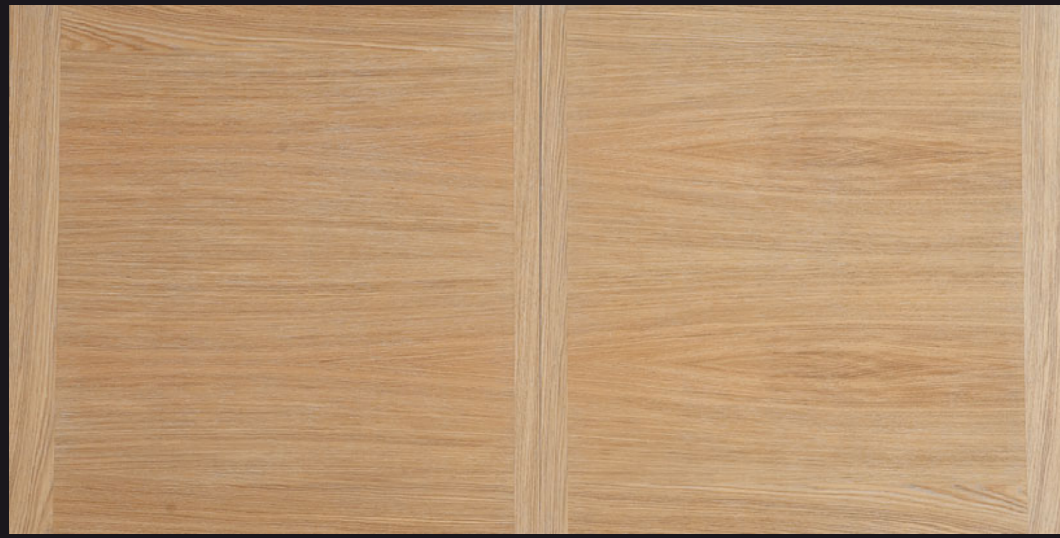
Piano Rovere decapé (19) - Pickled Oak top (19)