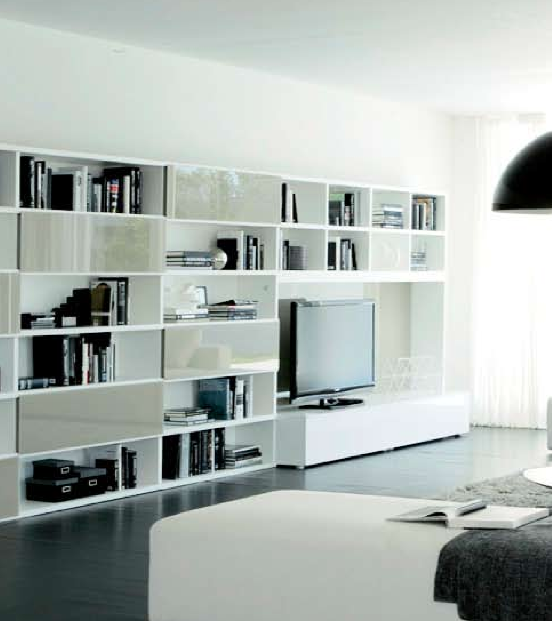
Binari per ante scorrevoli in tinta con la finitura della libreria _ Runners for sliding doors on the same colour of the bookcase _ Gleitschiene für Schiebetüren mit der selber Farbe von dem Bücherschrank _ Rails pour portes coulissantes dans le même couleur de la bibliothèque _ Guías para puertas correderas en el mismo color de la librería