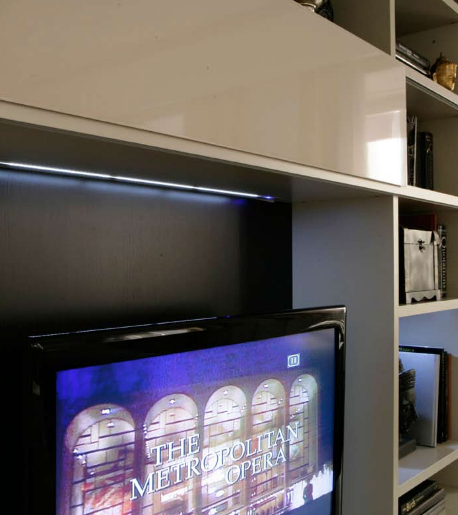
Nuova barra luminosa a led. Faretti a led con accensione a touch _ New led-lighting bar. Spot Led avec interrupteur "touch" _ Neue Stange mit Led-beleuchtung. Led Strahler mit Touchschalter _ Nouvelle barre lumineuse avec spots Led. Spot Led avec interrupteur "touch" _ Nueva barra con focos Led. Foco Led con interruptor "touch"