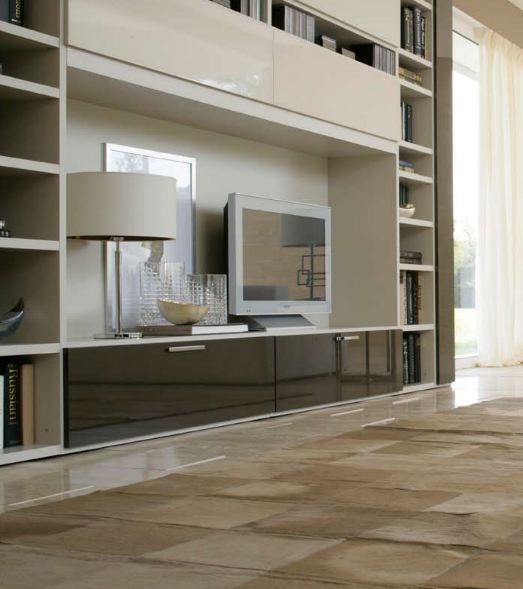
Elemento terminale libreria laccato opaco Canapa e Terranova Lucido _ End unit mat lacquered Canapa and gloss Terranova _ Abschlusselement matt lackiert Canapa und hochglanz Terranova _ Elément terminal mat laqué Canapa et Terranova brillant _ Modulo terminal lacado mate Canapa y Terranova brillo