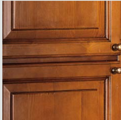
FINITURA ANTA: ROVERE COLORE 15