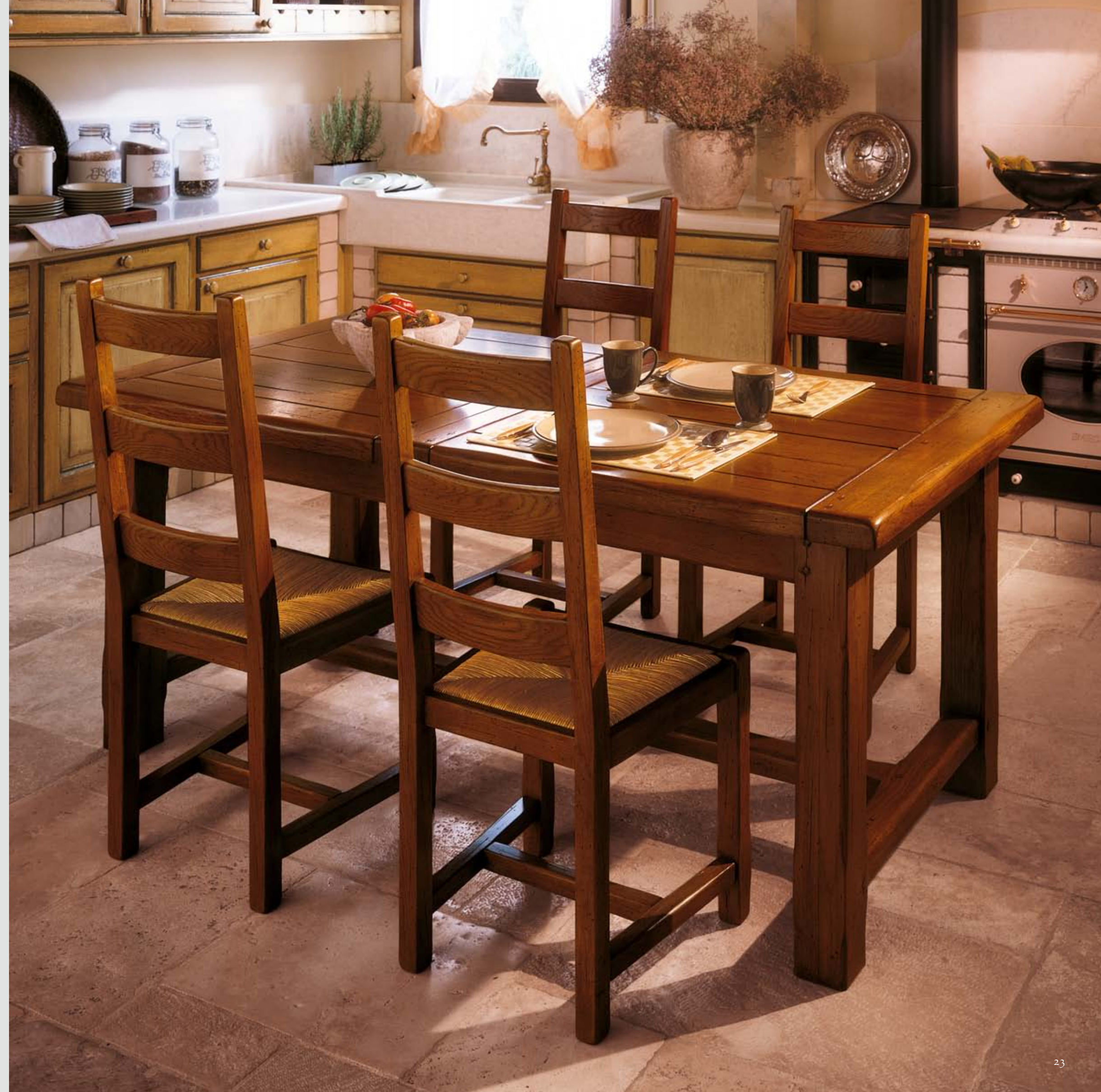
ART. 82.467 TAVOLO ALLUNGABILE IN ROVERE EXTENDABLE TABLE IN OAK WOOD CM 180 X 90 X H 75 APERTO CM 260 OPENED CM 260