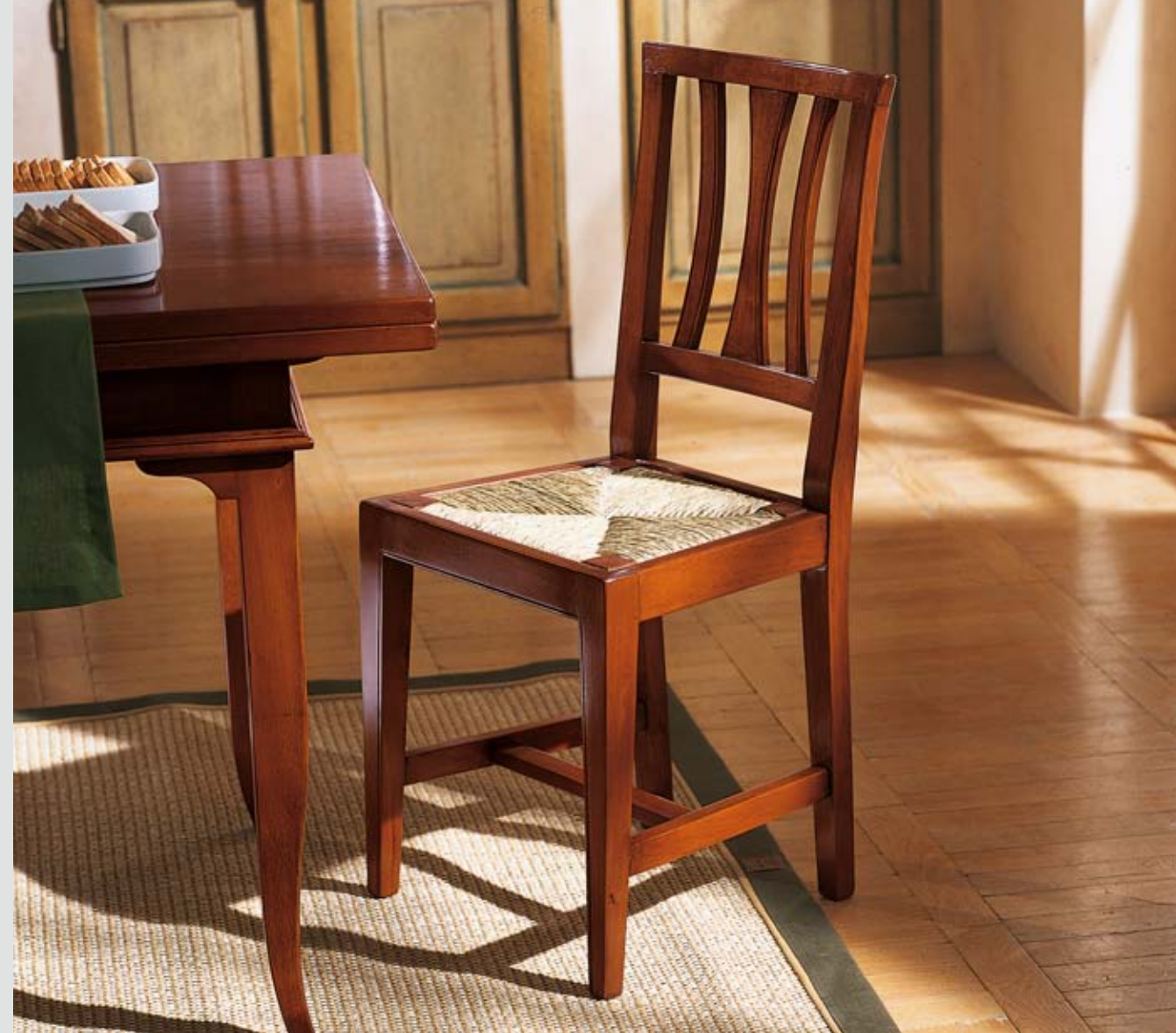
ART. 91.023 SEDIA CON SEDILE IN PAGLIA CHAIR WITH STRAW SEAT CM 41 X 37 X H 93