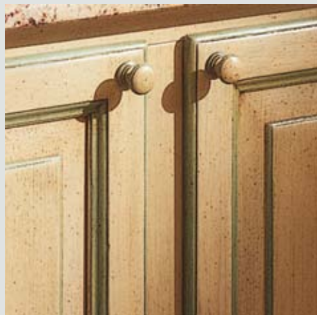
FINITURA ANTA: ROVERE LACCATO COLORE 25