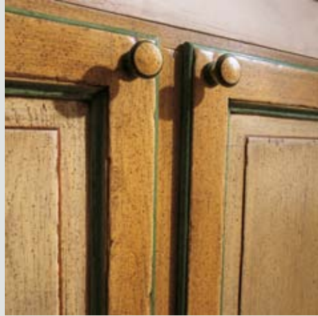
FINITURA ANTA: ROVERE LACCATO COLORE 43