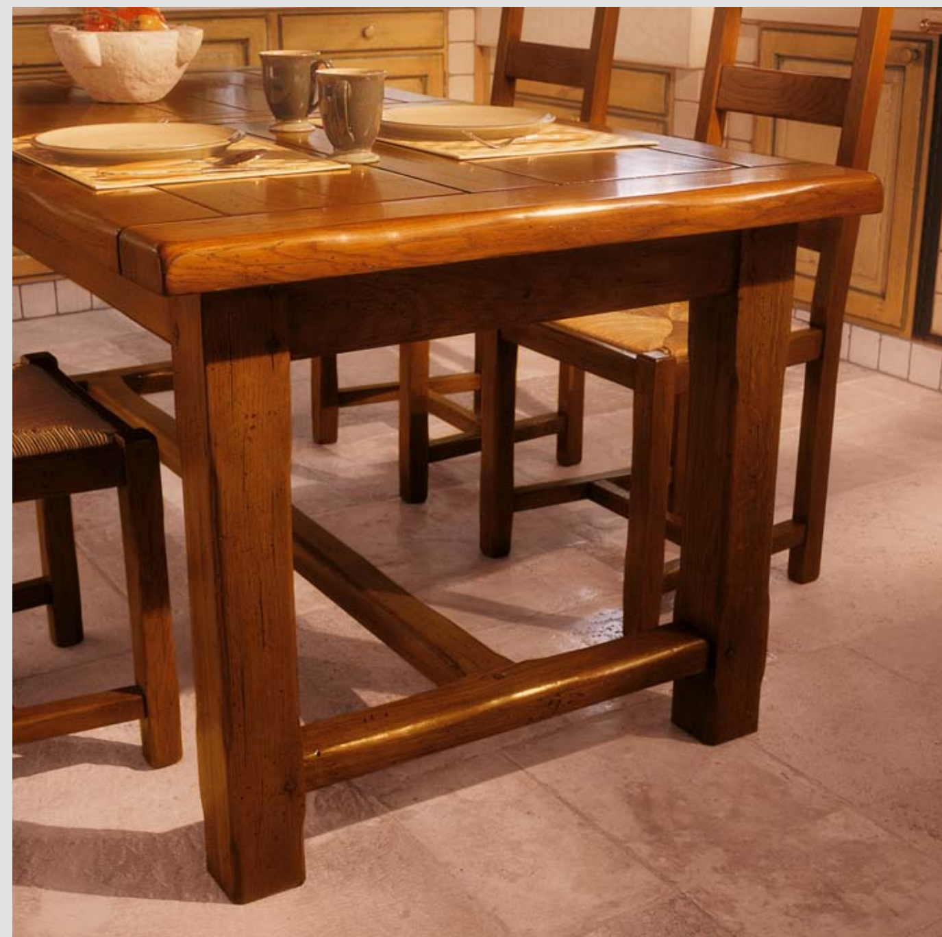
ART. 92.393 SEDIA CON SEDILE IN PAGLIA CHAIR WITH STRAW SEAT CM 46 X 43 X H 105