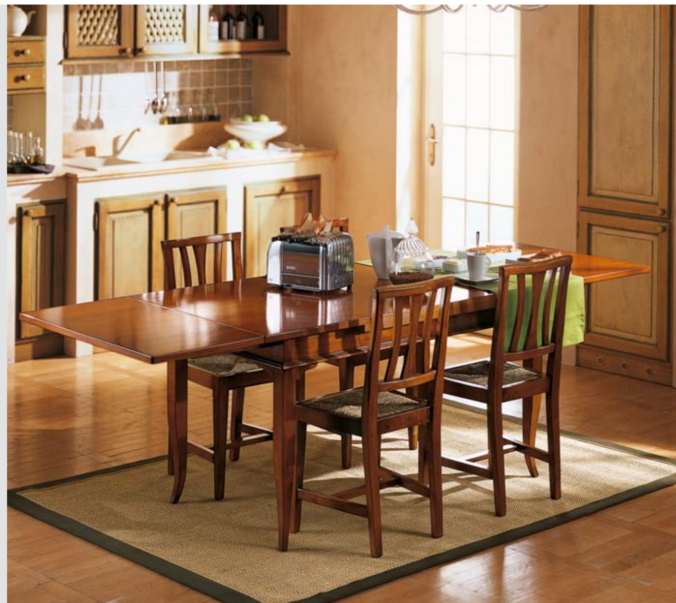
ART. 82.501 TAVOLO ALLUNGABILE IN ROVERE EXTENDABLE TABLE IN OAK WOOD CM 160 X 85 X H 77 APERTO CM 250 OPENED CM 250