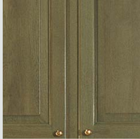
FINITURA ANTA: ROVERE TINTO ALL'ANILINA COLORE 09