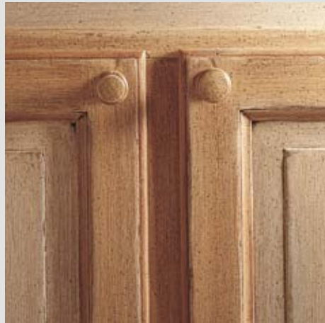
FINITURA ANTA: ROVERE LACCATO COLORE 42