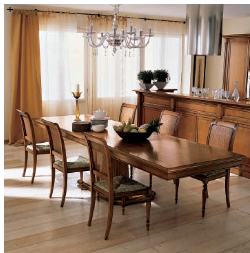
ART. 80.630 CM 200 X 100 X H 77 TAVOLO ALLUNGABILE. APERTO CM 335 EXTENDABLE TABLE. OPENED CM 335 AUSZIEHTISCH. OFFEN CM 335 TABLE À RALLONGE. OUVERTE CM 335 MESA EXTENSIBLE. ABIERTA CM 335