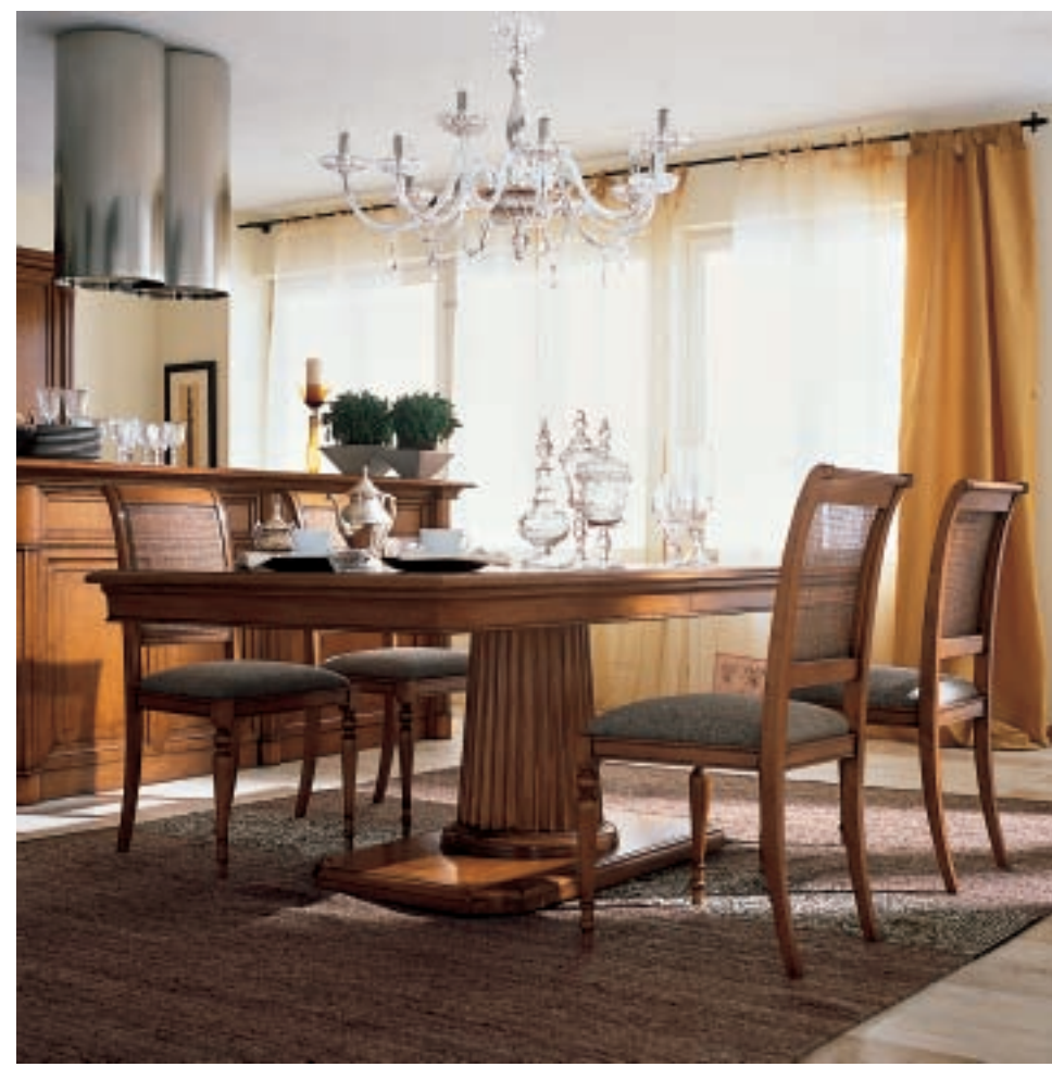
ART. 90.426 CM 49 X 43 X H 98 SEDIA CON SEDILE IN TESSUTO CHAIR WITH FABRIC SEAT STUHL MIT STOFFSITZ CHAISE AVEC SIÈGE EN TISSU SILLA ASIENTO TELA